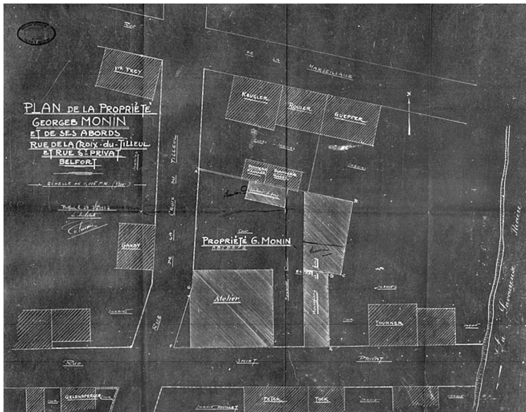
Plan de la propriété Georges Monin et de ses abords rue de la Croix du Tilleul et rue Saint-Privat - Belfort. 90, Belfort, 8 rue Saint-Privat