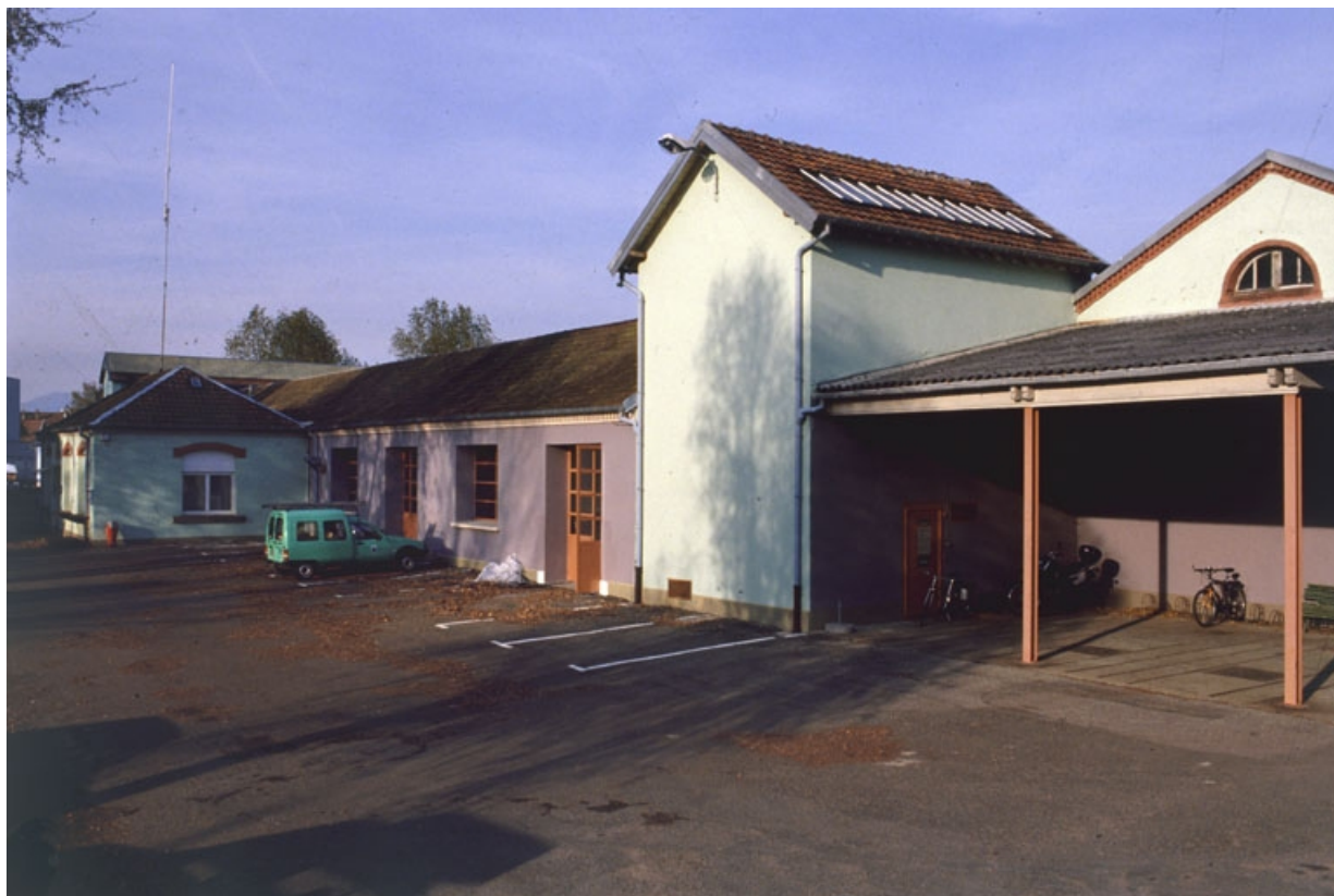
Bureaux, atelier du tissage, chaufferie et atelier de forge.