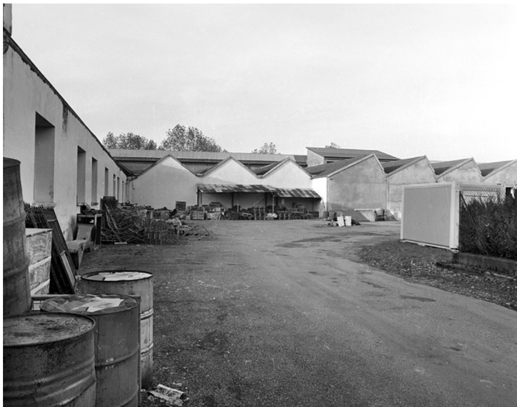
Pignons des ateliers de réception et de préparation du tissage.