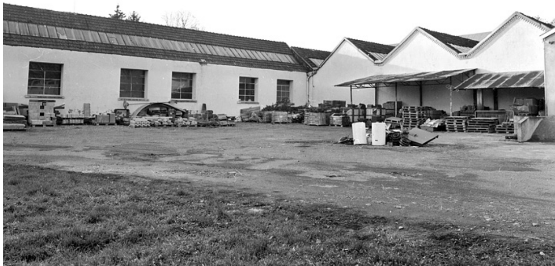
Façades arrière depuis la cour.