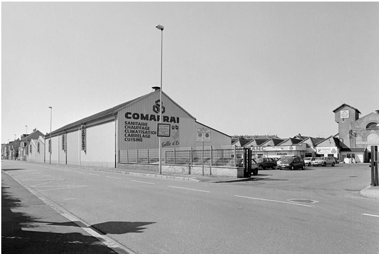
Vue de l'entrée depuis l'avenue Jean Jaurès.