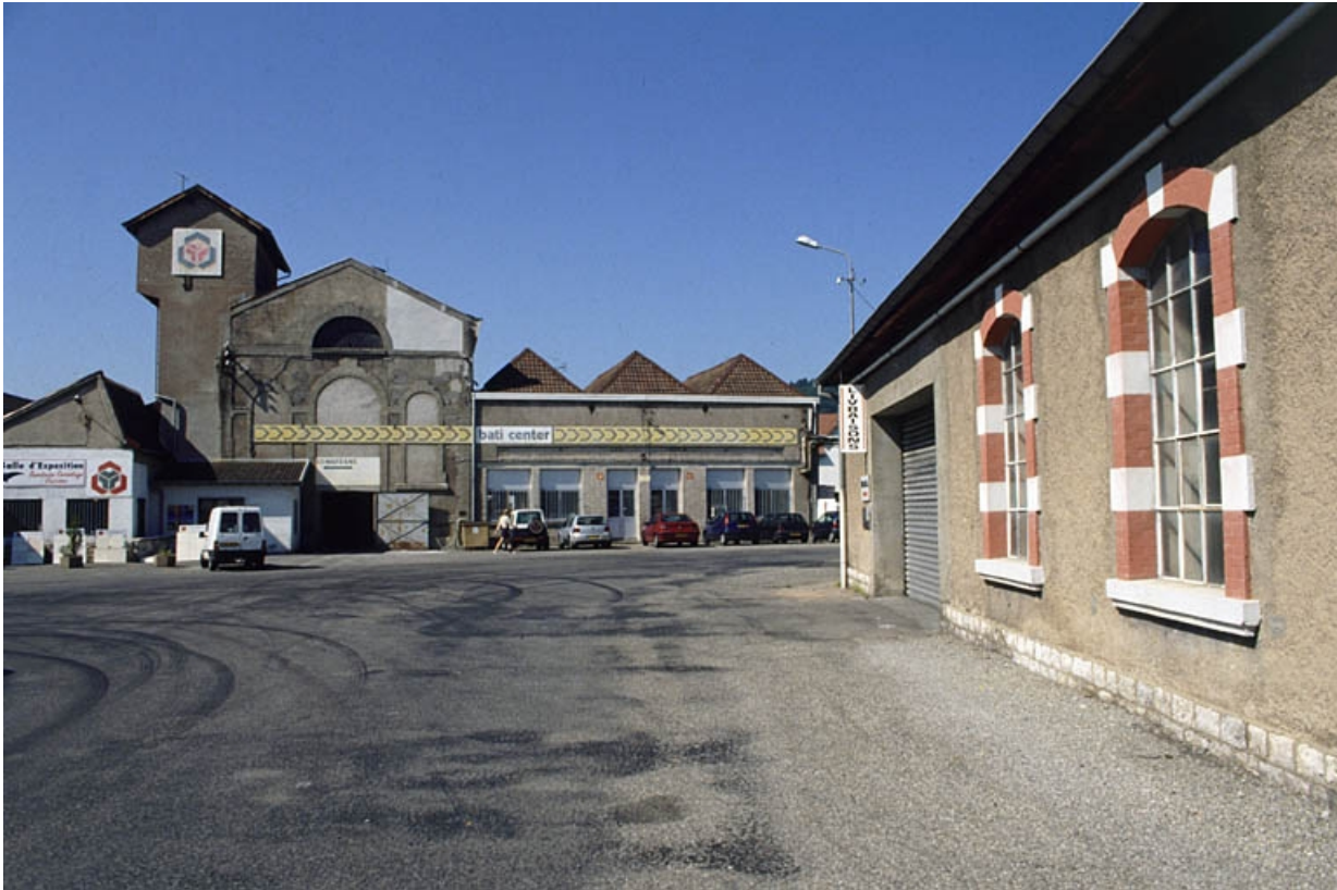
Vue des bâtiments de la filature depuis l'entrée (salle des machines ?).