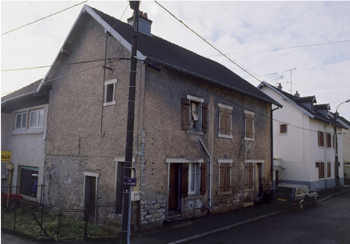
Logement ouvrier situé au n° 16 de la rue de Bussang.