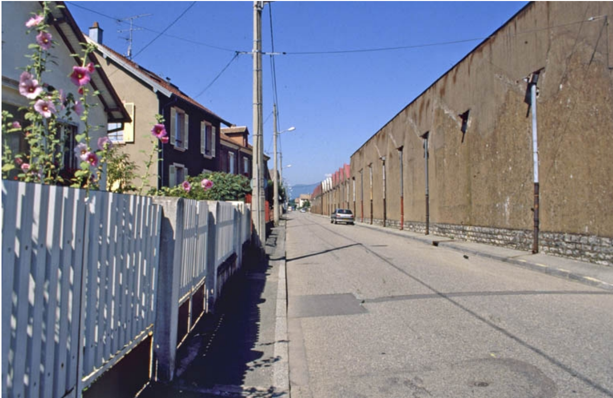
Mur ouest de l'atelier de la filature sur la rue du Salbert.