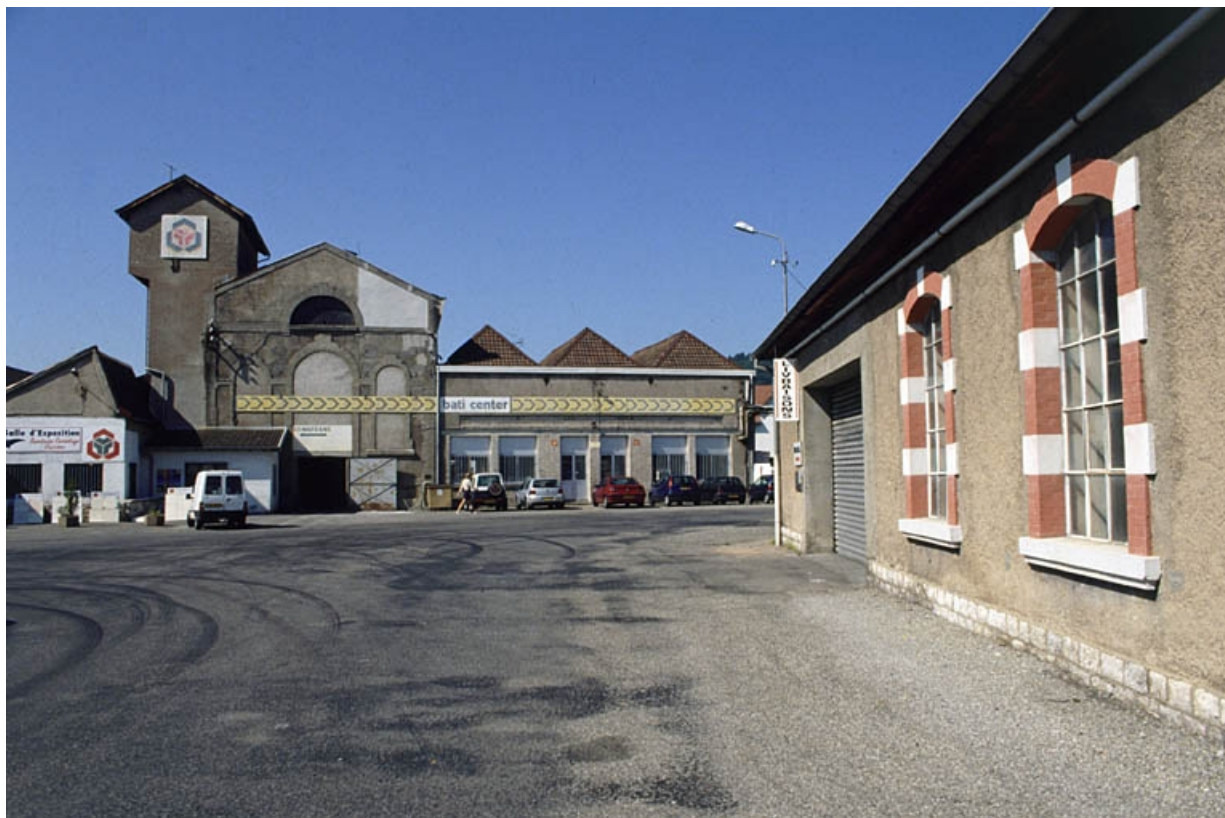
Vue des bâtiments de la filature depuis l'entrée (salle des machines ?).