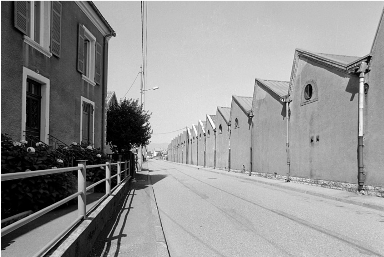
Alignement de sheds de la filature sur la rue du Salbert.