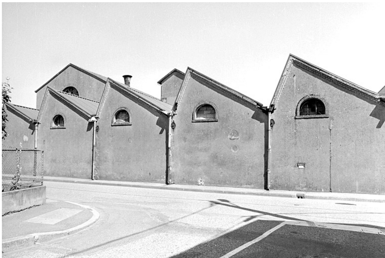
Murs-pignons ouest de l'atelier de la filature sur la rue du Salbert.