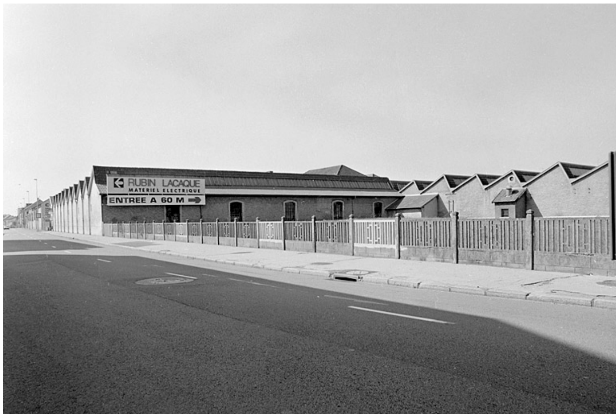
Vue d'ensemble des ateliers de tissage depuis le nord de l'avenue Jean Jaurès.