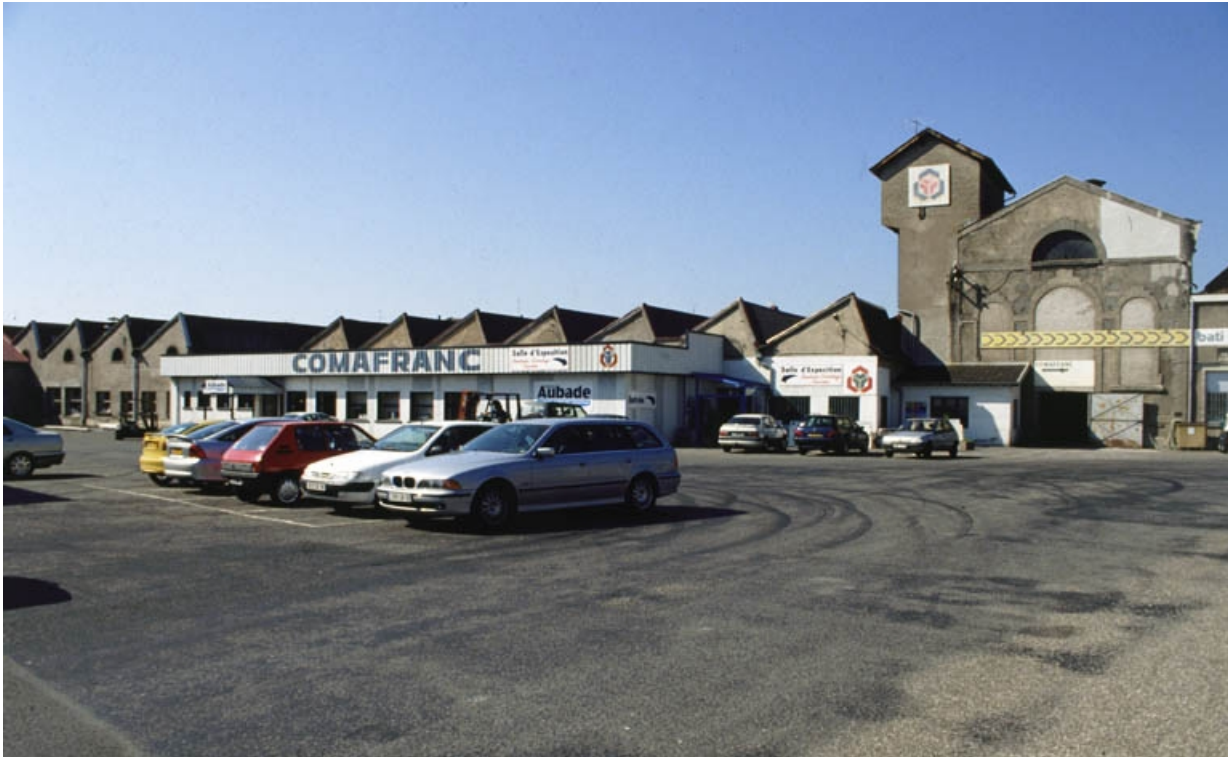
Vue des ateliers de la filature depuis l'entrée.