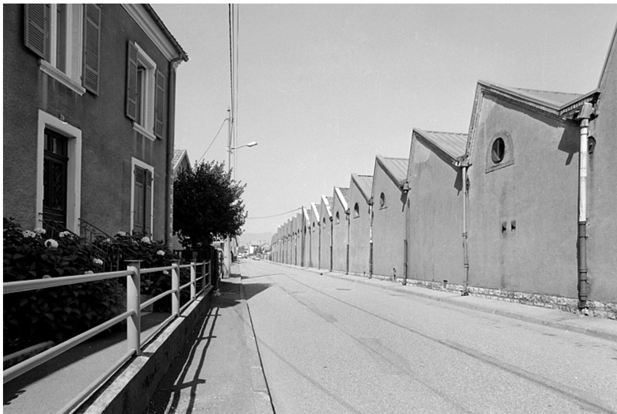
Alignement de sheds de la filature sur la rue du Salbert.