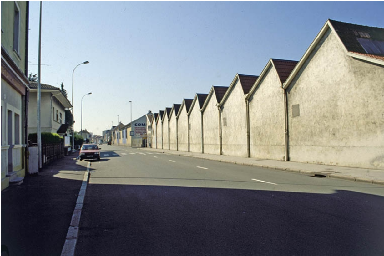
Pignons des ateliers du tissage sur l'avenue Jean Jaurès.