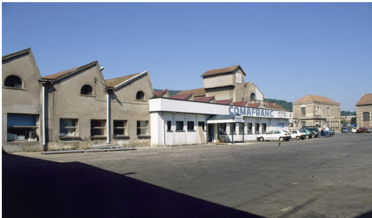
Vue des ateliers de la filature depuis le sud de la cour.