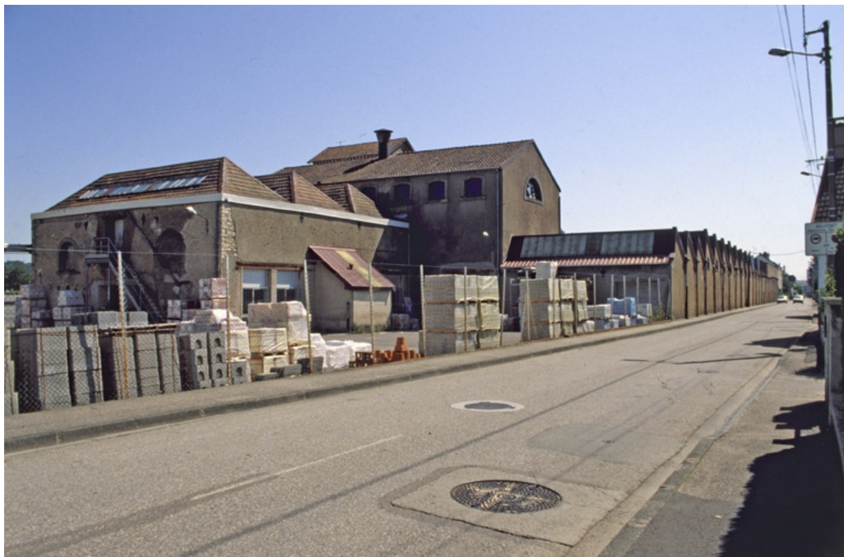
Salle des machines et ateliers de fabrication de la filature depuis la rue du Salbert.