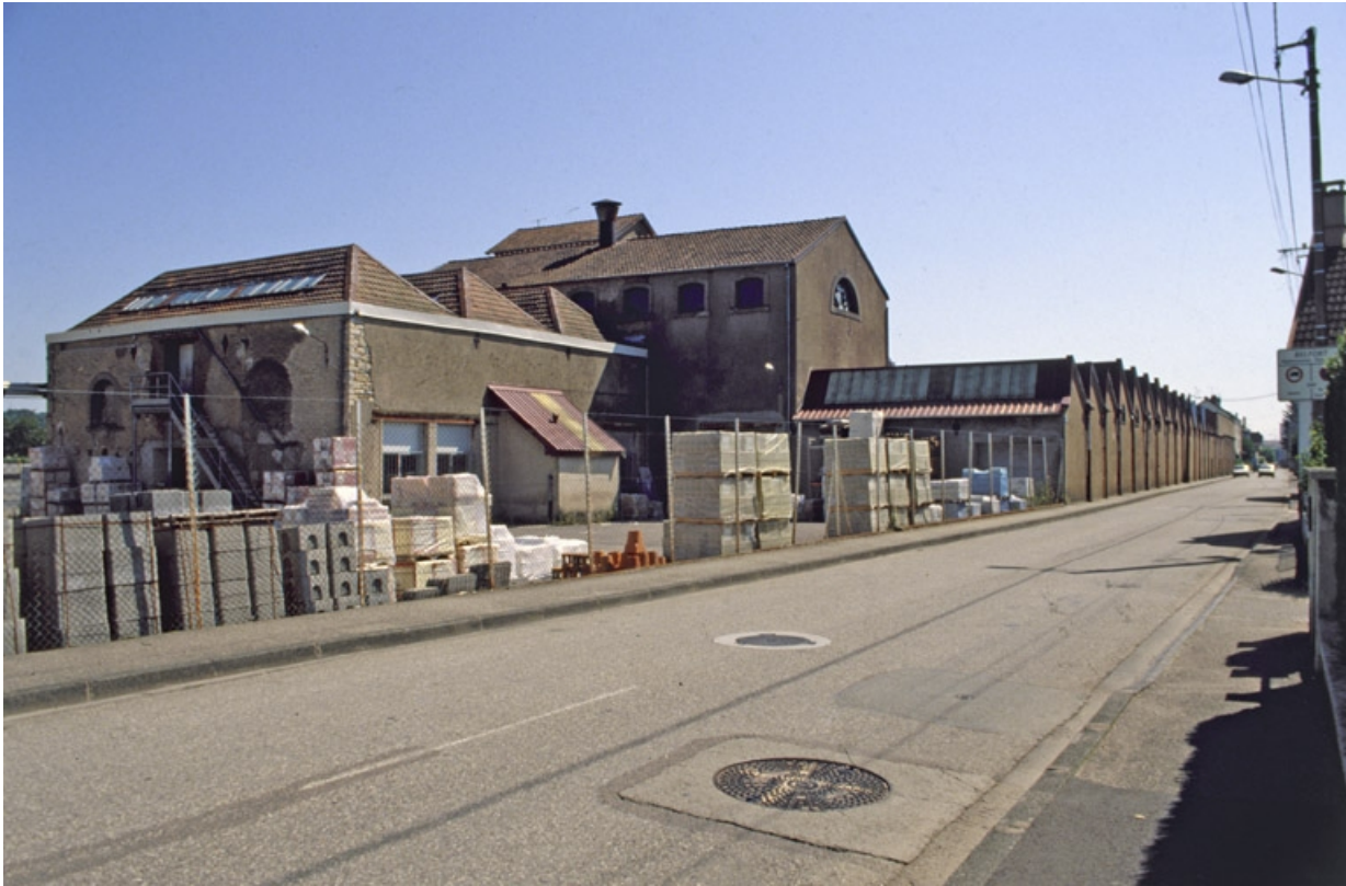
Salle des machines et ateliers de fabrication de la filature depuis la rue du Salbert.