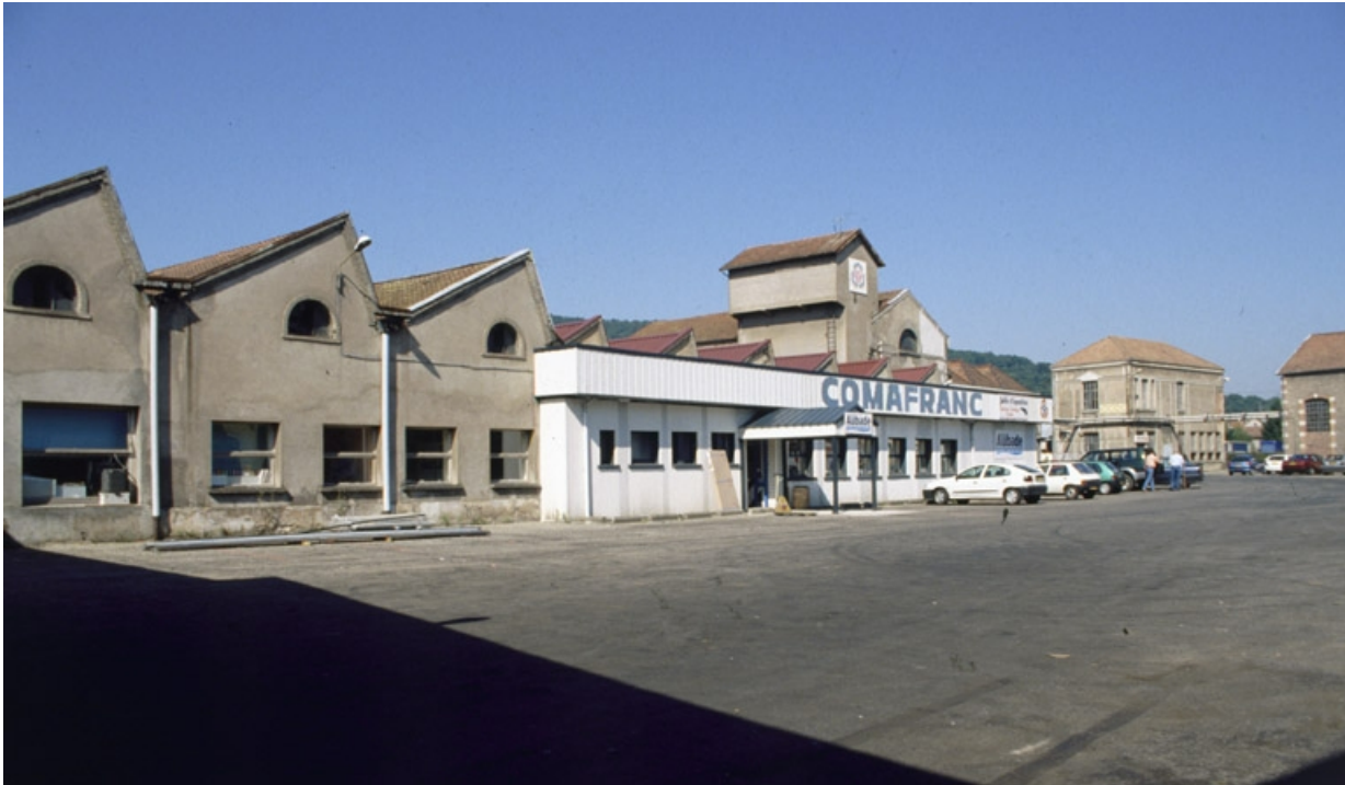
Vue des ateliers de la filature depuis le sud de la cour.