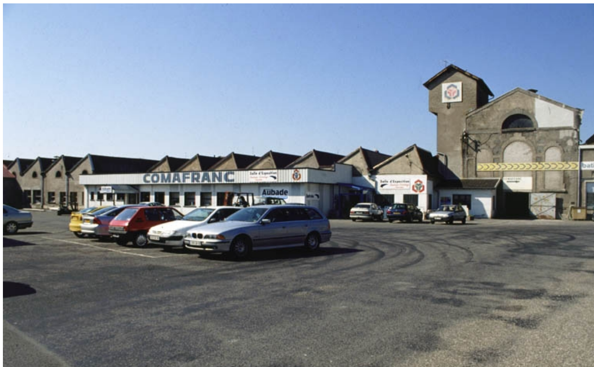
Vue des ateliers de la filature depuis l'entrée.