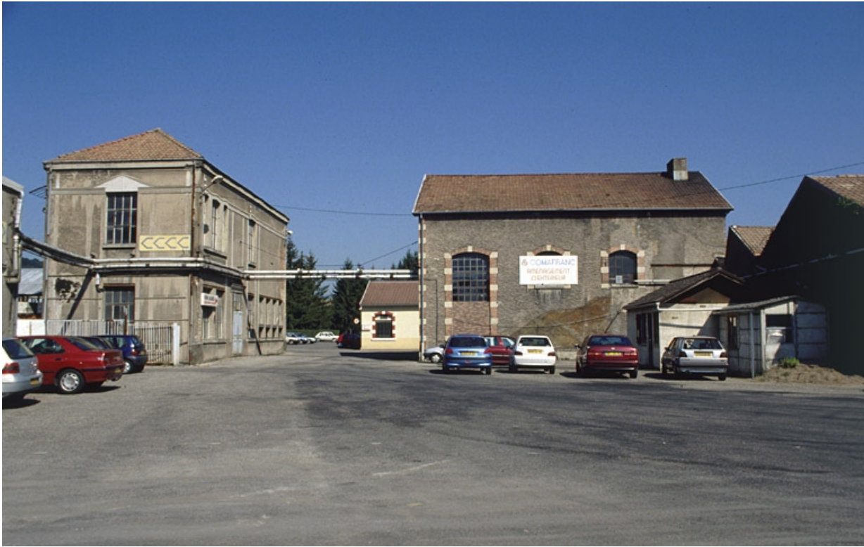
Transformateur électrique et ancienne salle des machines du tissage (?).