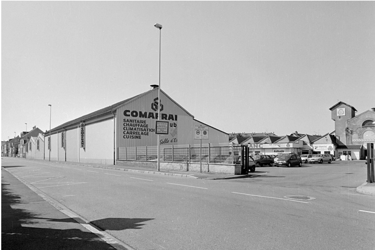
Vue de l'entrée depuis l'avenue Jean Jaurès.