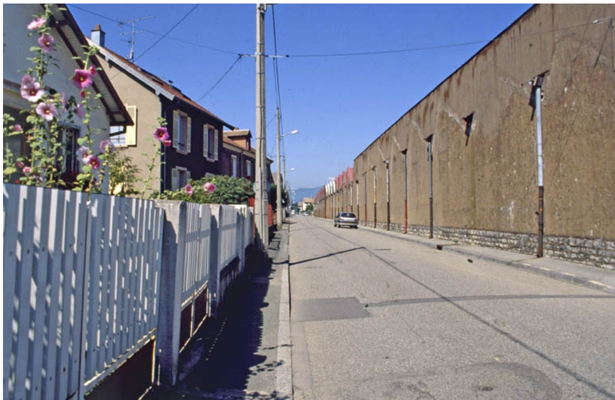
Mur ouest de l'atelier de la filature sur la rue du Salbert.