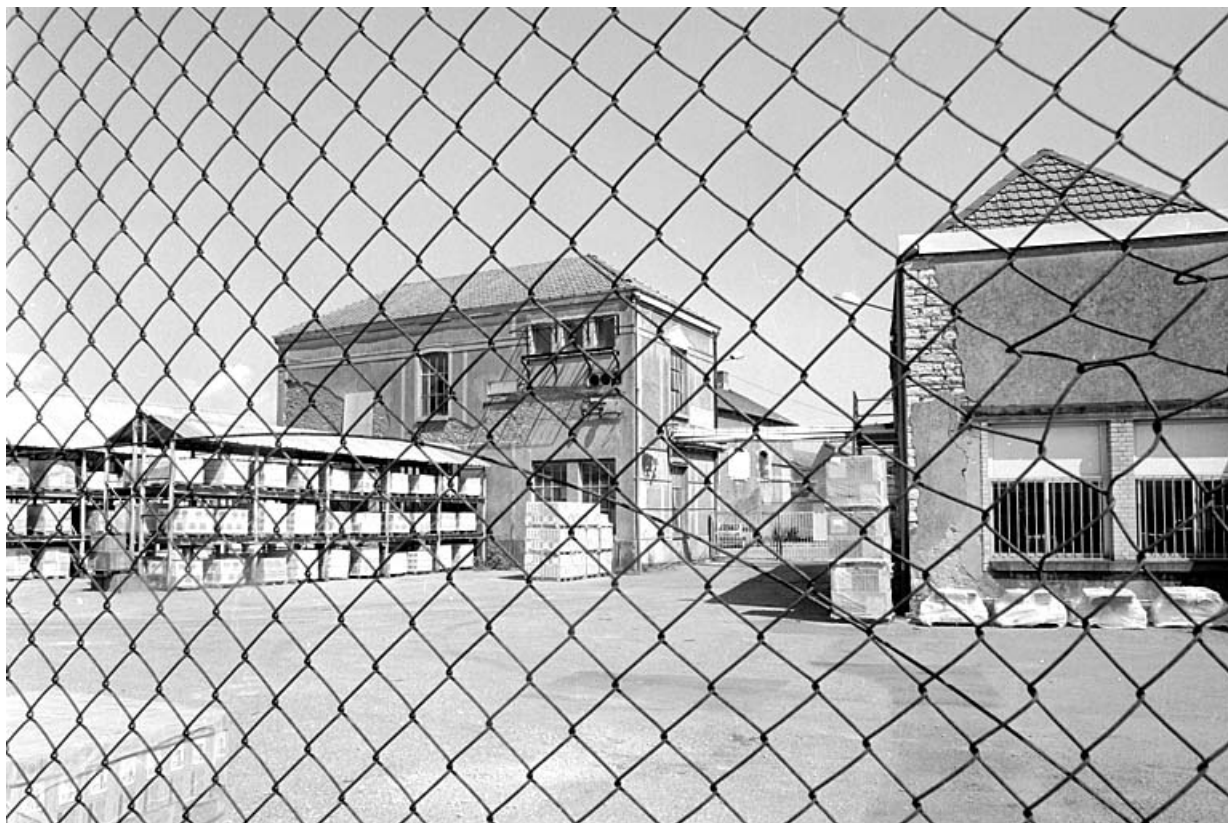
Transformateur électrique (?) vu au travers du grillage depuis la rue du Salbert.