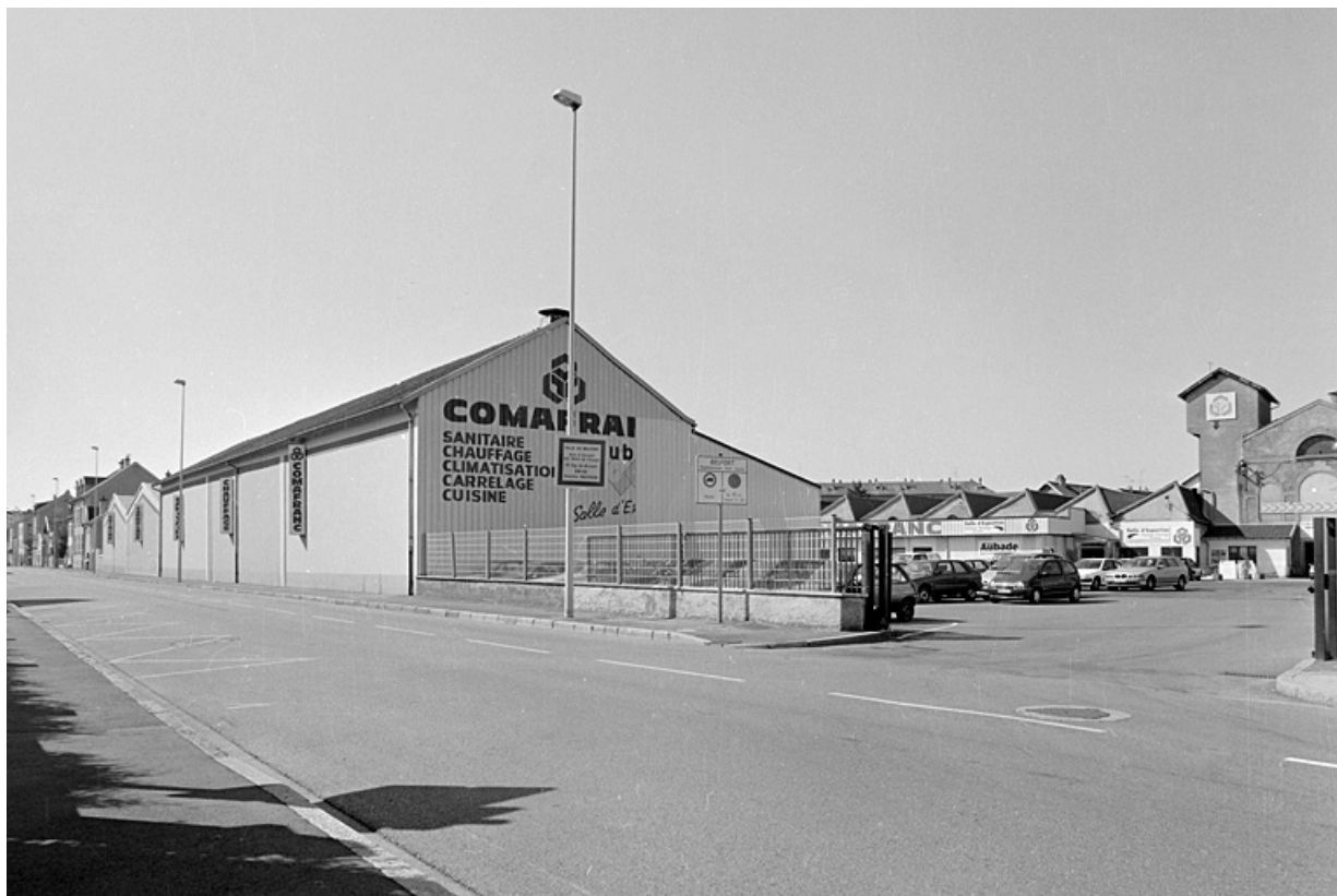
Vue de l'entrée depuis l'avenue Jean Jaurès.