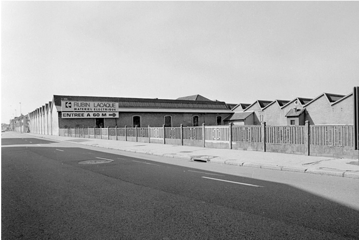
Vue d'ensemble des ateliers de tissage depuis le nord de l'avenue Jean Jaurès.