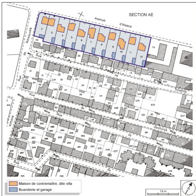
Plan-masse des logements de contremaître. Extrait du plan cadastral, 2001, section AH, 1:1000 réduit à 1:1500. 90, Belfort avenue de Lorraine