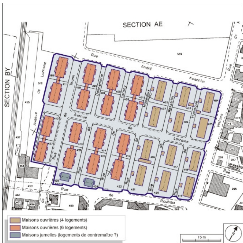
Plan-masse des logements ouvriers. Extrait du plan cadastral, 2001, section AH, 1:1000 réduit à 1:1500. 90, Belfort avenue de Lorraine