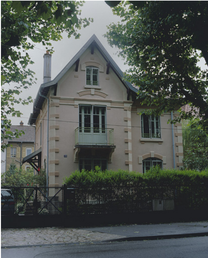
Maison de contremaître rue d'Alsace.