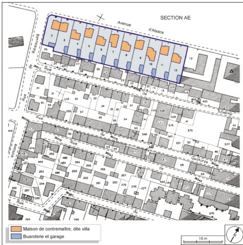
Plan-masse des logements de contremaître. Extrait du plan cadastral, 2001, section AH, 1:1000 réduit à 1:1500. 90, Belfort avenue de Lorraine