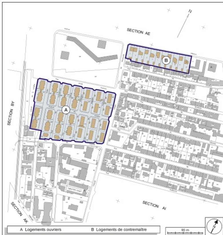
Plan de situation des logements d'ouvriers et des logements de contremaître. Extrait du plan cadastral, 2001, section AH, 1:1000 réduit à 1:3000.