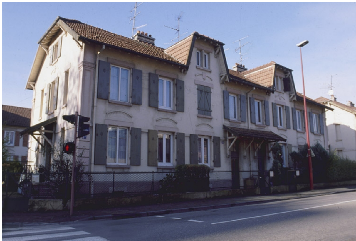
Façade antérieure d'un logement ouvrier rue Voltaire.