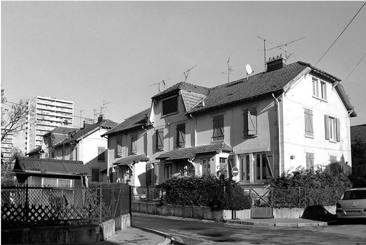
Vue de trois quarts d'un logement ouvrier.