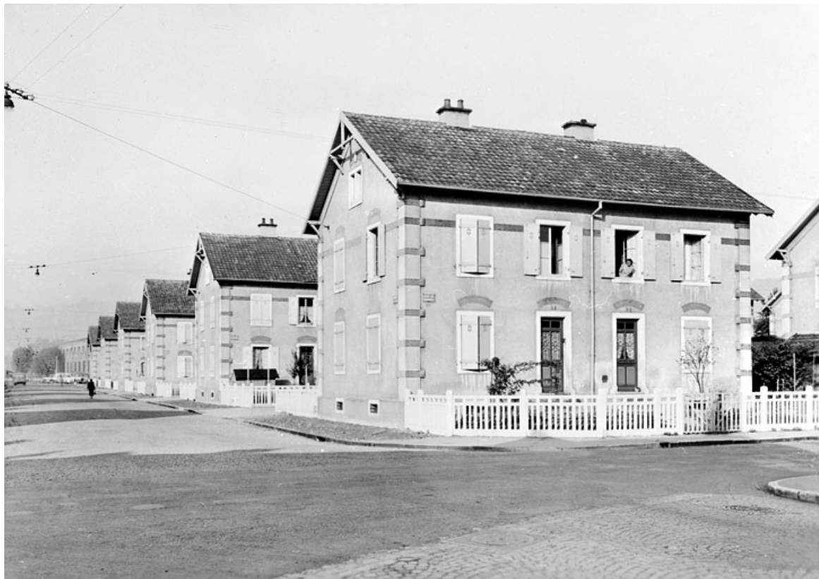
Vue des anciennes cités Alsthom.