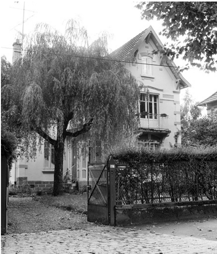
Maison de contremaître rue d'Alsace.