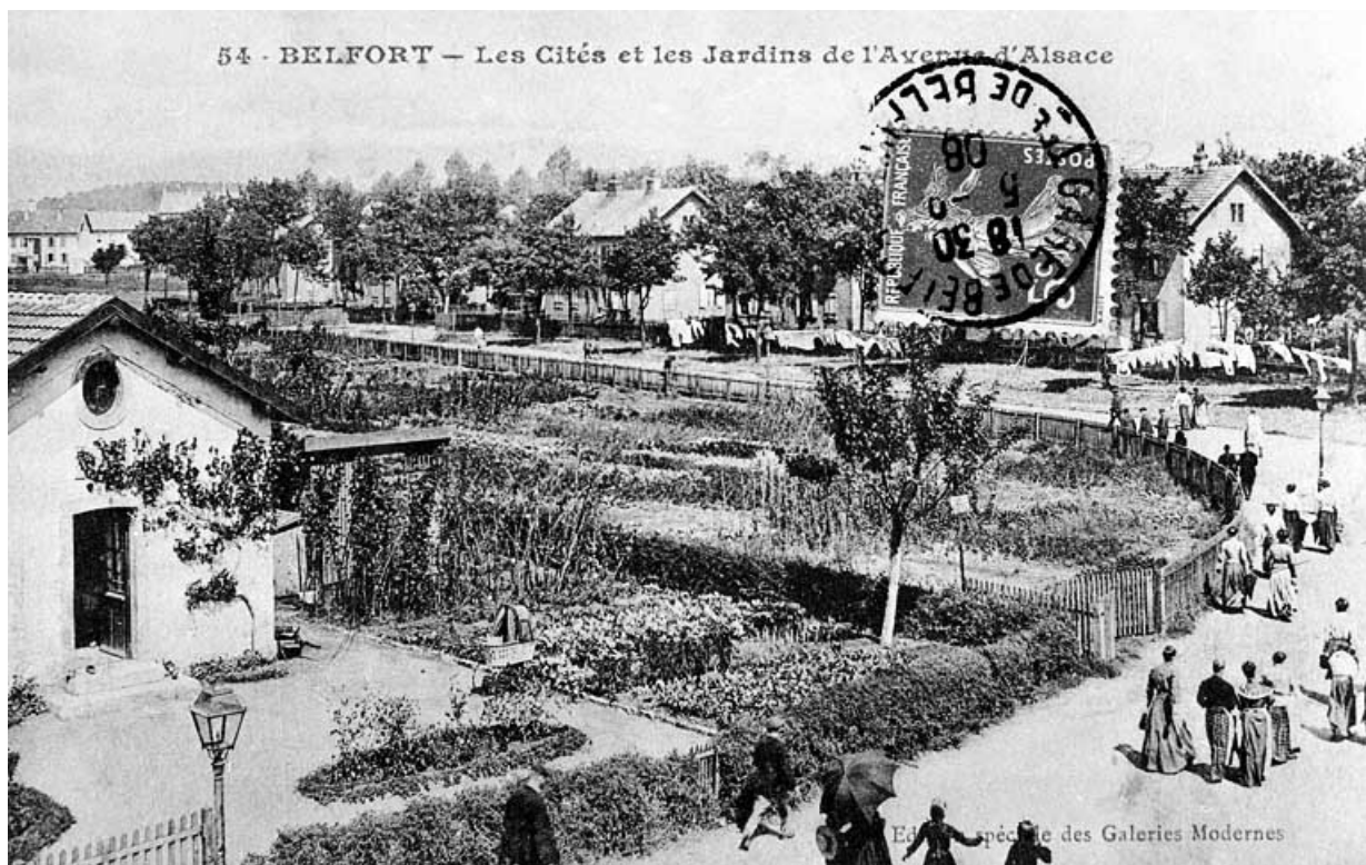
Belfort - Les Cités et les Jardins de l'Avenue d'Alsace.