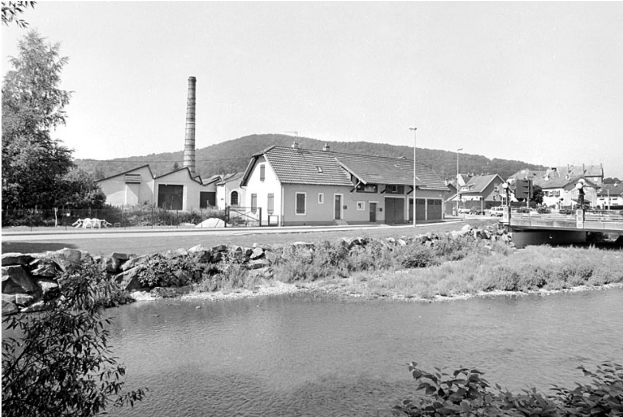
Vue d'ensemble depuis l'est.