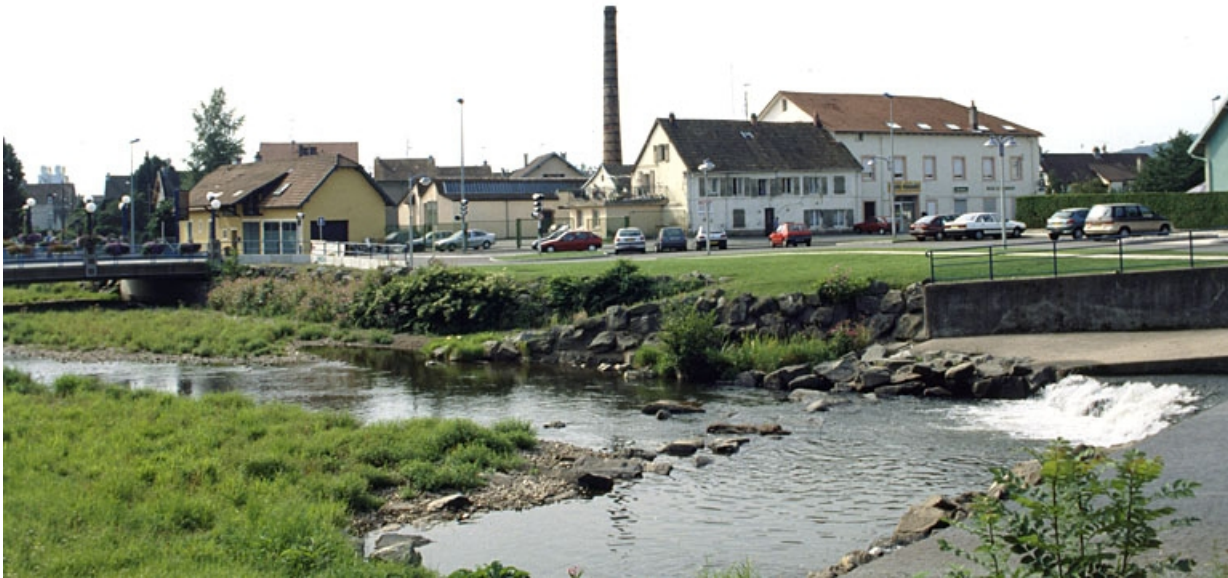
Vue d'ensemble depuis le nord.