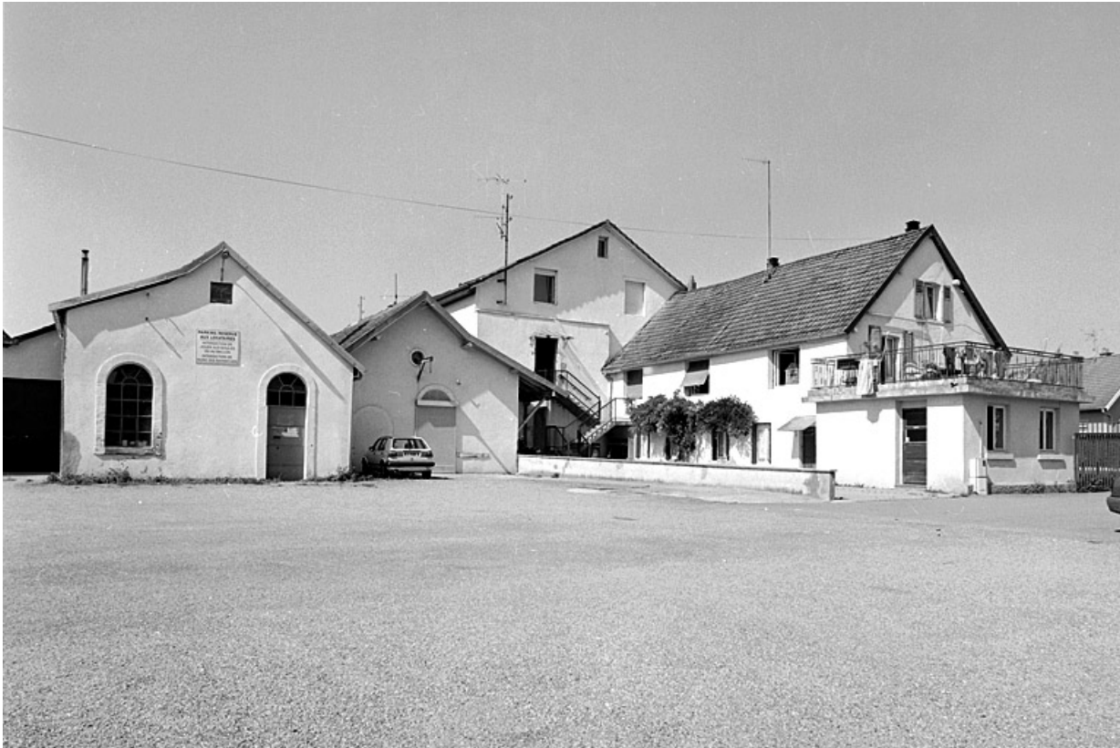
Pignons des ateliers depuis la cour.