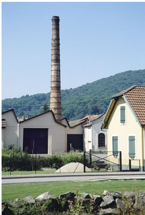
Ateliers de fabrication et cheminée depuis l'est. 90, Valdoie rue de Blumberg