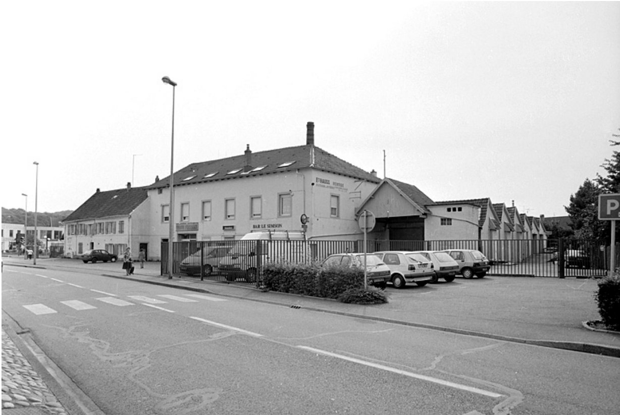
Vue d'ensemble depuis le nord-ouest.