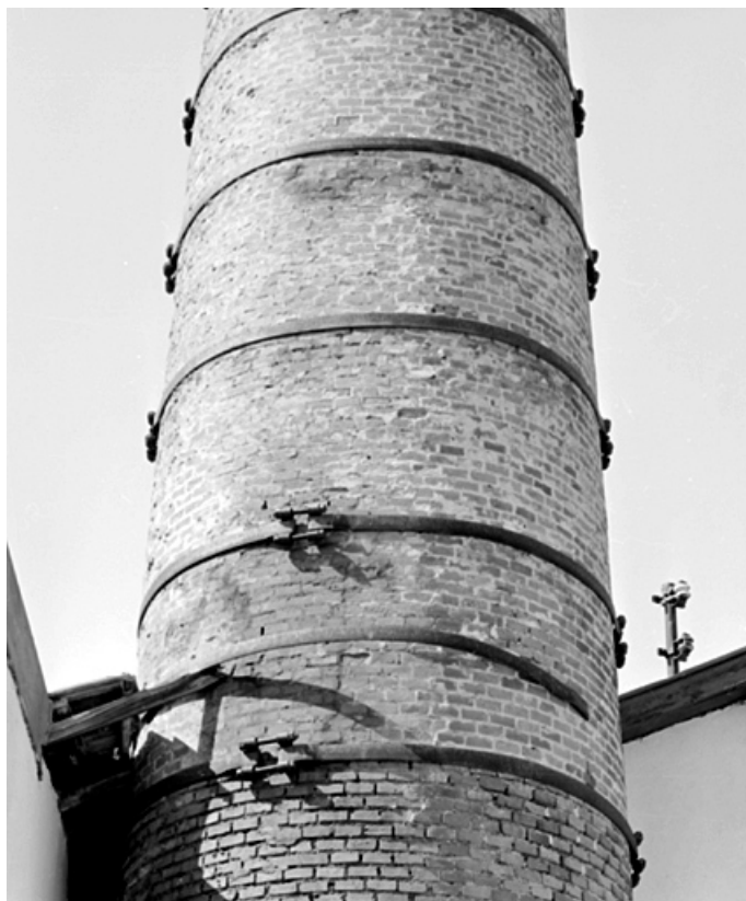
Détail de la cheminée : cerclages métalliques.