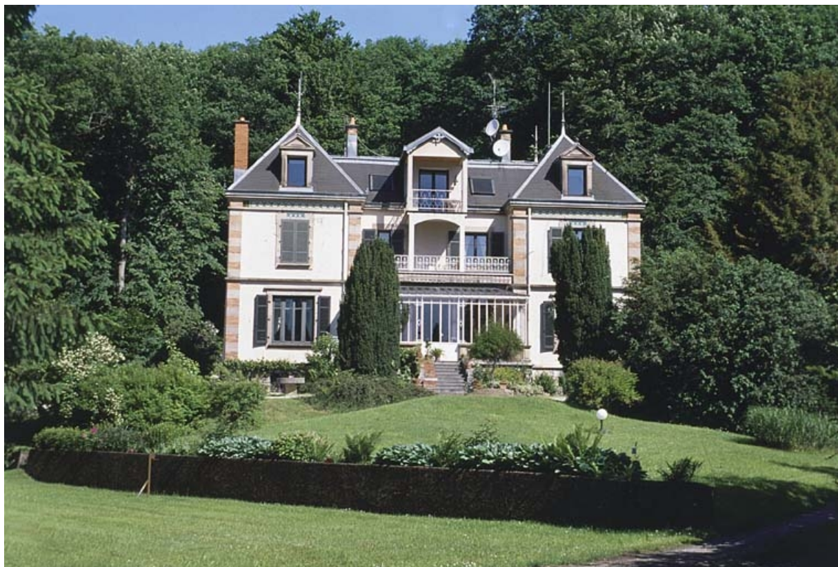
Façade antérieure du logement patronal.