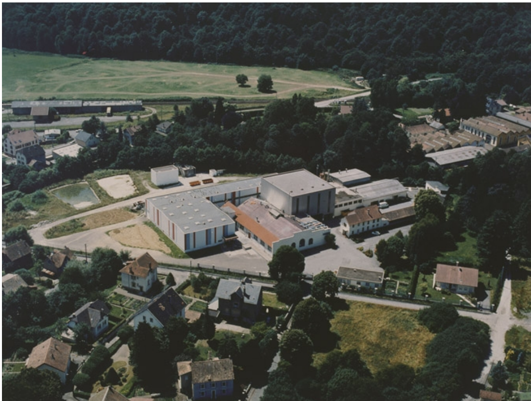
Vue aérienne depuis le sud-est.