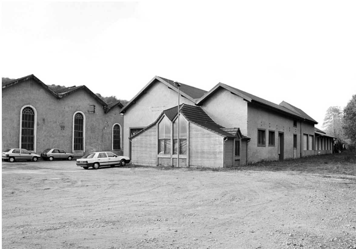
Ateliers de fabrication depuis le sud-est.