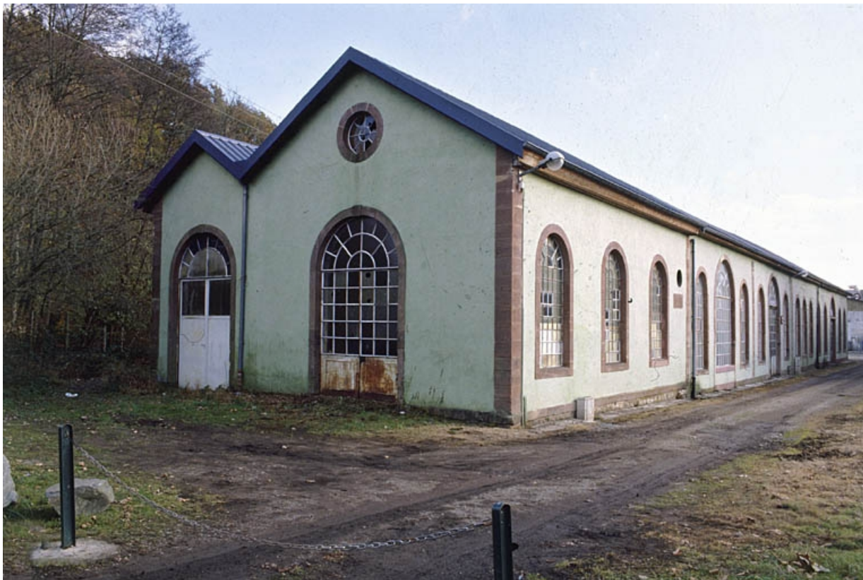
Salle des machines depuis le nord.