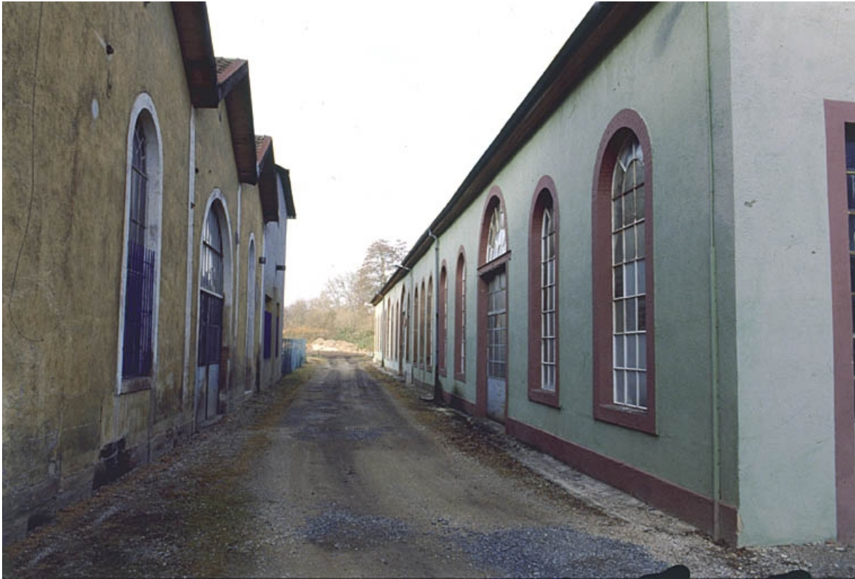
Passage entre les ateliers est.