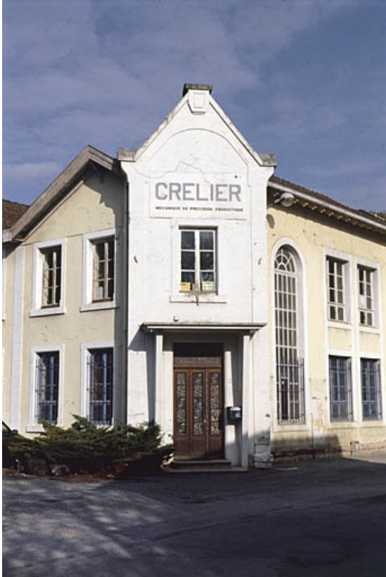
Bâtiment d'entrée : bureaux.