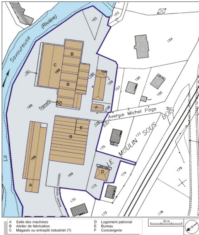
Plan-masse et de situation. Extrait du plan cadastral, 1984, section BL, 1:1000. 90, Valdoie, 5 à 10 avenue Michel Page