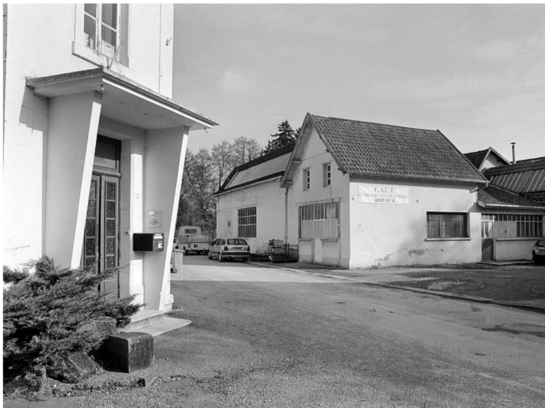
Ateliers de fabrication sud depuis le bâtiment des bureaux.