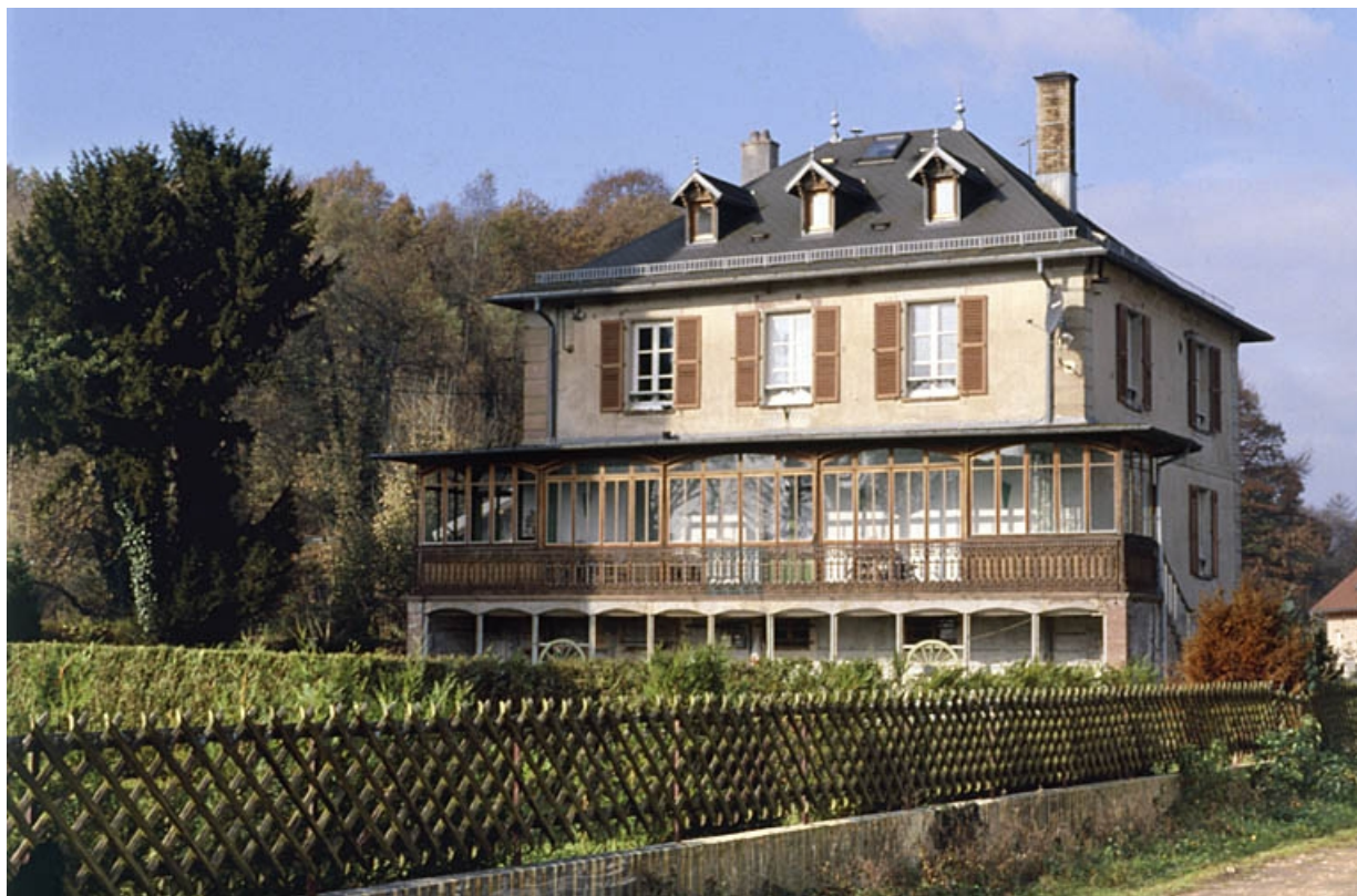
Logement patronal depuis le sud-est. 90, Valdoie, 5 à 10 avenue Michel Page