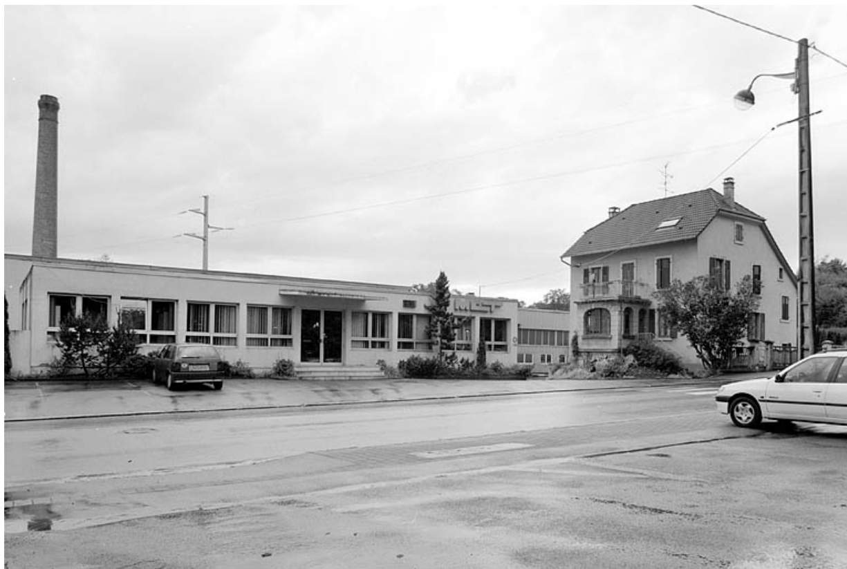
Bureaux et logement depuis le nord. 90, Delle, 37 faubourg de Montbéliard