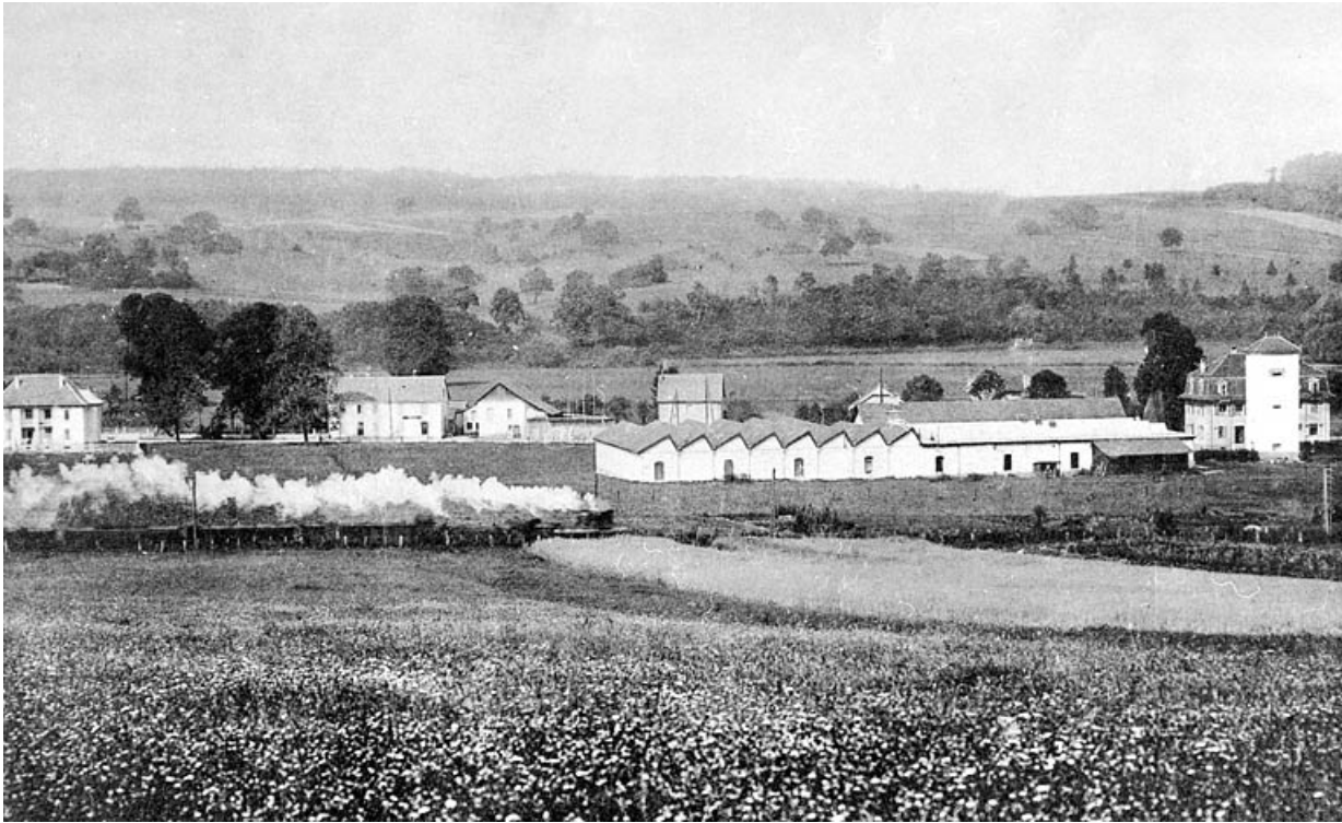
Delle (Territoire de Belfort). Les usines Amstutz Lervi et Cie. 90, Delle, 40 faubourg de Belfort