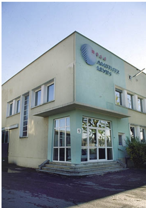
Entrée du bâtiment administratif d'entreprise.