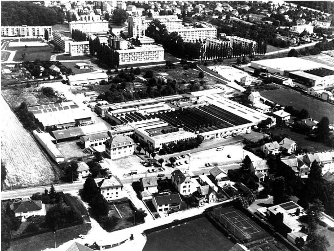
Vue aérienne générale depuis le nord-ouest. 90, Delle, 40 faubourg de Belfort