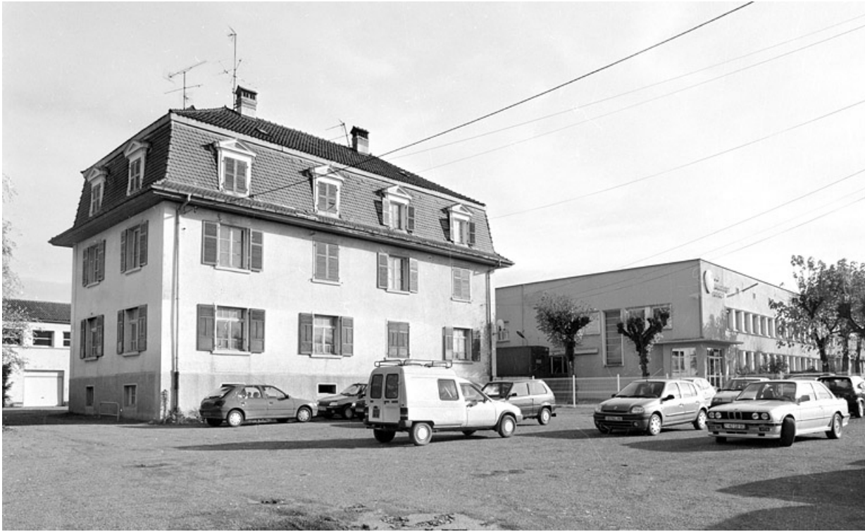
Logement (anciens bureaux) et atelier de fabrication.