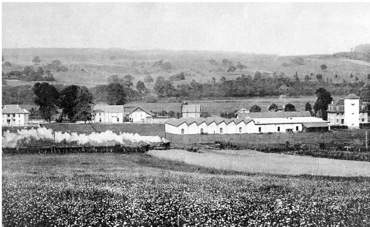
Delle (Territoire de Belfort). Les usines Amstutz Lervi et Cie. 90, Delle, 40 faubourg de Belfort