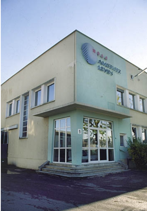
Entrée du bâtiment administratif d'entreprise.