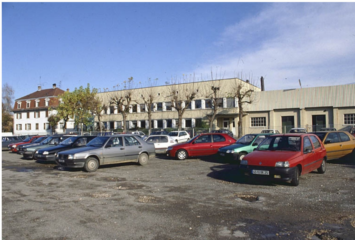
Vue d'ensemble depuis le sud-ouest.