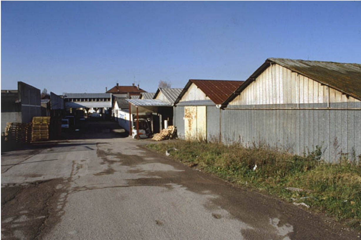
Ateliers de fabrication et entrepôts industriels depuis l'est.