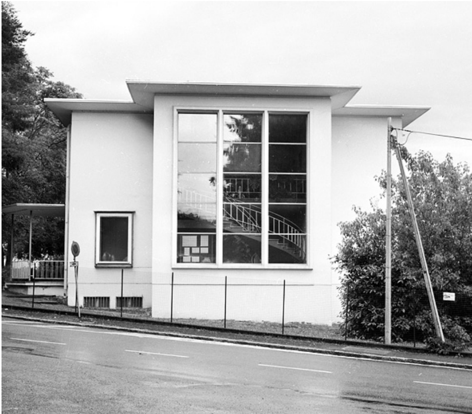
Façade nord du bâtiment administratif d'entreprise.