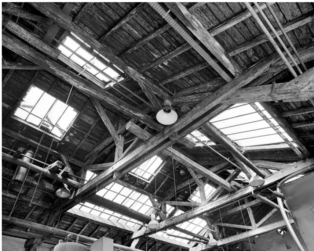
Charpente de l'atelier de matriçage des métaux non ferreux (désaffecté). 90, Delle rue des Parcs