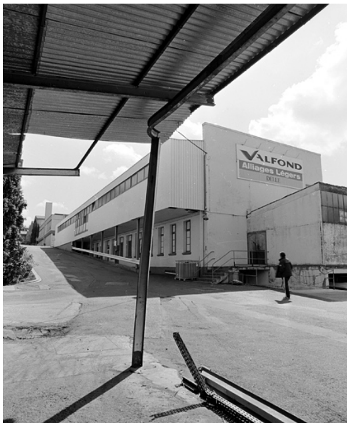
Ateliers de fabrication et vestiaire depuis l'ouest. 90, Delle rue des Parcs