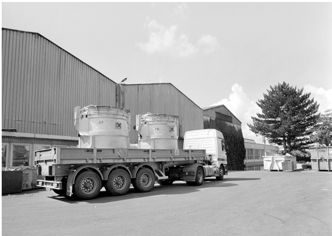
Camion manoeuvrant pour aller décharger les poches d'aluminium liquide.