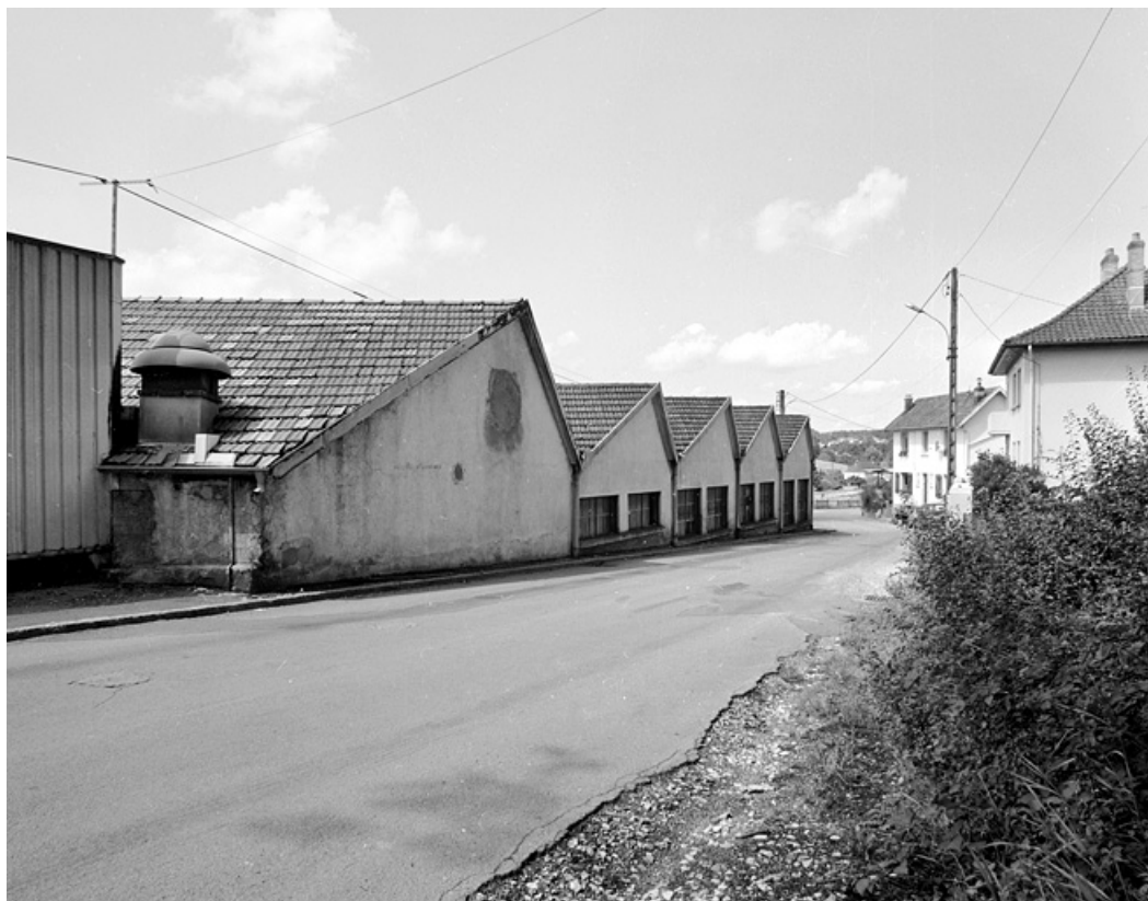
Ateliers donnant sur la rue de l'Egé.