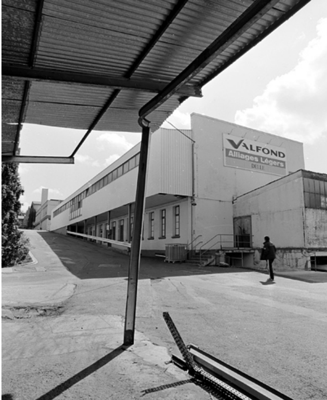
Ateliers de fabrication et vestiaire depuis l'ouest.