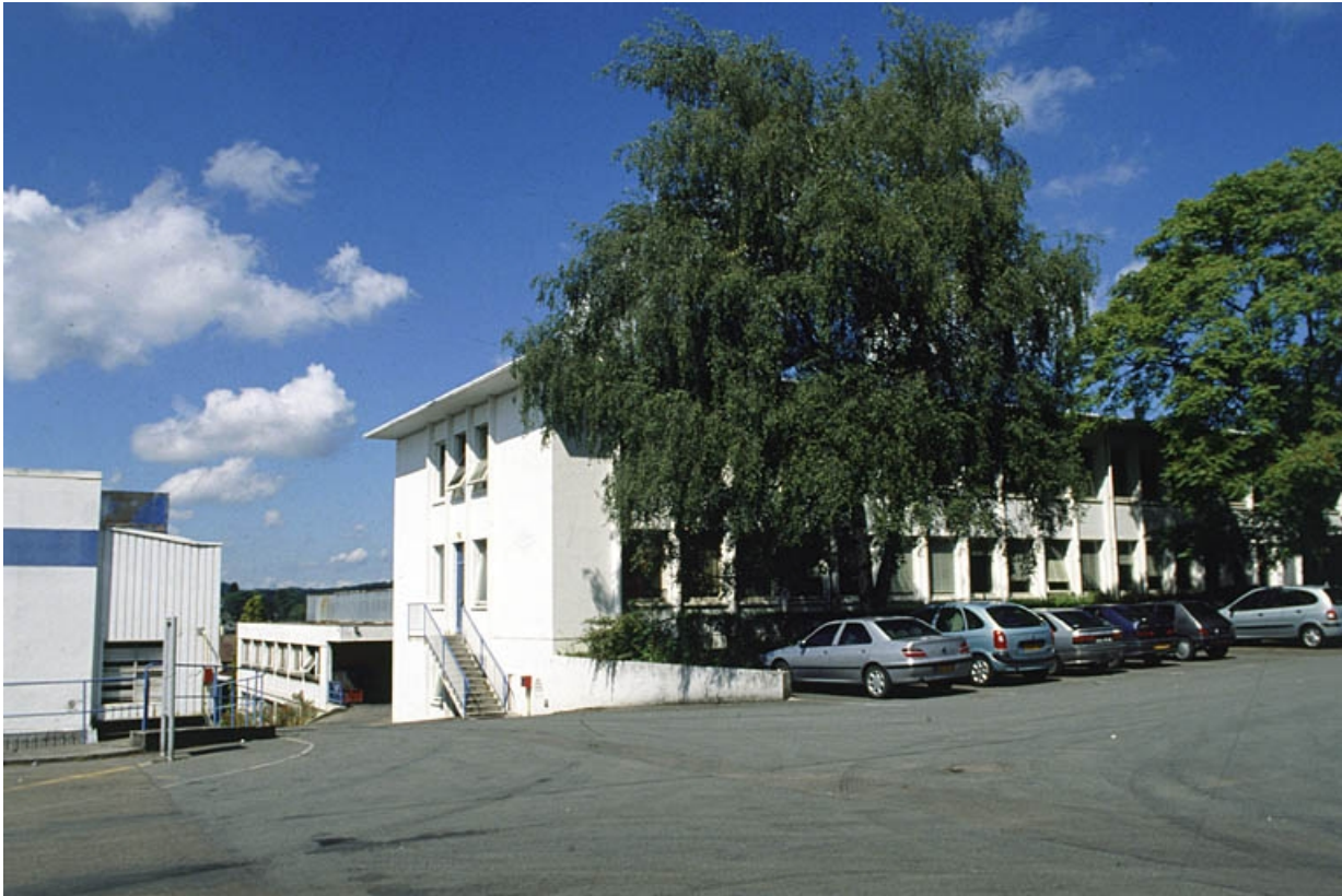
Bâtiment administratif d'entreprise.