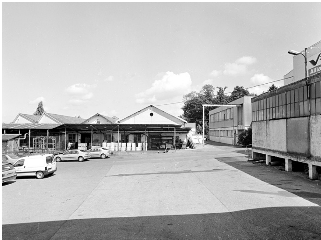
Ateliers de fabrication désaffectés (usinage, tournage, fraisage, décapage et matricage). 90, Delle rue des Parcs