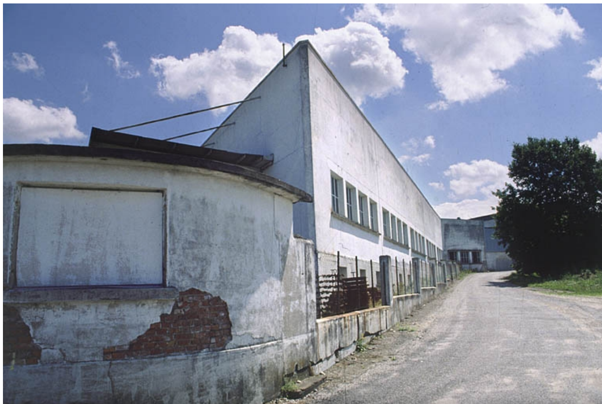
Fonderie et atelier d'usinage du zamak. 90, Delle rue des Parcs