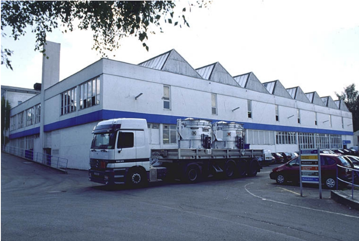
Atelier de fabrication des pièces en aluminium.