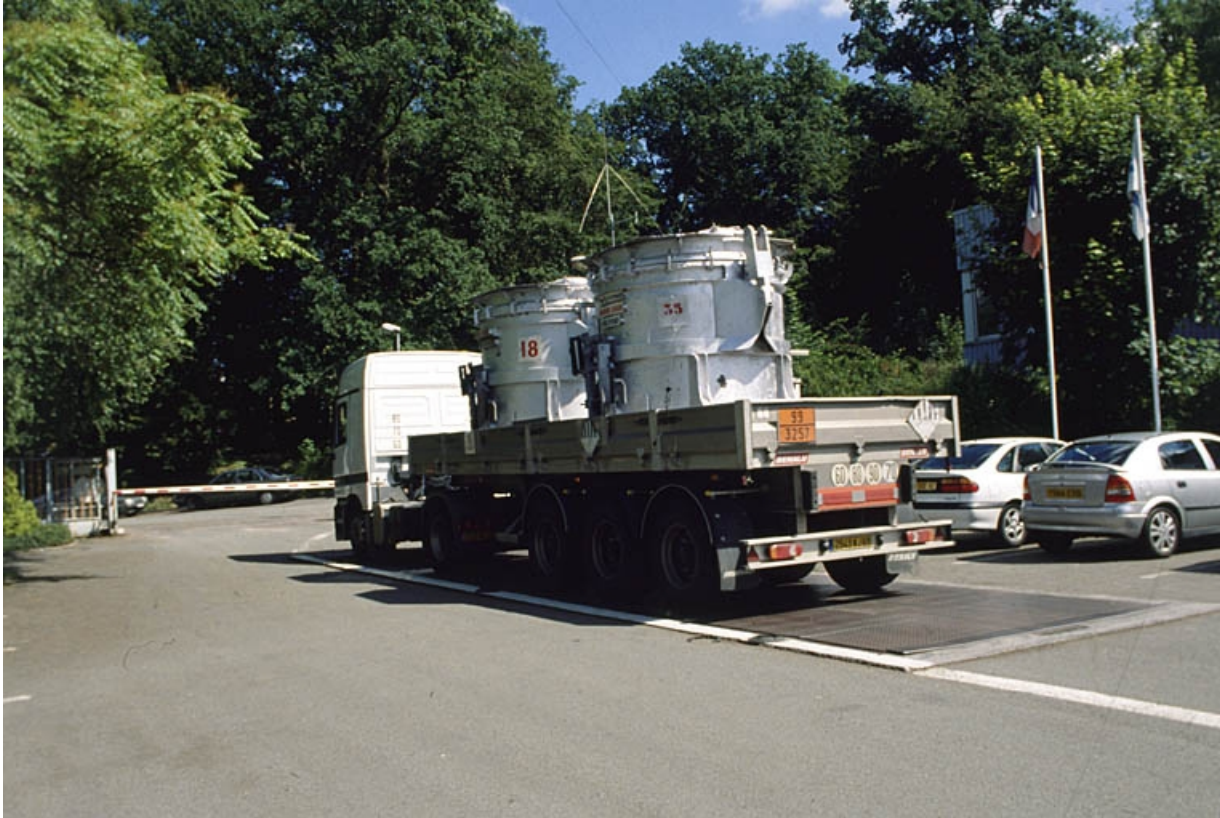
Camion chargé de deux poches d'aluminium liquide.