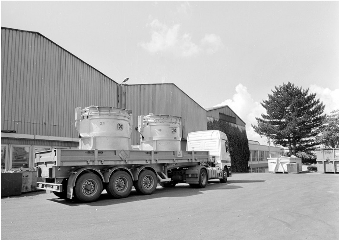
Camion manoeuvrant pour aller décharger les poches d'aluminium liquide. 90, Delle rue des Parcs