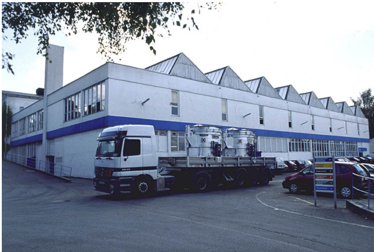
Atelier de fabrication des pièces en aluminium.