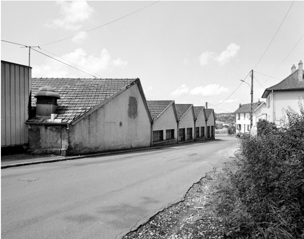
Ateliers donnant sur la rue de l'Egé.