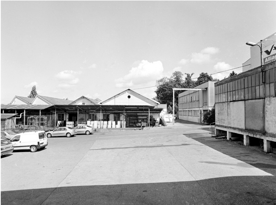
Ateliers de fabrication désaffectés (usinage, tournage, fraisage, décapage et matriçage). 90, Delle rue des Parcs