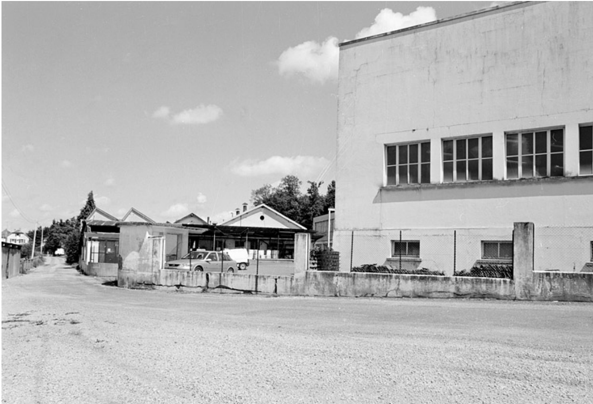
Ateliers de fabrication sur la rue des Parcs.