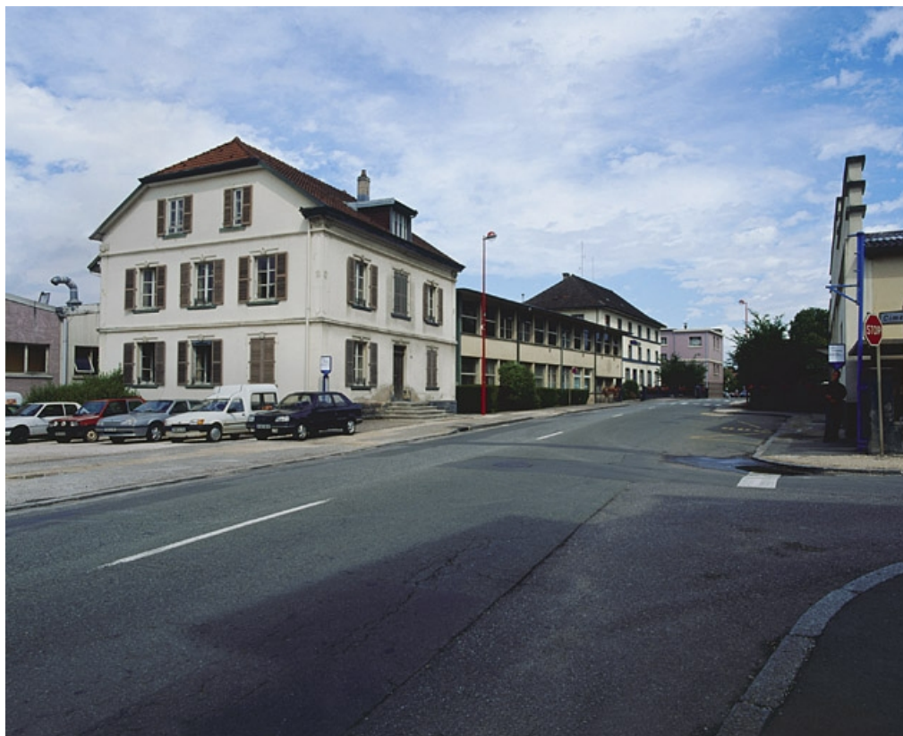
Vue d'ensemble depuis le sud. 90, Delle, 27 faubourg de Belfort