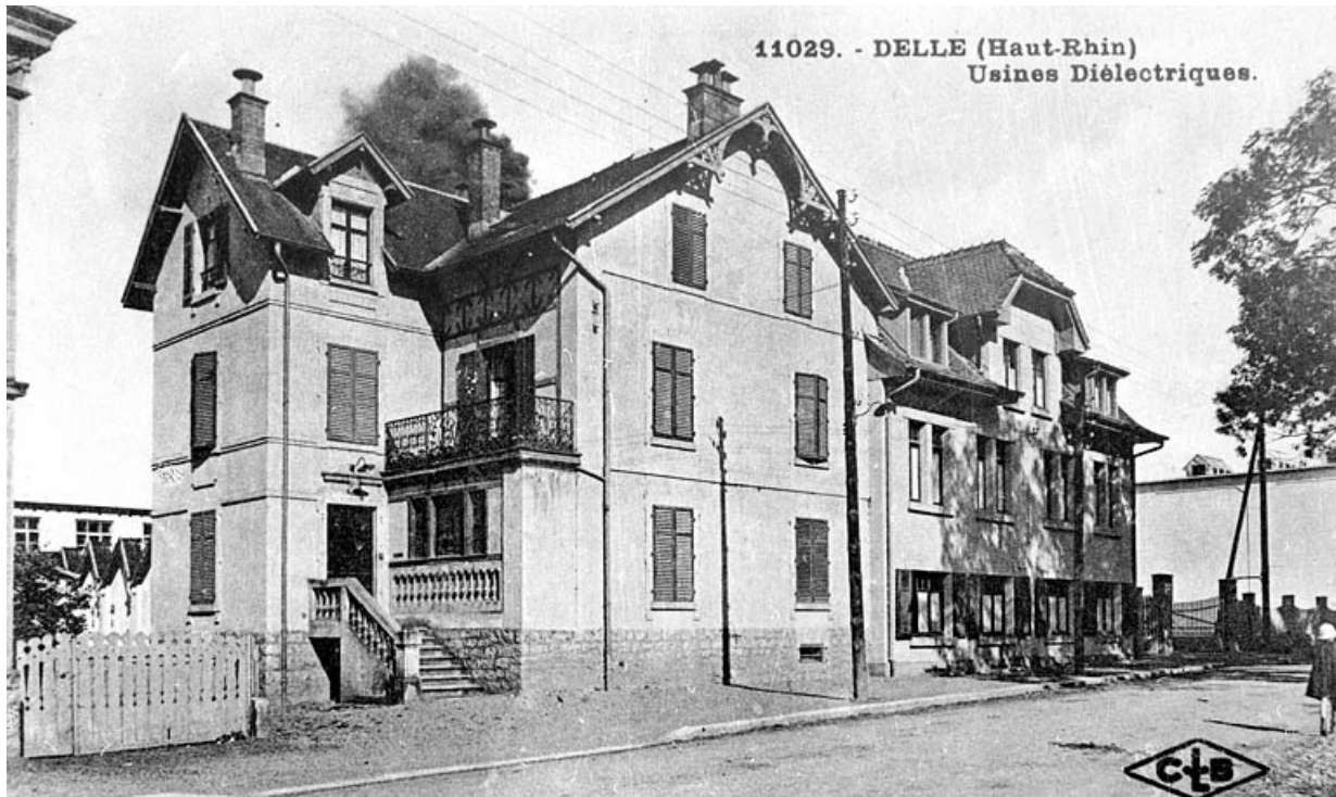
Delle (Haut-Rhin) - Usines Diélectriques. 90, Delle, 27 faubourg de Belfort