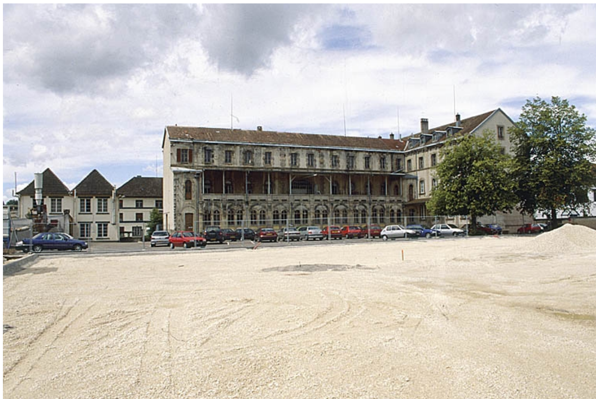
Vue rapprochée depuis l'est. 90, Delle, 27 faubourg de Belfort