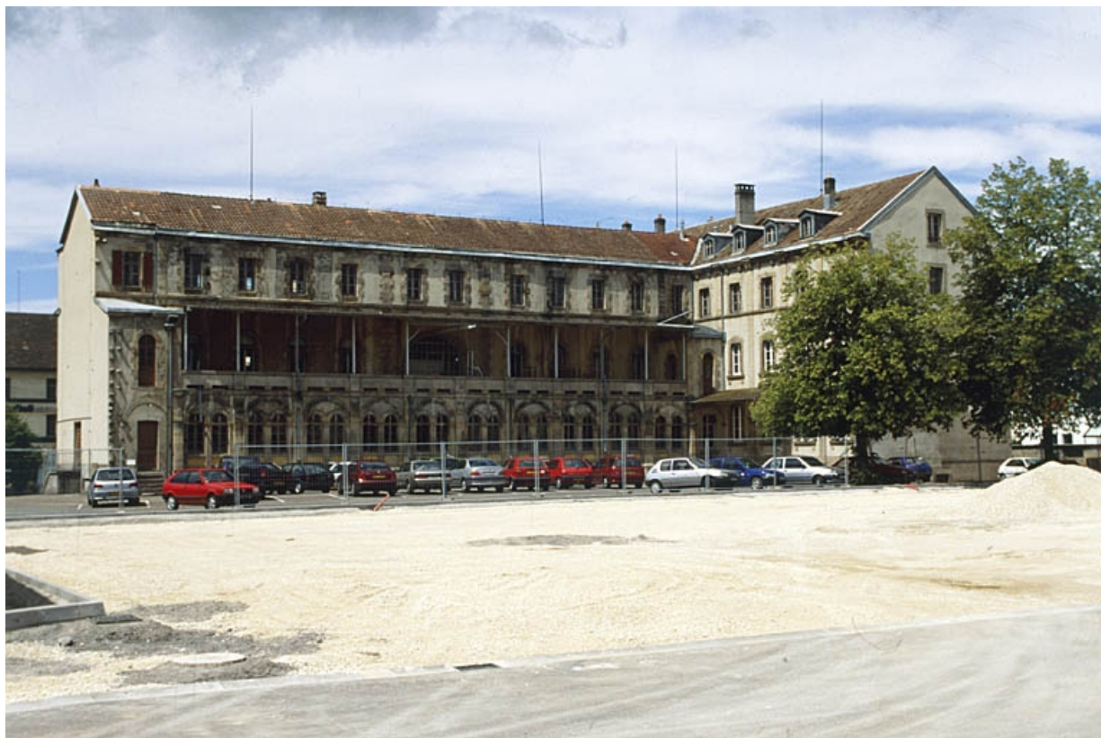
Façade est de l'ancien couvent de dominicaines.