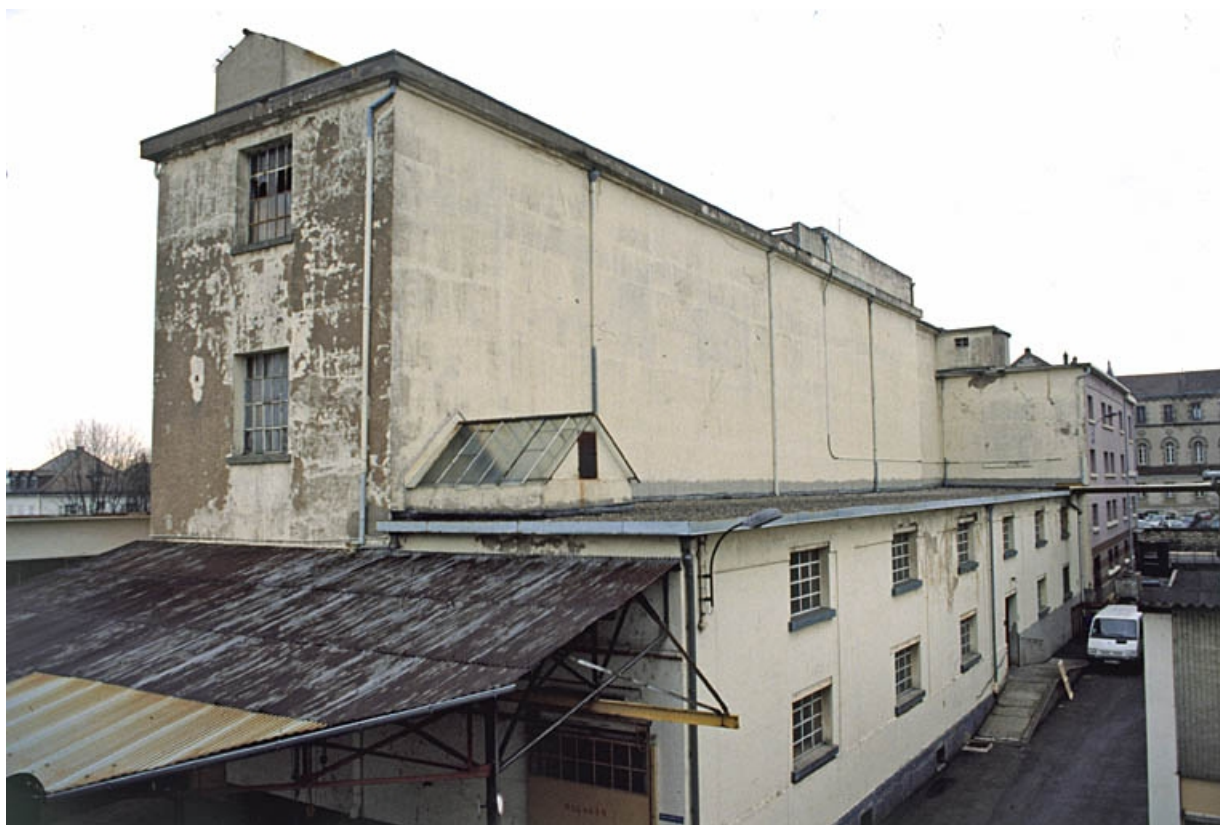
Atelier de découpage et d'imprégnation des toiles, et magasin général. 90, Delle, 27 faubourg de Belfort