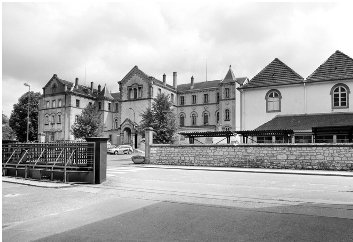
Bâtiment administratif (ancien couvent) et laboratoire.