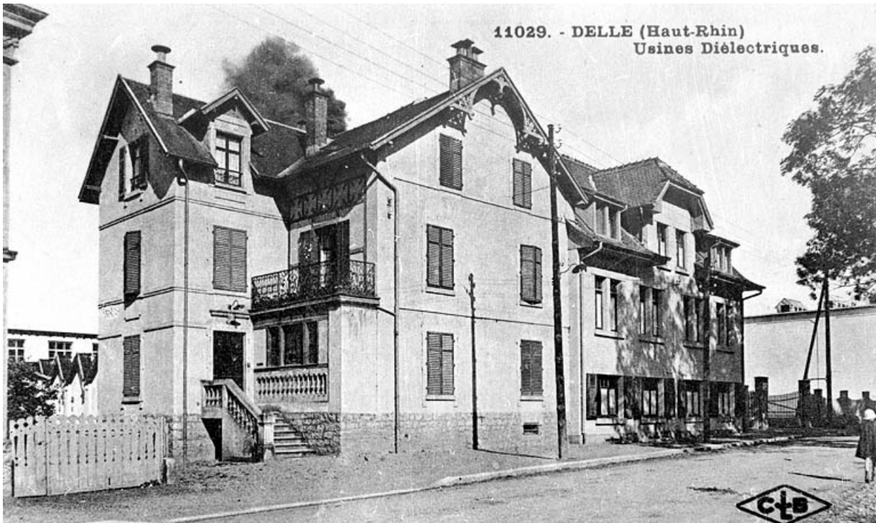
Delle (Haut-Rhin) - Usines Diélectriques. 90, Delle, 27 faubourg de Belfort