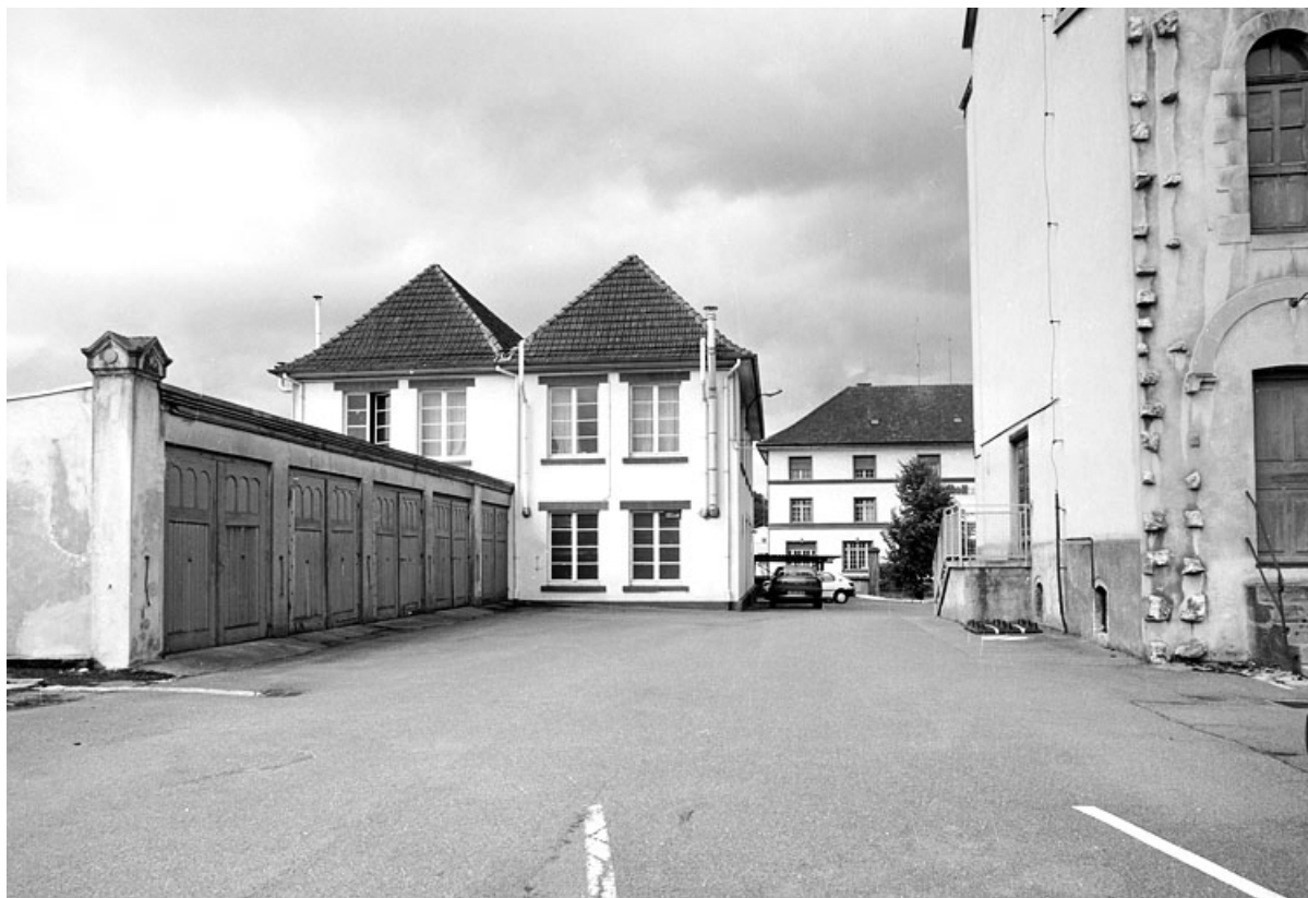
Remises et laboratoire depuis l'est.