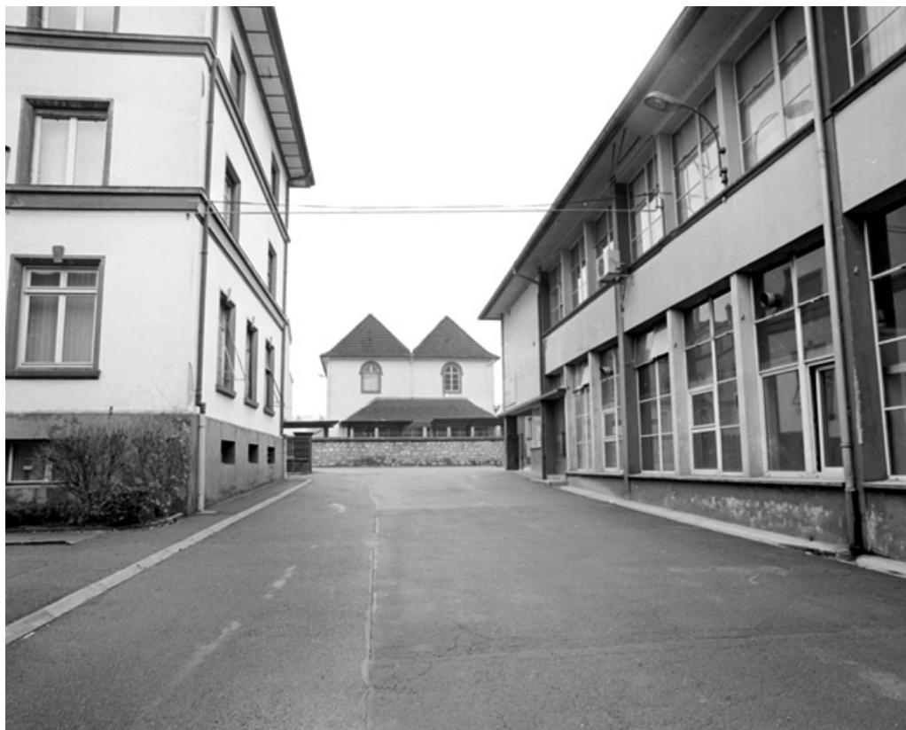
Bureaux (à gauche) et bâtiment abritant des fonctions productives et sociales (à droite). 90, Delle, 27 faubourg de Belfort