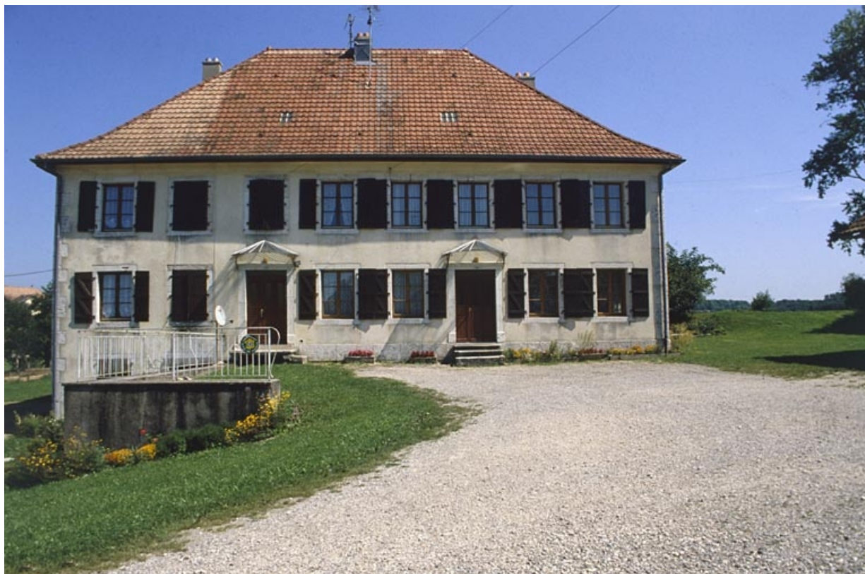
Façade ouest du logement patronal.