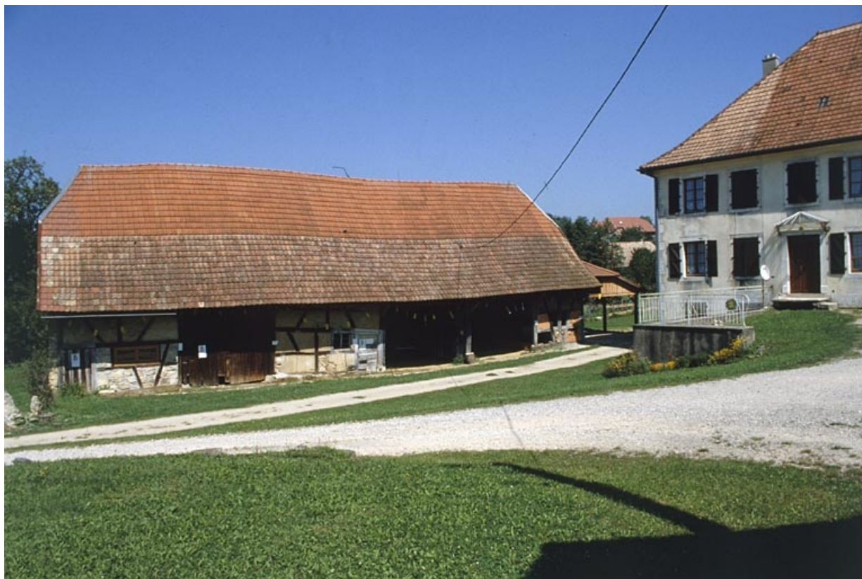
Remise, grange et écurie depuis le sud.