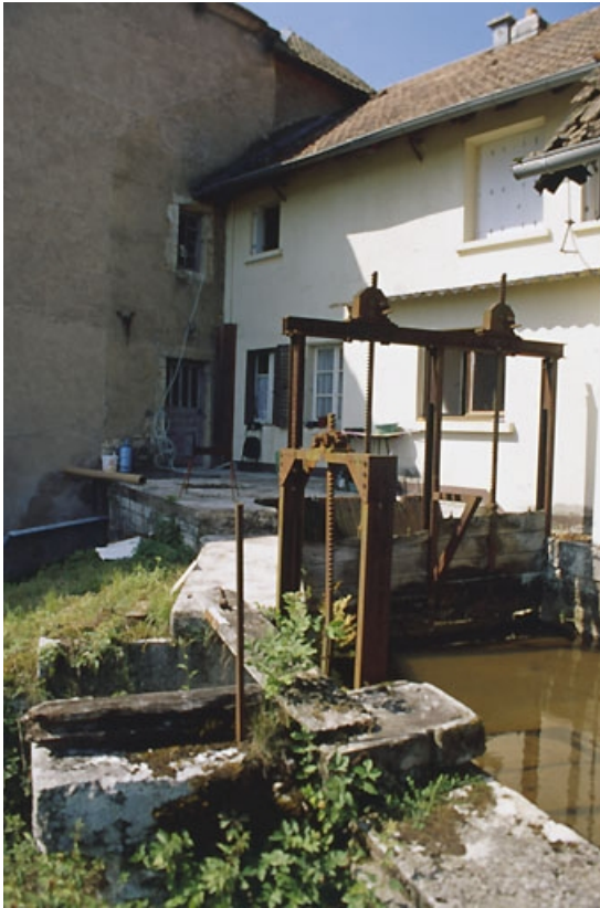
Vannage sur le canal d'amenée.