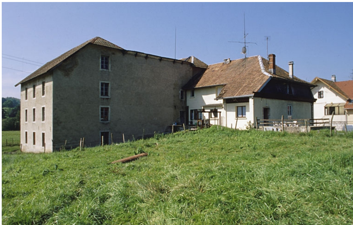
Vue d'ensemble depuis le sud-est.