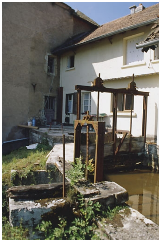
Vannage sur le canal d'amenée.