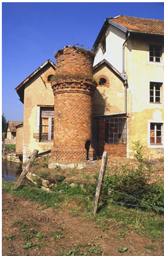
Salle des machines dissimulée par les vestiges de la cheminée.