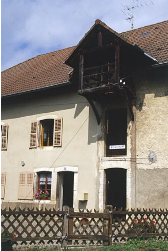
Logement accolé à la minoterie.