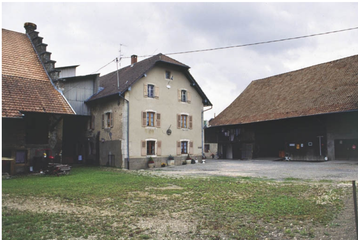
Parties agricoles et mur-pignon du logement depuis la cour.