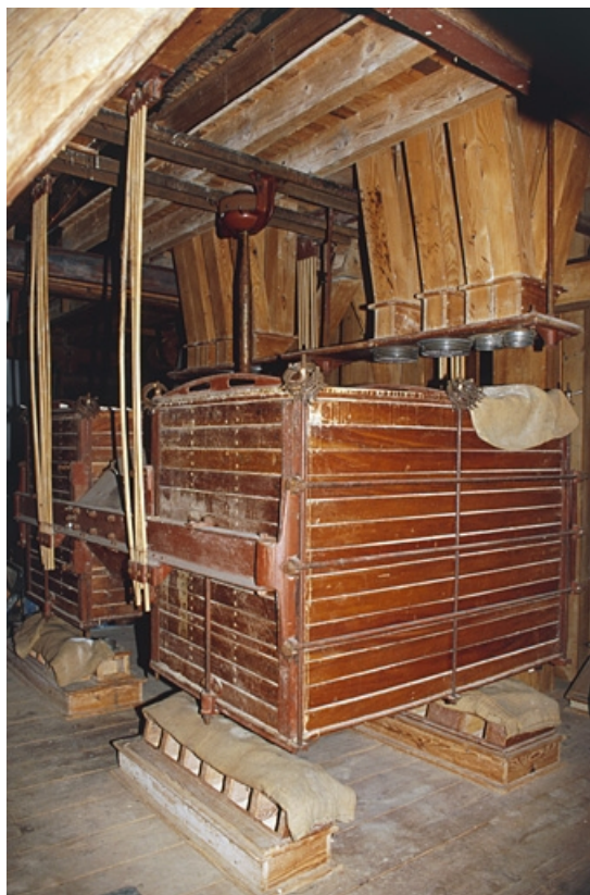
Planschter Lafon à l'étage en surcroît.