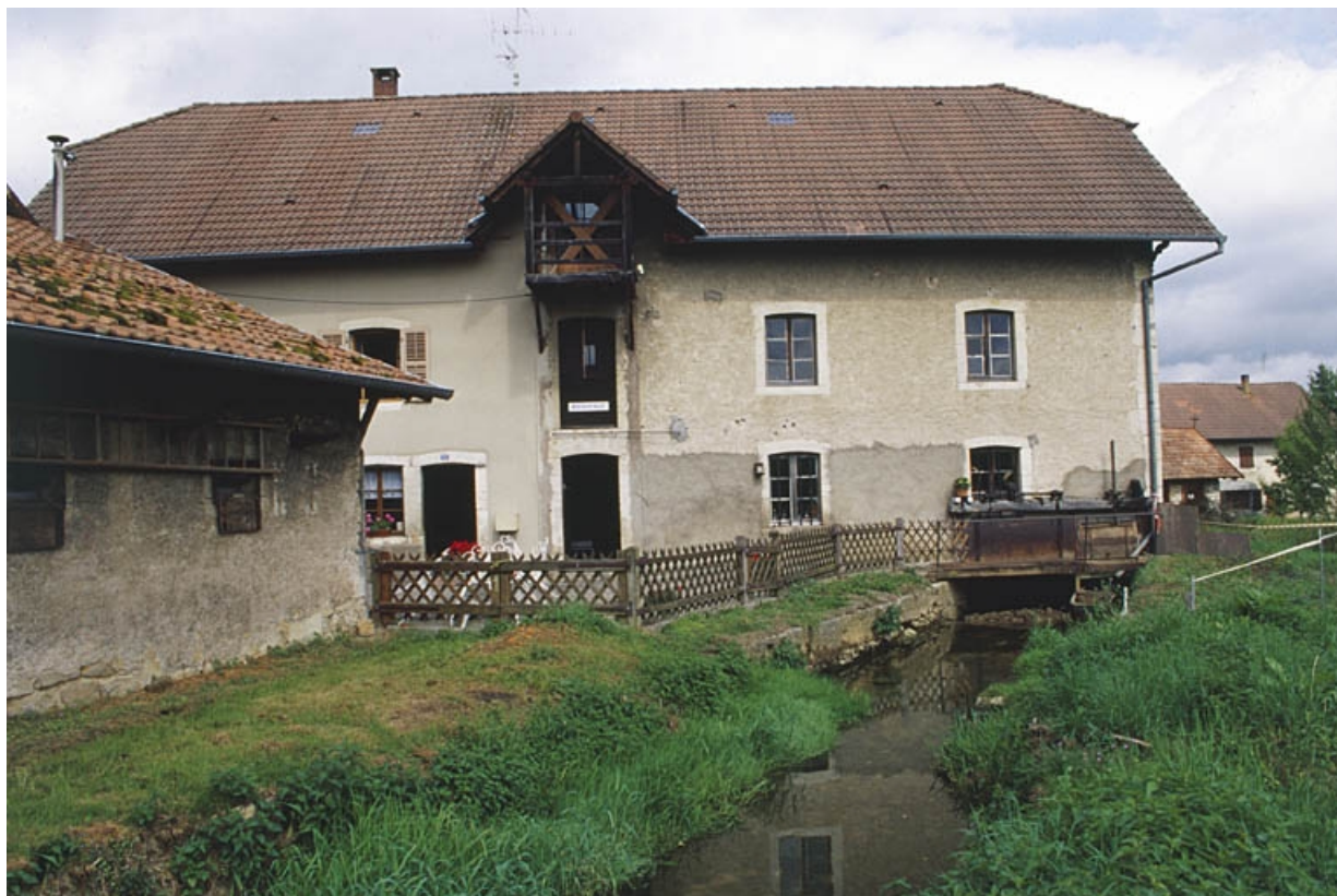
Façade antérieure de la minoterie.