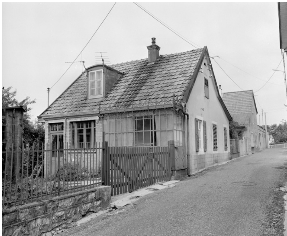
Maison au n° 6, rue des Mélèzes : vue de trois quarts gauche en 1981. SRI. Enquête régionale sur les bâtiments industriels (1979-1981).

90, Beaucourt, lieudit : cité Pierre Japy