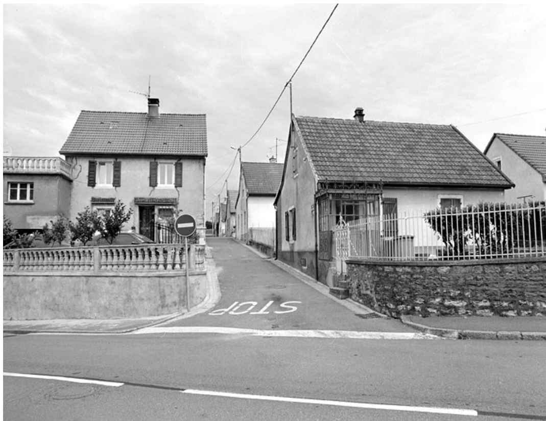
Vue de la rue des Chênes depuis le sud.

90, Beaucourt, lieudit : cité Pierre Japy