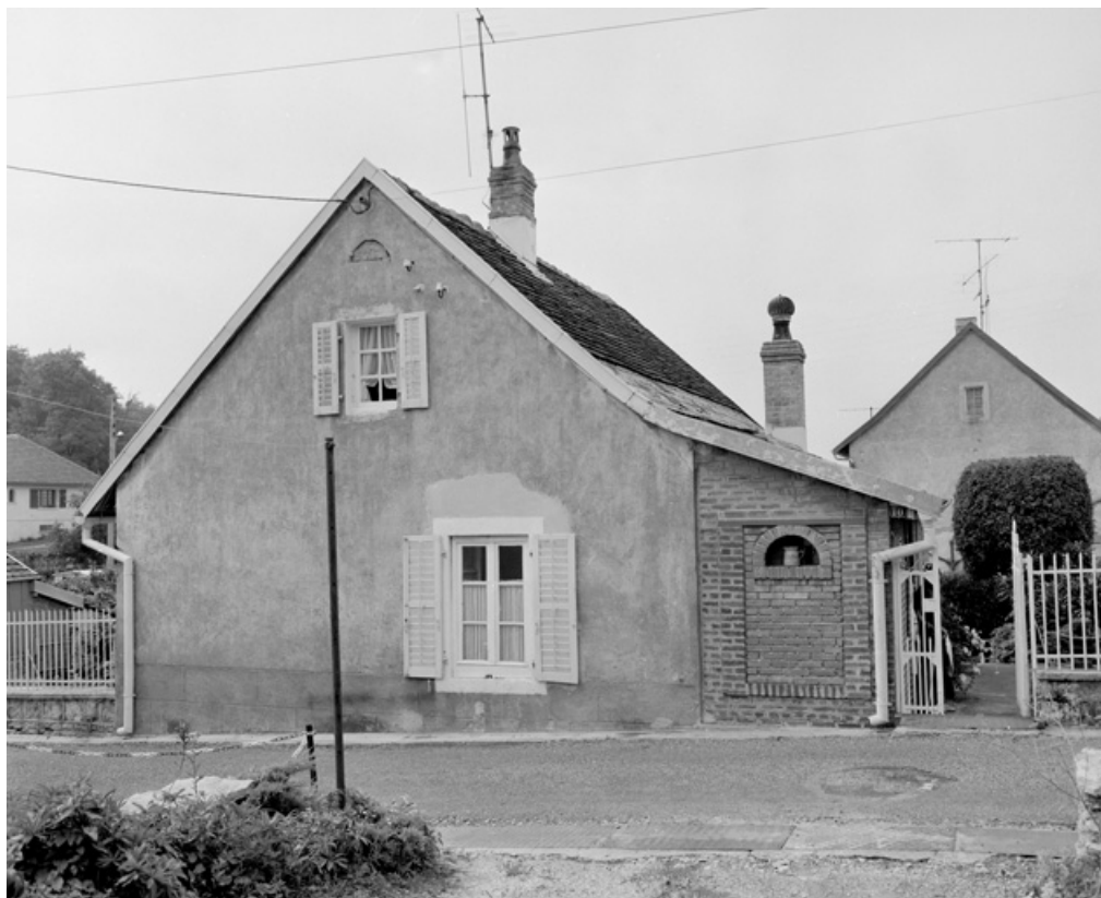
Maison au n° 10, rue des Mèlèzes : façade sur rue en 1981. SRI. Enquête régionale sur les bâtiments industriels (1979-1981). 90, Beaucourt, lieudit : cité Pierre Japy