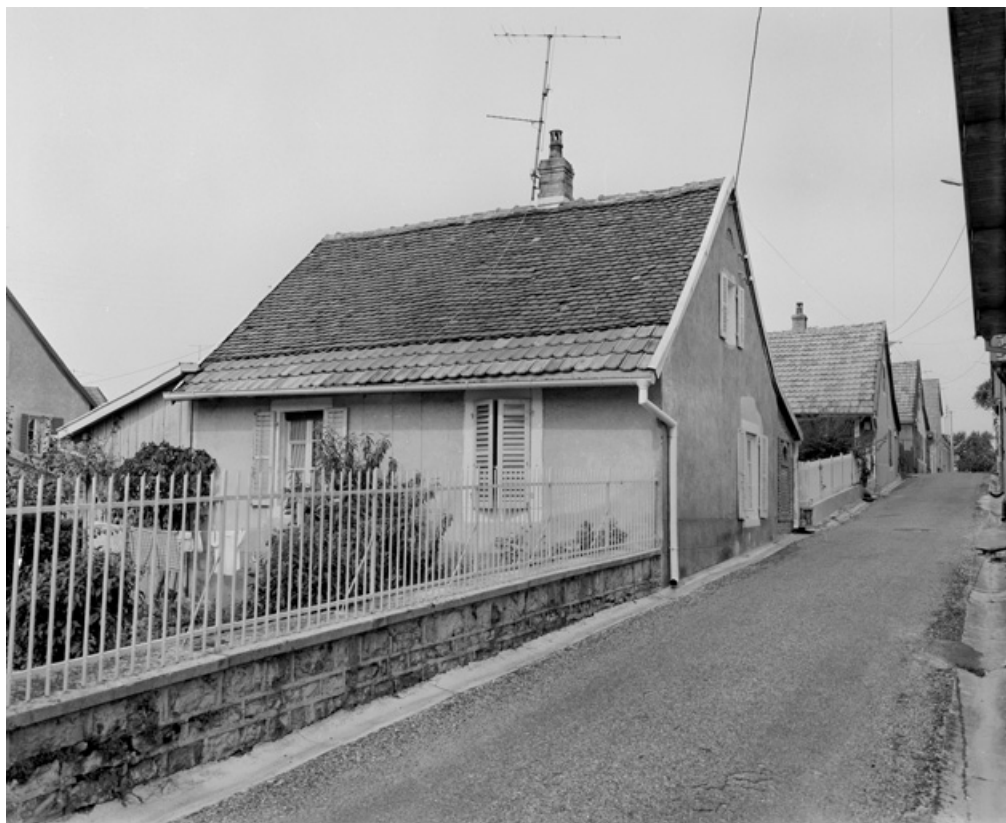
Maison au n° 10, rue des Mélèzes : façade sur jardin en 1981. SRI. Enquête régionale sur les bâtiments industriels (1979-1981). 90, Beaucourt, lieudit : cité Pierre Japy