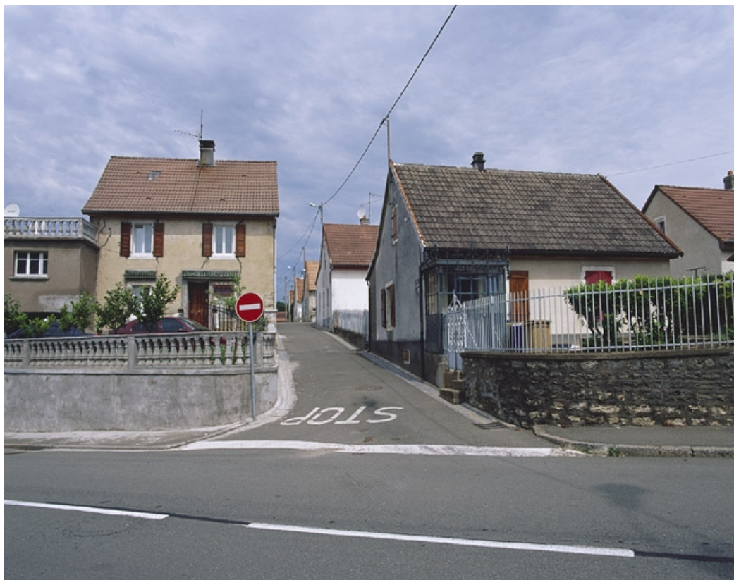
Vue de la rue des Chênes depuis le sud.

90, Beaucourt, lieudit : cité Pierre Japy