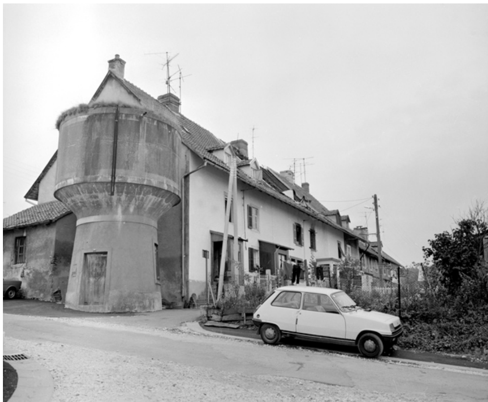
"Caserna" rue des Bouleaux : vue depuis le nord en 1981. SRI. Enquête régionale sur les bâtiments industriels (1979-1981). 90, Beaucourt, lieudit : cité Pierre Japy