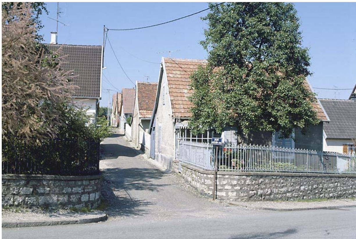
Alignement de maisons rue des Mélèzes en 1986.