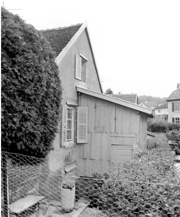
Maison au n° 10, rue des Mélèzes : façade postérieure en 1981. SRI. Enquête régionale sur les bâtiments industriels (1979-1981). 90, Beaucourt, lieudit : cité Pierre Japy