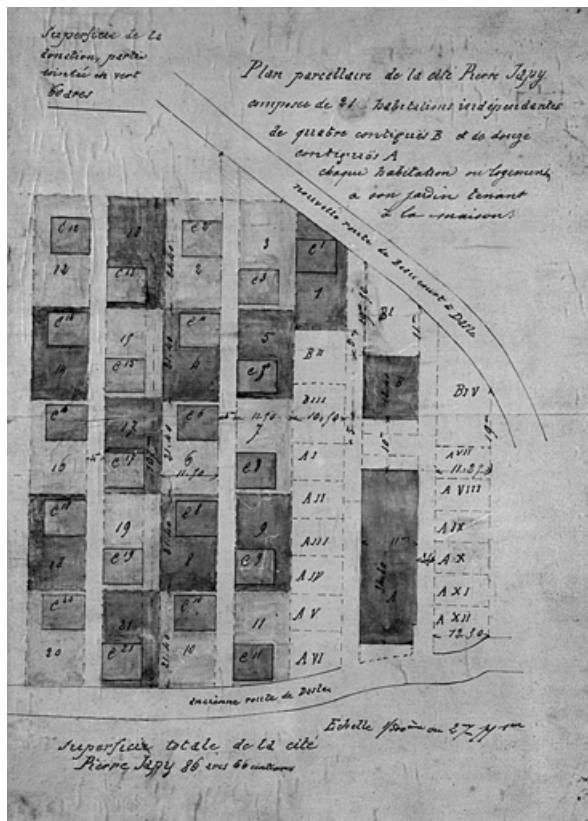
Plan parcellaire de la cité Pierre Japy composée de 21 habitations indépendantes [...].

90, Beaucourt, lieudit : cité Pierre Japy