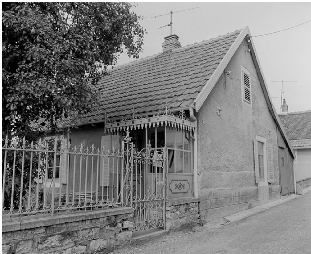
Maison au n° 12, rue des Mèlèzes : vue de trois quarts gauche en 1981. SRI. Enquête régionale sur les bâtiments industriels (1979-1981).

90, Beaucourt, lieudit : cité Pierre Japy