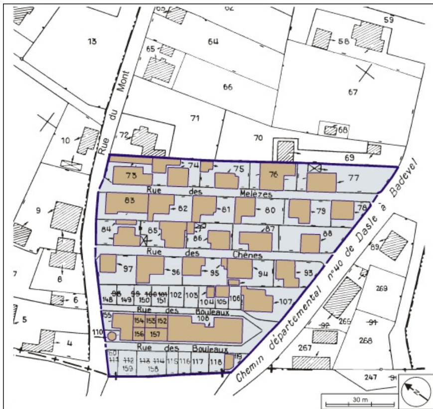
Plan-masse et de situation. Extrait du plan cadastral, 1979, section AM, 1:1000.

90, Beaucourt, lieudit : cité Pierre Japy