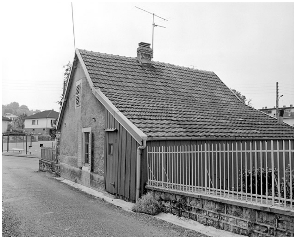
Maison au n° 12, rue des Mélèzes : vue de trois quarts droite en 1981. SRI. Enquête régionale sur les bâtiments industriels (1979-1981).

90, Beaucourt, lieudit : cité Pierre Japy