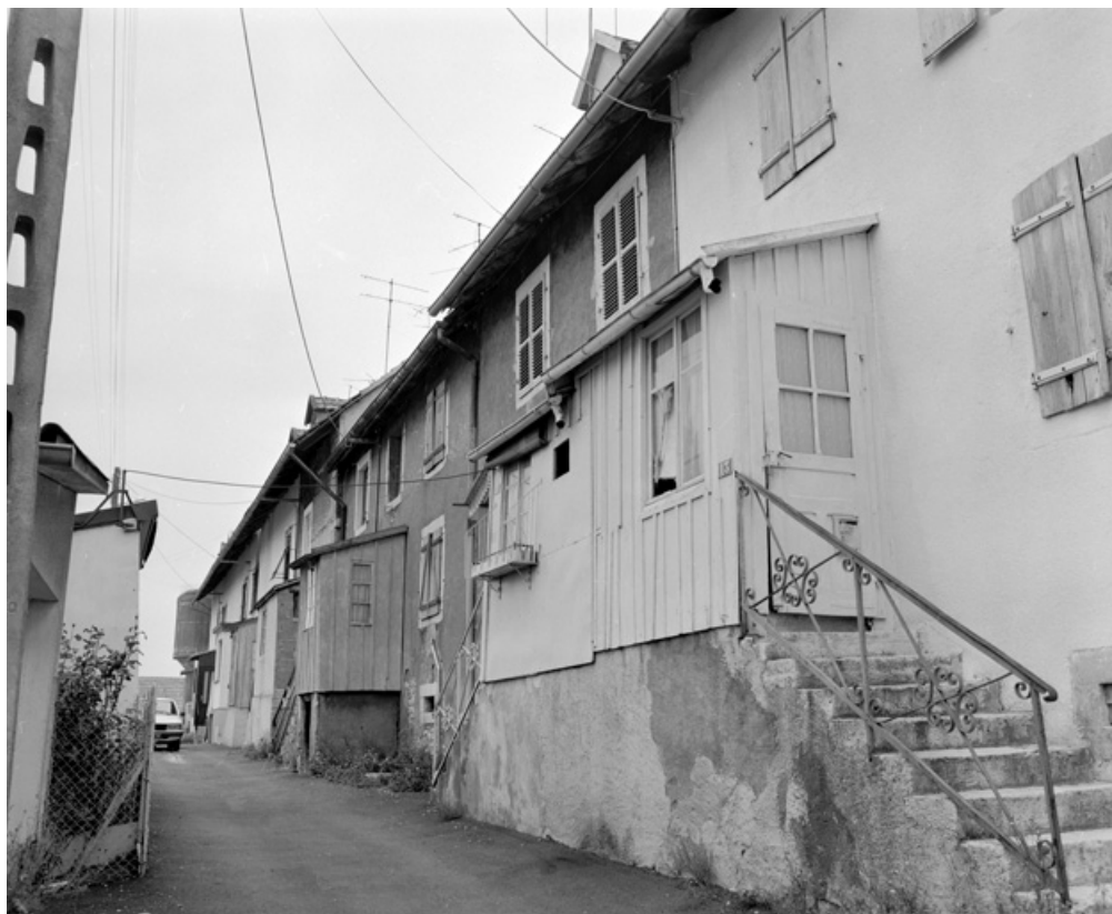
"Casernes" rue des Bouleaux : vue depuis le sud en 1981. 90, Beaucourt, lieudit : cité Pierre Japy