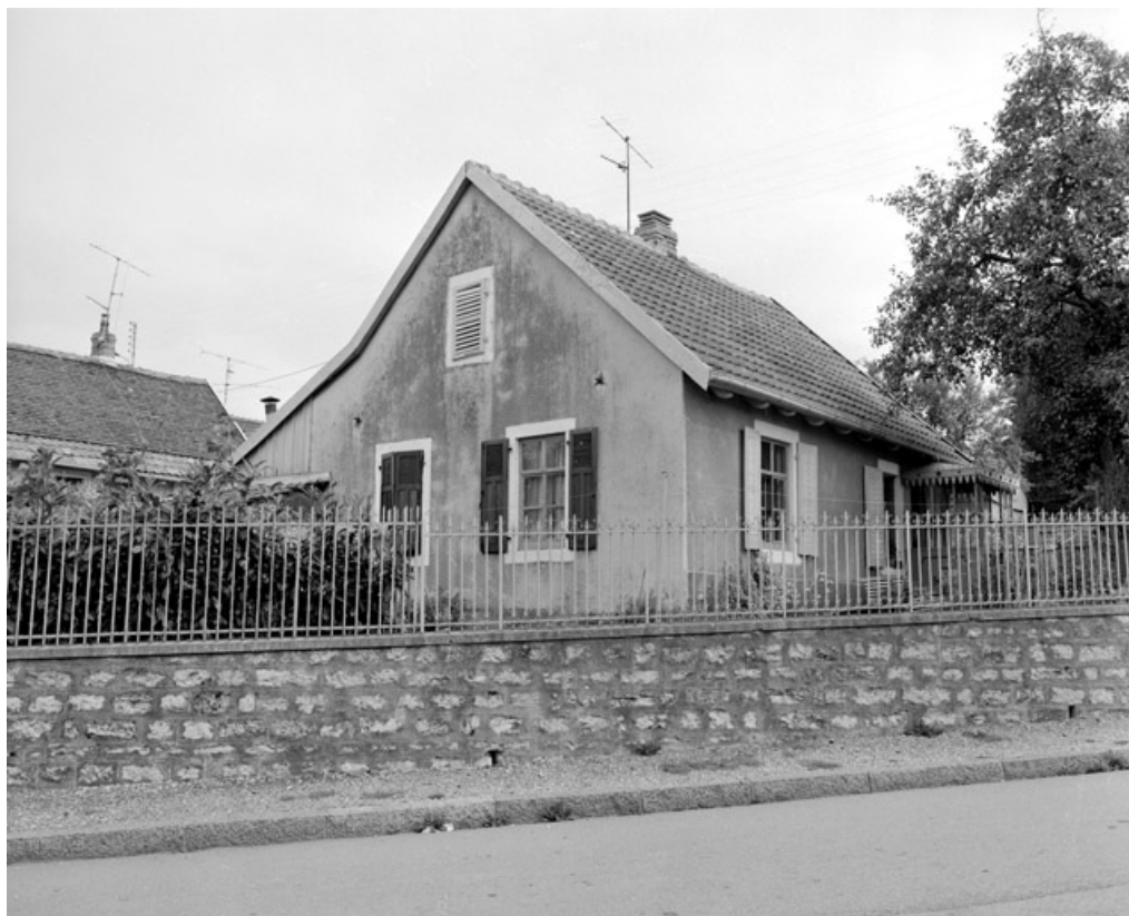
Maison au n° 12, rue des Mélèzes : façade sur jardin en 1981. SRI. Enquête régionale sur les bâtiments industriels (1979-1981). 90, Beaucourt, lieudit : cité Pierre Japy