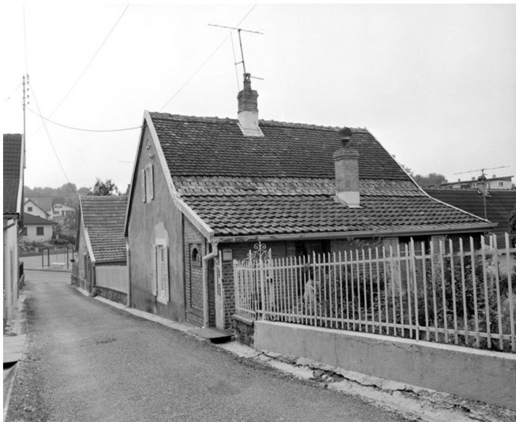
Maison au n° 10, rue des Mélèzes : vue de trois quarts droite en 1981. SRI. Enquête régionale sur les bâtiments industriels (1979-1981).

90, Beaucourt, lieudit : cité Pierre Japy