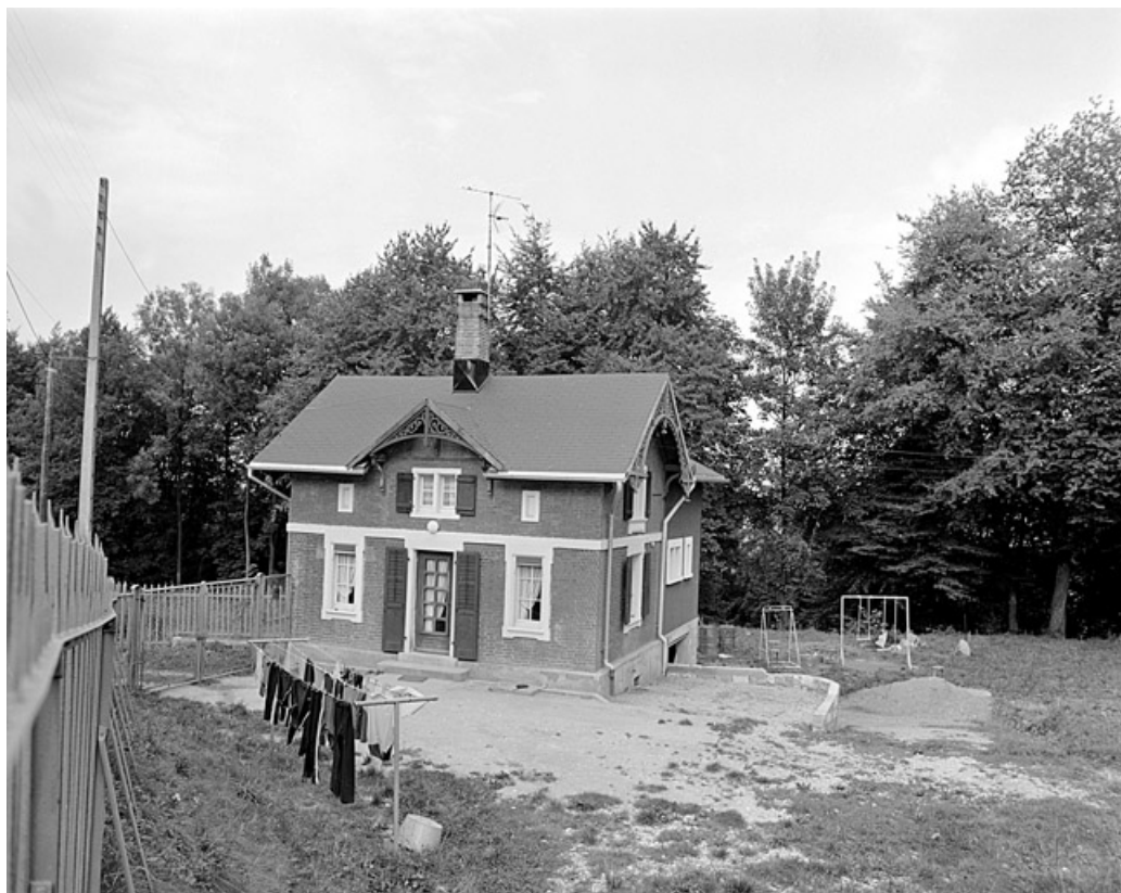
Conciergerie en 1981. SRI. Enquête régionale sur les bâtiments industriels (1979-1981). 90, Beaucourt rue Sous les Vignes