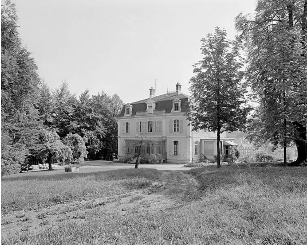
Vue d'ensemble depuis le nord-ouest en 1981. SRI. Enquête régionale sur les bâtiments industriels (1979-1981). 90, Beaucourt rue Sous les Vignes