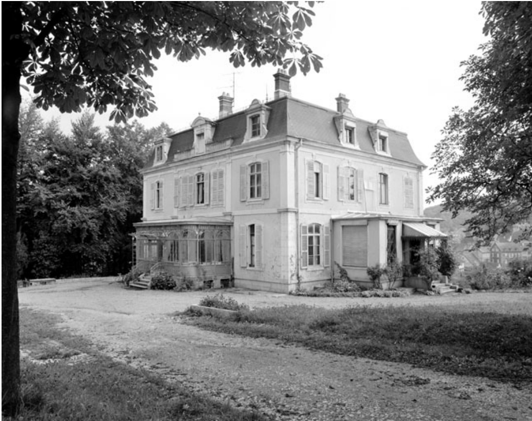
Vue de trois quarts depuis le nord-ouest en 1981. SRI. Enquête régionale sur les bâtiments industriels (1979-1981). 90, Beaucourt rue Sous les Vignes