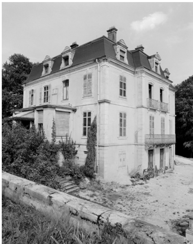
Façades ouest et sud en 1981. SRI. Enquête régionale sur les bâtiments industriels (1979-1981). 90, Beaucourt rue Sous les Vignes