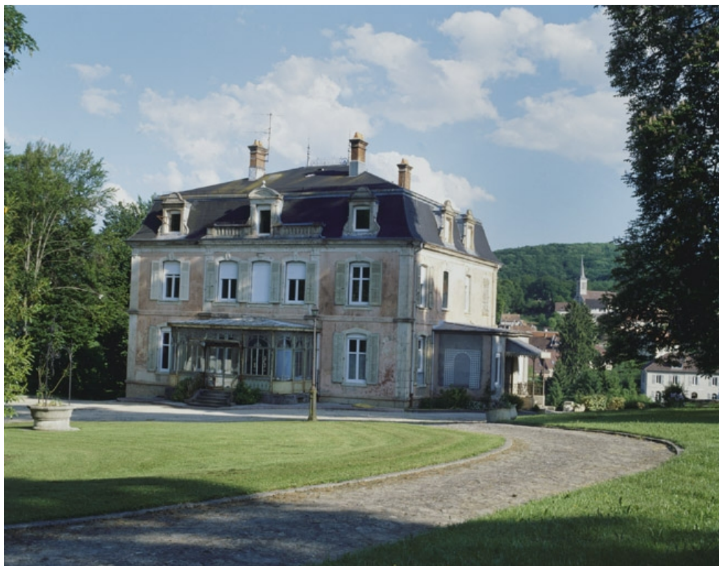
Façade nord vue de trois quarts.