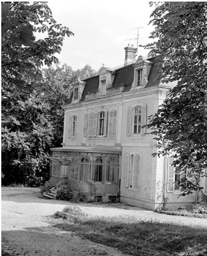
Façade nord vue de trois quarts droite en 1981. SRI. Enquête régionale sur les bâtiments industriels (1979-1981). 90, Beaucourt rue Sous les Vignes