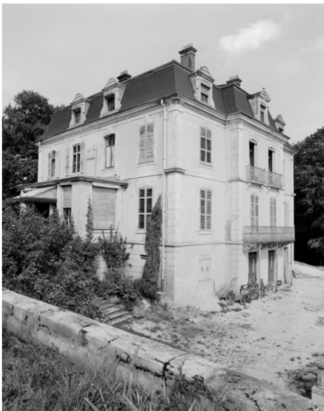
Façades ouest et sud en 1981. SRI. Enquête régionale sur les bâtiments industriels (1979-1981). 90, Beaucourt rue Sous les Vignes