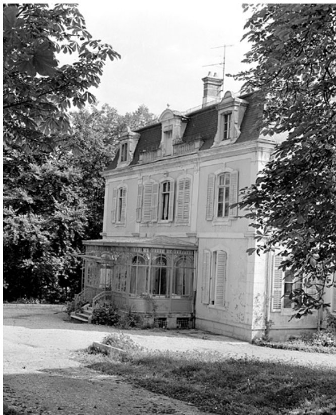
Façade nord vue de trois quarts droite en 1981. SRI. Enquête régionale sur les bâtiments industriels (1979-1981). 90, Beaucourt rue Sous les Vignes