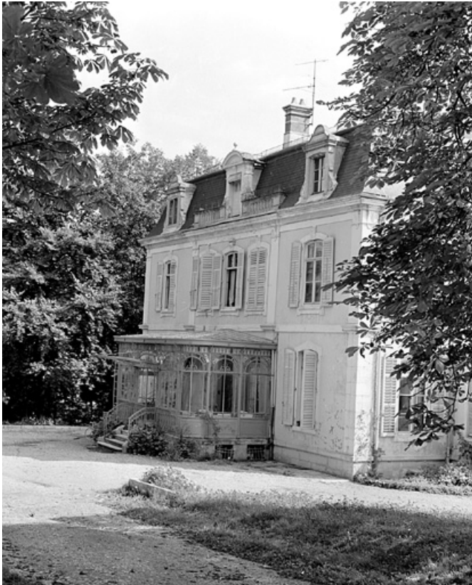
Façade nord vue de trois quarts droite en 1981. SRI. Enquête régionale sur les bâtiments industriels (1979-1981). 90, Beaucourt rue Sous les Vignes