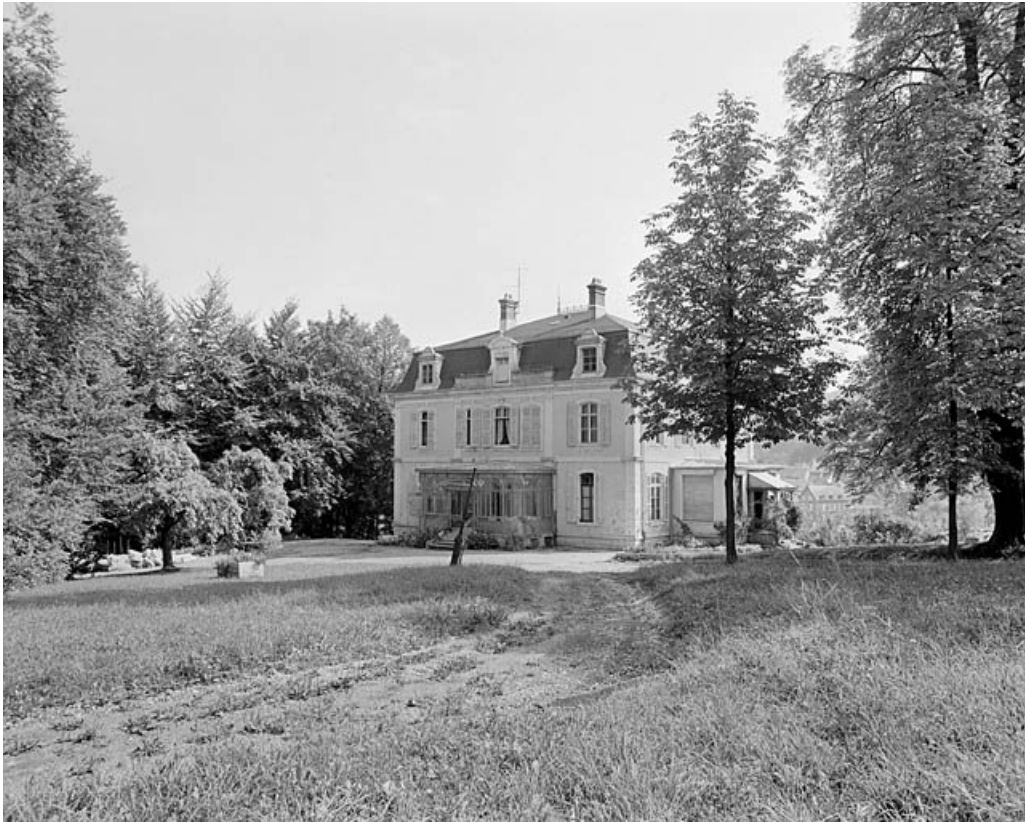
Vue d'ensemble depuis le nord-ouest en 1981. SRI. Enquête régionale sur les bâtiments industriels (1979-1981). 90, Beaucourt rue Sous les Vignes