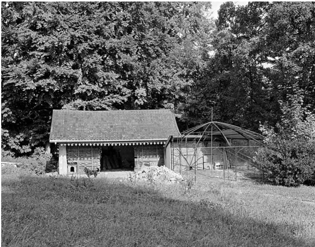
Bûcher et chenil en 1981. SRI. Enquête régionale sur les bâtiments industriels (1979-1981). 90, Beaucourt rue Sous les Vignes