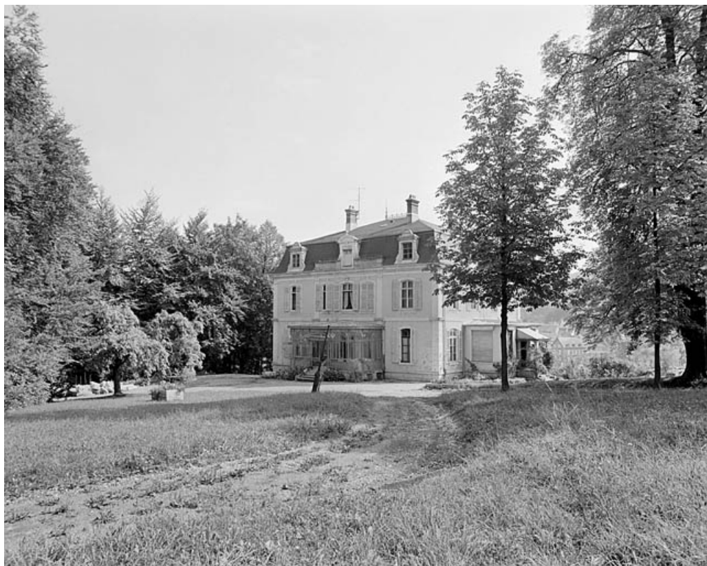
Vue d'ensemble depuis le nord-ouest en 1981. SRI. Enquête régionale sur les bâtiments industriels (1979-1981). 90, Beaucourt rue Sous les Vignes