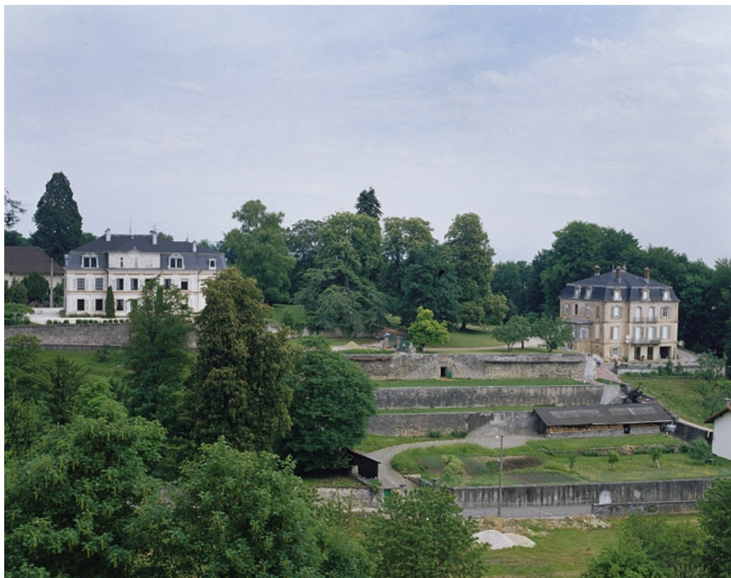
Vue d'ensemble depuis le sud (à droite). 90, Beaucourt rue Sous les Vignes