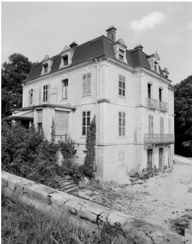
Façades ouest et sud en 1981. SRI. Enquête régionale sur les bâtiments industriels (1979-1981). 90, Beaucourt rue Sous les Vignes