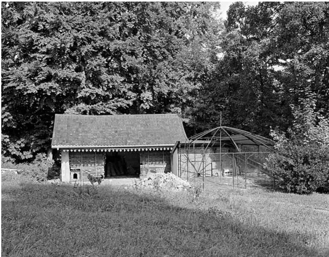
Bûcher et chenil en 1981. SRI. Enquête régionale sur les bâtiments industriels (1979-1981). 90, Beaucourt rue Sous les Vignes