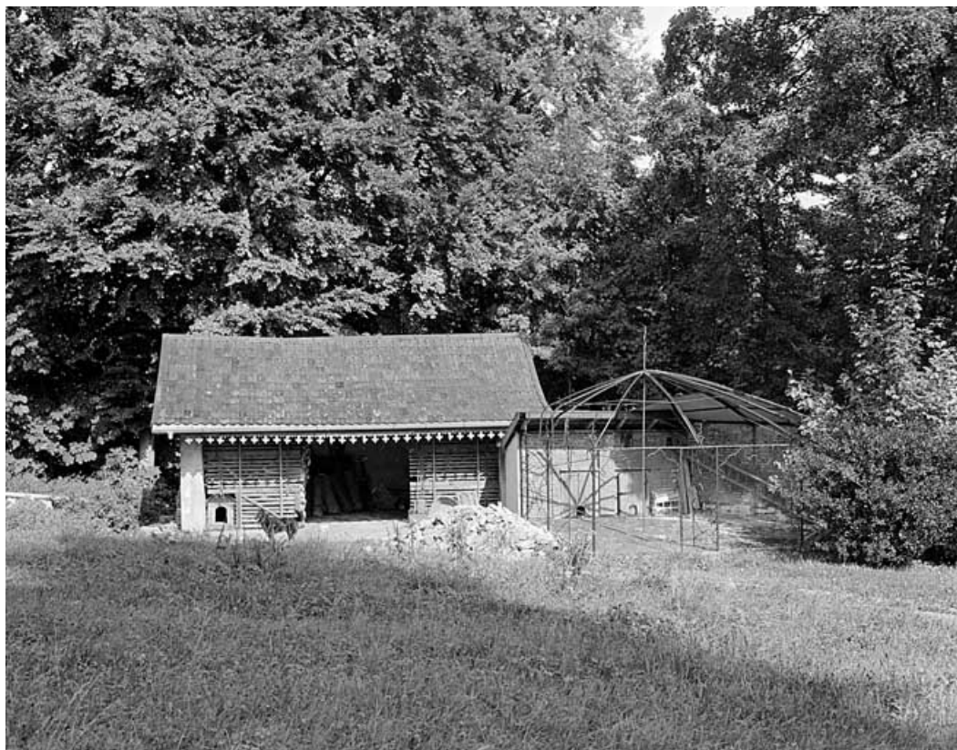
Bûcher et chenil en 1981. SRI. Enquête régionale sur les bâtiments industriels (1979-1981). 90, Beaucourt rue Sous les Vignes