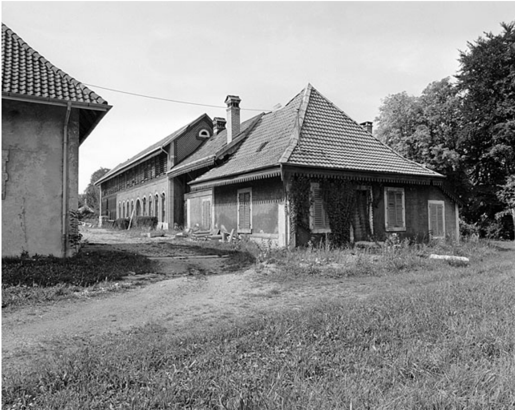
Vue de trois quarts de l'orangerie et du logement en 1981. SRI. Enquête régionale sur les bâtiments industriels (1979-1981). 90, Beaucourt rue Sous les Vignes