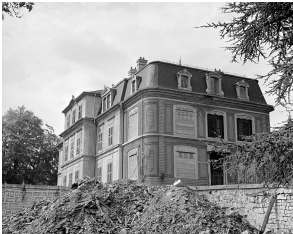
Façades sud et nord vues de trois quarts en 1981. SRI. Enquête régionale sur les bâtiments industriels (1979-1981). 90, Beaucourt rue Sous les Vignes