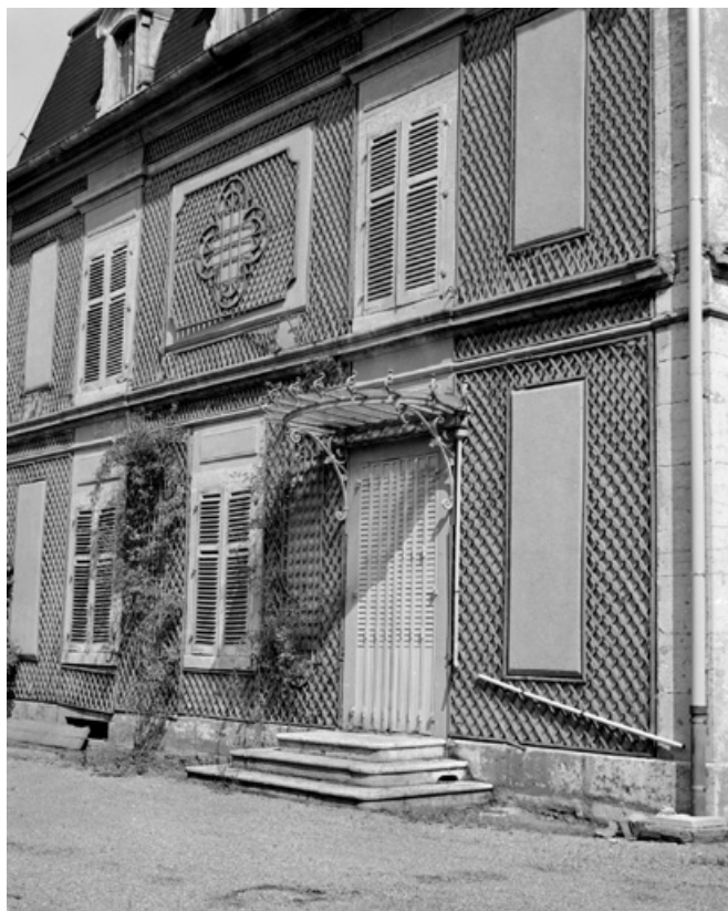
Détail de la façade ouest en 1981. SRI. Enquête régionale sur les bâtiments industriels (1979-1981). 90, Beaucourt rue Sous les Vignes