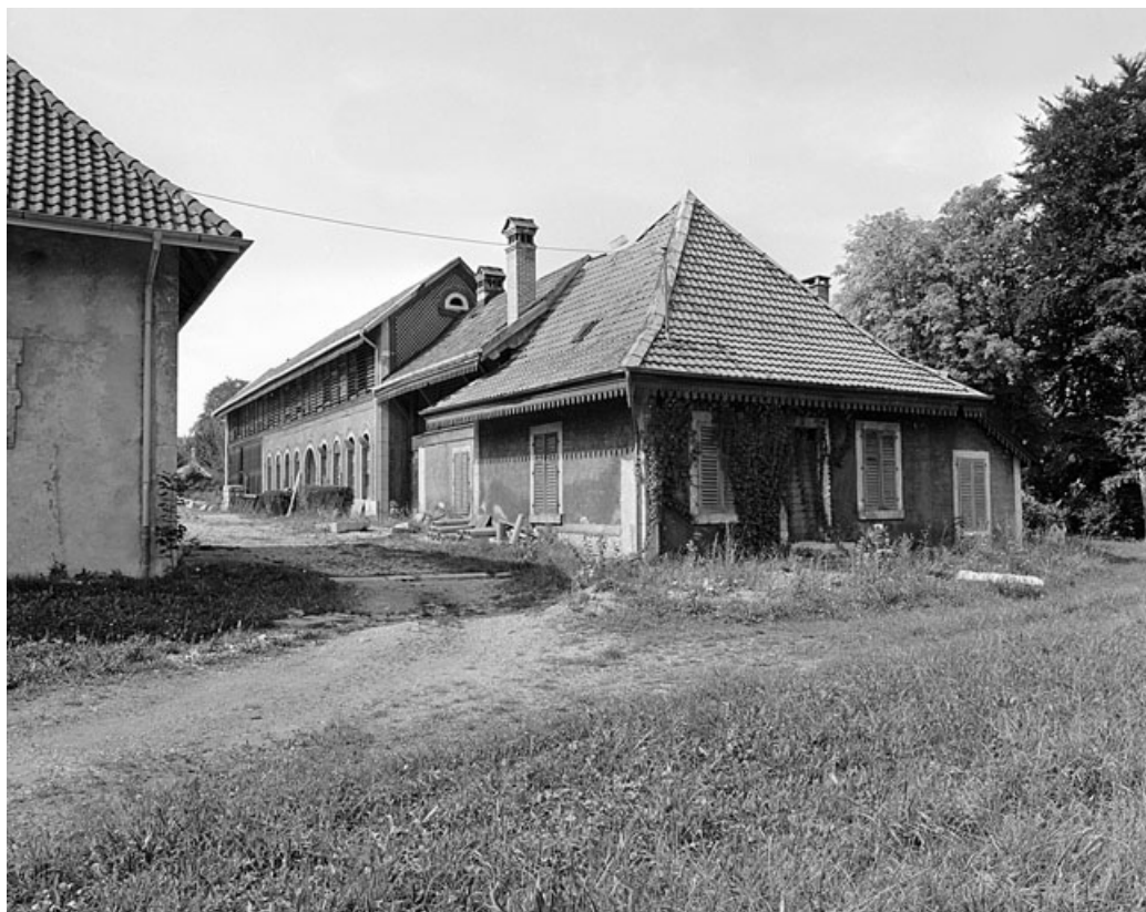
Vue de trois quarts de l'orangerie et du logement en 1981. SRI. Enquête régionale sur les bâtiments industriels (1979-1981). 90, Beaucourt rue Sous les Vignes