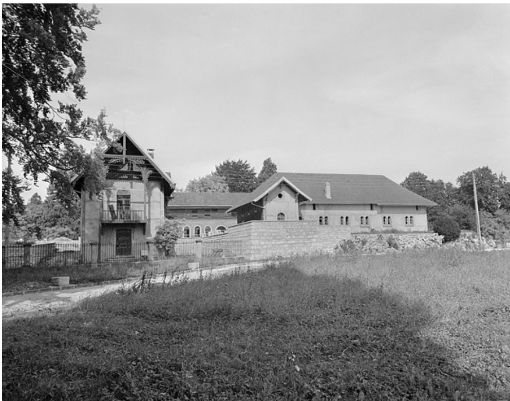
Bâtiments agricoles depuis le sud en 1981. SRI. Enquête régionale sur les bâtiments industriels (1979-1981). 90, Beaucourt rue Sous les Vignes