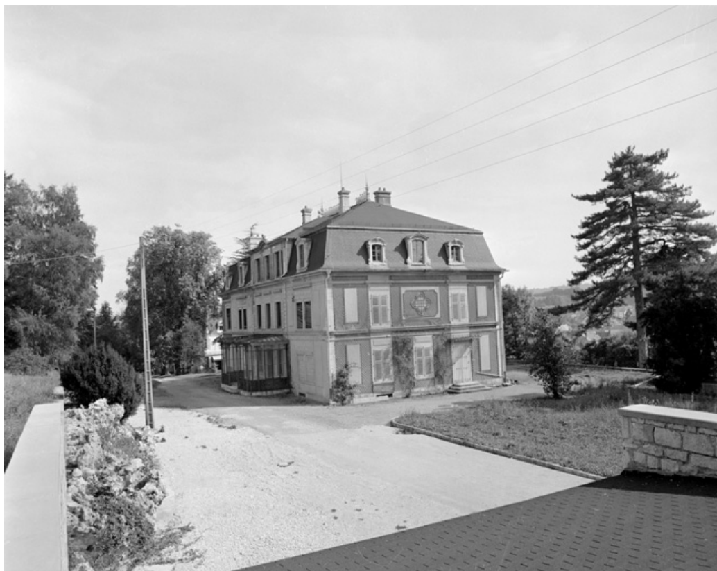
Vue de trois quarts arrière en 1981. SRI. Enquête régionale sur les bâtiments industriels (1979-1981). 90, Beaucourt rue Sous les Vignes