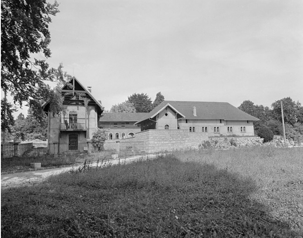
Bâtiments agricoles depuis le sud en 1981. SRI. Enquête régionale sur les bâtiments industriels (1979-1981). 90, Beaucourt rue Sous les Vignes