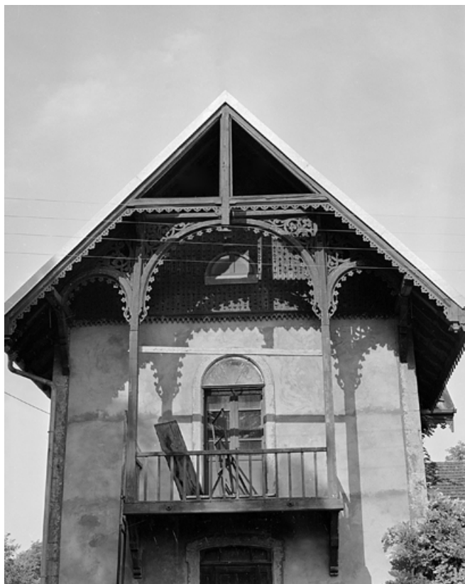
Détail du pignon de la conciergerie en 1981. SRI. Enquête régionale sur les bâtiments industriels (1979-1981). 90, Beaucourt rue Sous les Vignes