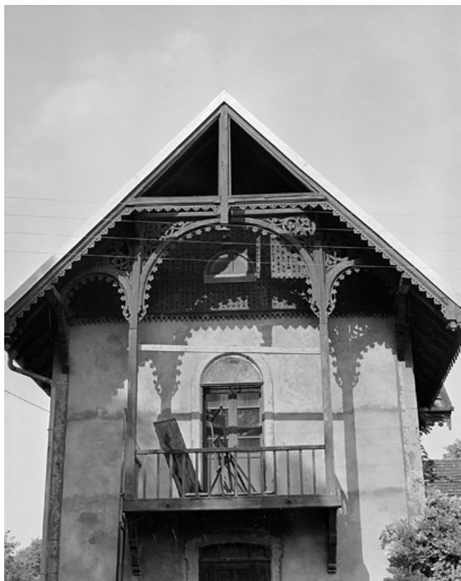
Détail du pignon de la conciergerie en 1981. SRI. Enquête régionale sur les bâtiments industriels (1979-1981). 90, Beaucourt rue Sous les Vignes