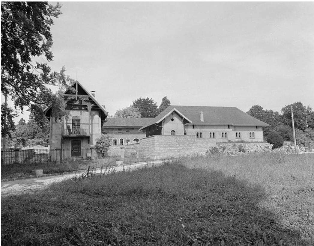
Bâtiments agricoles depuis le sud en 1981. 90, Beaucourt rue Sous les Vignes