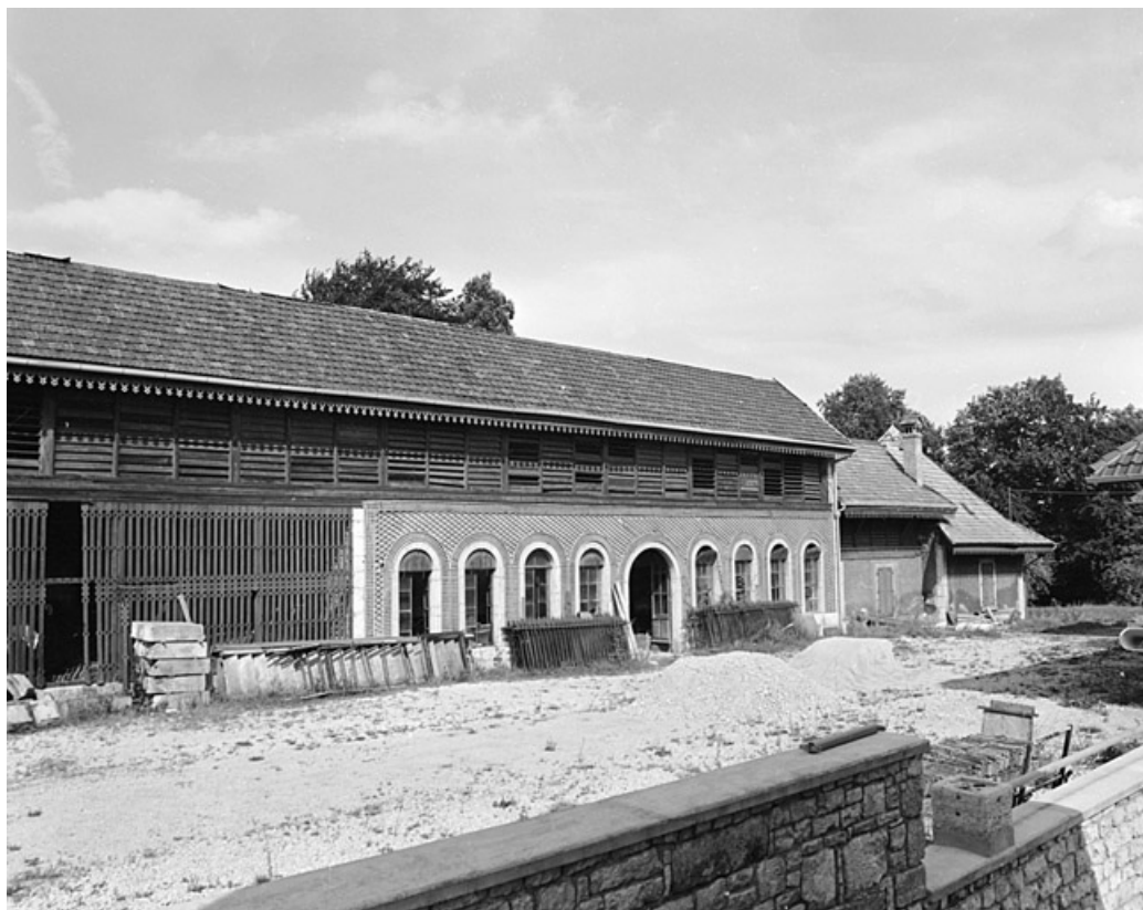
Façade sud de l'orangerie en 1981. SRI. Enquête régionale sur les bâtiments industriels (1979-1981). 90, Beaucourt rue Sous les Vignes