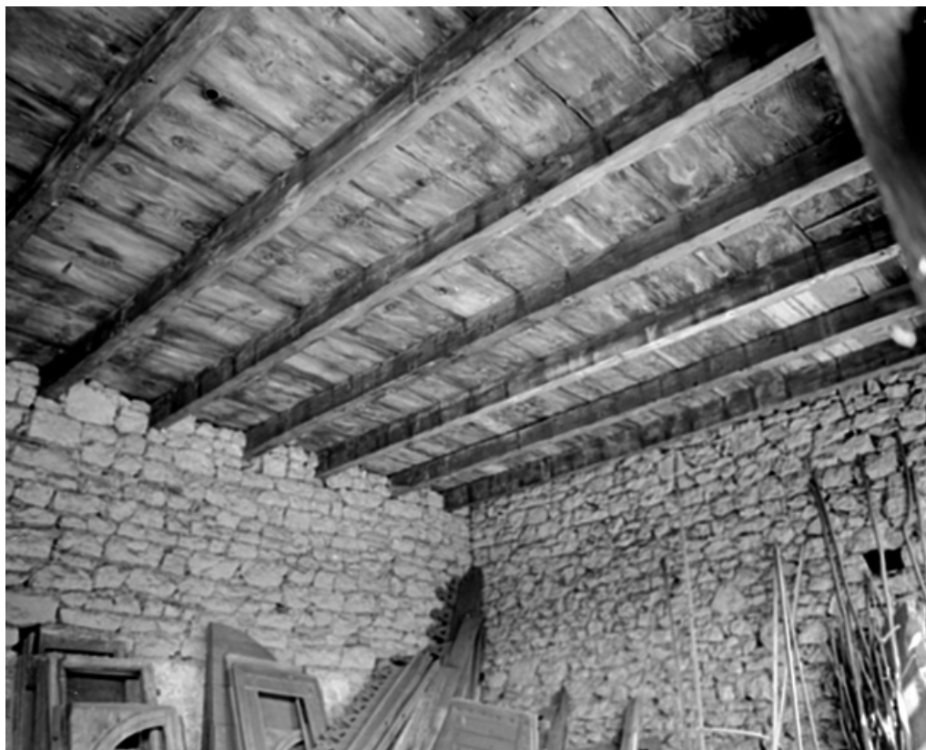
Intérieur de l'orangerie en 1981. 90, Beaucourt rue Sous les Vignes