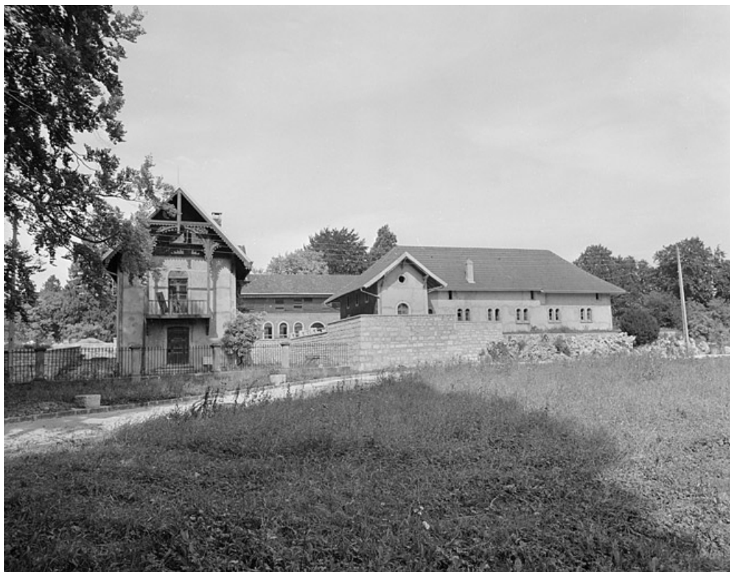
Bâtiments agricoles depuis le sud en 1981. SRI. Enquête régionale sur les bâtiments industriels (1979-1981). 90, Beaucourt rue Sous les Vignes