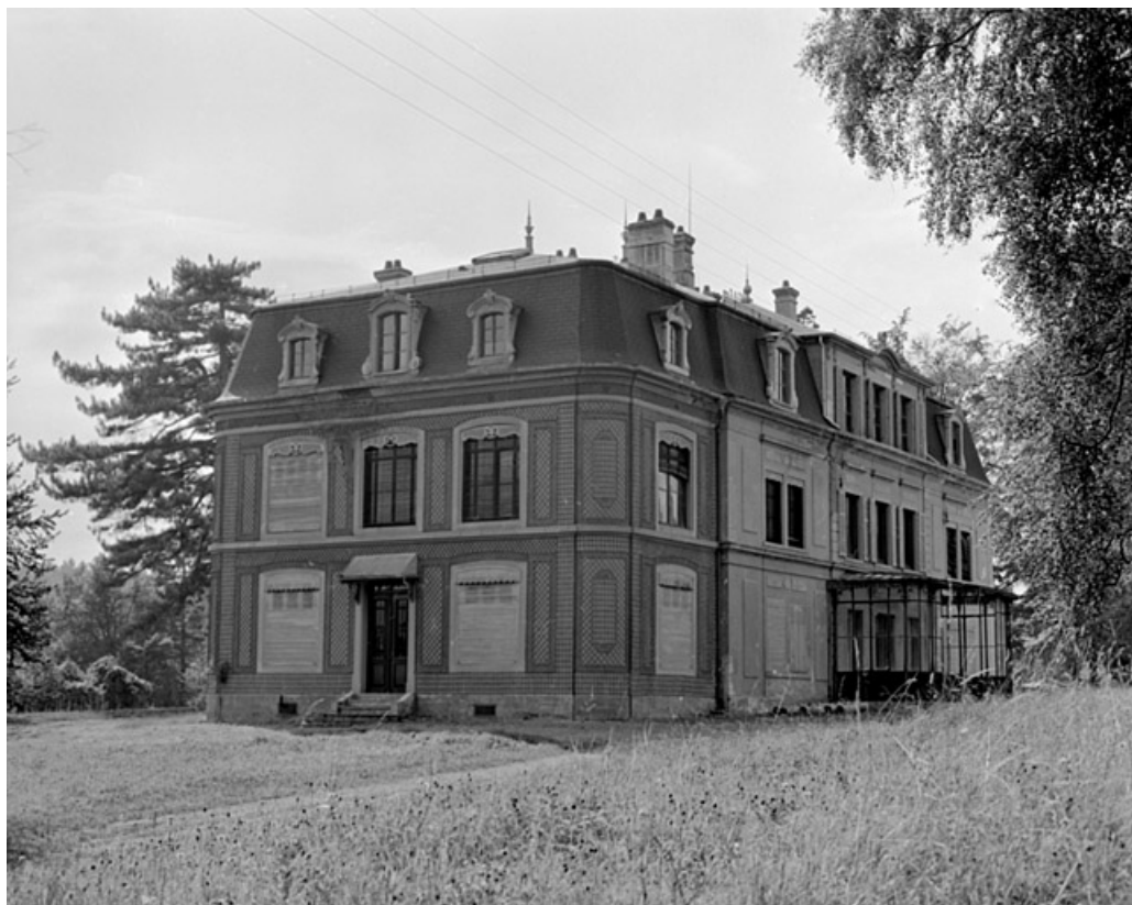
Façades est et nord vues de trois quarts en 1981. SRI. Enquête régionale sur les bâtiments industriels (1979-1981). 90, Beaucourt rue Sous les Vignes