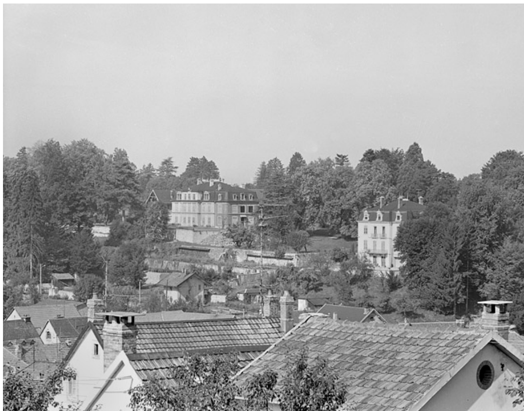
Vue d'ensemble depuis le sud-est (à gauche) en 1981. SRI. Enquête régionale sur les bâtiments industriels (1979-1981). 90, Beaucourt