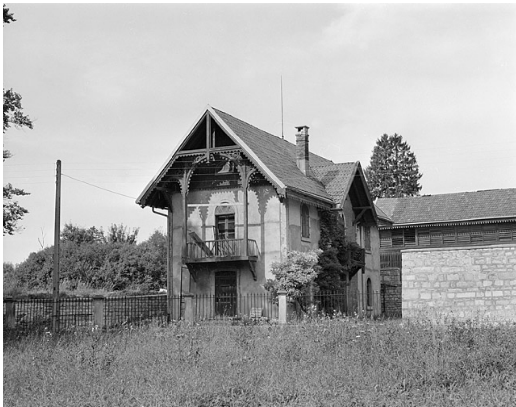
La conciergerie depuis le sud en 1981. SRI. Enquête régionale sur les bâtiments industriels (1979-1981). 90, Beaucourt rue Sous les Vignes