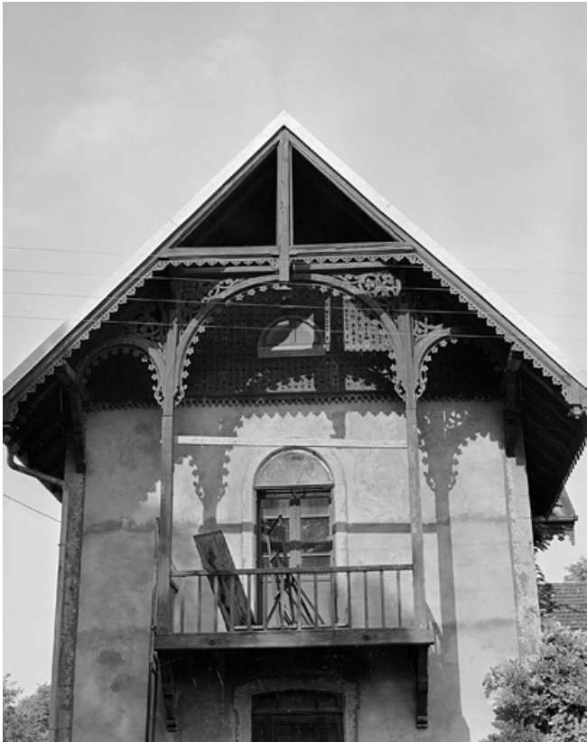
Détail du pignon de la conciergerie en 1981. SRI. Enquête régionale sur les bâtiments industriels (1979-1981). 90, Beaucourt rue Sous les Vignes