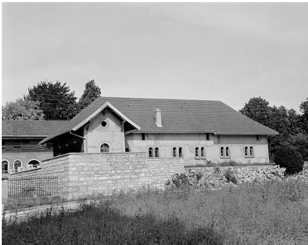
Façade sud des écuries en 1981. SRI. Enquête régionale sur les bâtiments industriels (1979-1981). 90, Beaucourt rue Sous les Vignes