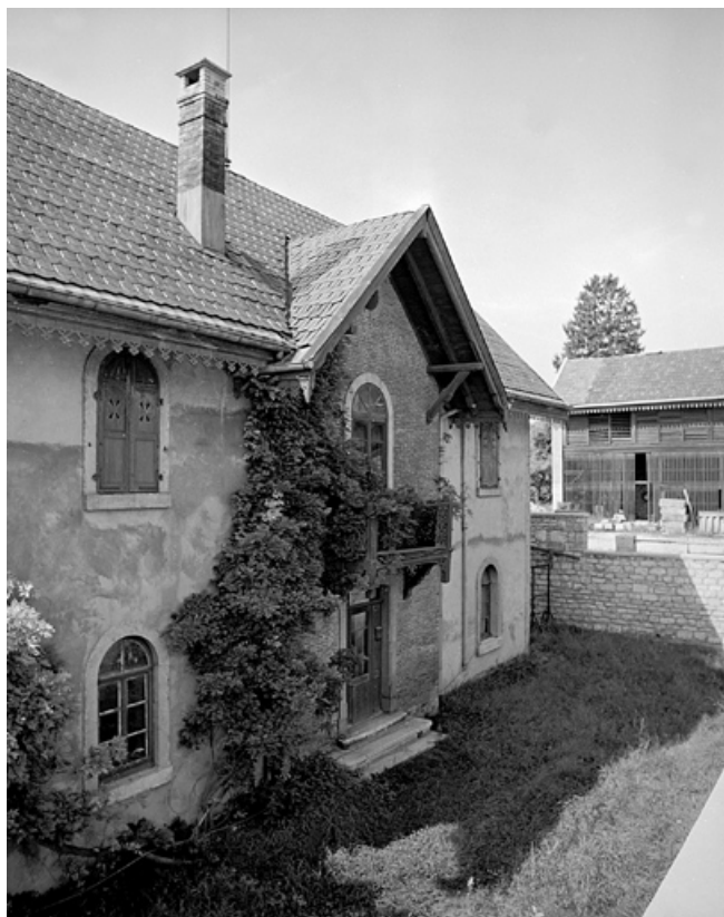
Façade est de la conciergerie en 1981. SRI. Enquête régionale sur les bâtiments industriels (1979-1981). 90, Beaucourt rue Sous les Vignes