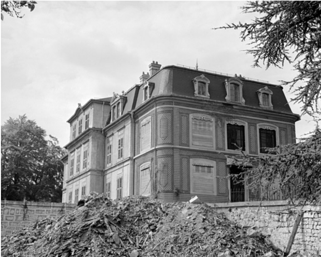
Façades sud et nord vues de trois quarts en 1981. SRI. Enquête régionale sur les bâtiments industriels (1979-1981). 90, Beaucourt rue Sous les Vignes