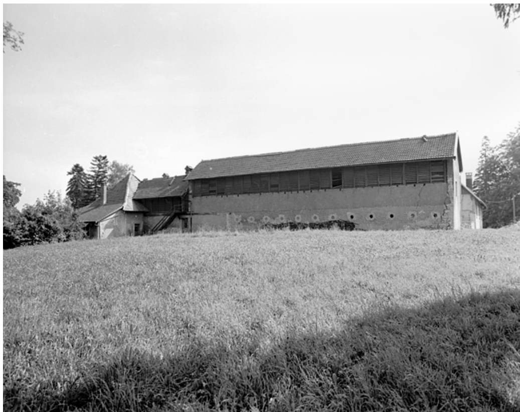
Façade nord de l'orangerie en 1981. SRI. Enquête régionale sur les bâtiments industriels (1979-1981). 90, Beaucourt rue Sous les Vignes