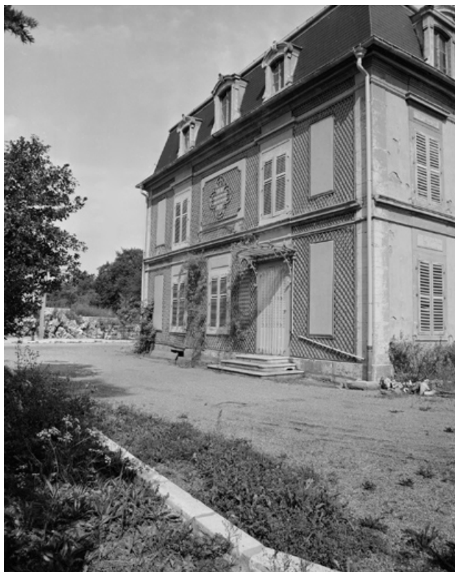
Façade ouest vue de trois quarts en 1981. SRI. Enquête régionale sur les bâtiments industriels (1979-1981). 90, Beaucourt rue Sous les Vignes