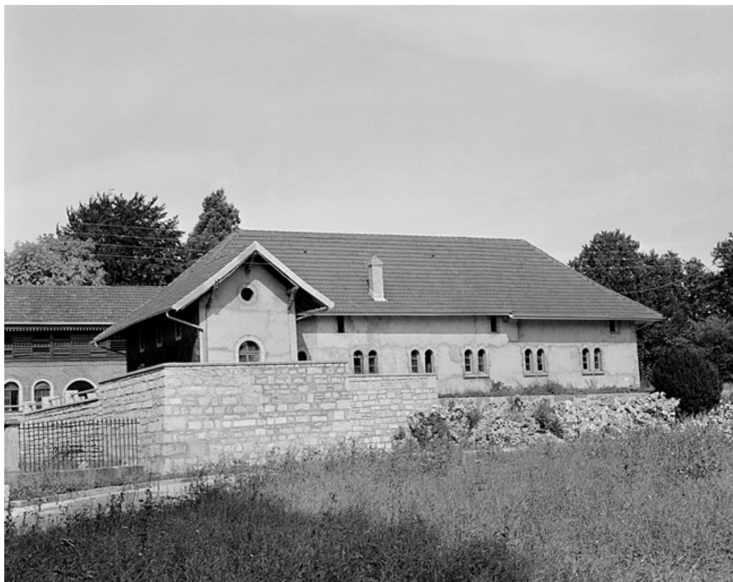
Façade sud des écuries en 1981. SRI. Enquête régionale sur les bâtiments industriels (1979-1981). 90, Beaucourt rue Sous les Vignes