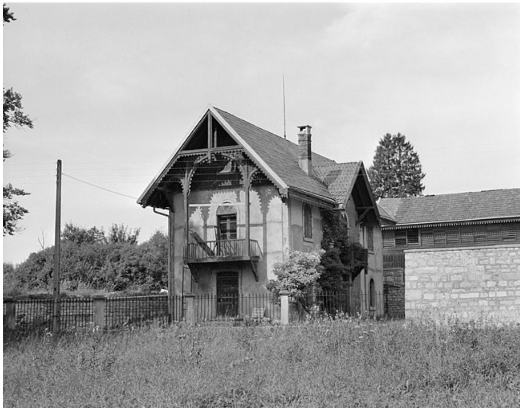
La conciergerie depuis le sud en 1981. SRI. Enquête régionale sur les bâtiments industriels (1979-1981). 90, Beaucourt rue Sous les Vignes