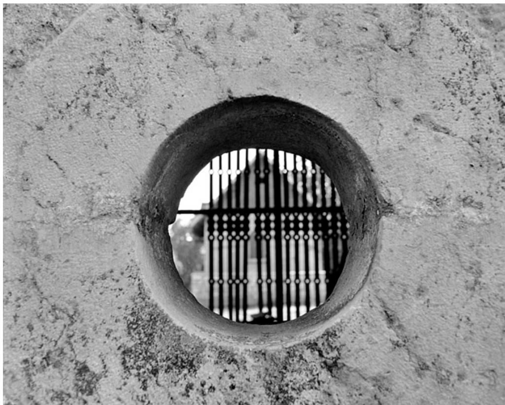
L'orangerie en 1981. Détail d'une baie d'aération. SRI. Enquête régionale sur les bâtiments industriels (1979-1981). 90, Beaucourt rue Sous les Vignes