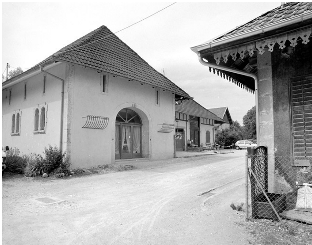
Vue de trois quarts du bâtiment à usage agricole (étable, fenil).