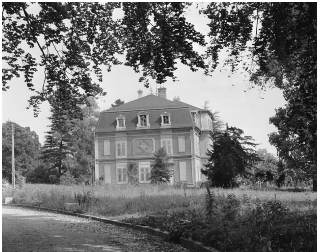
Façade ouest en 1981. SRI. Enquête régionale sur les bâtiments industriels (1979-1981). 90, Beaucourt rue Sous les Vignes