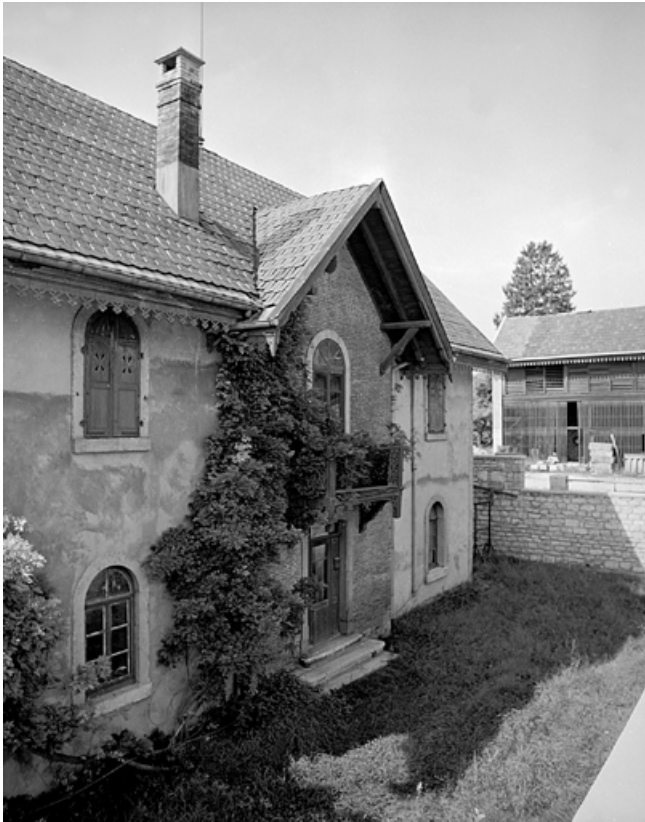
Façade est de la conciergerie en 1981. SRI. Enquête régionale sur les bâtiments industriels (1979-1981). 90, Beaucourt rue Sous les Vignes