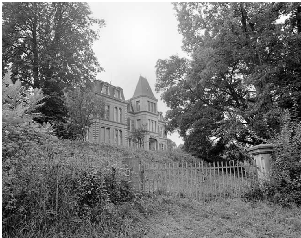
Façade postérieure en 1981. SRI. Enquête régionale sur les bâtiments industriels (1979-1981). 90, Beaucourt avenue des Vignes