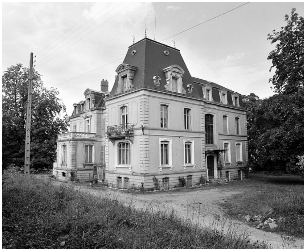
Vue de trois quarts en 1981. SRI. Enquête régionale sur les bâtiments industriels (1979-1981). 90, Beaucourt avenue des Vignes