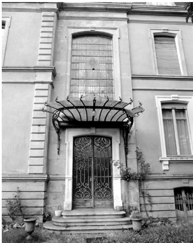
Façade est : détail de la porte en 1981. SRI. Enquête régionale sur les bâtiments industriels (1979-1981). 90, Beaucourt avenue des Vignes