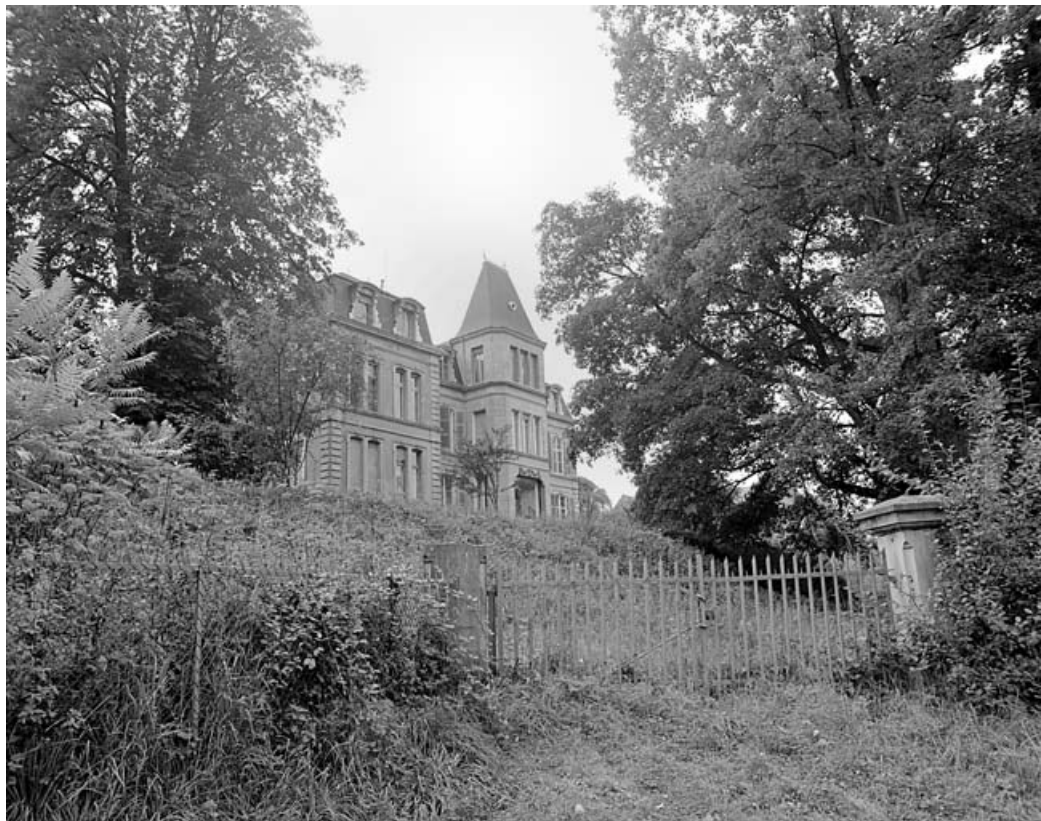
Façade postérieure en 1981. SRI. Enquête régionale sur les bâtiments industriels (1979-1981). 90, Beaucourt avenue des Vignes