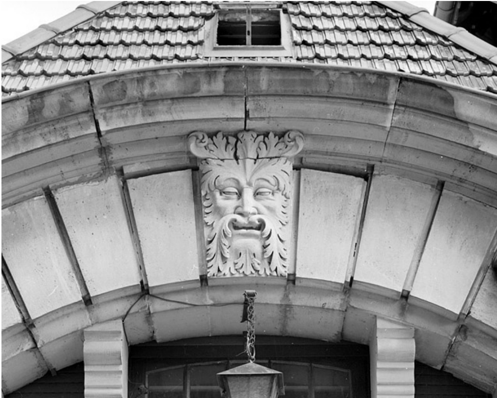
Conciergerie. Détail du mascaron sur la façade ouest.