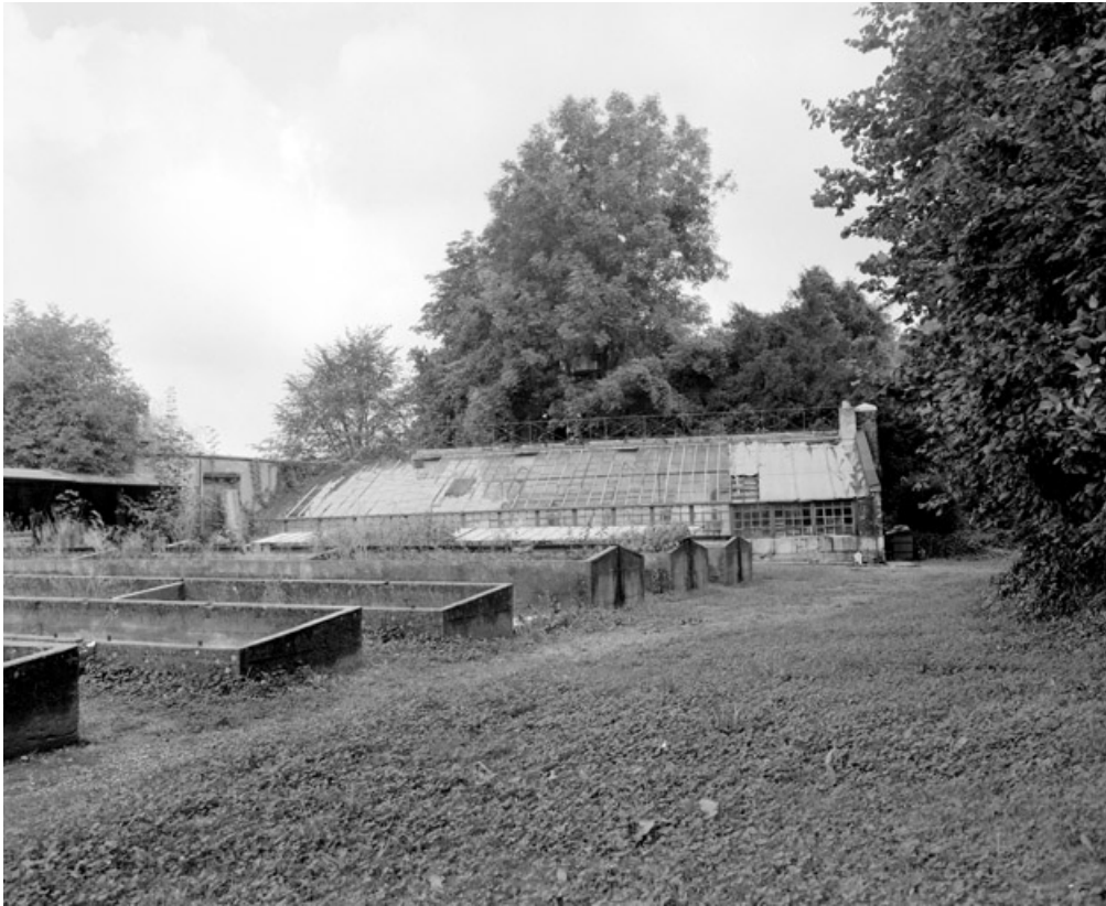
Serres situées dans les jardins du château en 1981. SRI. Enquête régionale sur les bâtiments industriels (1979-1981). 90, Beaucourt parc des Cèdres