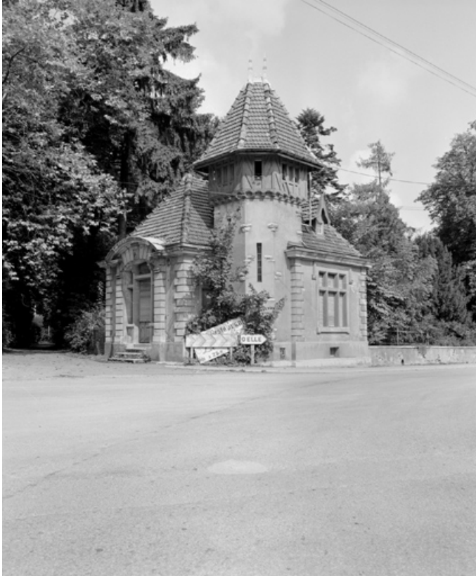
Conciergerie en 1981. SRI. Enquête régionale sur les bâtiments industriels (1979-1981). 90, Beaucourt parc des Cèdres