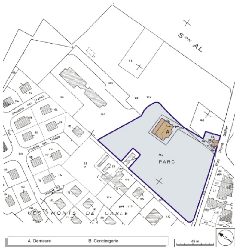
Plan-masse et de situation. Extrait du plan cadastral, 1984, section AM, 1:2000 agrandi à 1:1500. 90, Beaucourt parc des Cèdres