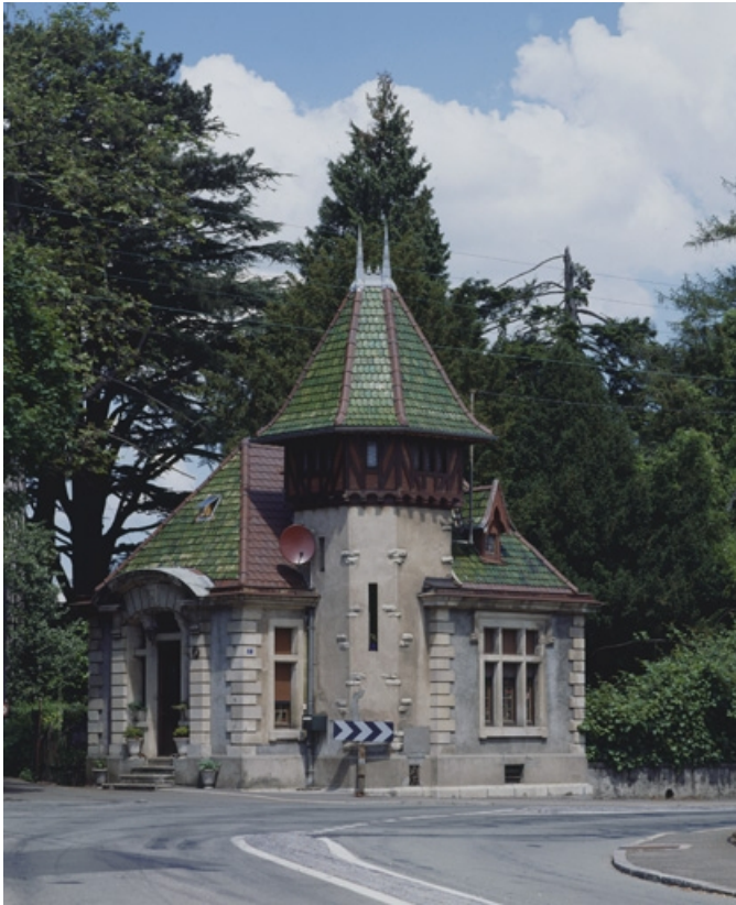
La conciergerie depuis le sud-ouest.