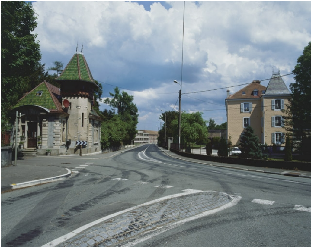
Vue d'ensemble de la conciergerie (à gauche).