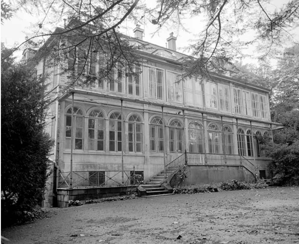
Façade nord en 1981. SRI. Enquête régionale sur les bâtiments industriels (1979-1981). 90, Beaucourt parc des Cèdres