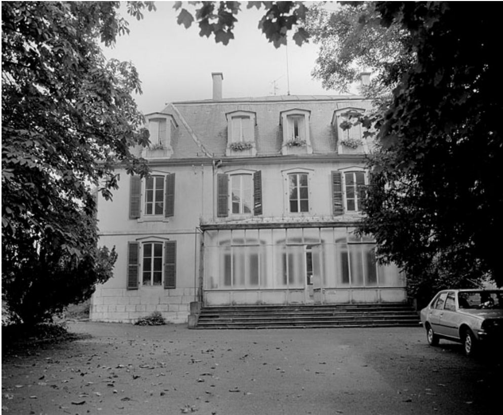
Façade sud en 1981. SRI. Enquête régionale sur les bâtiments industriels (1979-1981). 90, Beaucourt parc des Cèdres