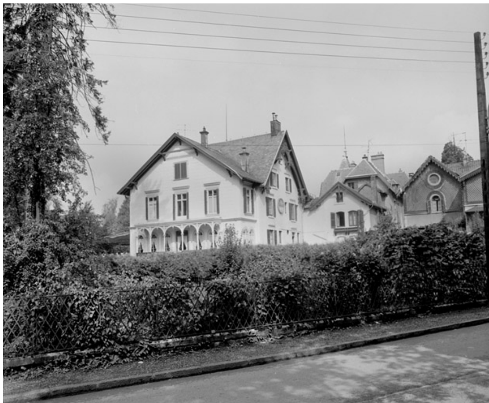
Vue depuis la rue Pierre Sellier en 1981. SRI. Enquête régionale sur les bâtiments industriels (1979-1981). 90, Beaucourt, 1, 3 rue du Mont de Dasle