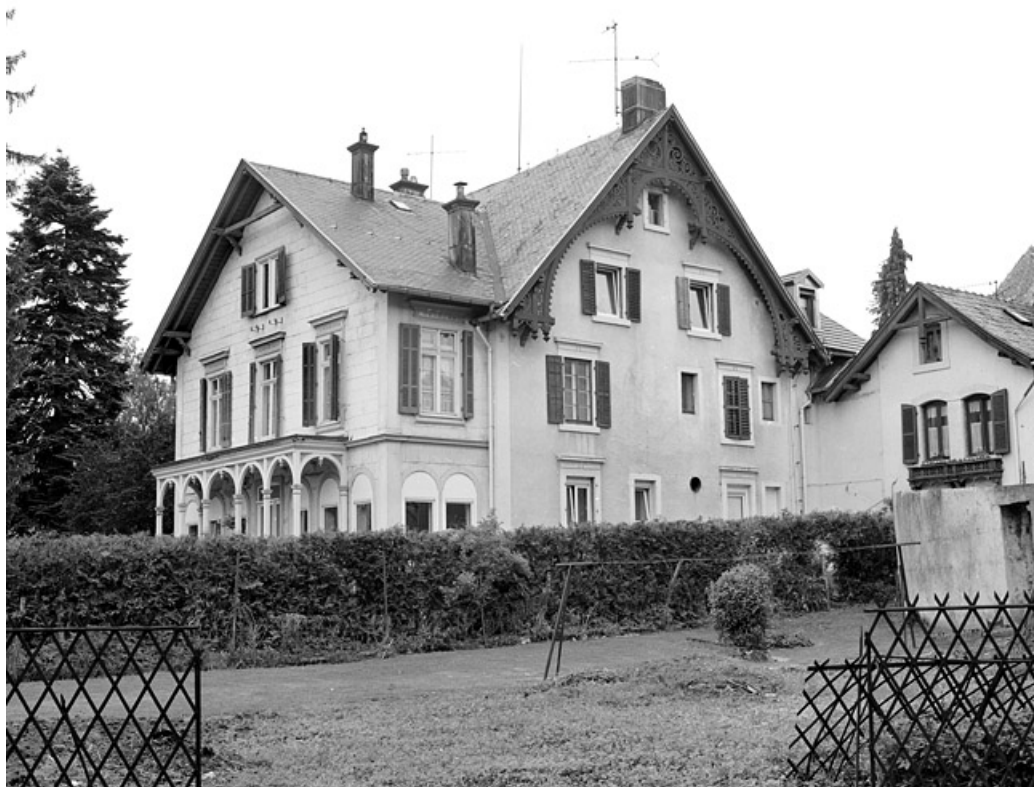
Façade orientale du logement principal.

90, Beaucourt, 1, 3 rue du Mont de Dasle