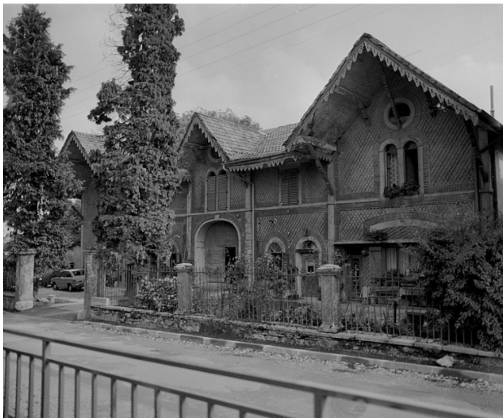
Façade sur rue de la ferme en 1981. SRI. Enquête régionale sur les bâtiments industriels (1979-1981). 90, Beaucourt, 1, 3 rue du Mont de Dasle