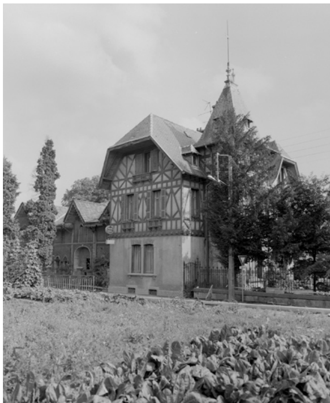
Vue de trois quarts de l'adjonction de la fin du 19e siècle (en 1981). SRI. Enquête régionale sur les bâtiments industriels (1979-1981).

90, Beaucourt, 1, 3 rue du Mont de Dasle