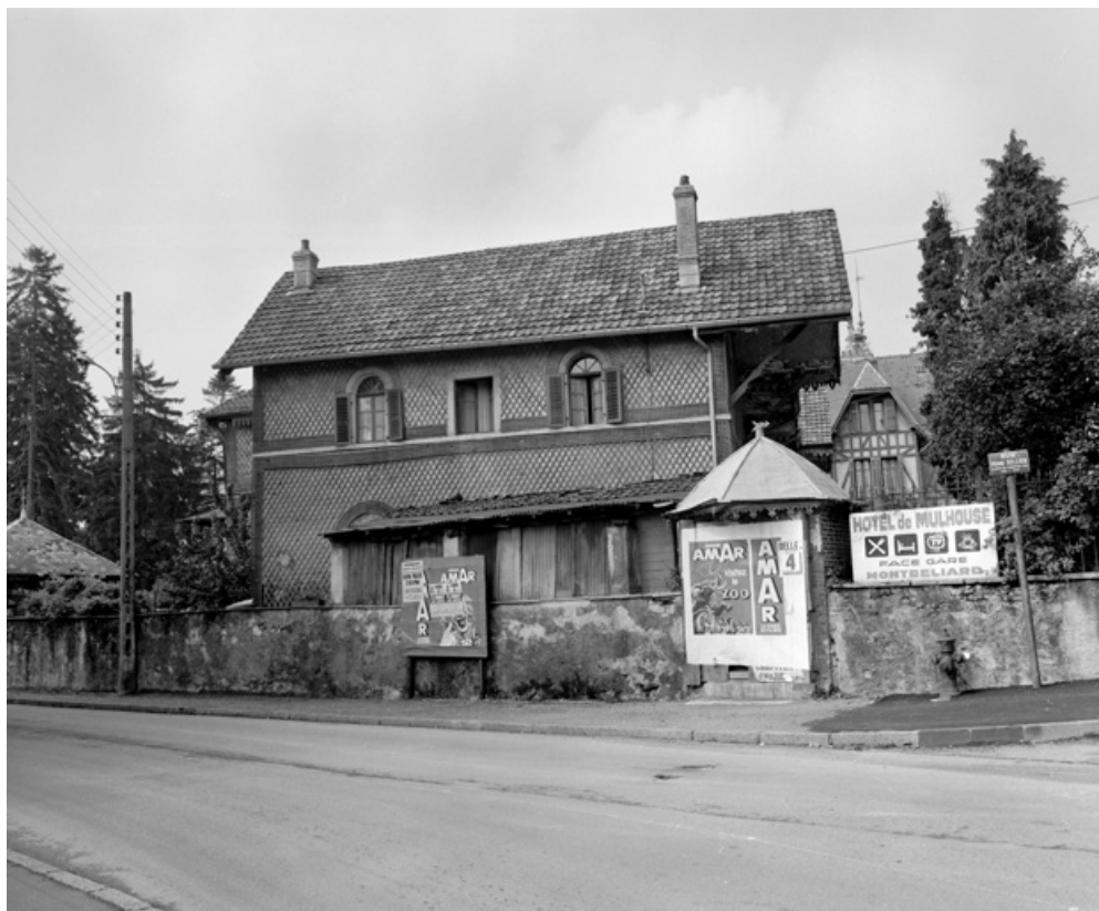
Façade est de la ferme en 1981. SRI. Enquête régionale sur les bâtiments industriels (1979-1981). 90, Beaucourt, 1, 3 rue du Mont de Dasle