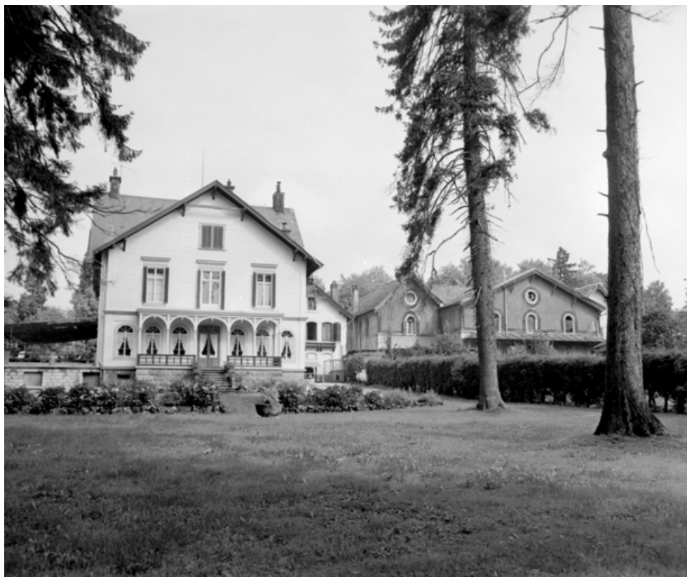
Vue d'ensemble depuis le sud en 1981. SRI. Enquête régionale sur les bâtiments industriels (1979-1981). 90, Beaucourt, 1, 3 rue du Mont de Dasle