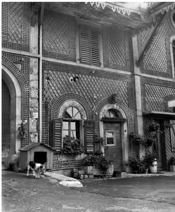
Façade antérieure de la ferme : partie centrale (logement) en 1981. SRI. Enquête régionale sur les bâtiments industriels (1979-1981). 90, Beaucourt, 1, 3 rue du Mont de Dasle