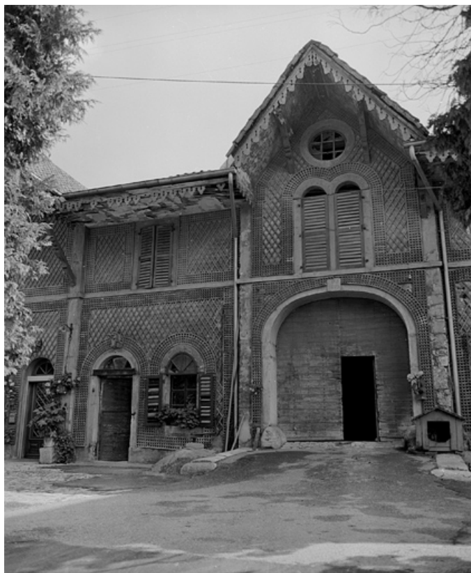
Façade antérieure de la ferme : entrée de grange et d'écurie en 1981. SRI. Enquête régionale sur les bâtiments industriels (1979-1981).

90, Beaucourt, 1, 3 rue du Mont de Dasle