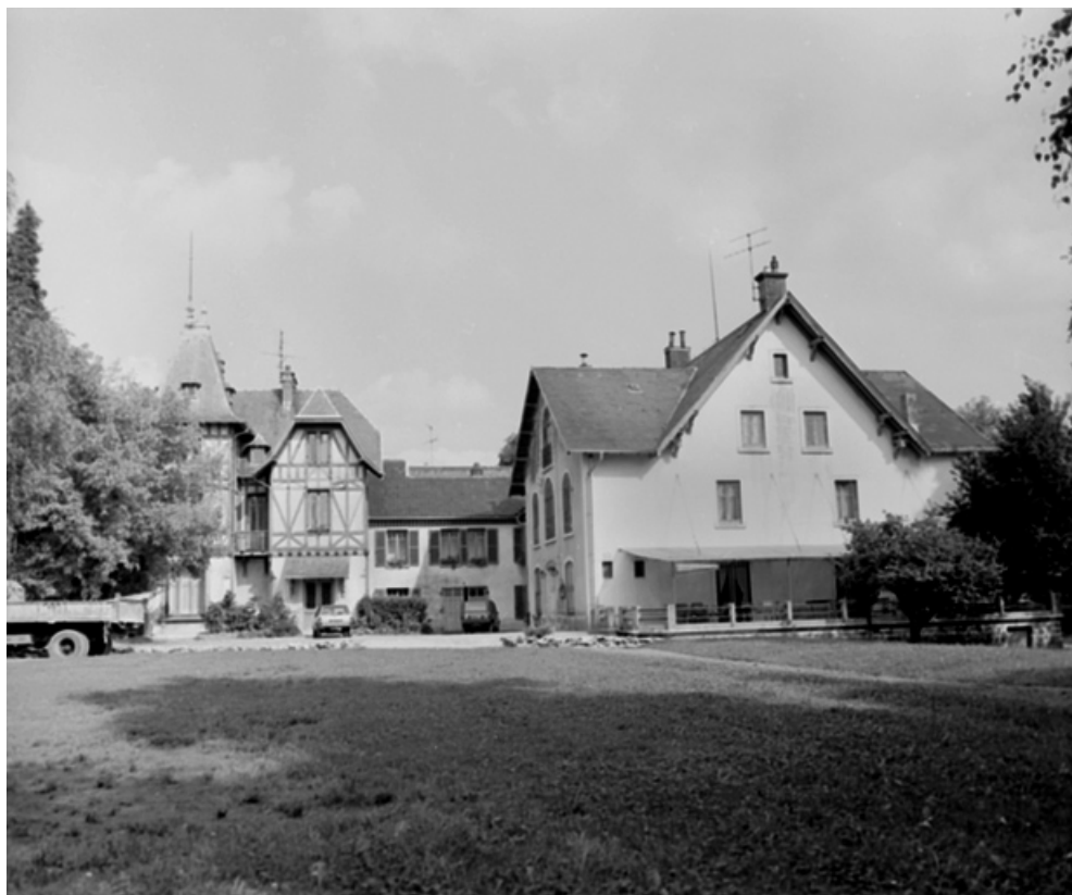
Vue d'ensemble depuis l'ouest en 1981. SRI. Enquête régionale sur les bâtiments industriels (1979-1981). 90, Beaucourt, 1, 3 rue du Mont de Dasle