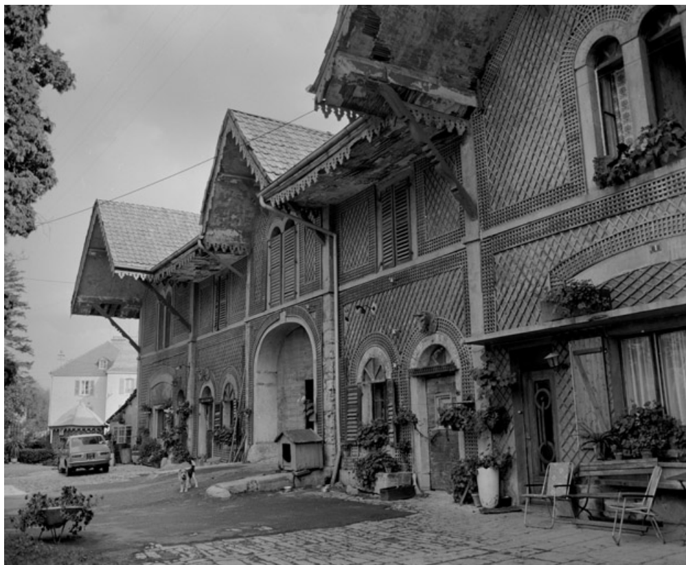
Vue de trois quarts de la façade de la ferme en 1981. SRI. Enquête régionale sur les bâtiments industriels (1979-1981). 90, Beaucourt, 1, 3 rue du Mont de Dasle