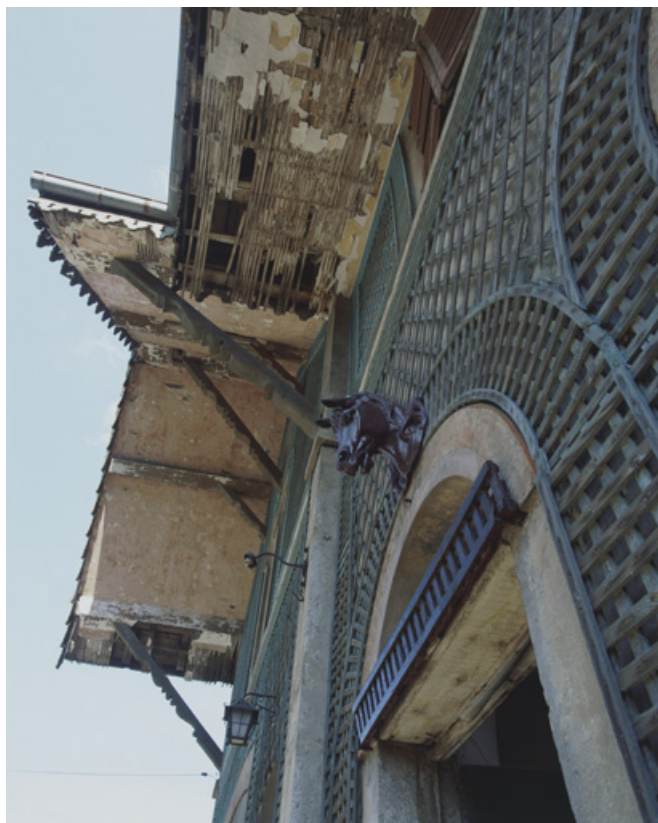
Façade antérieure de la ferme. Détail du décor.

90, Beaucourt, 1, 3 rue du Mont de Dasle