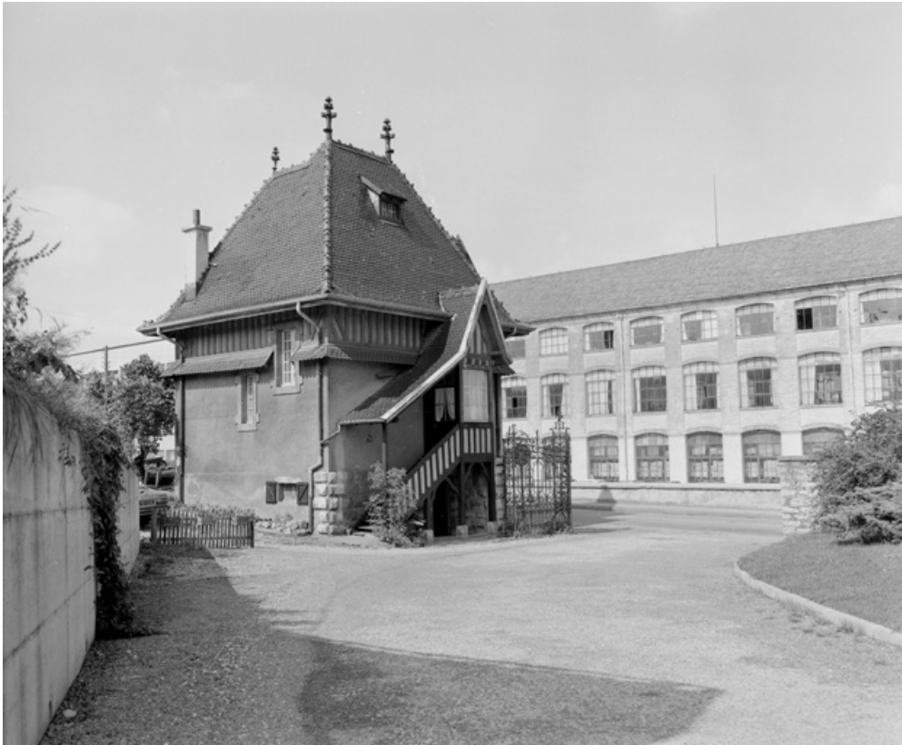
Conciergerie. Vue depuis le sud-est en 1981. SRI. Enquête régionale sur les bâtiments industriels (1979-1981). 90, Beaucourt, 7 rue Frédéric Japy