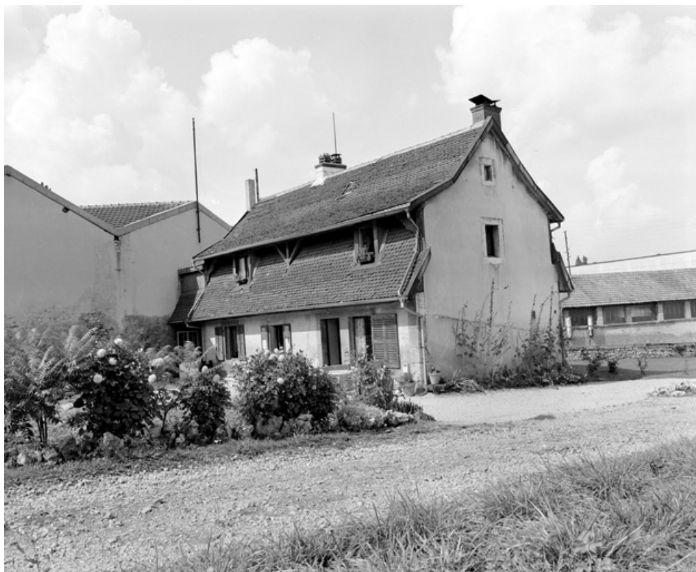
Logement du jardinier. Façade postérieure en 1981. SRI. Enquête régionale sur les bâtiments industriels (1979-1981). 90, Beaucourt, 7 rue Frédéric Japy