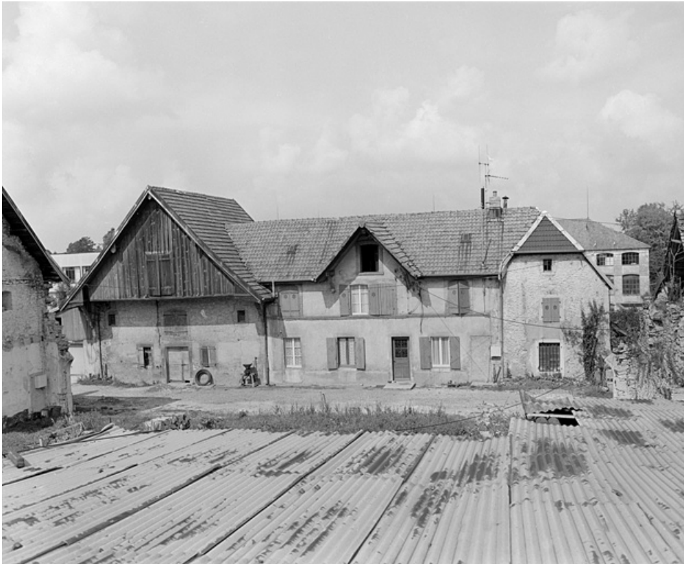
Dépendances : ferme des Grandes Planches. Façade postérieure en 1981. SRI. Enquête régionale sur les bâtiments industriels (1979-1981).