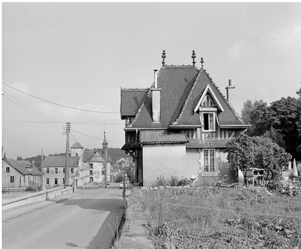
Conciergerie. Façade ouest en 1981. SRI. Enquête régionale sur les bâtiments industriels (1979-1981). 90, Beaucourt, 7 rue Frédéric Japy