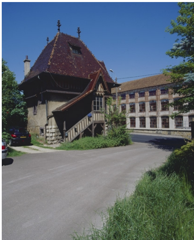
Vue de trois quarts de la conciergerie.