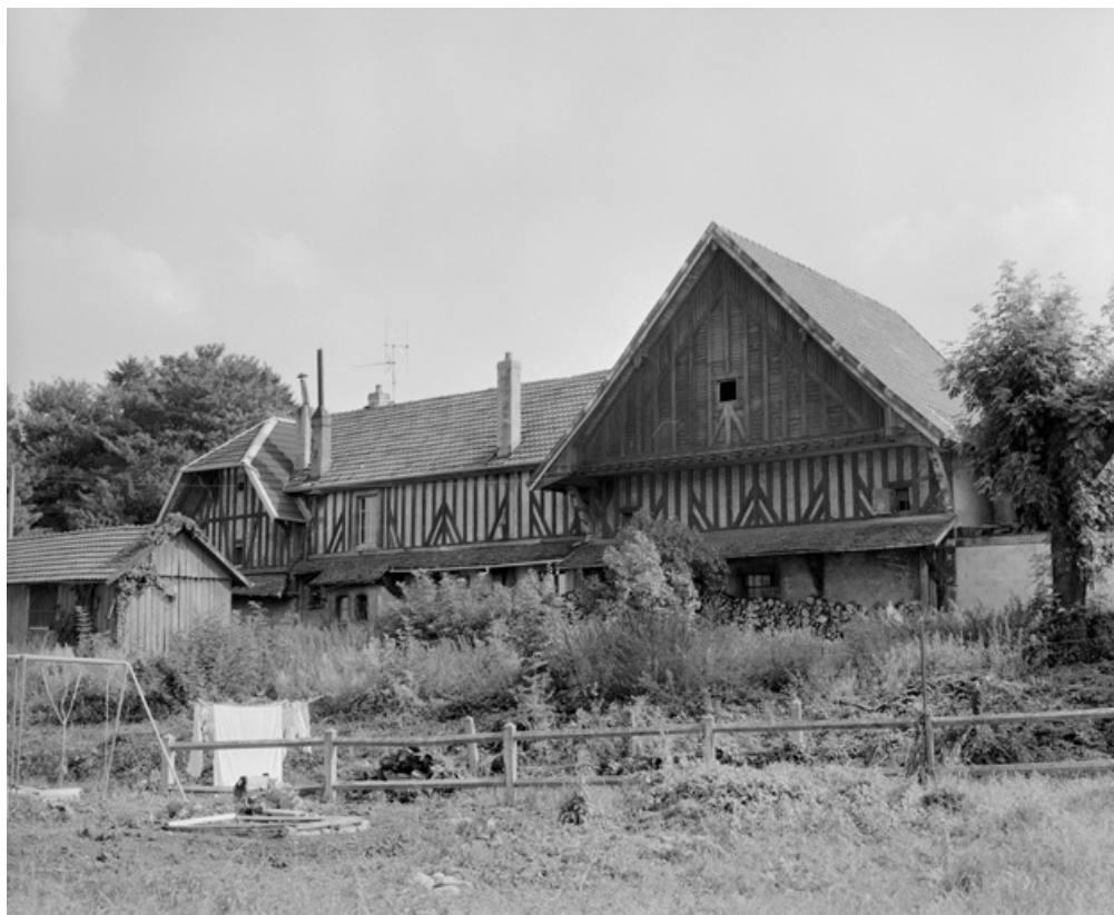
Dépendances : ferme des Grandes Planches. Façade antérieure en 1981. SRI. Enquête régionale sur les bâtiments industriels (1979-1981).