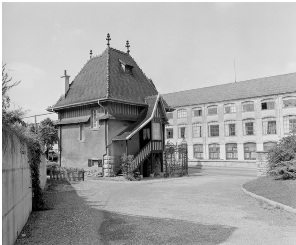
Conciergerie. Vue depuis le sud-est en 1981. SRI. Enquête régionale sur les bâtiments industriels (1979-1981). 90, Beaucourt, 7 rue Frédéric Japy