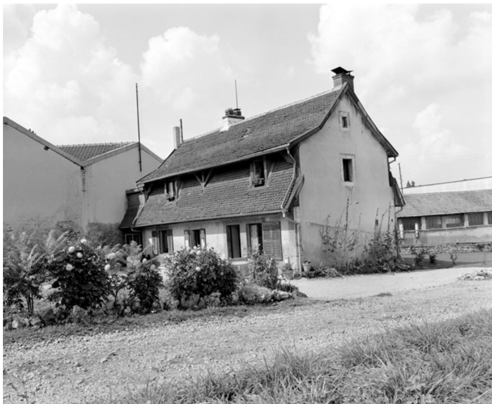
Logement du jardinier. Façade postérieure en 1981. SRI. Enquête régionale sur les bâtiments industriels (1979-1981). 90, Beaucourt, 7 rue Frédéric Japy