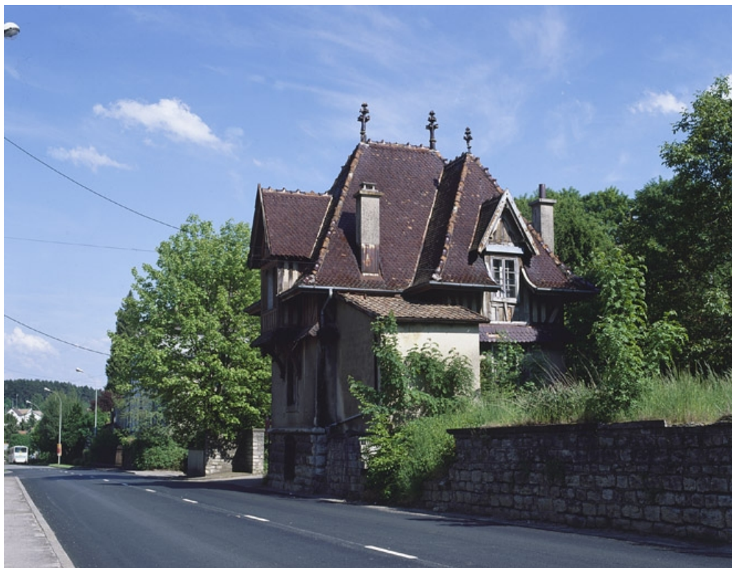
La conciergerie depuis l'ouest. 90, Beaucourt, 7 rue Frédéric Japy