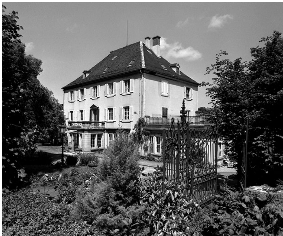
Vue de trois quarts depuis le sud-est.