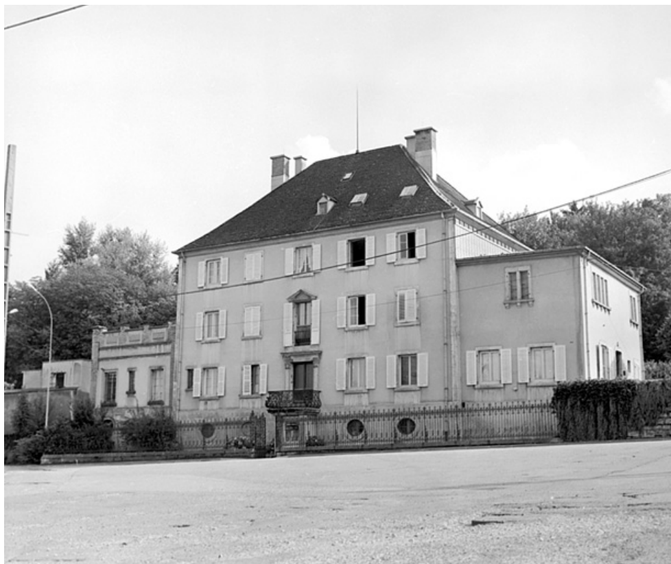
Façade sur rue en 1981. SRI. Enquête régionale sur les bâtiments industriels (1979-1981). 90, Beaucourt, 7 rue Frédéric Japy