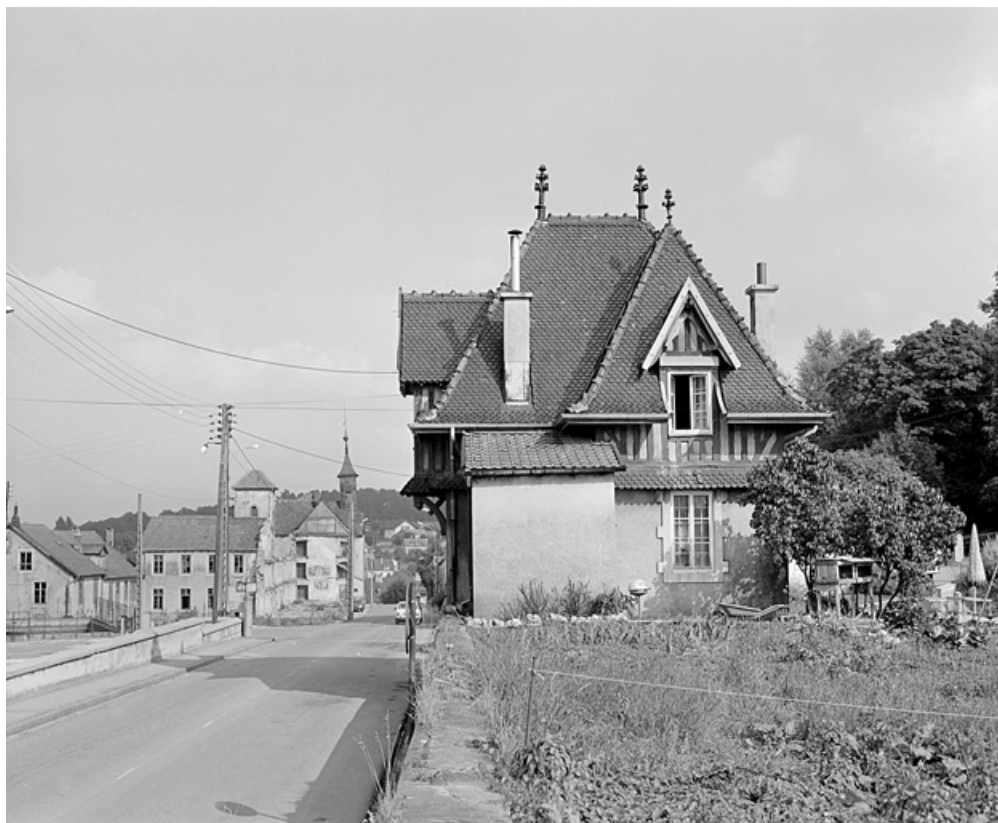
Conciergerie. Façade ouest en 1981. SRI. Enquête régionale sur les bâtiments industriels (1979-1981). 90, Beaucourt, 7 rue Frédéric Japy