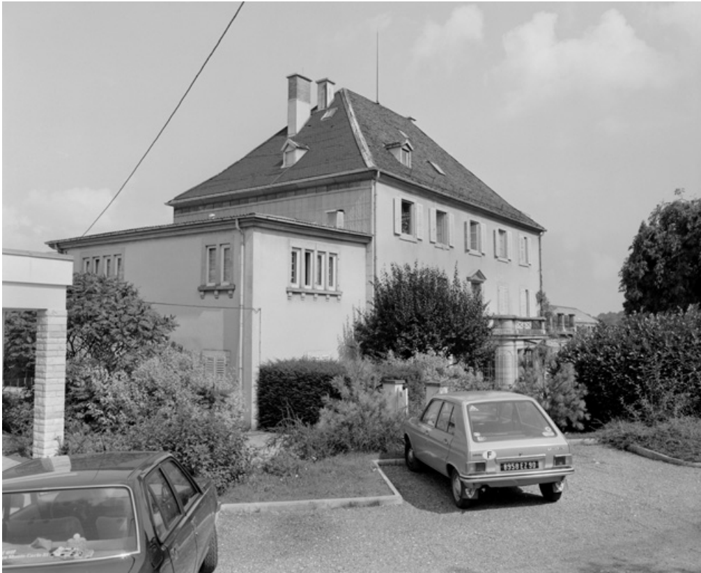
Façade postérieure en 1981. SRI. Enquête régionale sur les bâtiments industriels (1979-1981). 90, Beaucourt, 7 rue Frédéric Japy