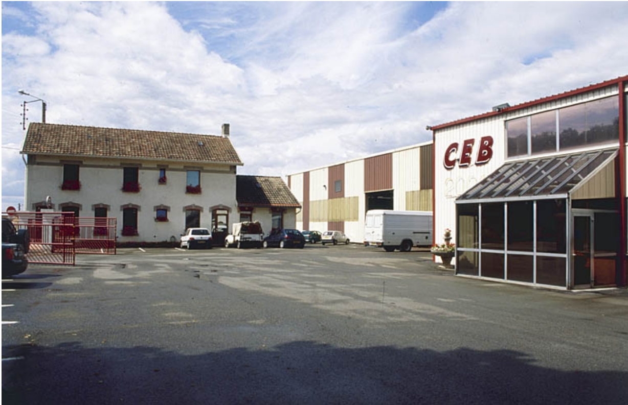
Conciergerie et façade antérieure des ateliers de fabrication.