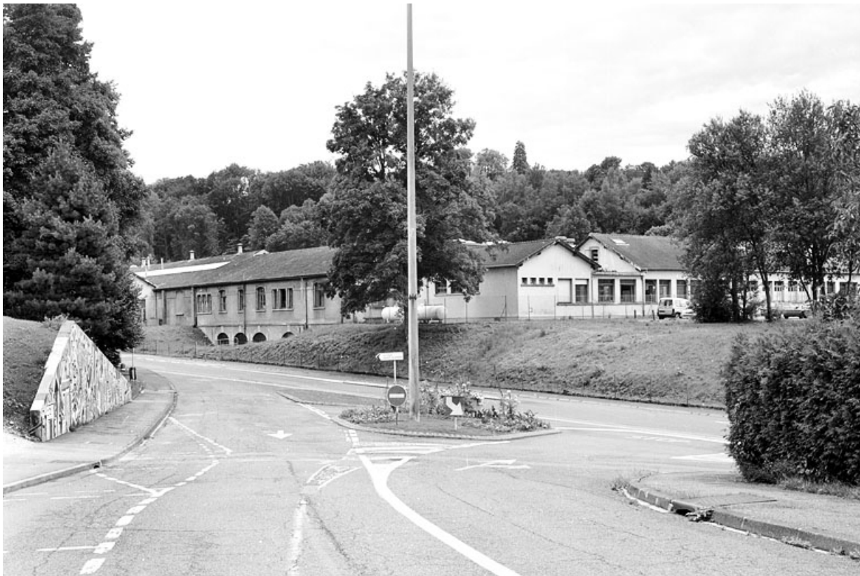
Vue d'ensemble depuis le nord.