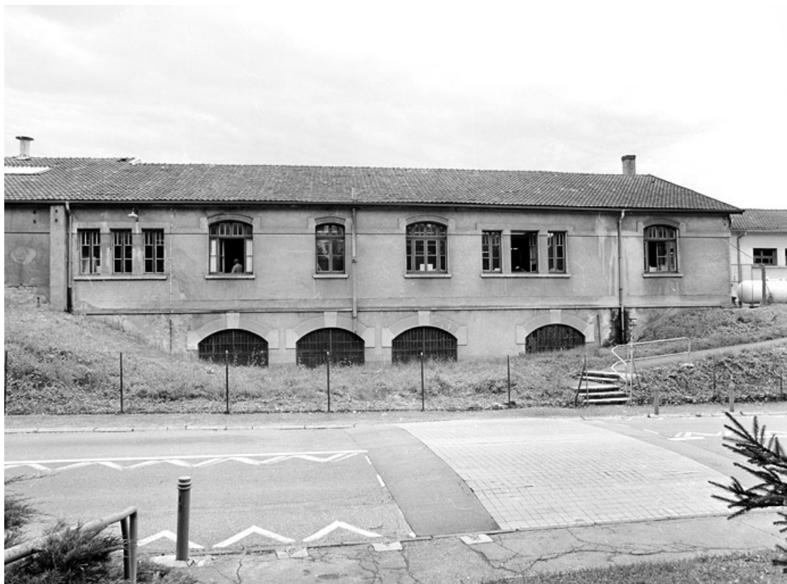
Façade postérieure des ateliers de fabrication.