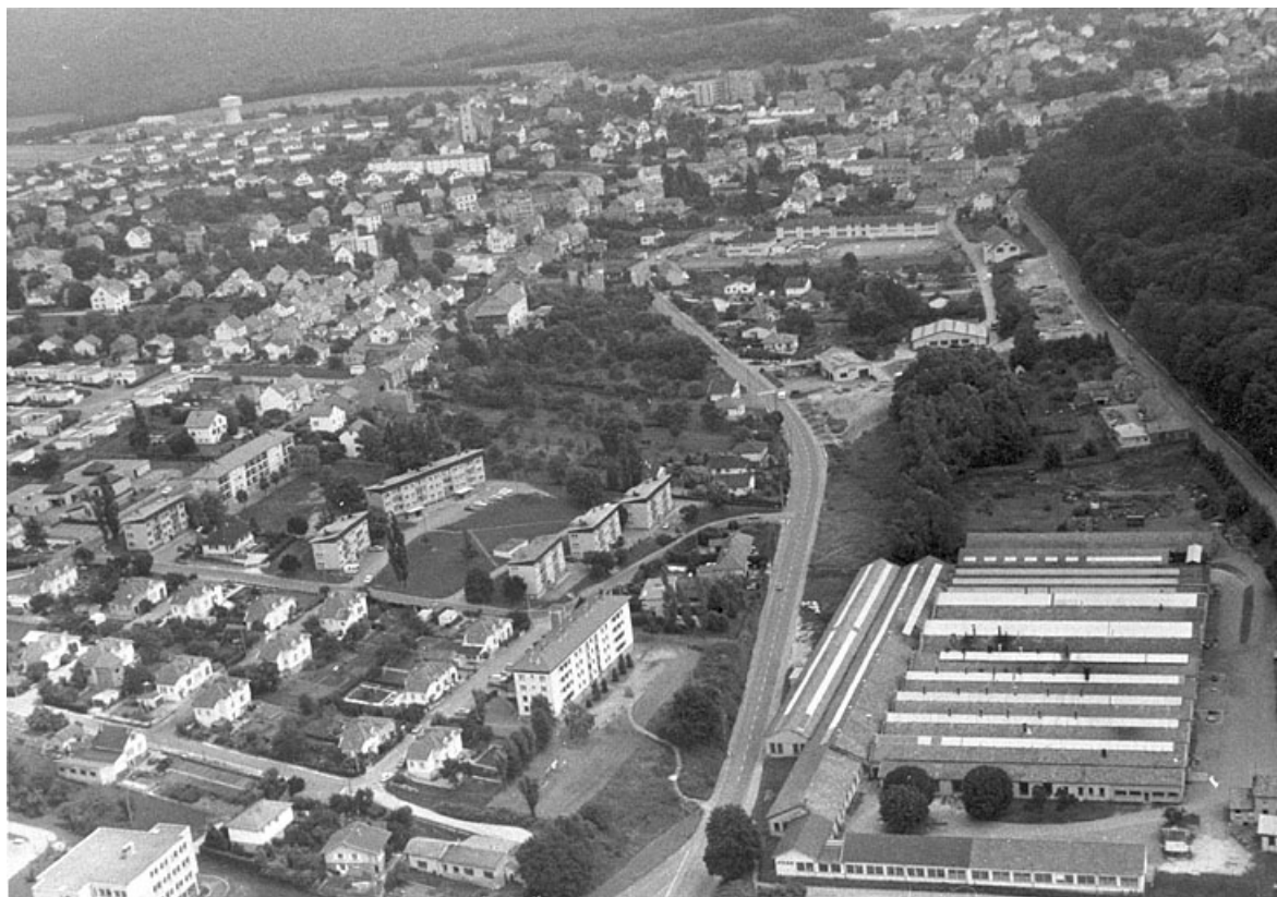
Vue aérienne depuis le nord-ouest en 1982.