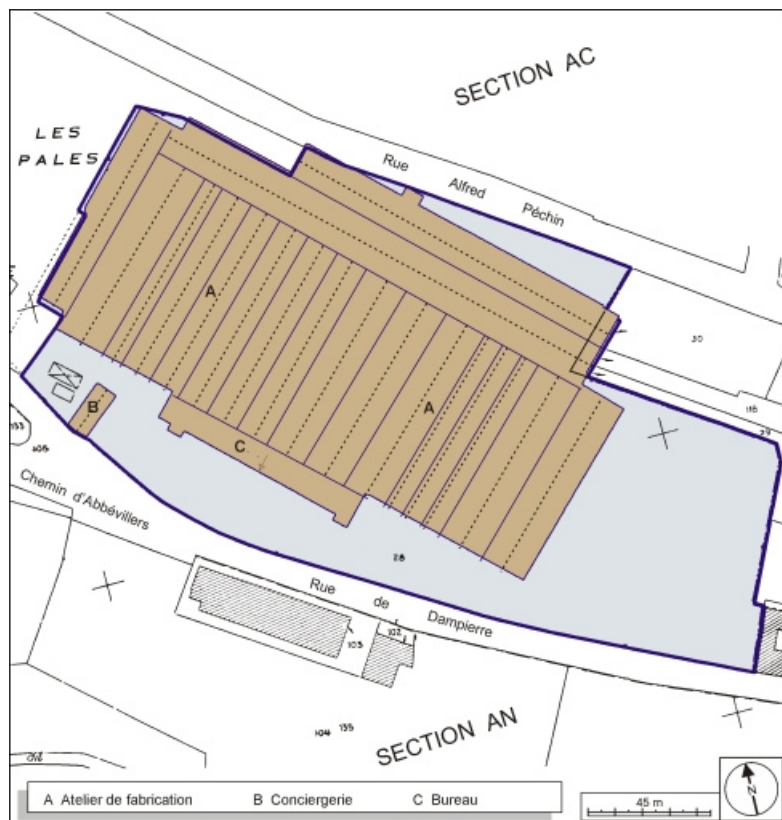
Plan-masse et de situation. Extrait du plan cadastral, 1984, section AK, 1:1000 réduit à 1:1500. 90, Beaucourt, 14 rue de Dampierre