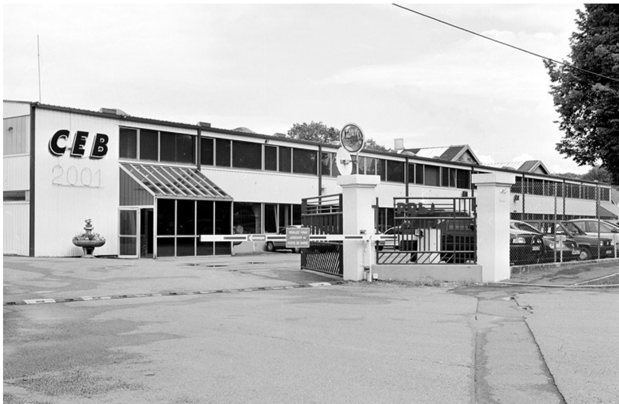
Façade antérieure des ateliers de fabrication depuis l'entrée.