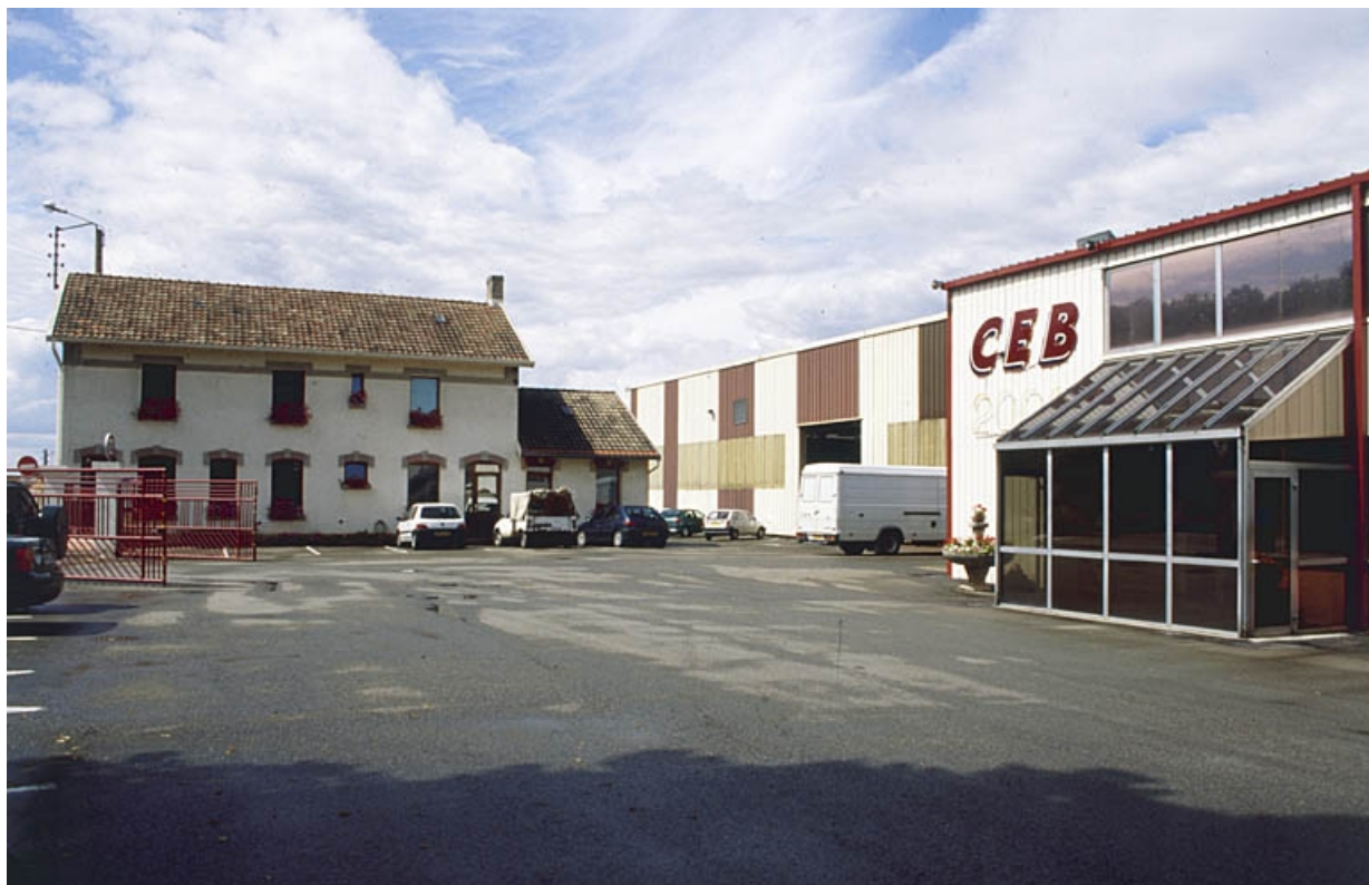
Conciergerie et façade antérieure des ateliers de fabrication.