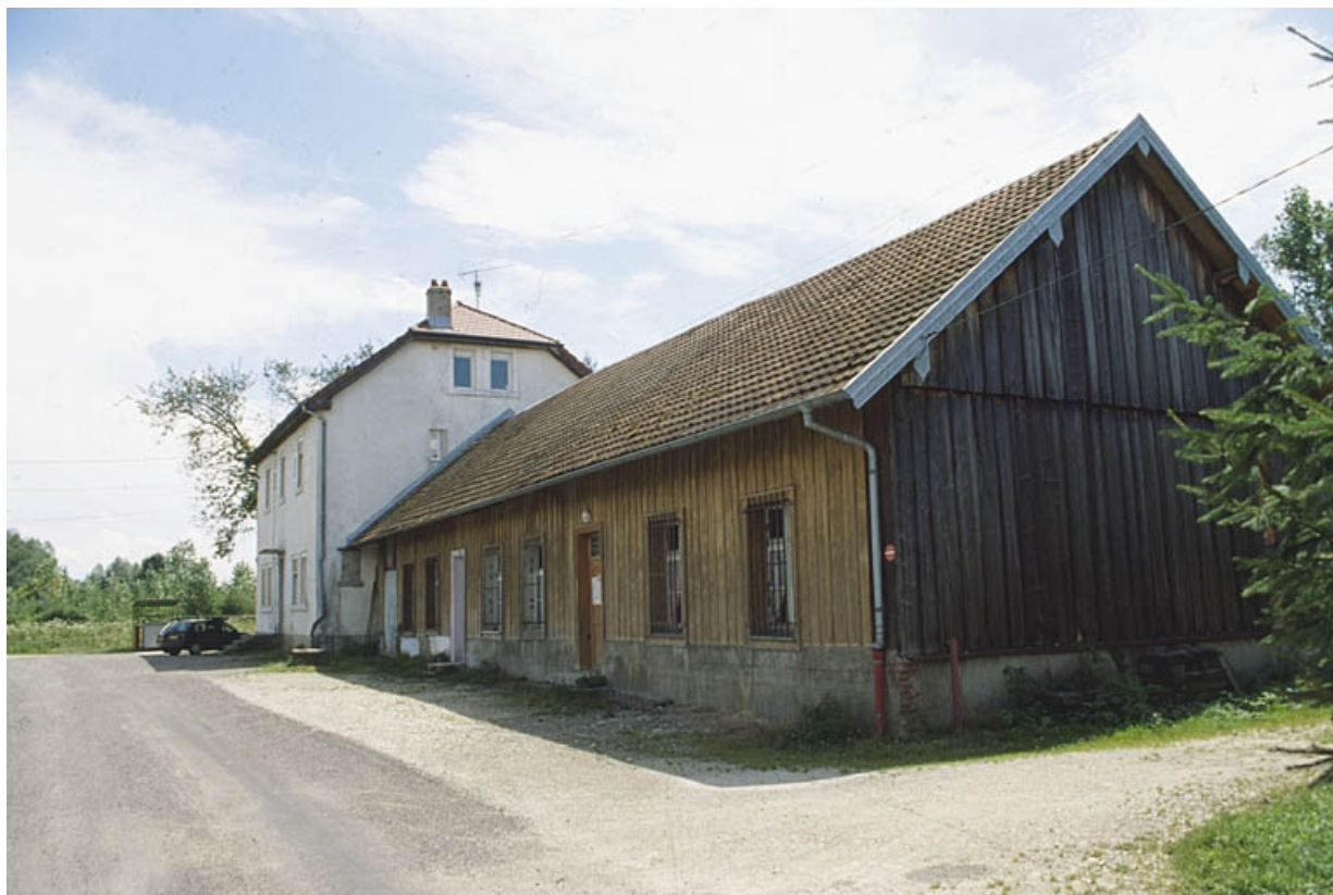
Vue depuis le nord-ouest.