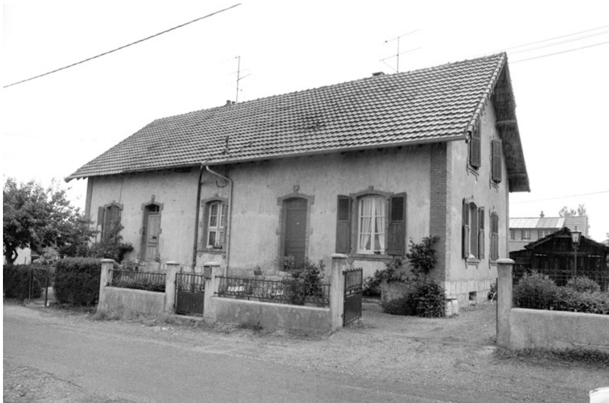
Une maison à deux logements en 1980.

90, Grandvillars, lieudit : cité Alsacienne