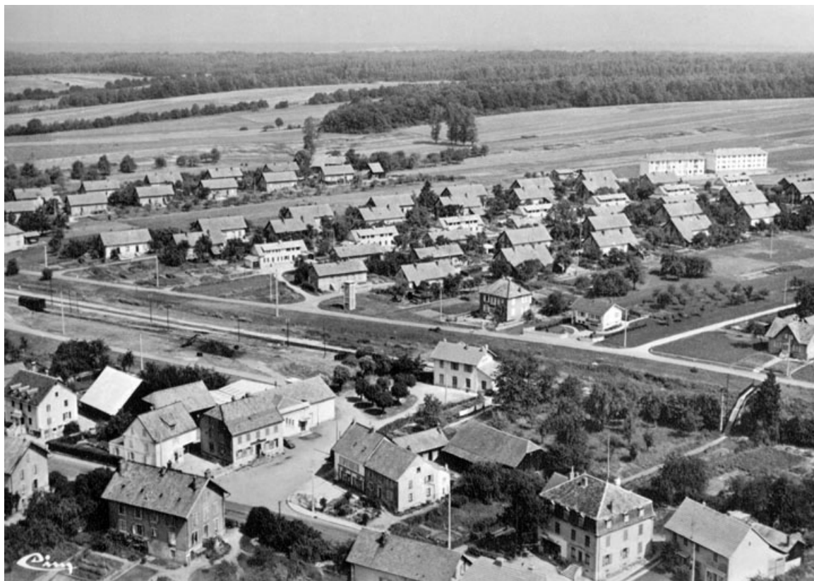
Grandvillars (Ter.-de-Belfort.). Vue générale.

90, Grandvillars, lieudit : cité Alsacienne