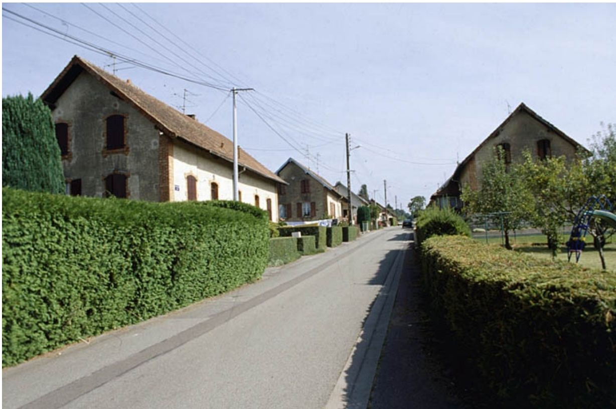
Vue d'ensemble de la 1ère rue.

90, Grandvillars, lieudit : cité Alsacienne