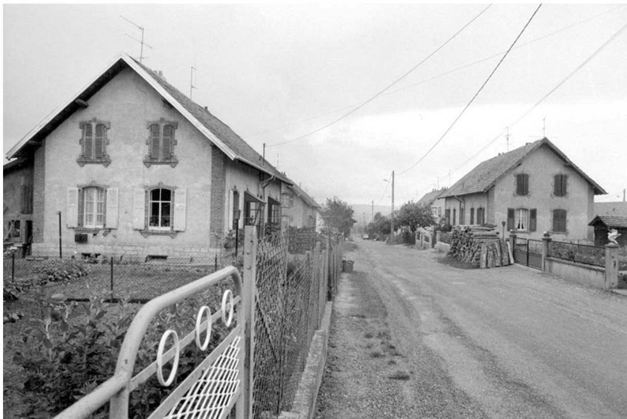
Une rue de la cité en 1980.

90, Grandvillars, lieudit : cité Alsacienne