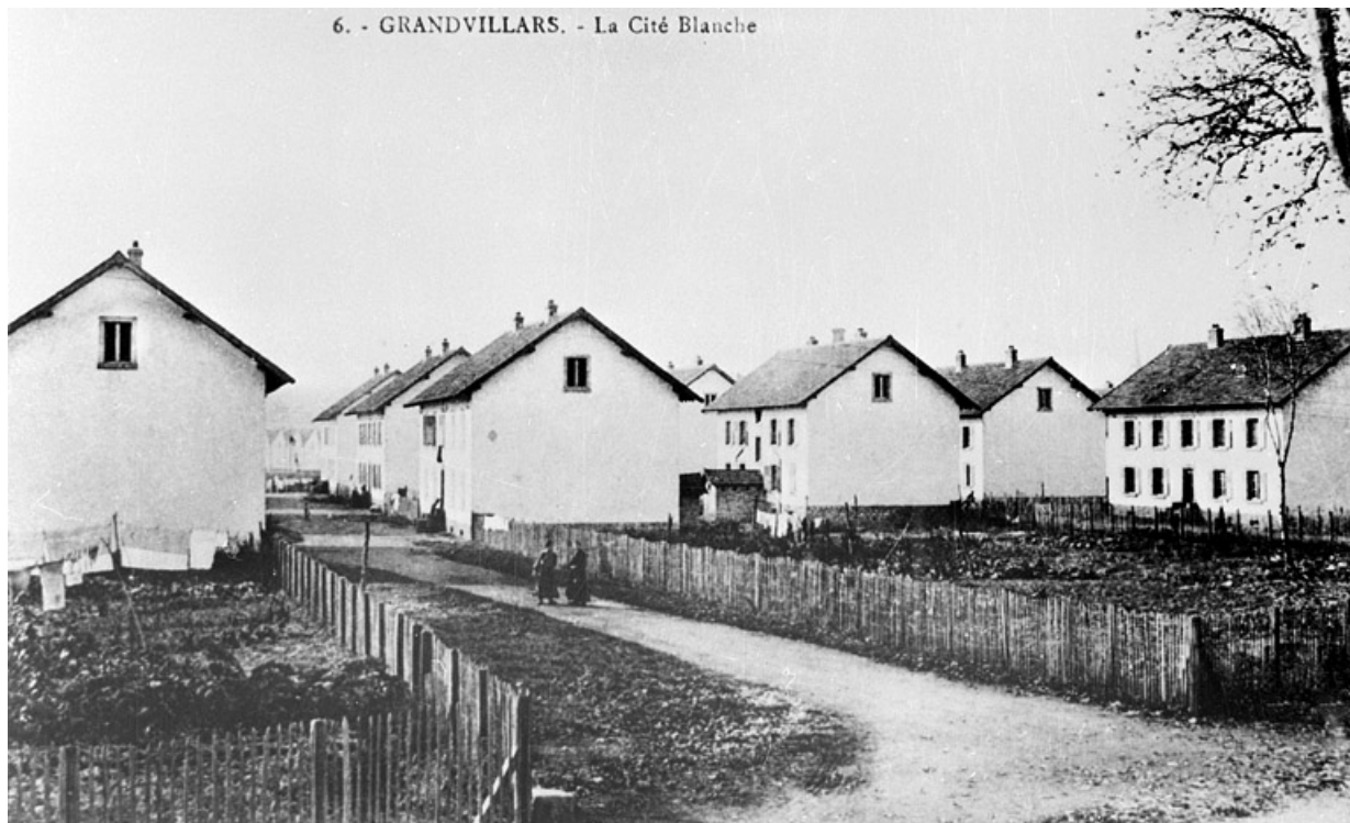
Grandvillars. La Cité blanche.

90, Grandvillars, lieudit : cité Condemaine