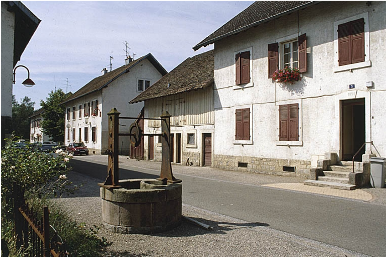
La rue du Vieux Puits.

90, Grandvillars, lieudit : cité Condemaine