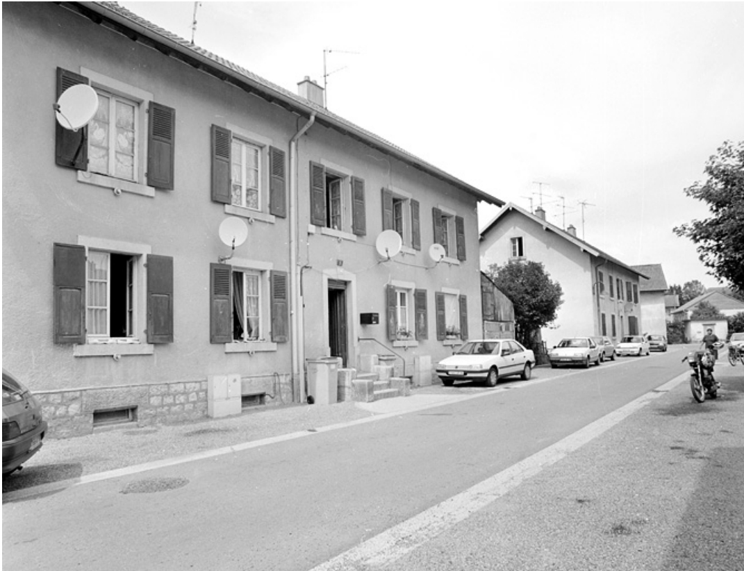
Une rue de la cité.

90, Grandvillars, lieudit : cité Condemaine