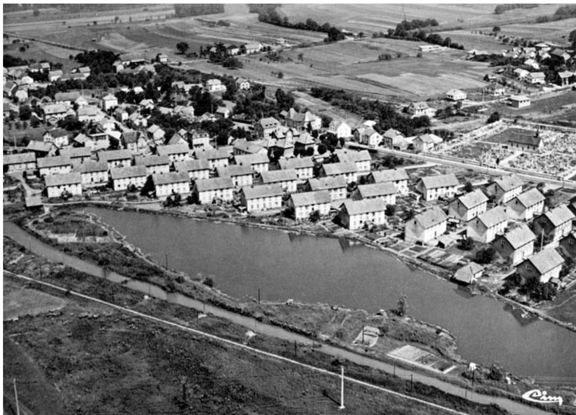
Grandvillars. (T.-de-B.). Vue générale aérienne.

90, Grandvillars, lieudit : cité Condemaine