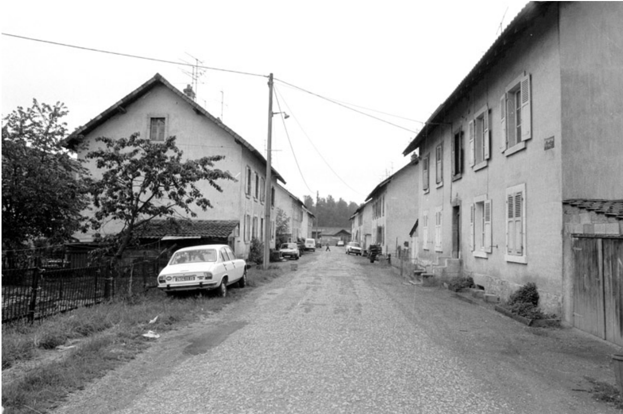
Une rue de la cité en 1980.

90, Grandvillars, lieudit : cité Condemaine