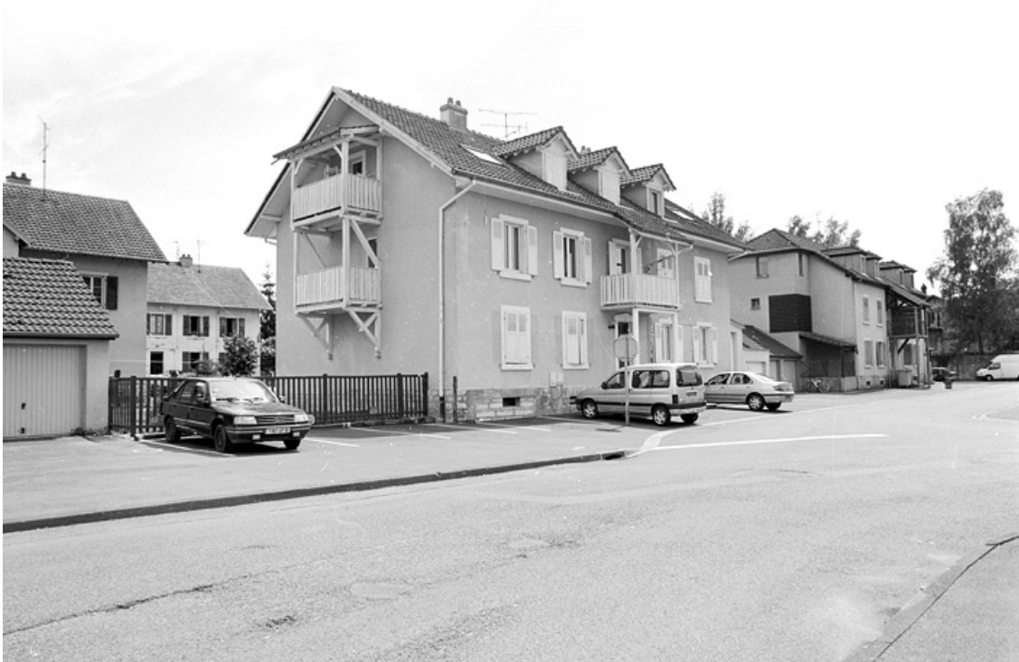
Logements collectifs (1902) rue Kléber.

90, Grandvillars, lieudit : cité Condemaine