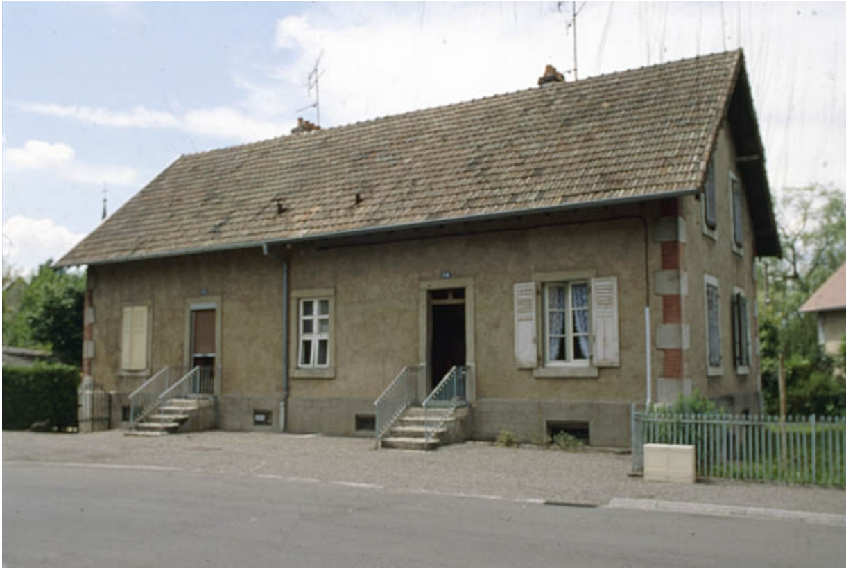
Maison à deux logements rue Kléber.

90, Grandvillars, lieudit : cité Condemaine