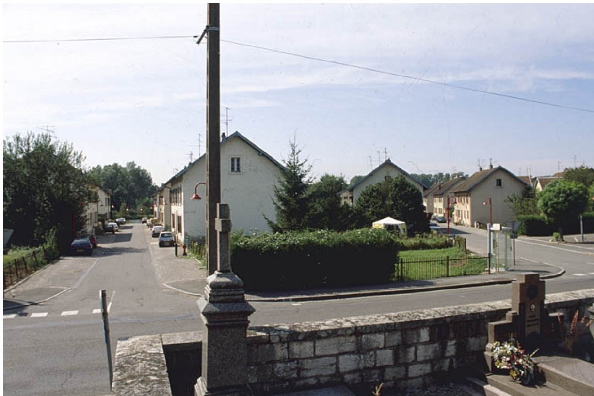
Rues de Condemaine et de Montrobert depuis le nord.

90, Grandvillars, lieudit : cité Condemaine