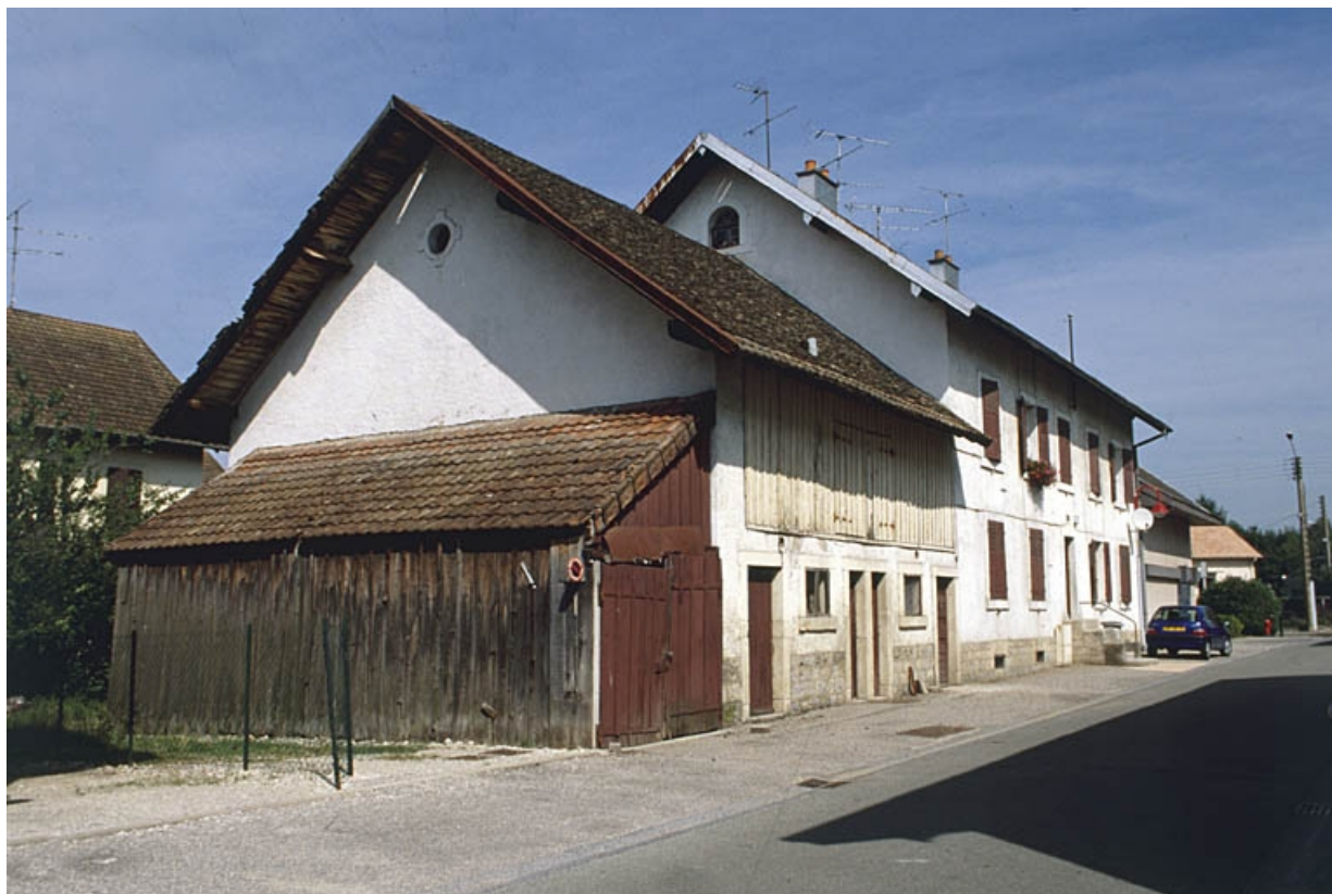
Maison à quatre logements et dépendances rue du Vieux Puits.

90, Grandvillars, lieu dit : cité Condemaine