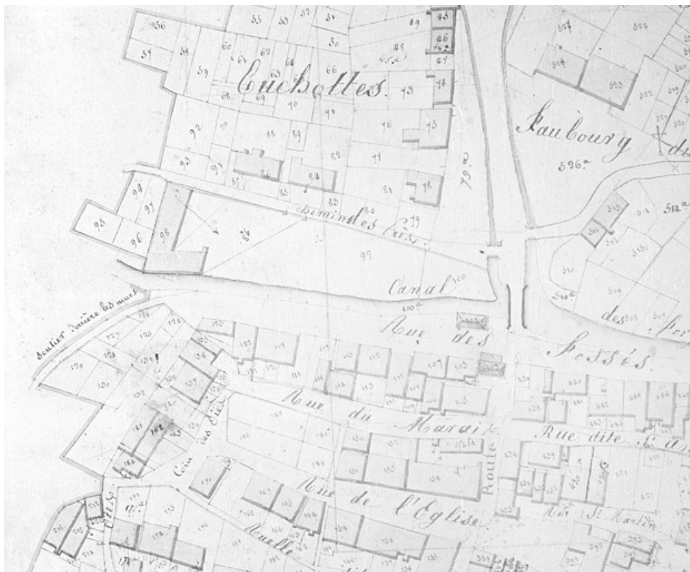
Grandvillars. Section E dite le village [plan-masse et de situation extrait du plan cadastral napoléonien].

90, Grandvillars rue de l' Ancien abattoir