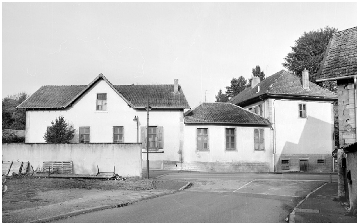
Salle de spectacle, chaufferie et école depuis l'est. 90, Morvillars, 1 rue des Forges