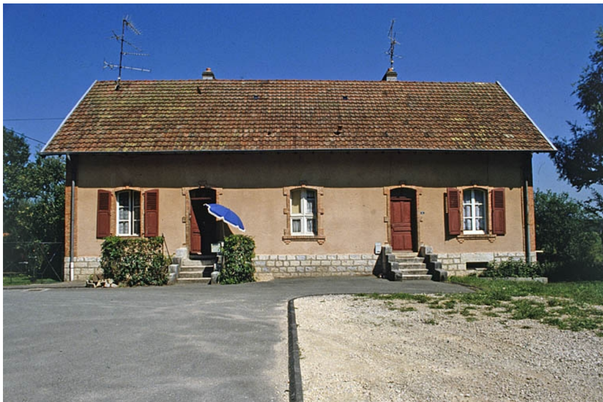
Façade antérieure d'un logement à 2 appartements.