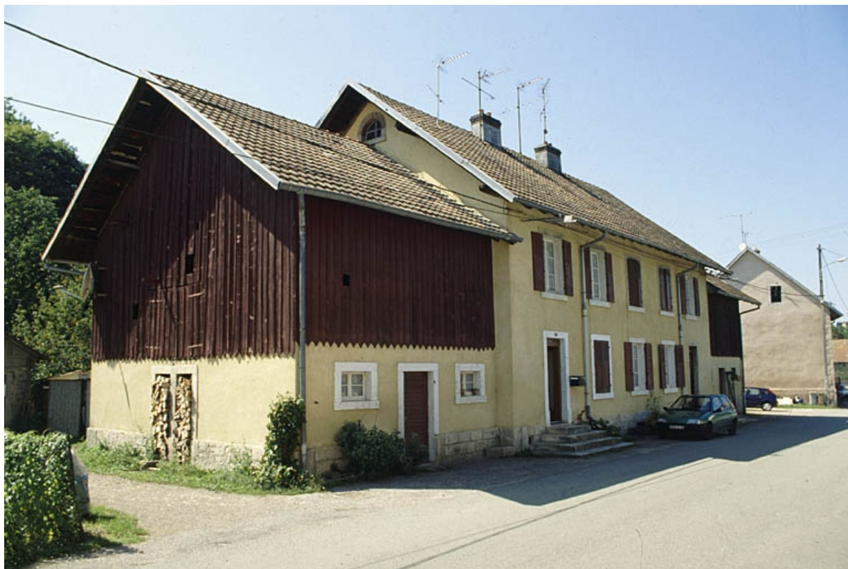
Logement ouvrier à 4 appartements avec dépendances (bûcher et véranda ?). 90, Morvillars, 2 à 11 rue du Pâquis