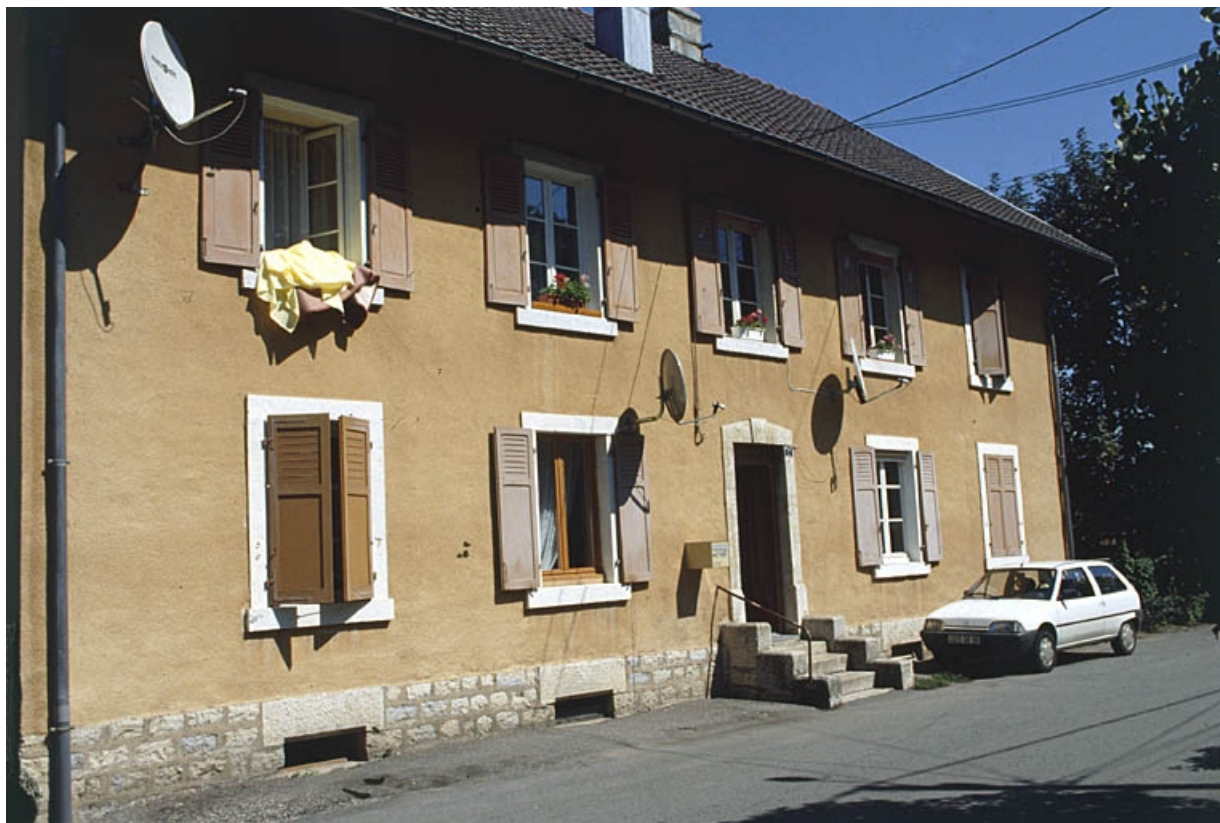
Façade antérieure d'un logement ouvrier à 4 appartements.