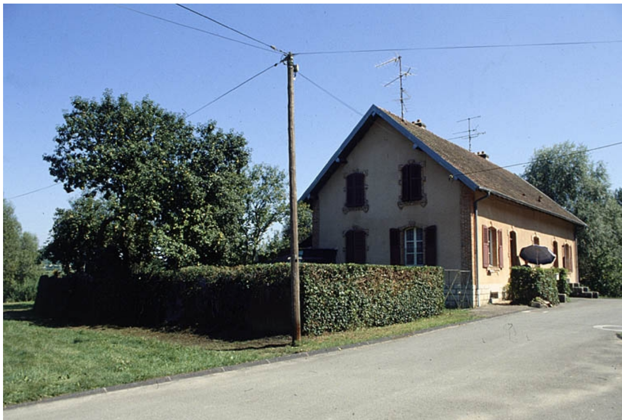
Vue de trois quarts d'un logement à 2 appartements.