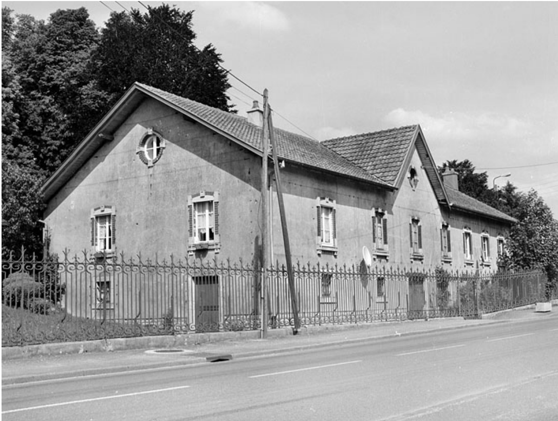
Vue de trois quarts de la conciergerie.

90, Morvillars, lieudit : sur les Roches