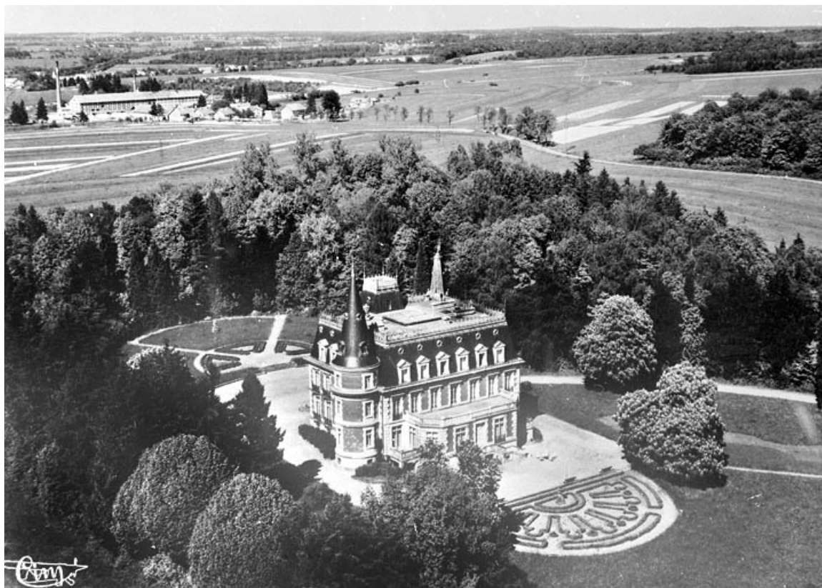
Morvillars (T.-de-B.) - Vue aérienne - Le Château de Fontaine et la Tuilerie.

90, Morvillars, lieudit : sur les Roches