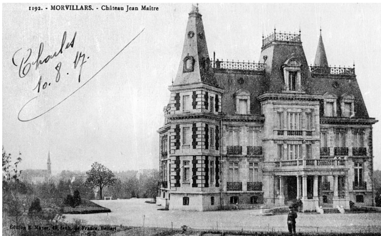
Morvillars - Château Jean Maître [légende erronée].

90, Morvillars, lieudit : sur les Roches