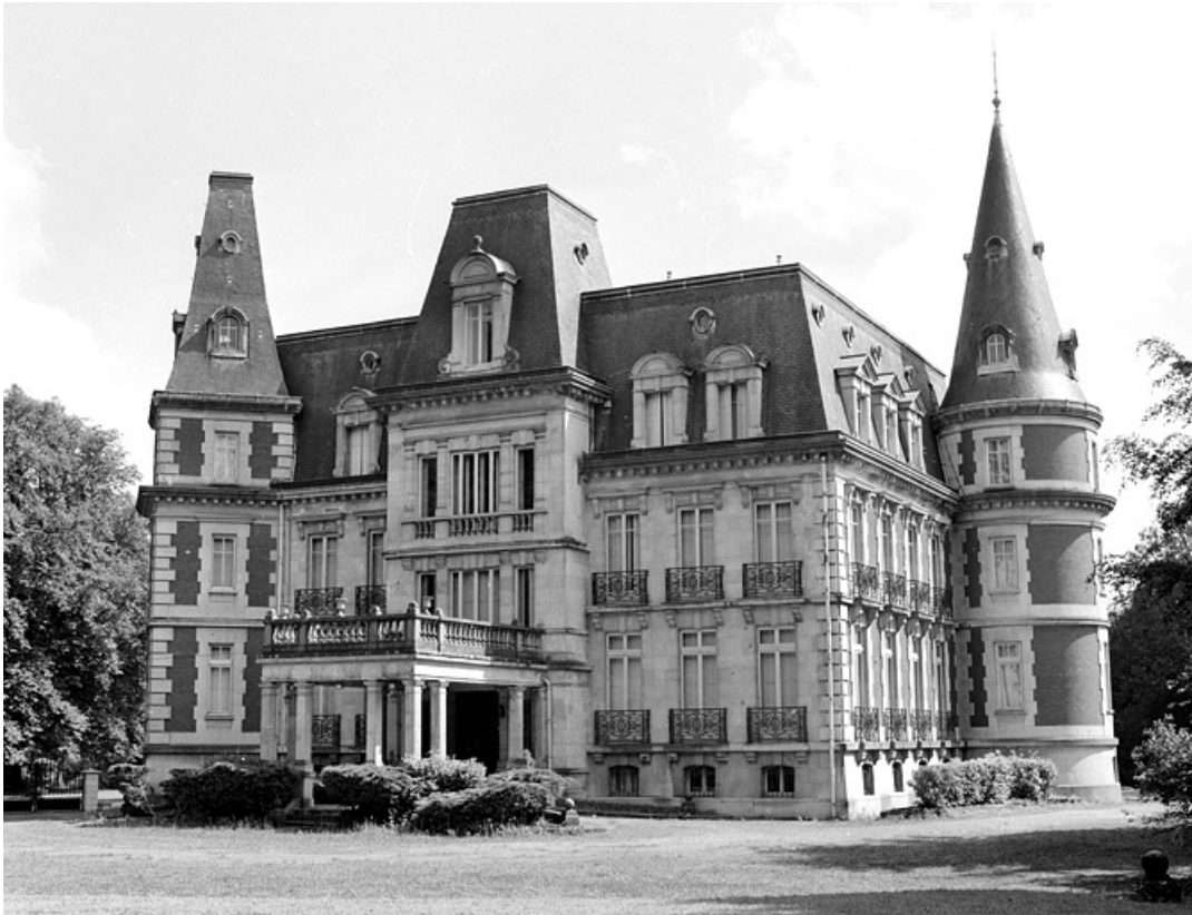
Vue d'ensemble depuis le nord-ouest.

90, Morvillars, lieudit : sur les Roches