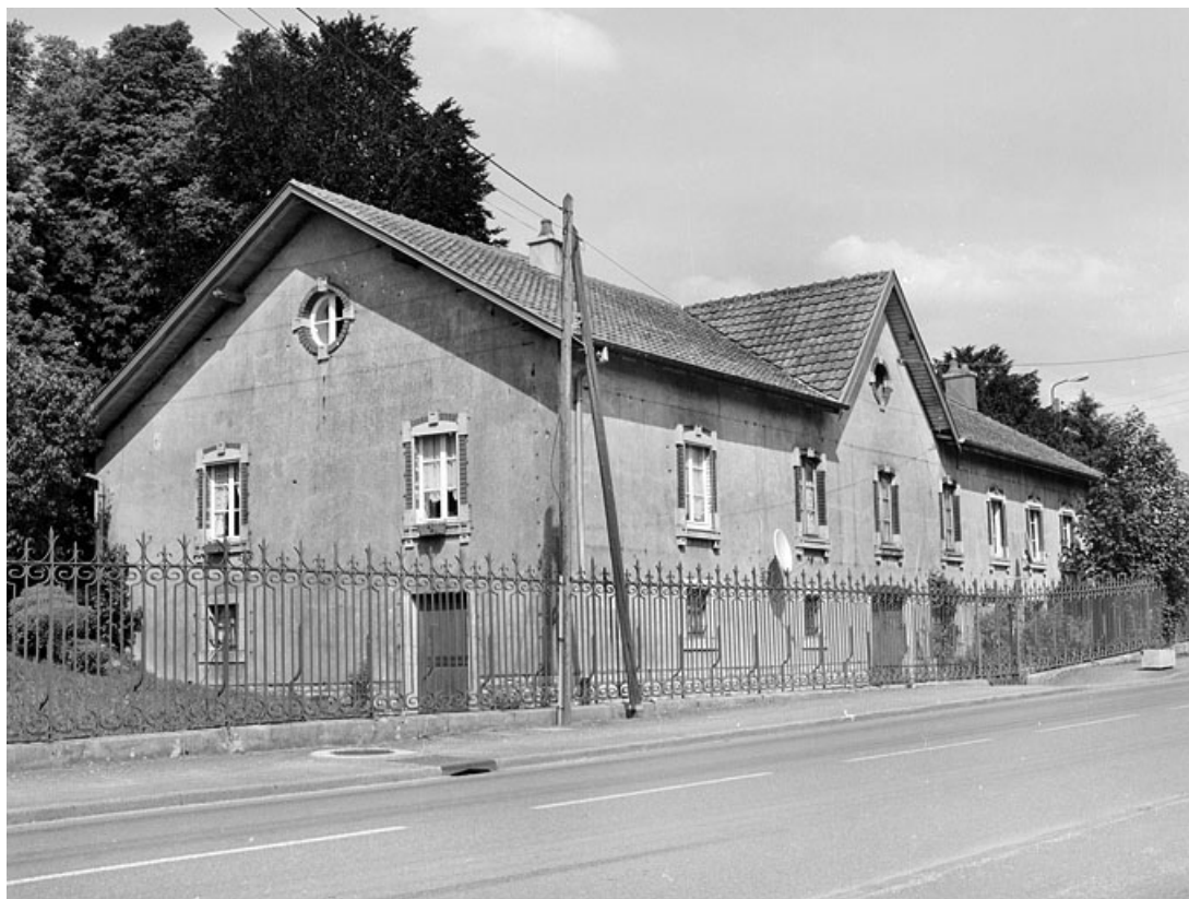
Vue de trois quarts de la conciergerie.

90, Morvillars, lieudit : sur les Roches