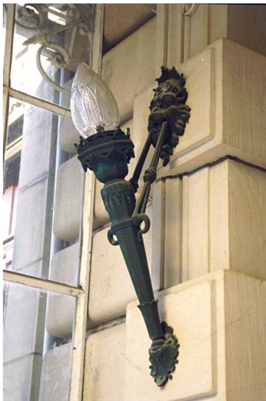
Façade antérieure : lampe d'applique.