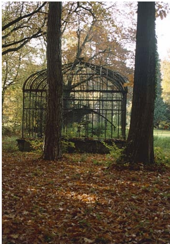
La serre : vue depuis l'est.