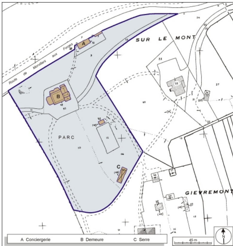
Plan-masse et de situation. Extrait du plan cadastral, 1984, section B, 1:1000 réduit à 1:1500. 90, Morvillars, 11 rue des Forges