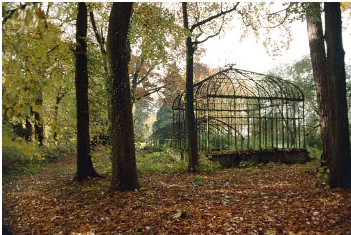
Vue d'ensemble de la serre.