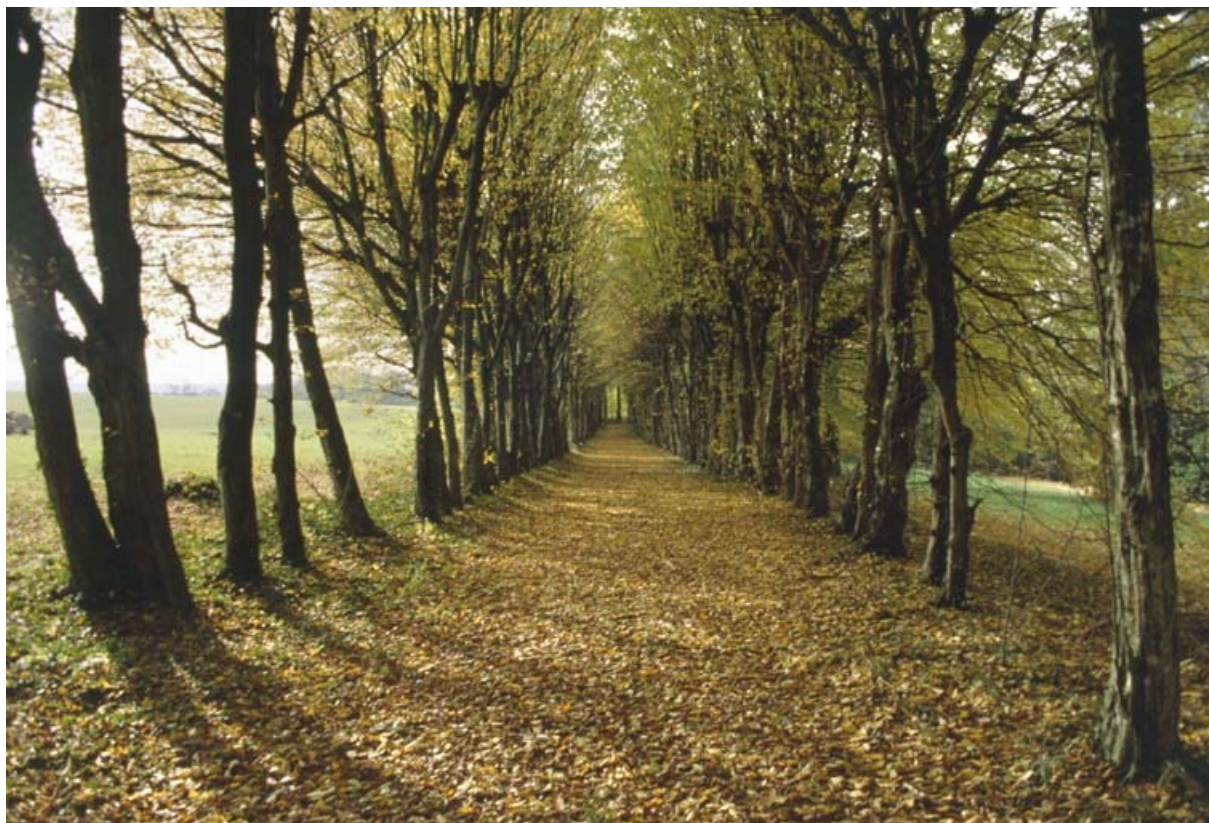
Allée couverte à l'ouest de la demeure.