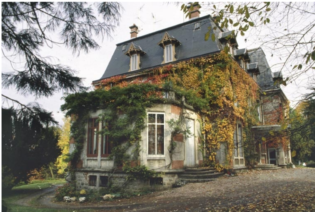
Vue depuis le sud-ouest.