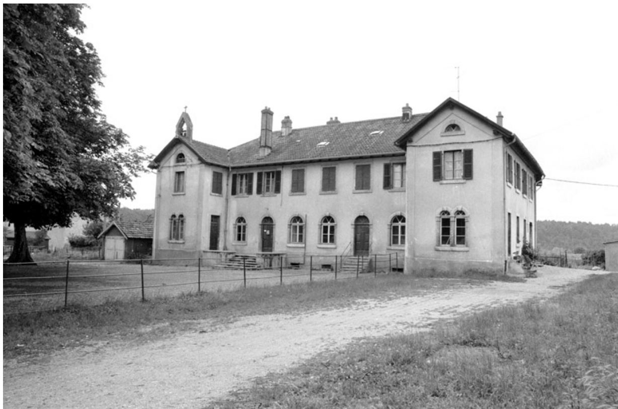
Vue d'ensemble en 1980.