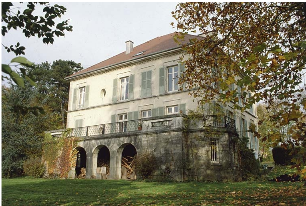
Vue de trois quarts arrière.