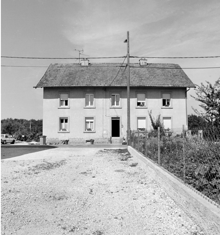
Vue d'ensemble d'un logement ouvrier collectif.