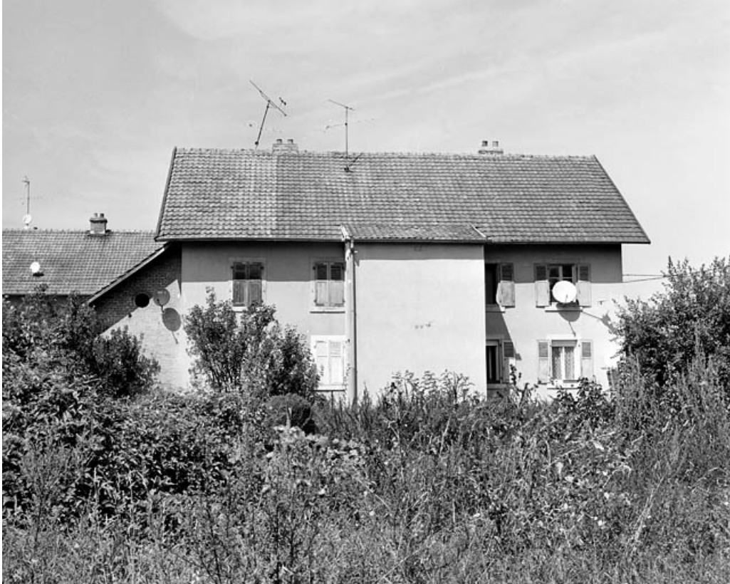
Façade postérieure d'un logement ouvrier collectif.