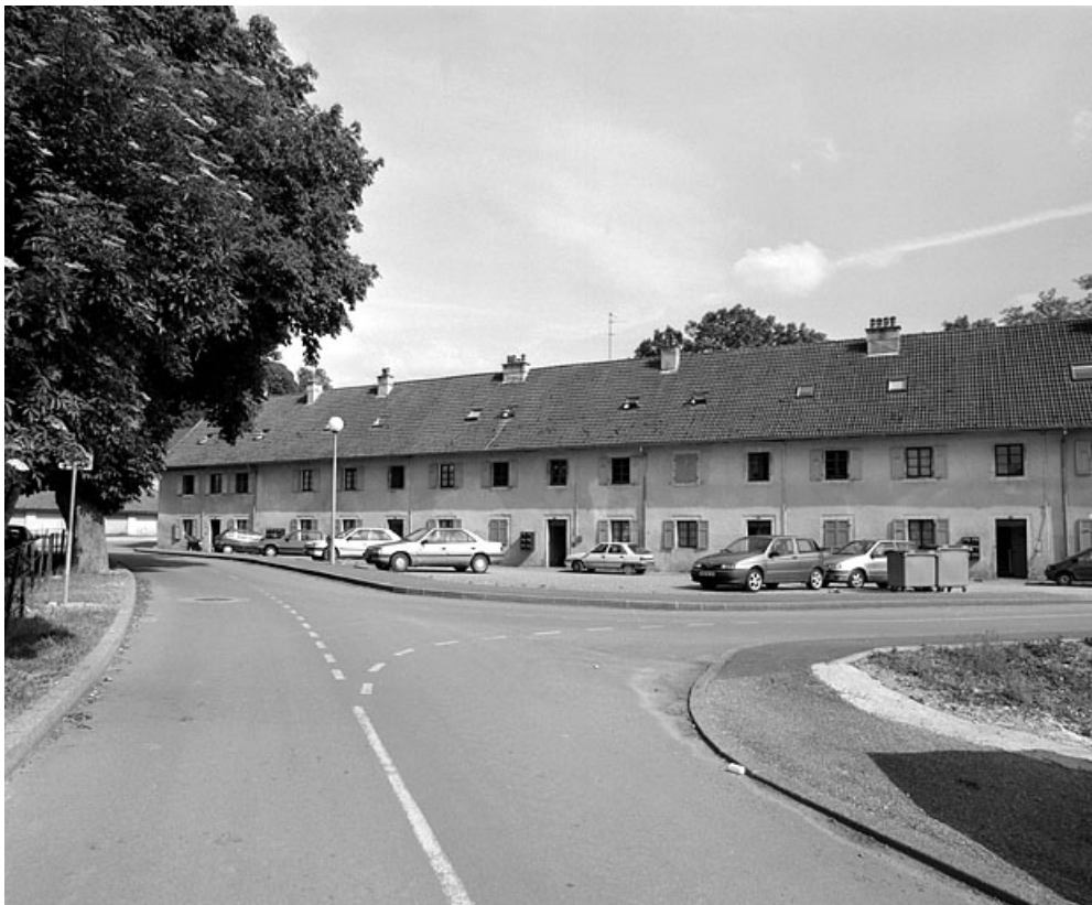
Logement ouvrier collectif (n° 17 à 25 rue du Canal). 90, Méziré rue de l' Allaine