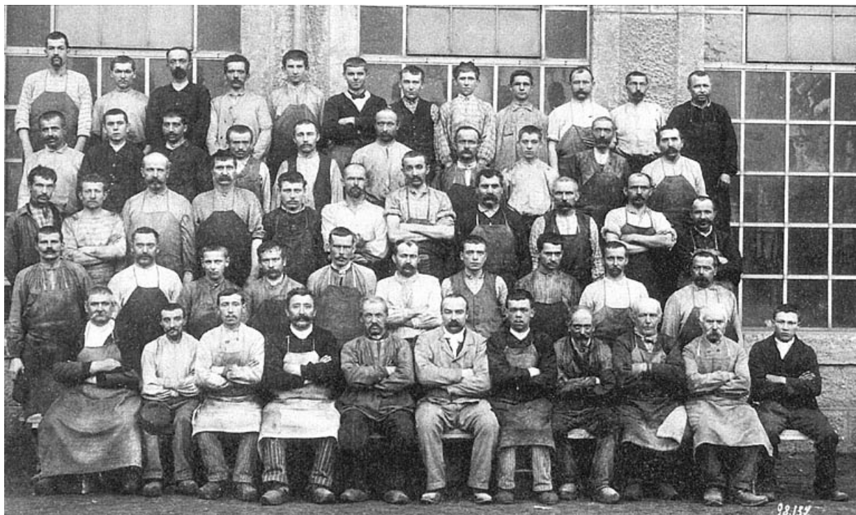
Groupe d'ouvriers (Forges de Grandvillars ?).