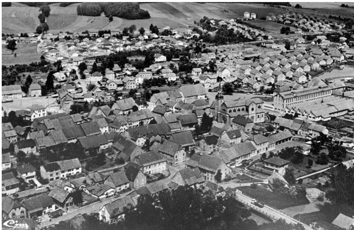
Grandvillars (T.-de-B.). La localité et les Usines du Château. Vue aérienne [l'usine dite du Château et les cités ouvrières Bellevue, Migeon, Alsacienne et des Creux].