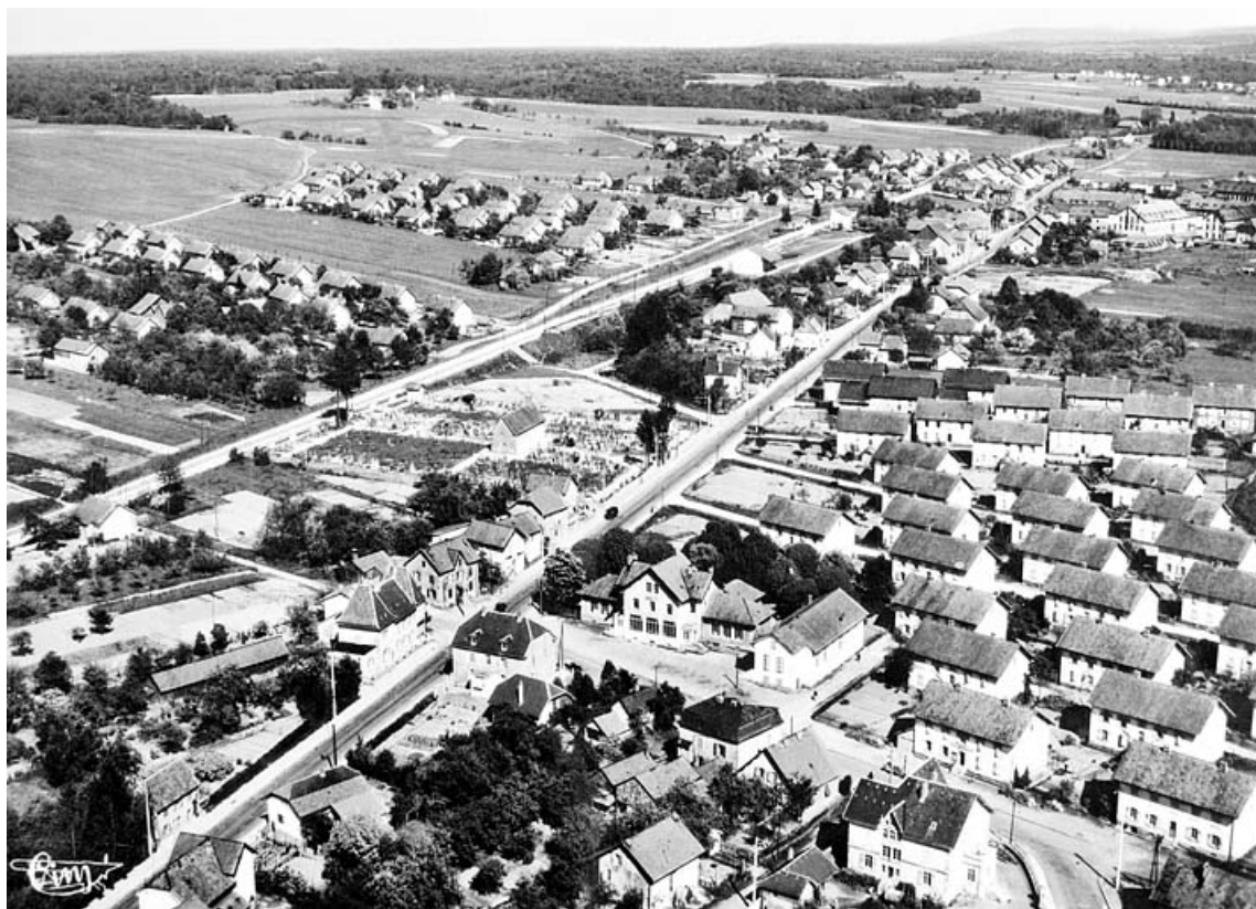
Grandvillars. Vue générale aérienne. Les cités [de gauche à droite : cité Alsacienne, des Creux et Migeon. Au fond : les Forges]. 90, Grandvillars