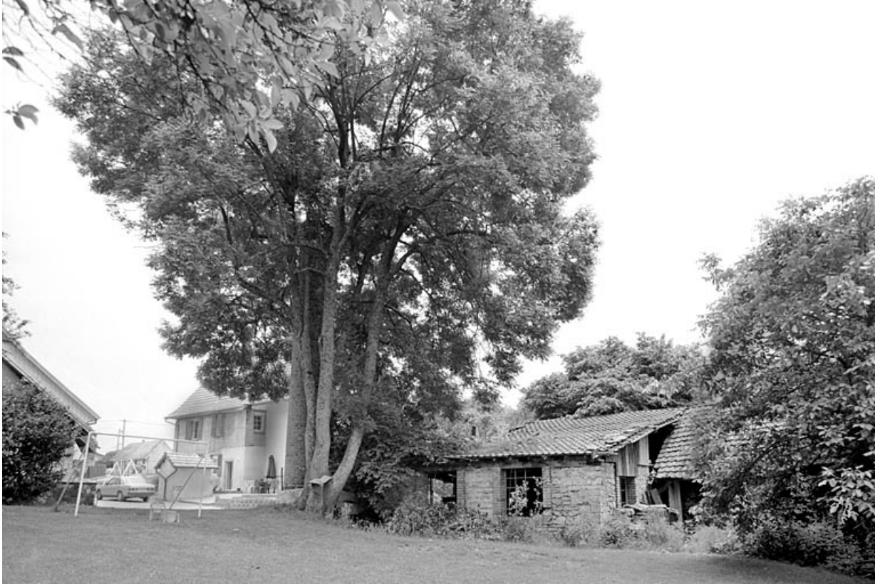
Logement patronal et salle des machines depuis l'ouest. 90, Suarce R.D. 13