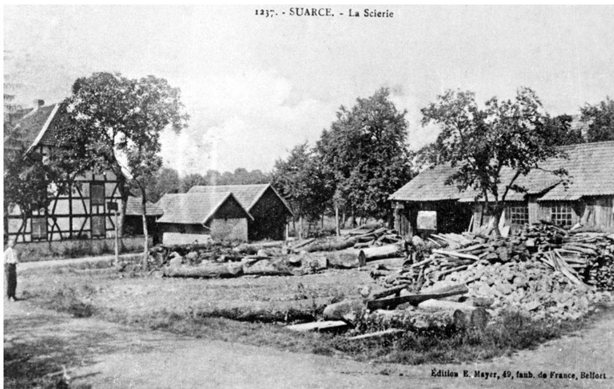
Suarce. La Scierie.