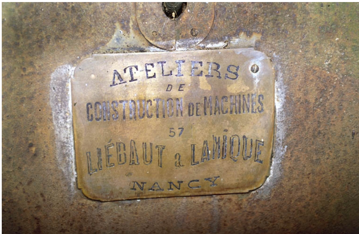
Plaque de constructeur de la machine à vapeur.