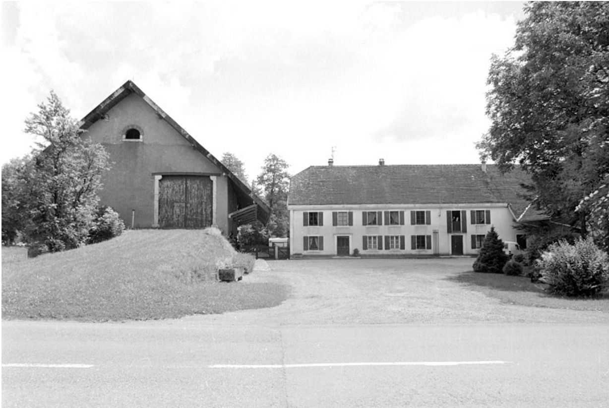
Vue depuis l'entrée.