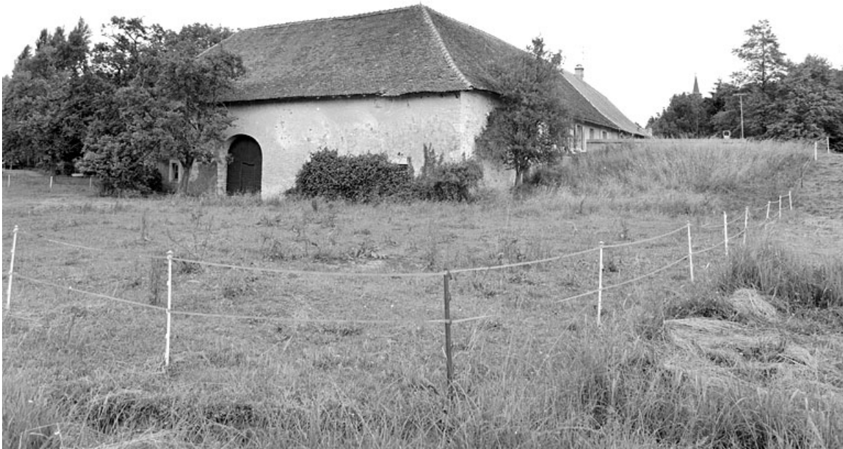
Le moulin depuis le sud.