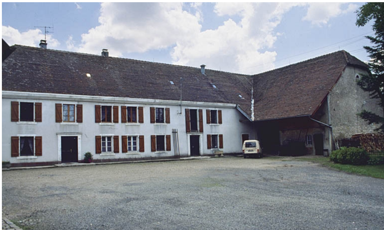
De gauche à droite : logement, moulin et parties agricoles.