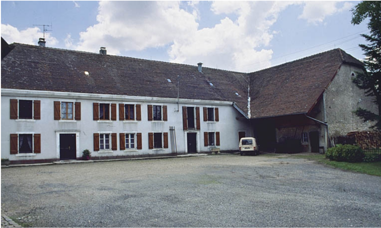
De gauche à droite : logement, moulin et parties agricoles.