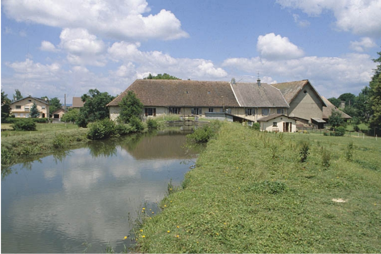
Canal d'amenée du moulin.