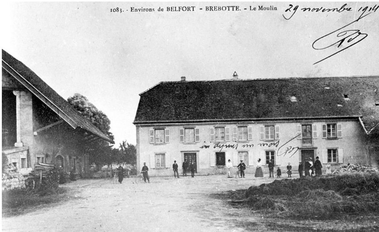
Environs de Belfort. Brebotte. Le moulin.