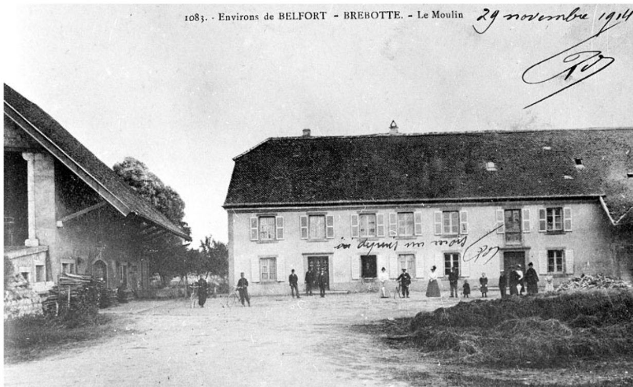
Environs de Belfort. Brebotte. Le moulin.