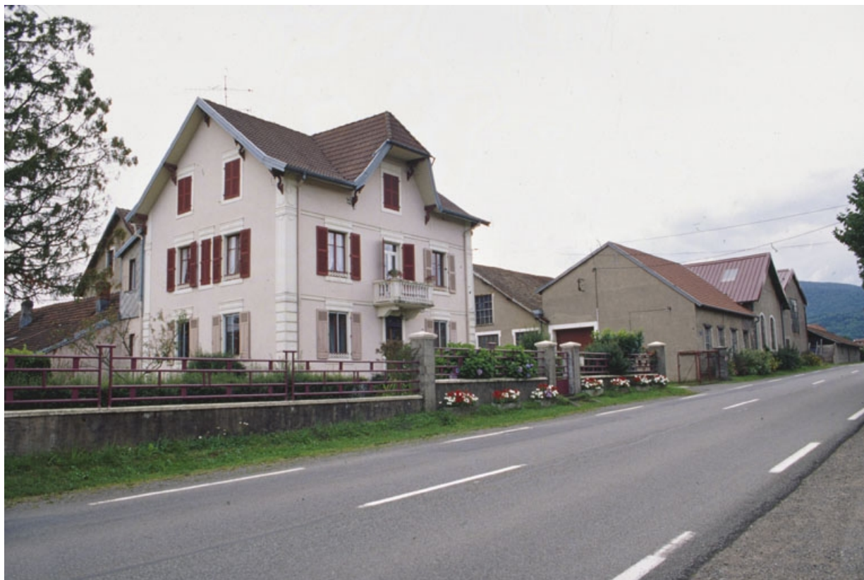
Vue d'ensemble depuis l'est. Logement patronal au premier plan.

90, Rougegoutte, 27 avenue Charles de Gaulle