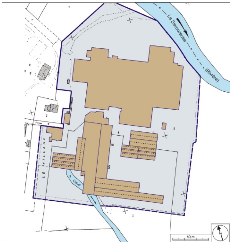
Plan-masse de l'usine. Extrait du plan cadastral, 1991, section AM, 1:1000 réduit à 1:2000. 90, Châtenois-les-Forges, 7 avenue des Forges