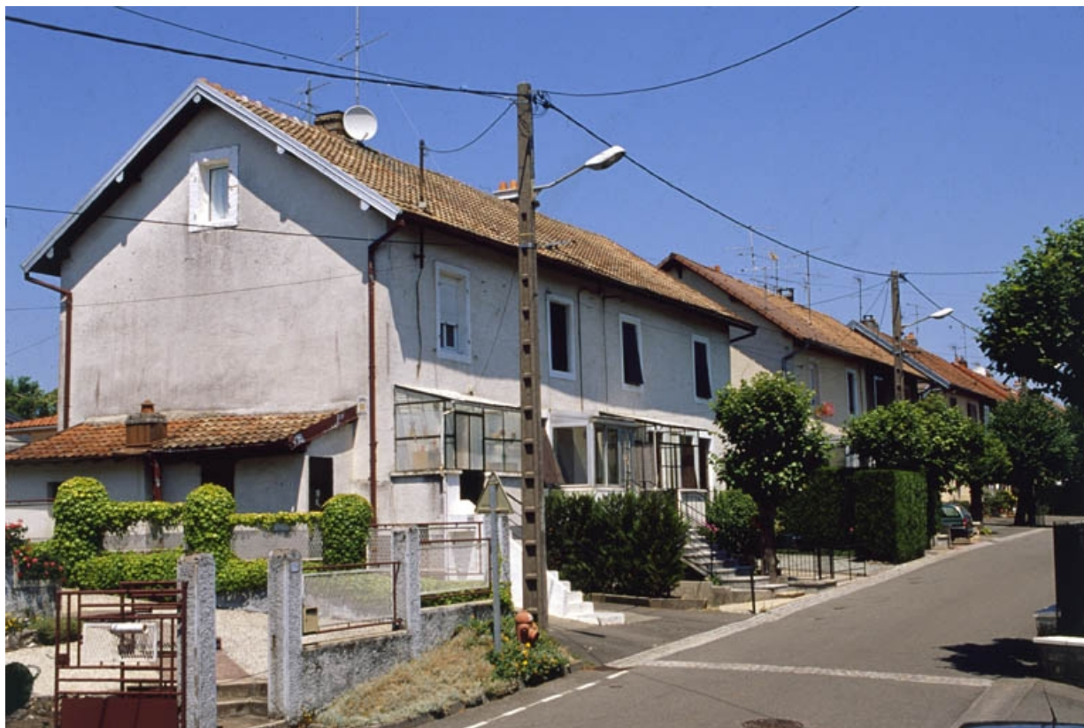
Logements ouvriers rue de Lattre de Tassigny. 90, Châtenois-les-Forges, 7 avenue des Forges