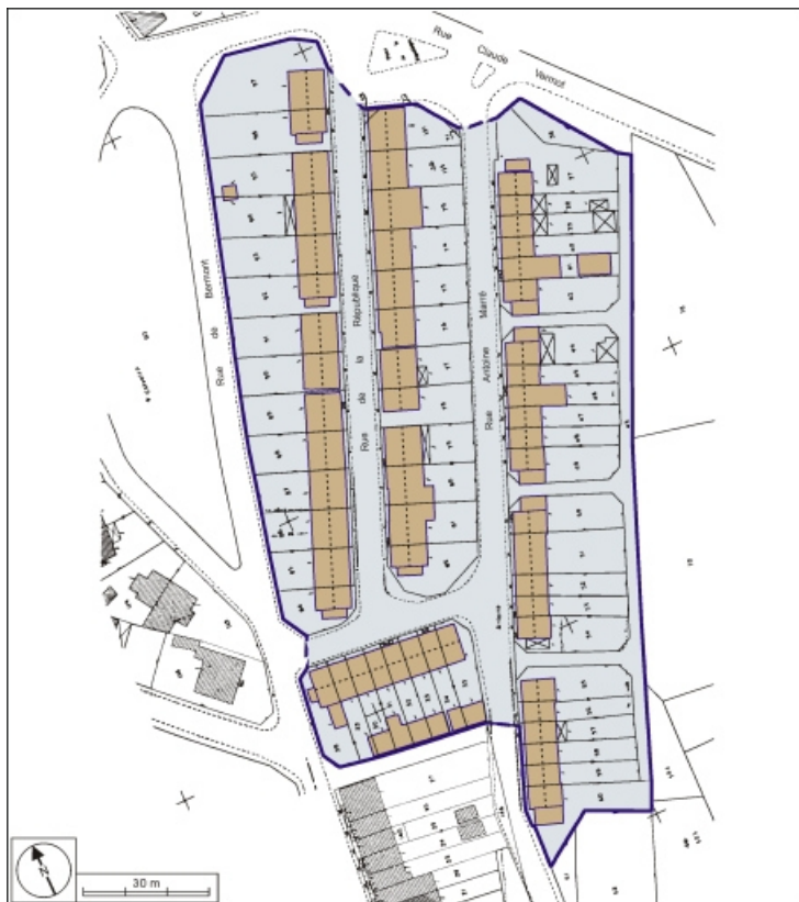
Plan-masse de la cité ouvrière rues de la République et Bernard Marré. Extrait du plan cadastral, 1991, section AA, 1:500 réduit à 1:1000.

90, Châtenois-les-Forges, 7 avenue des Forges