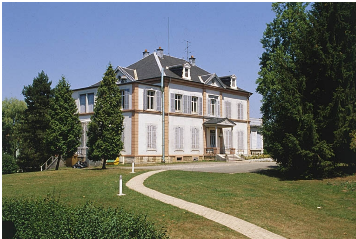
Vue de trois quarts arrière du logement patronal.

90, Châtenois-les-Forges, 7 avenue des Forges