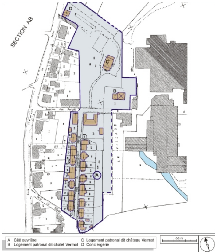
Plan-masse de la cité ouvrière du Commandant Prince et des logements patronaux. Extrait du plan cadastral, 1991, section AM, 1:1000 réduit à 1:2000.

90, Châtenois-les-Forges, 7 avenue des Forges