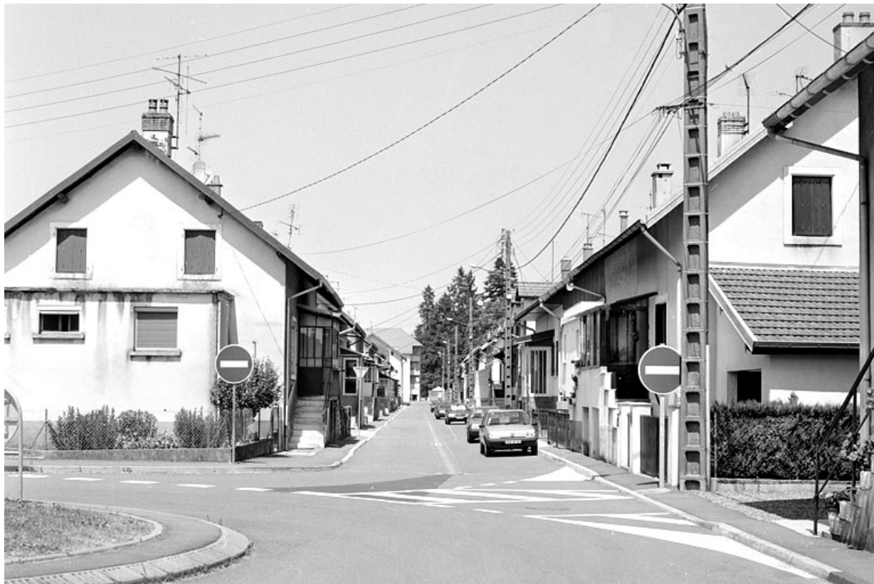
Logements ouvriers rue du Commandant Prince.

90, Châtenois-les-Forges, 7 avenue des Forges