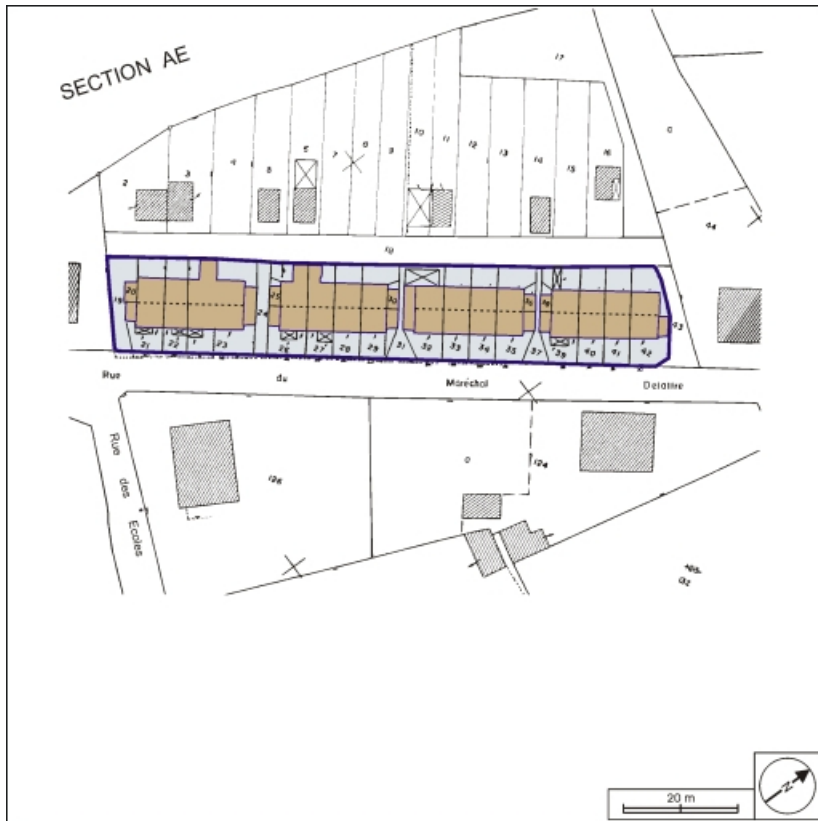
Plan-masse de la cité ouvrière rue du Maréchal Delattre de Tassigny. Extrait du plan cadastral, 1991, section AC, 1:500 réduit à 1:750.

90, Châtenois-les-Forges, 7 avenue des Forges