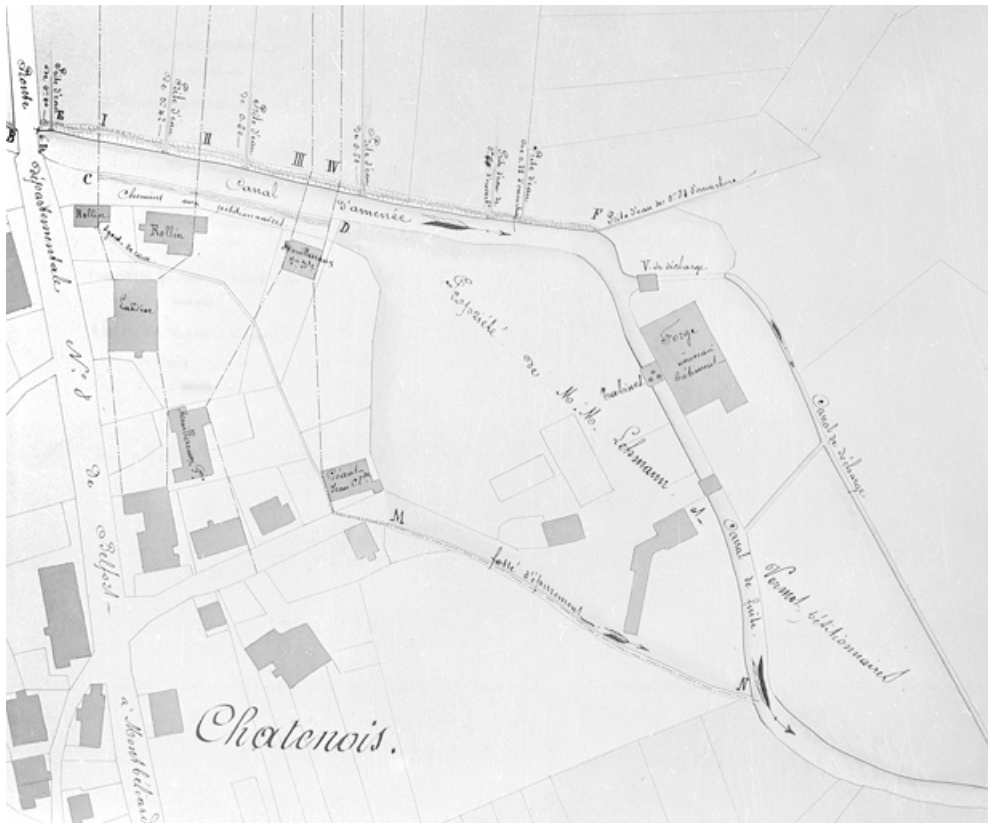
Plan des lieux [...] sur la demande des sieurs Vermot et Lehmann, tendant à réunir les 2 chutes en une seule.

90, Châtenois-les-Forges, 7 avenue des Forges