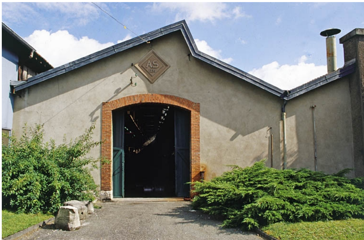
Détail d'un pignon d'un atelier de fabrication en rez-de-chaussée.

90, Danjoutin, 22 rue du Général Leclerc