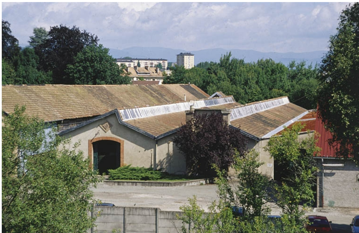
Ateliers de fabrication depuis le sud.

90, Danjoutin, 22 rue du Général Leclerc