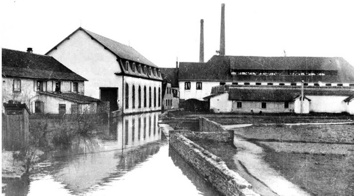
La filature de Danjoutin.