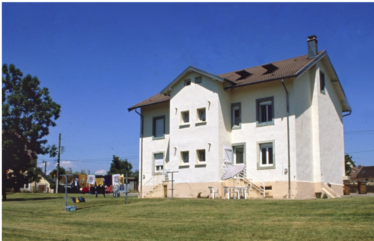
Façade postérieure d'un logement ouvrier.