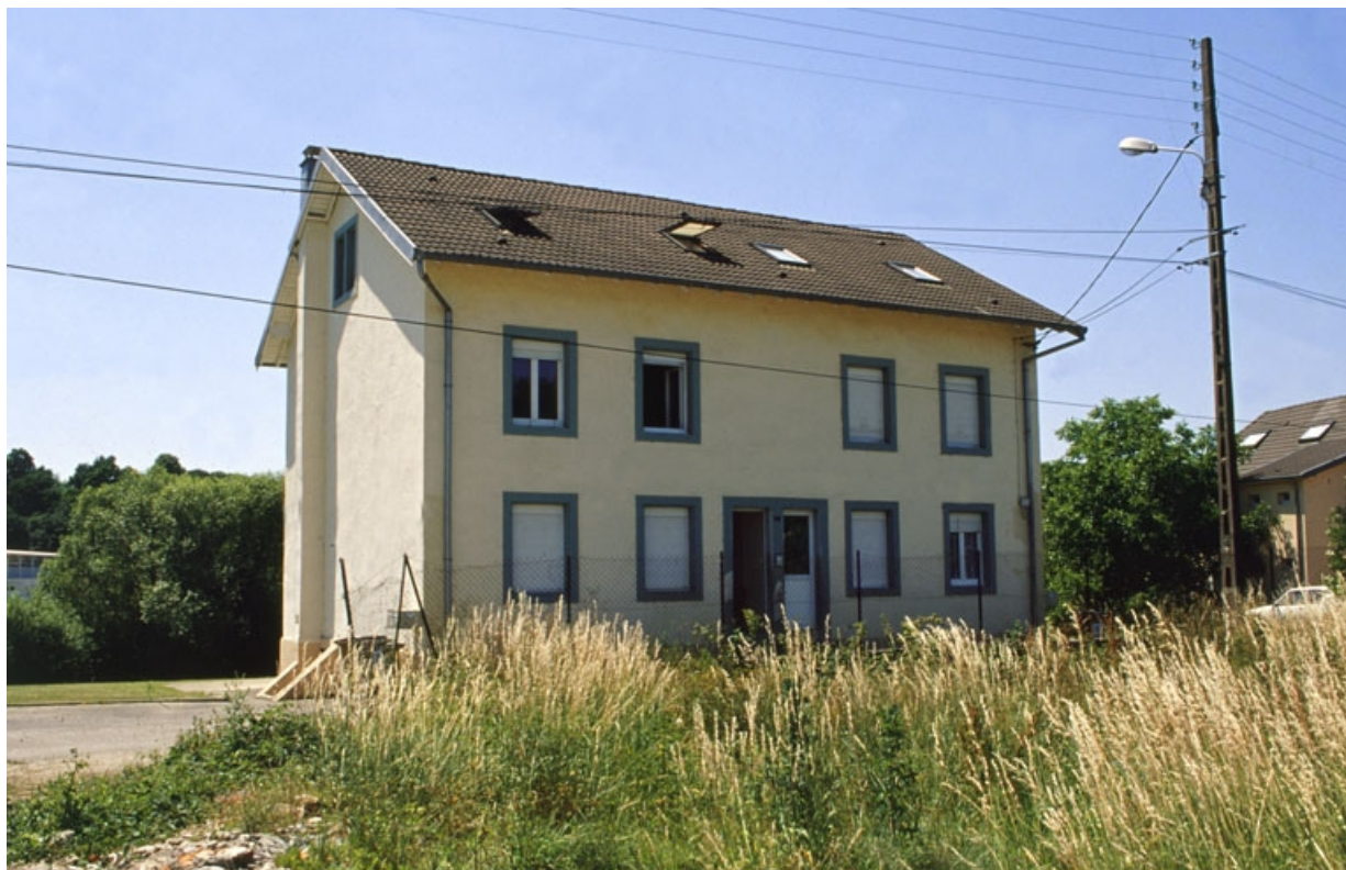
Façade antérieure d'un logement ouvrier rue de la Libération.