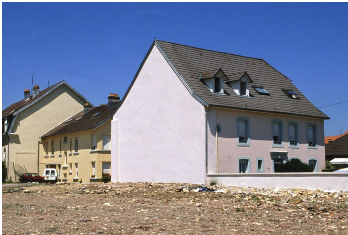
Vue d'ensemble des bâtiments subsistants depuis le sud.