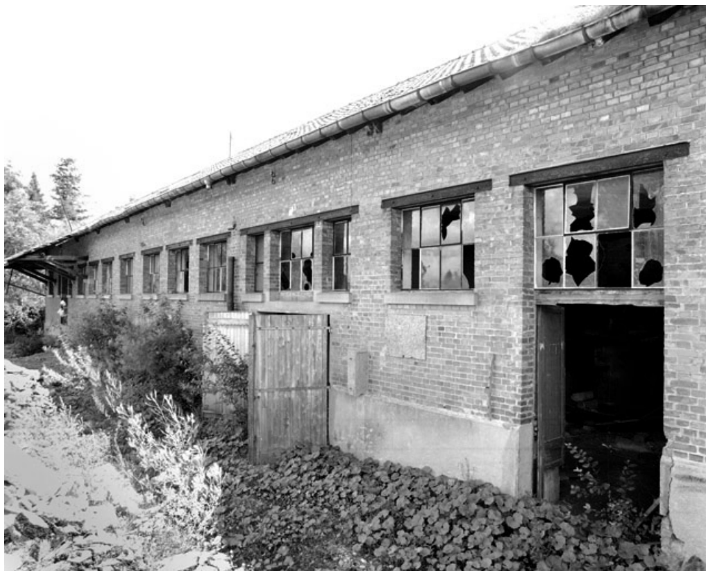
Détail de la façade nord de l'atelier de fabrication.

90, Montreux-Château, 38 rue Georges Helminger