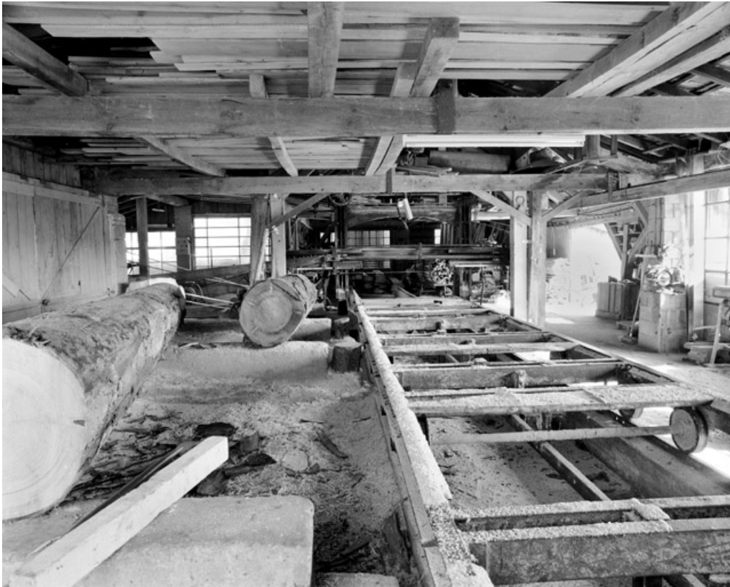
Chariot du châssis de scie.