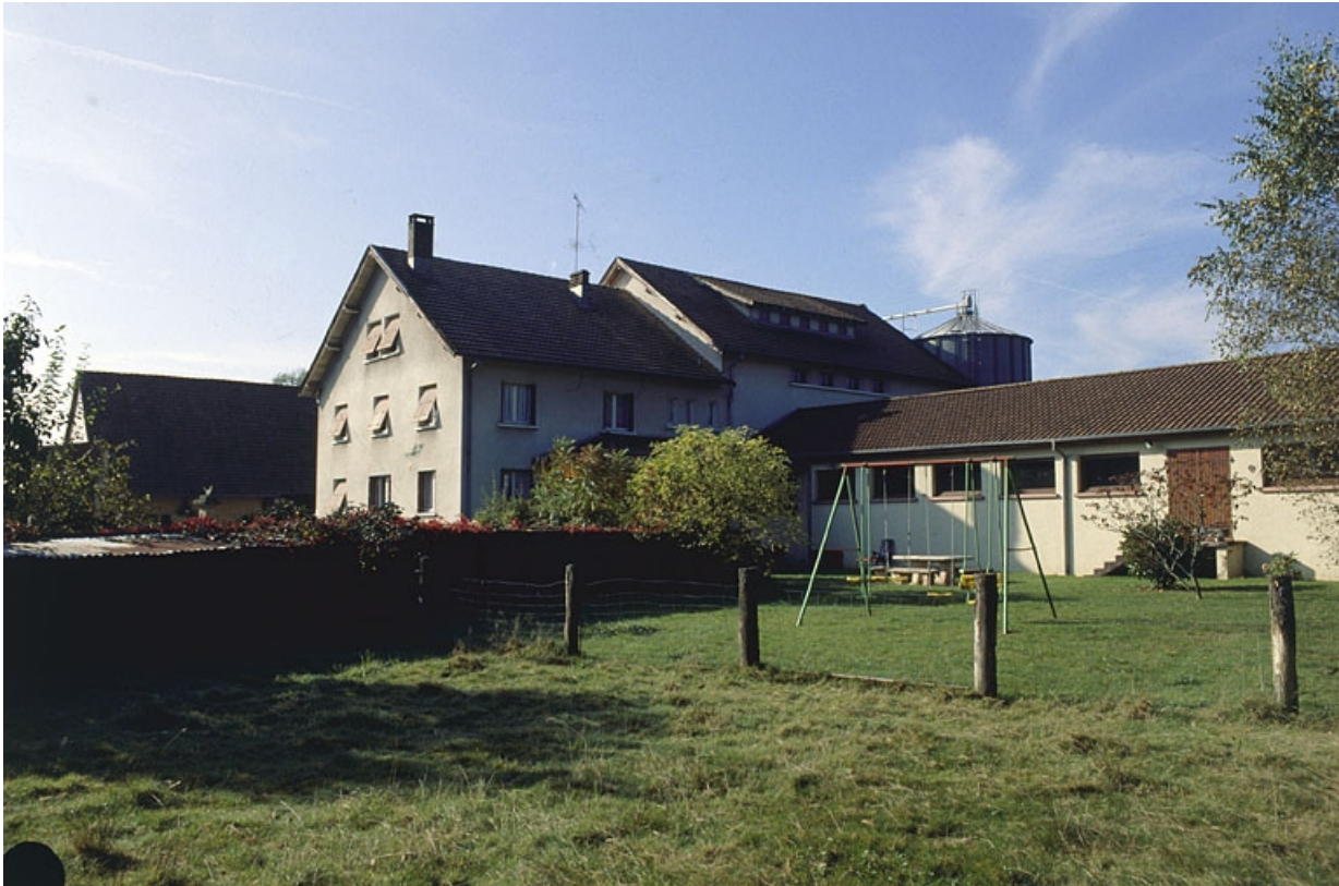
Façade postérieure du logement et de l'atelier de fabrication de la minoterie. 90, Bethonvilliers, 2 rue du Moulin