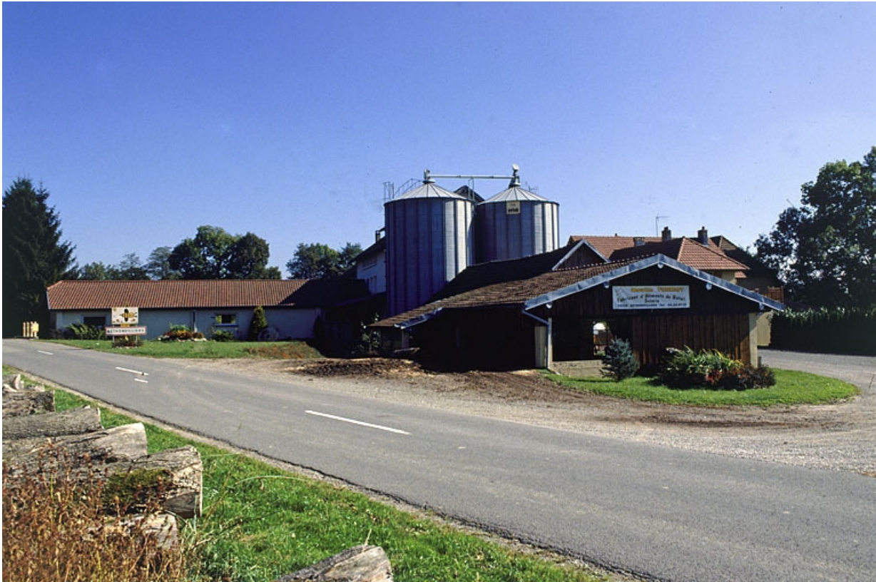
Magasin industriel, silos et scierie depuis l'ouest.