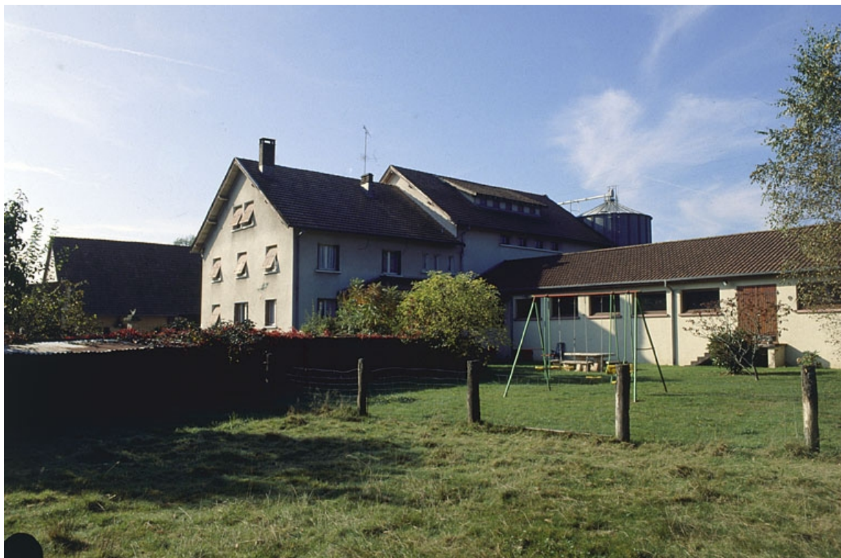
Façade postérieure du logement et de l'atelier de fabrication de la minoterie.