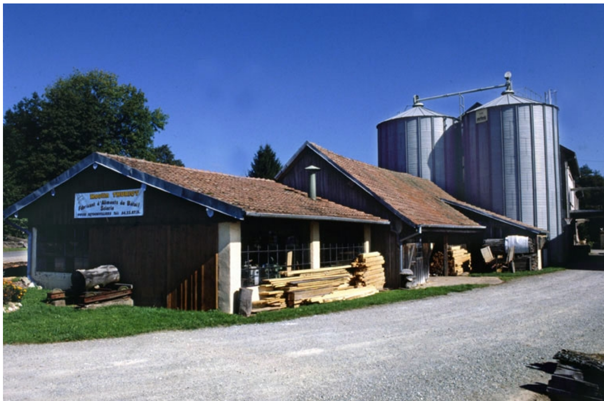
Atelier de scierie et silos de la minoterie.