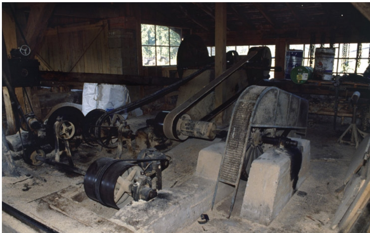
Système d'entraînement de la scie par poulies, courroies, bielle et manivelle. 90, Bethonvilliers, 2 rue du Moulin