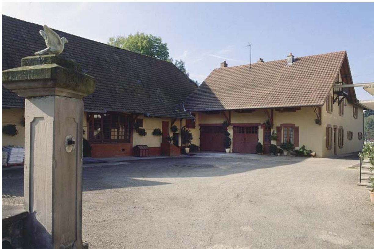
Atelier de fabrication (alimentation pour bétail) et logement ouvrier.