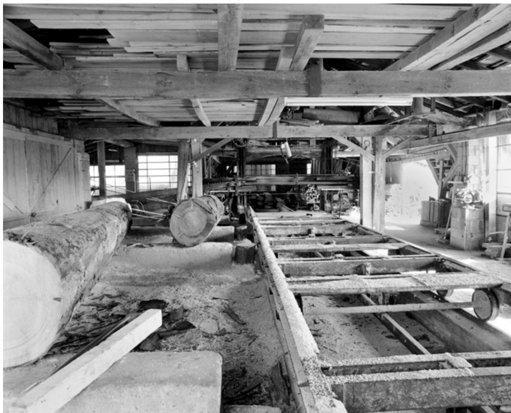
Chariot du châssis de scie.