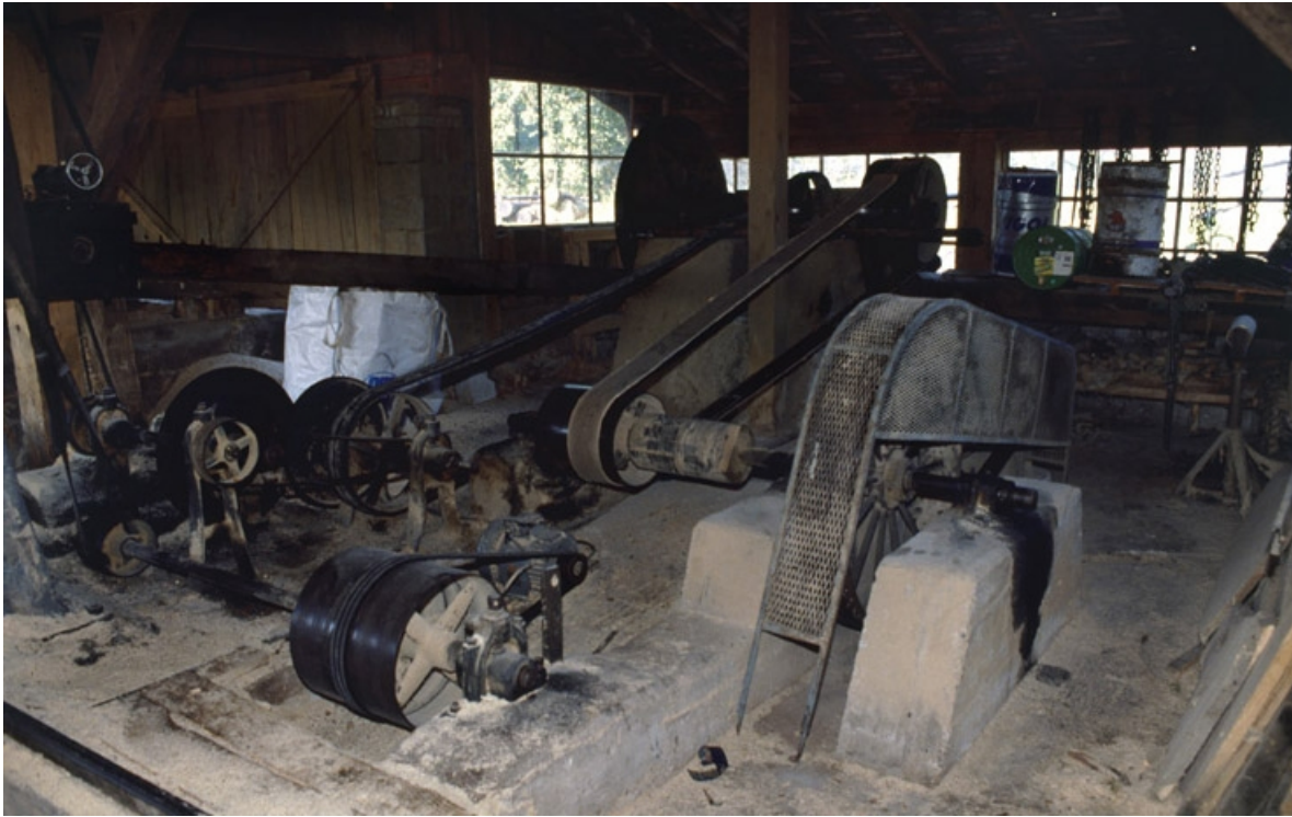
Système d'entraînement de la scie par poulies, courroies, bielle et manivelle. 90, Bethonvilliers, 2 rue du Moulin