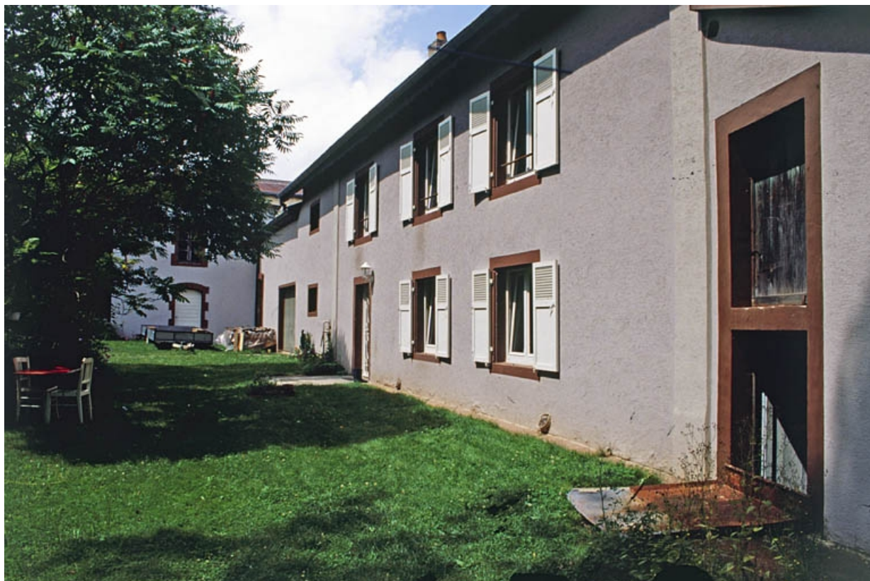
Bâtiment d'eau et atelier de fabrication (au fond) et logement.