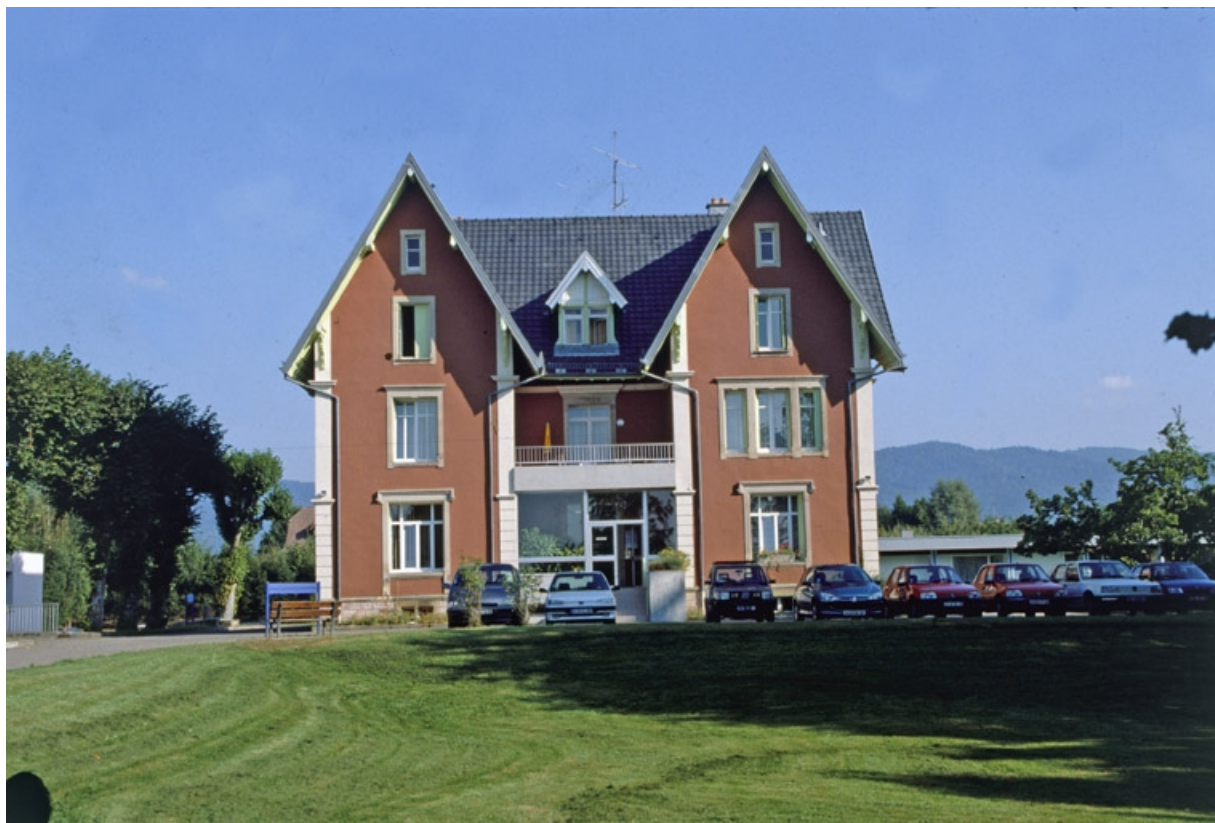
Façade sud-est du logement patronal.