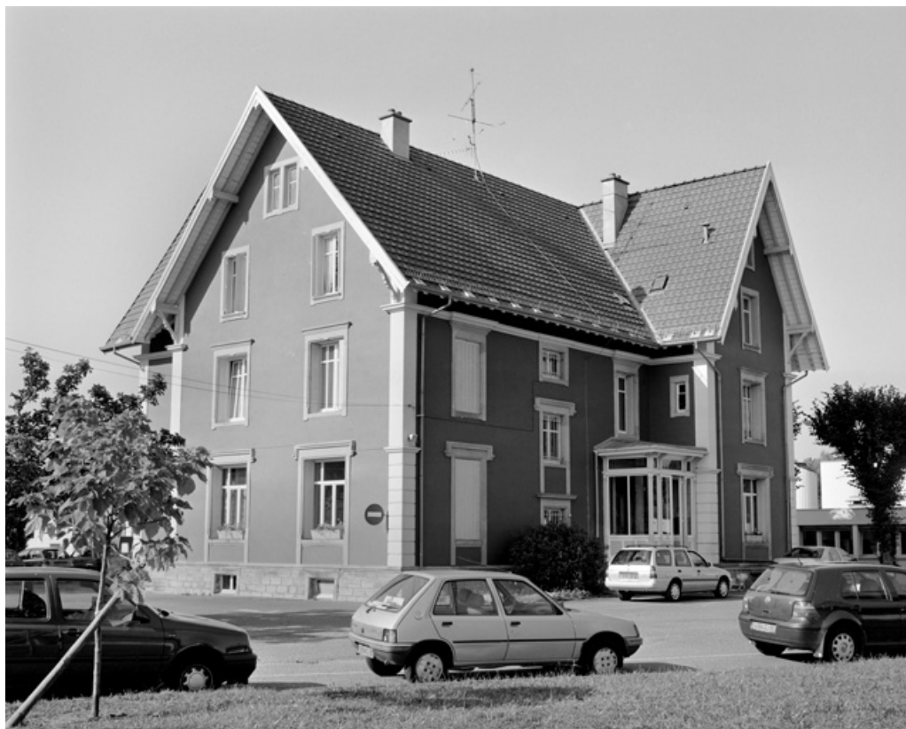
Le logement patronal depuis le nord. 90, Chaux chemin Tournerie