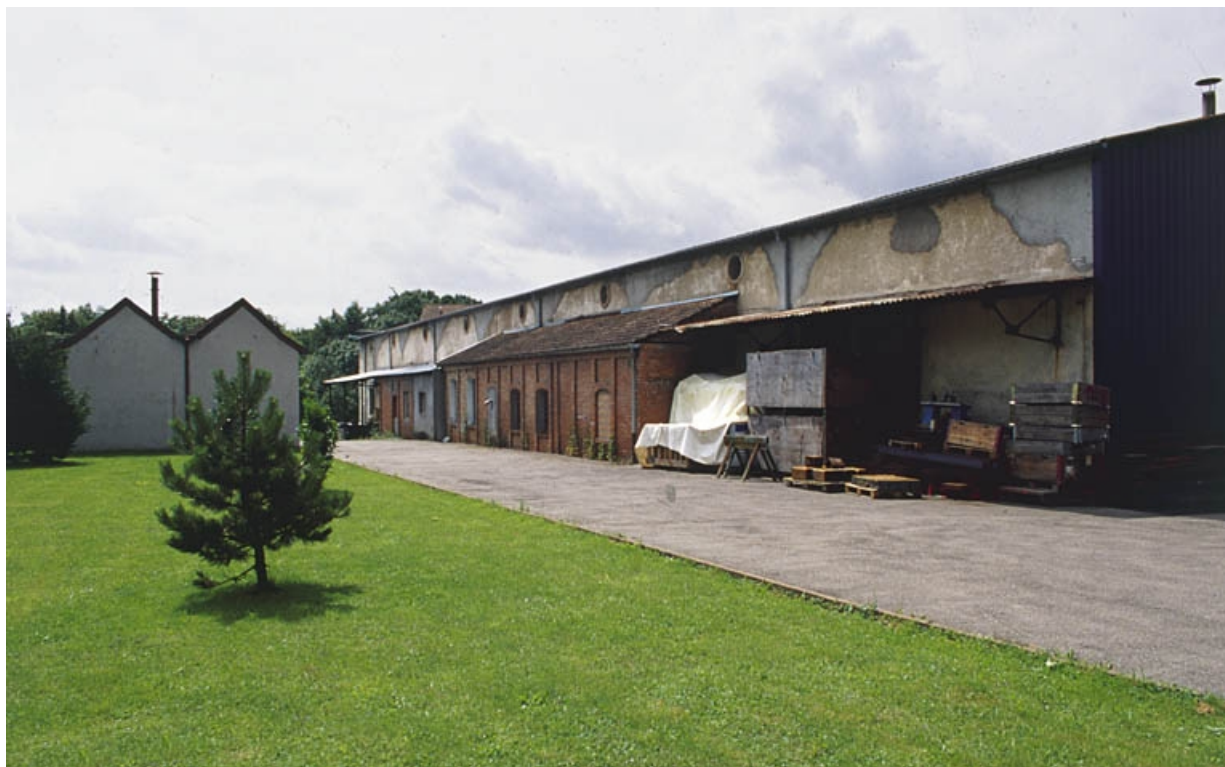
Façade postérieure des ateliers de fabrication.