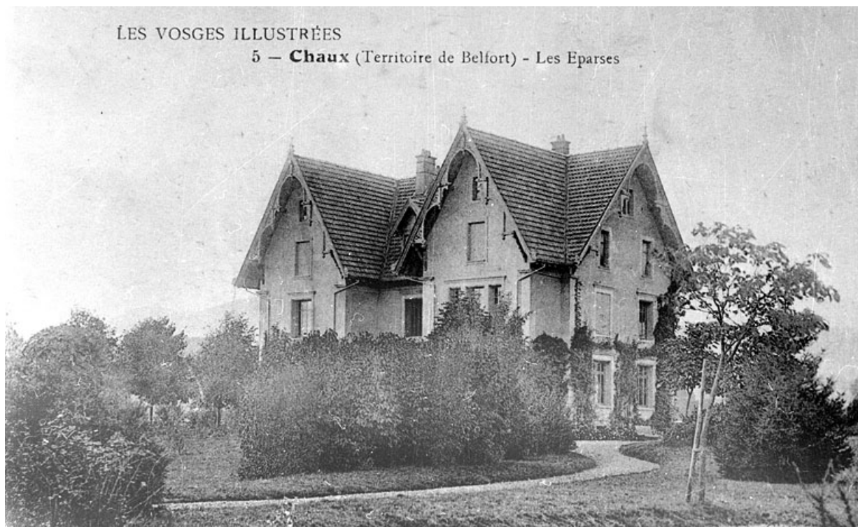
Chaux (Territoire de Belfort). Les Eparses.