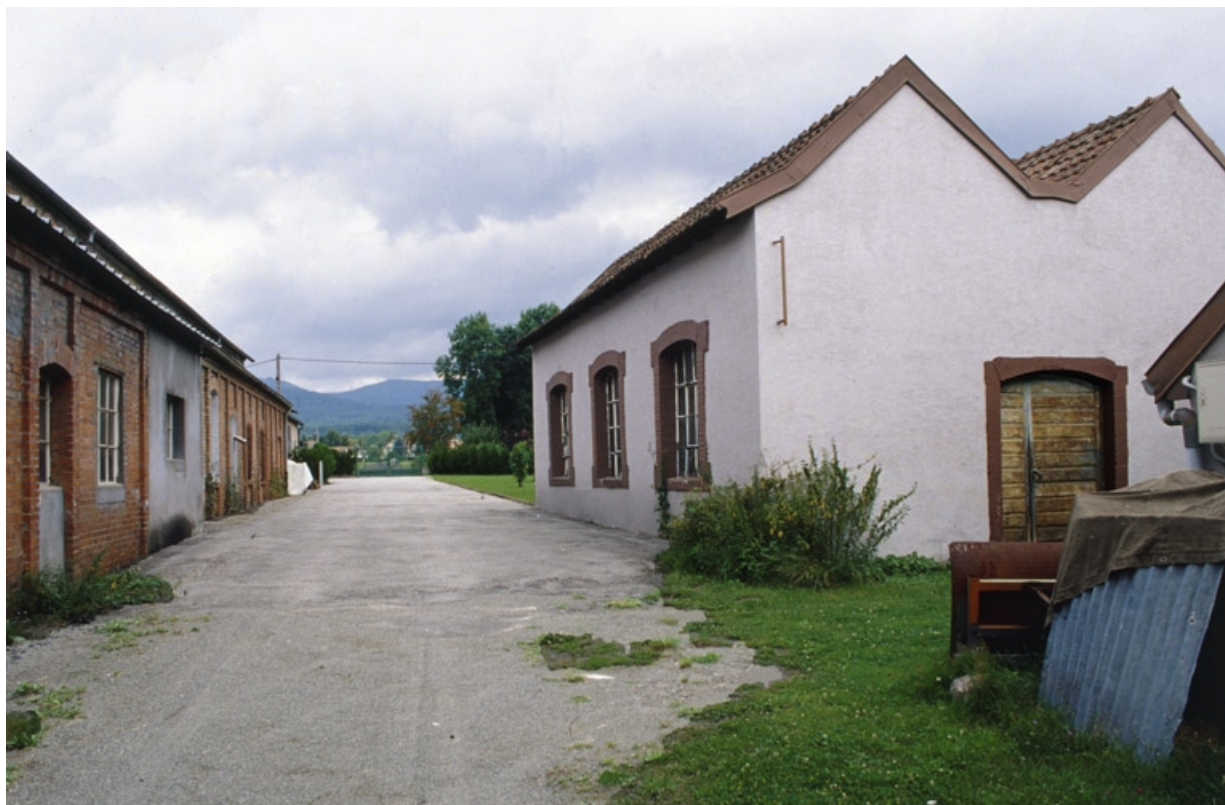
Façade de l'atelier de fabrication (à gauche) et atelier de réparation (à droite). 90, Chaux chemin Tournerie