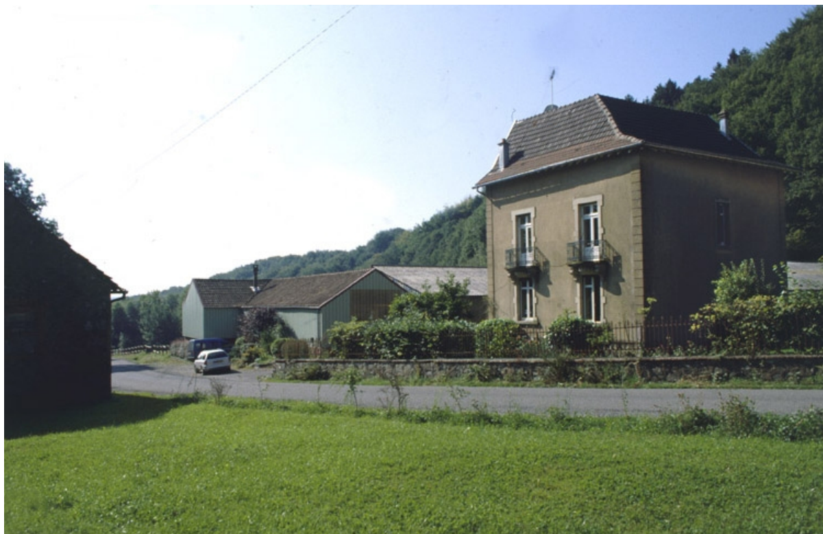
Vue d'ensemble depuis le nord.