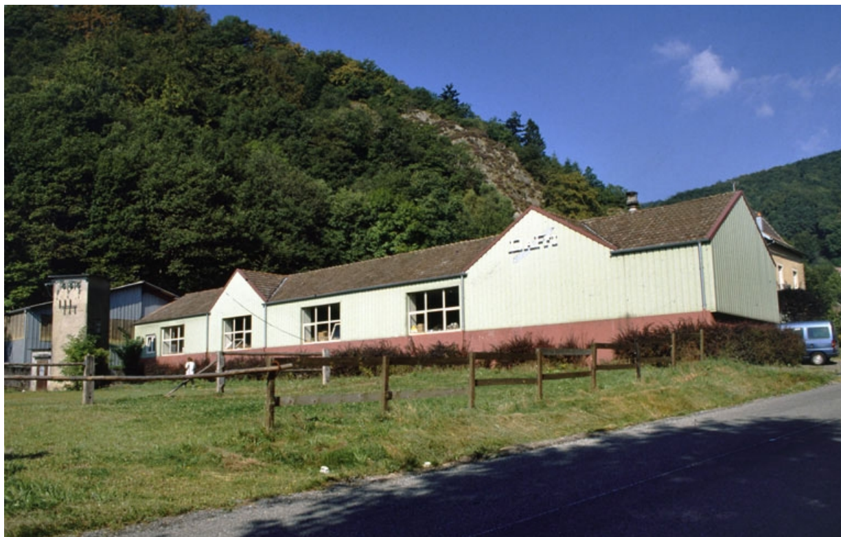
Atelier de fabrication et logement patronal depuis le sud-est.