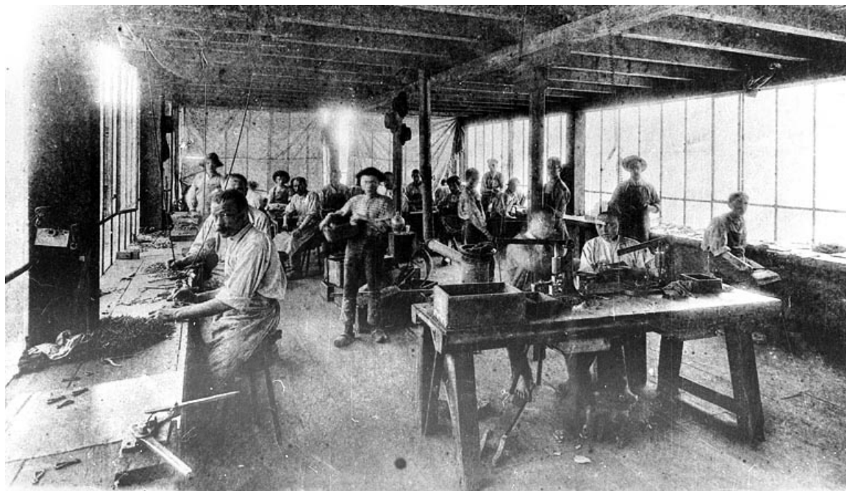
738 — AUXELLES-HAUT — Usine Schwab Frères La fabrication des porte-mousquetons — Salle des monteurs