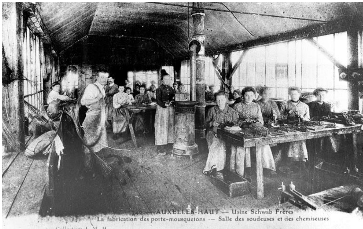
Auxelles-Haut - Usines Schwab Frères. La fabrication des porte-mousquetons. Salle des soudeuses et des chemiseuses. 90, Auxelles-Haut, 56 rue des Roches