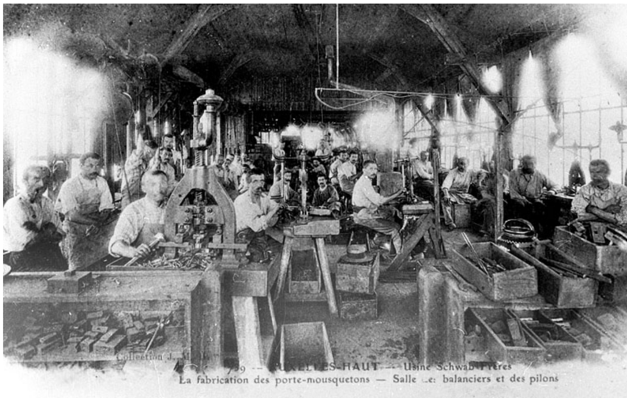
Auxelles-Haut - Usines Schwab Frères. La fabrication des porte-mousquetons. Salle des balanciers et des pilons. 90, Auxelles-Haut, 56 rue des Roches