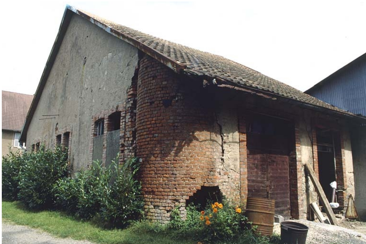
Salle des machines et vestiges de la cheminée.

90, Petitefontaine, 17 rue des Marronniers