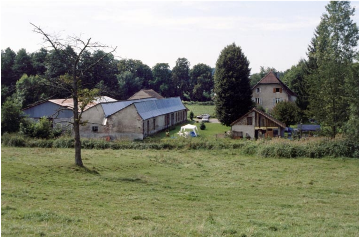
Atelier de fabrication et moulin depuis le nord.

90, Petitefontaine, 17 rue des Marronniers