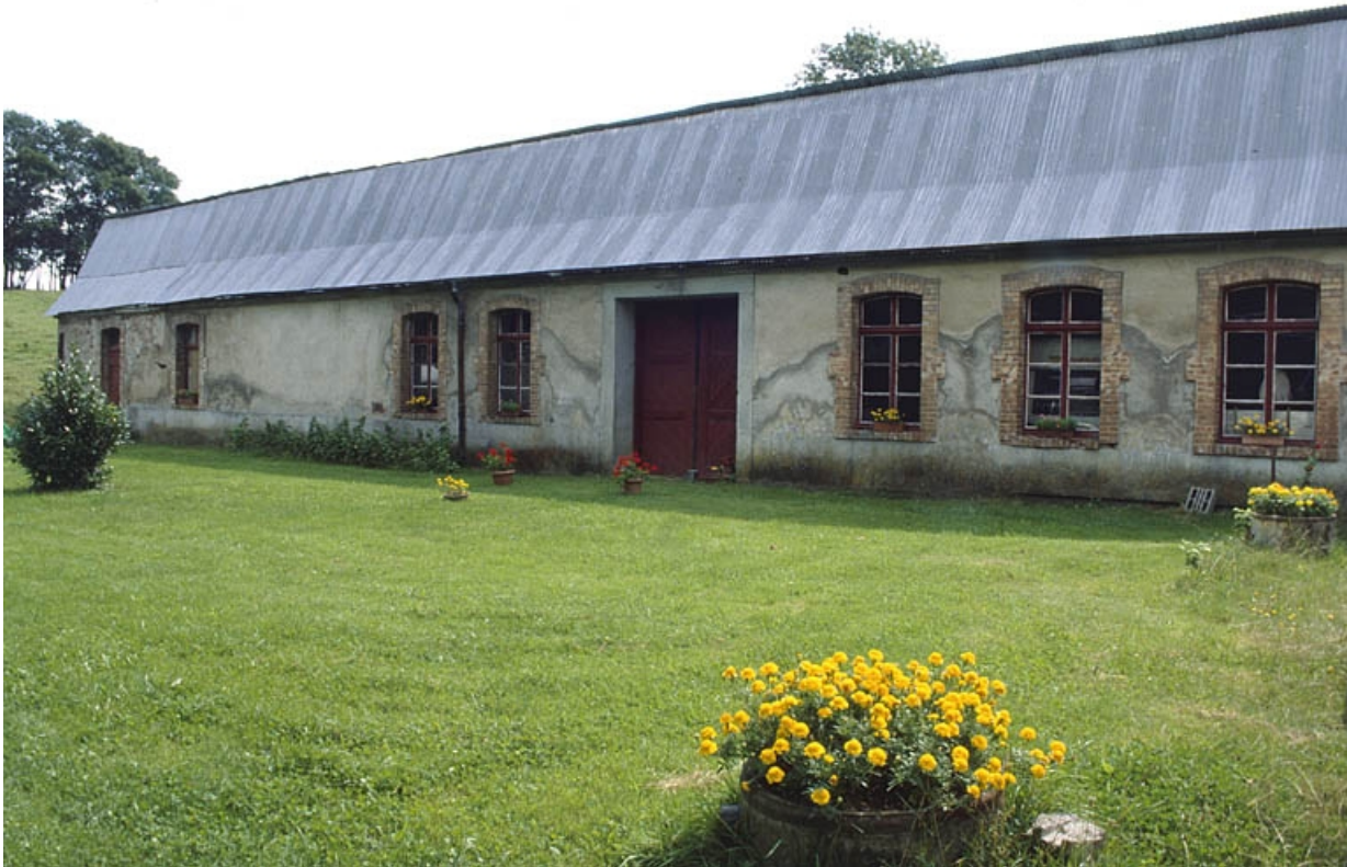
Façade (remaniée) de l'atelier de fabrication.

90, Petitefontaine, 17 rue des Marronniers