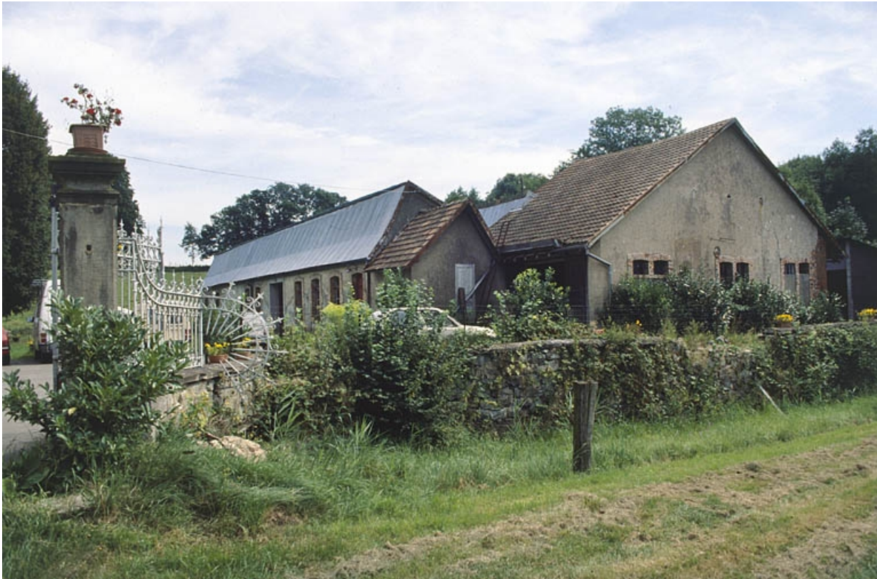
Atelier de fabrication et salle des machines depuis l'entrée.

90, Petitefontaine, 17 rue des Marronniers