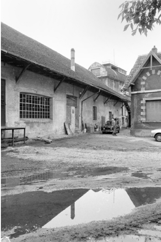
Façade sur cour de l'atelier de nettoyage et d'embouteillage en 1980. SRI. Enquête régionale sur les bâtiments industriels (1979-1981).

90, Lachapelle-sous-Rougemont, 4, 6 rue du Général de Gaulle