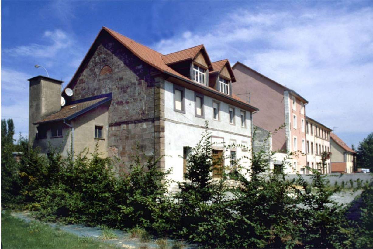
Façade postérieure des ateliers de fabrication.

90, Lachapelle-sous-Rougemont, 4, 6 rue du Général de Gaulle