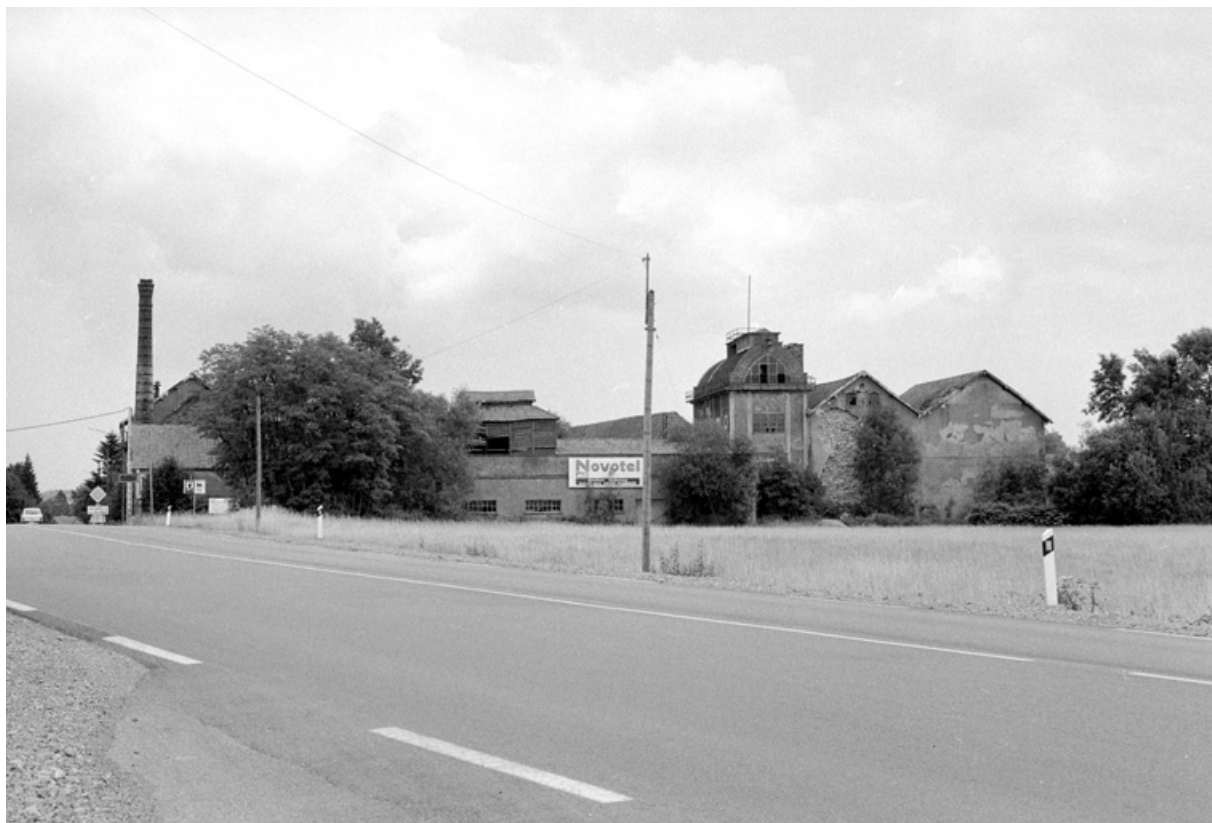
Vue d'ensemble en 1980. SRI. Enquête régionale sur les bâtiments industriels (1979-1981). 90, Lachapelle-sous-Rougemont, 4, 6 rue du Général de Gaulle