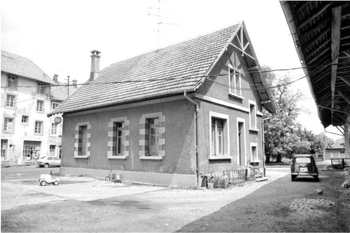
Bureaux en 1980. SRI. Enquête régionale sur les bâtiments industriels (1979-1981). 90, Lachapelle-sous-Rougemont, 4, 6 rue du Général de Gaulle