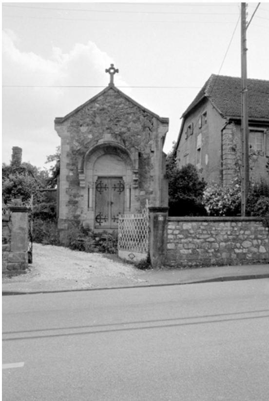
Chapelle en 1980. SRI. Enquête régionale sur les bâtiments industriels (1979-1981).

90, Lachapelle-sous-Rougemont, 4, 6 rue du Général de Gaulle