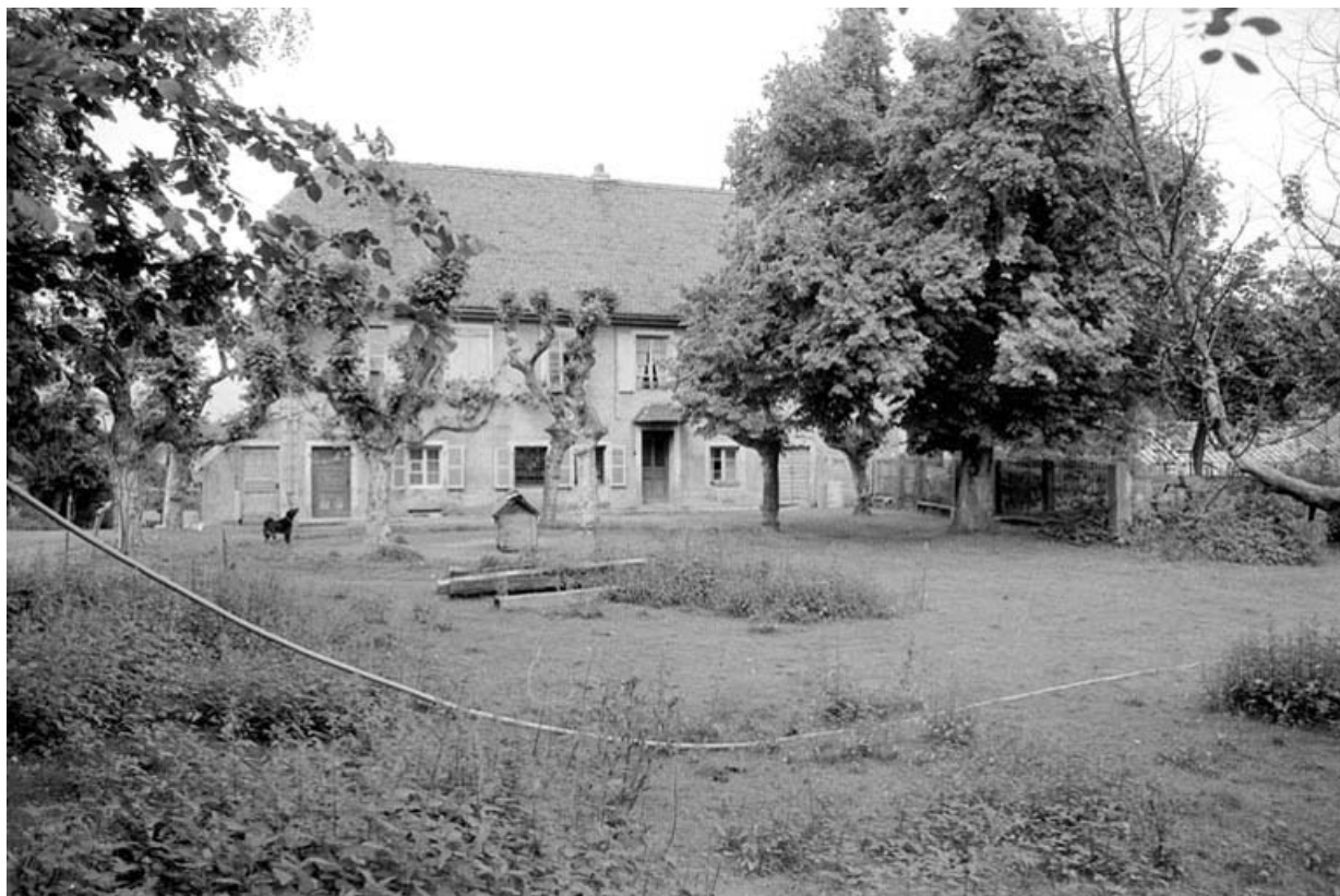
Logement patronal en 1980. SRI. Enquête régionale sur les bâtiments industriels (1979-1981). 90, Lachapelle-sous-Rougemont, 4, 6 rue du Général de Gaulle