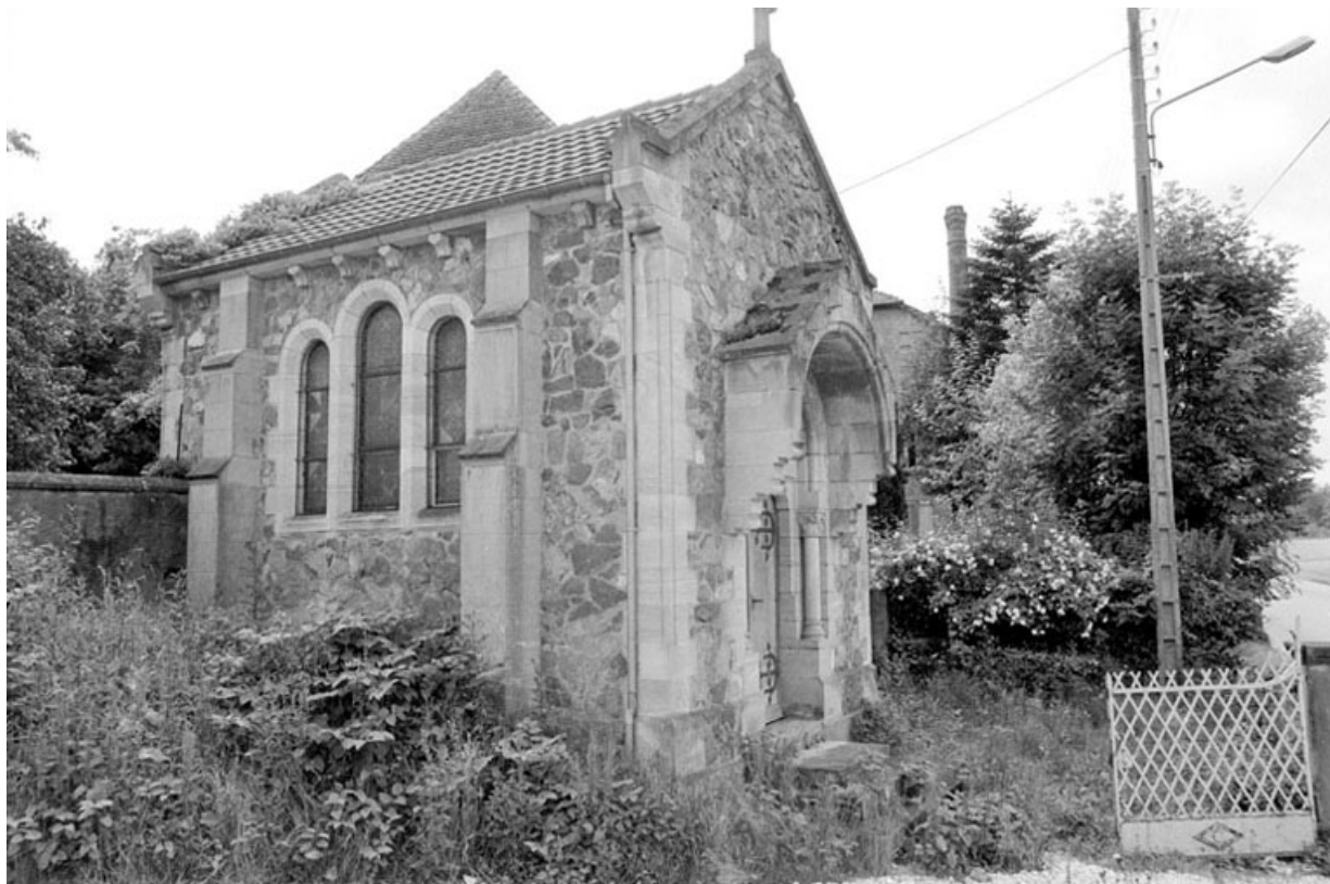
La chapelle vue de trois quarts en 1980. SRI. Enquête régionale sur les bâtiments industriels (1979-1981). 90, Lachapelle-sous-Rougemont, 4, 6 rue du Général de Gaulle