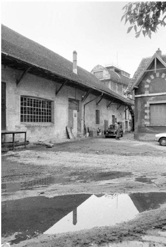
Façade sur cour de l'atelier de nettoyage et d'embouteillage en 1980. SRI. Enquête régionale sur les bâtiments industriels (1979-1981).

90, Lachapelle-sous-Rougemont, 4, 6 rue du Général de Gaulle