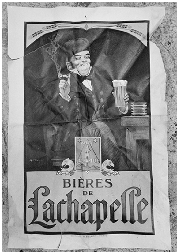
Affiche publicitaire. SRI. Enquête régionale sur les bâtiments industriels (1979-1981).

90, Lachapelle-sous-Rougemont, 4, 6 rue du Général de Gaulle