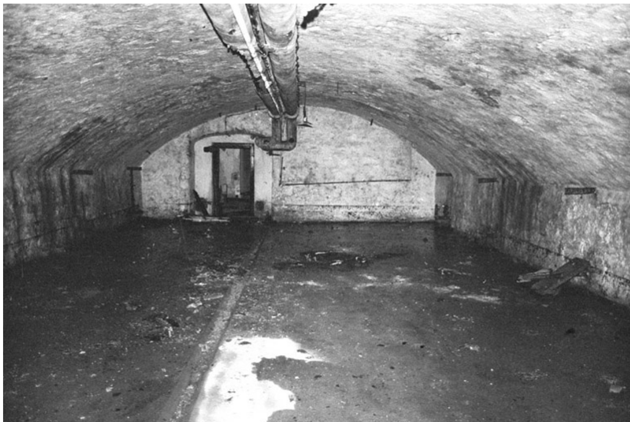
Cave en 1980. SRI. Enquête régionale sur les bâtiments industriels (1979-1981). 90, Lachapelle-sous-Rougemont, 4, 6 rue du Général de Gaulle