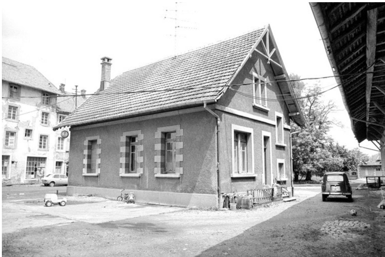
Bureaux en 1980. SRI. Enquête régionale sur les bâtiments industriels (1979-1981).

90, Lachapelle-sous-Rougemont, 4, 6 rue du Général de Gaulle