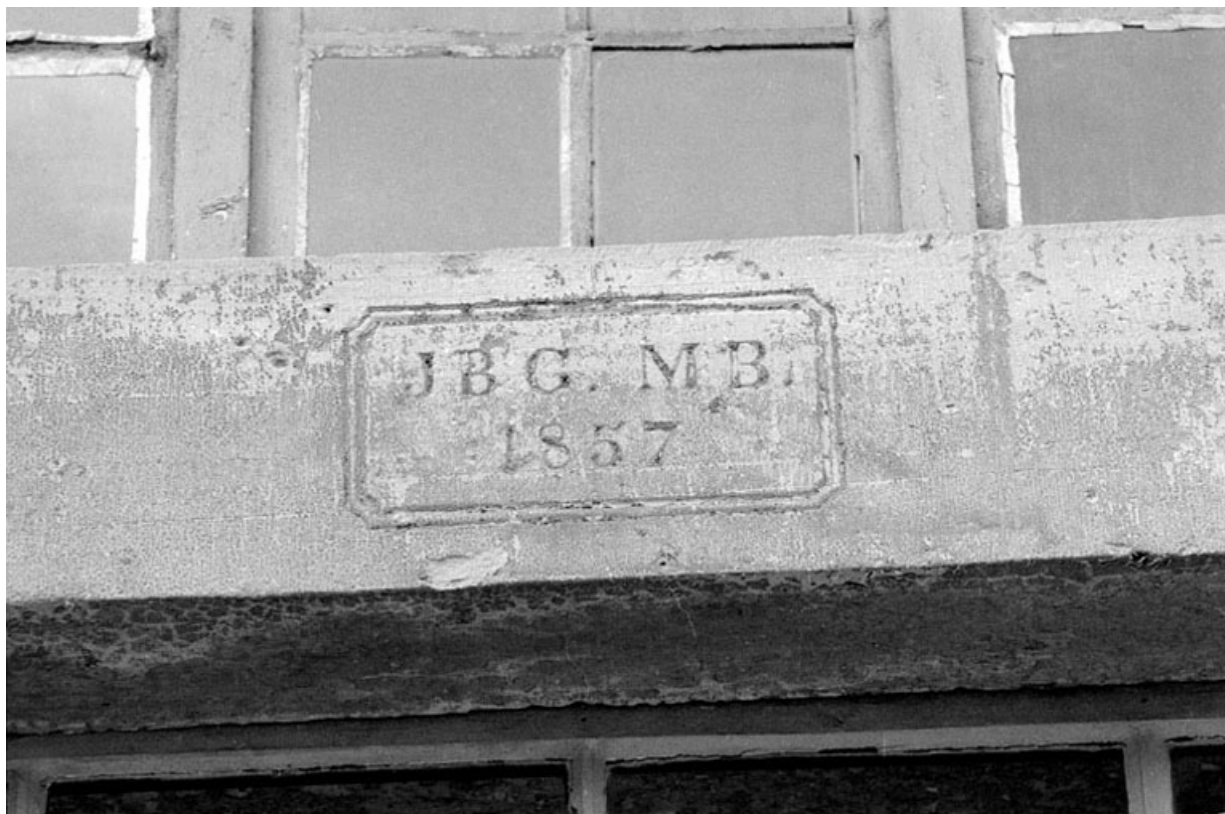
Cartouche gravé sur un linteau de porte de l'atelier de fabrication (eaux gazeuses). SRI. Enquête régionale sur les bâtiments industriels (1979-1981).

90, Lachapelle-sous-Rougemont, 4, 6 rue du Général de Gaulle