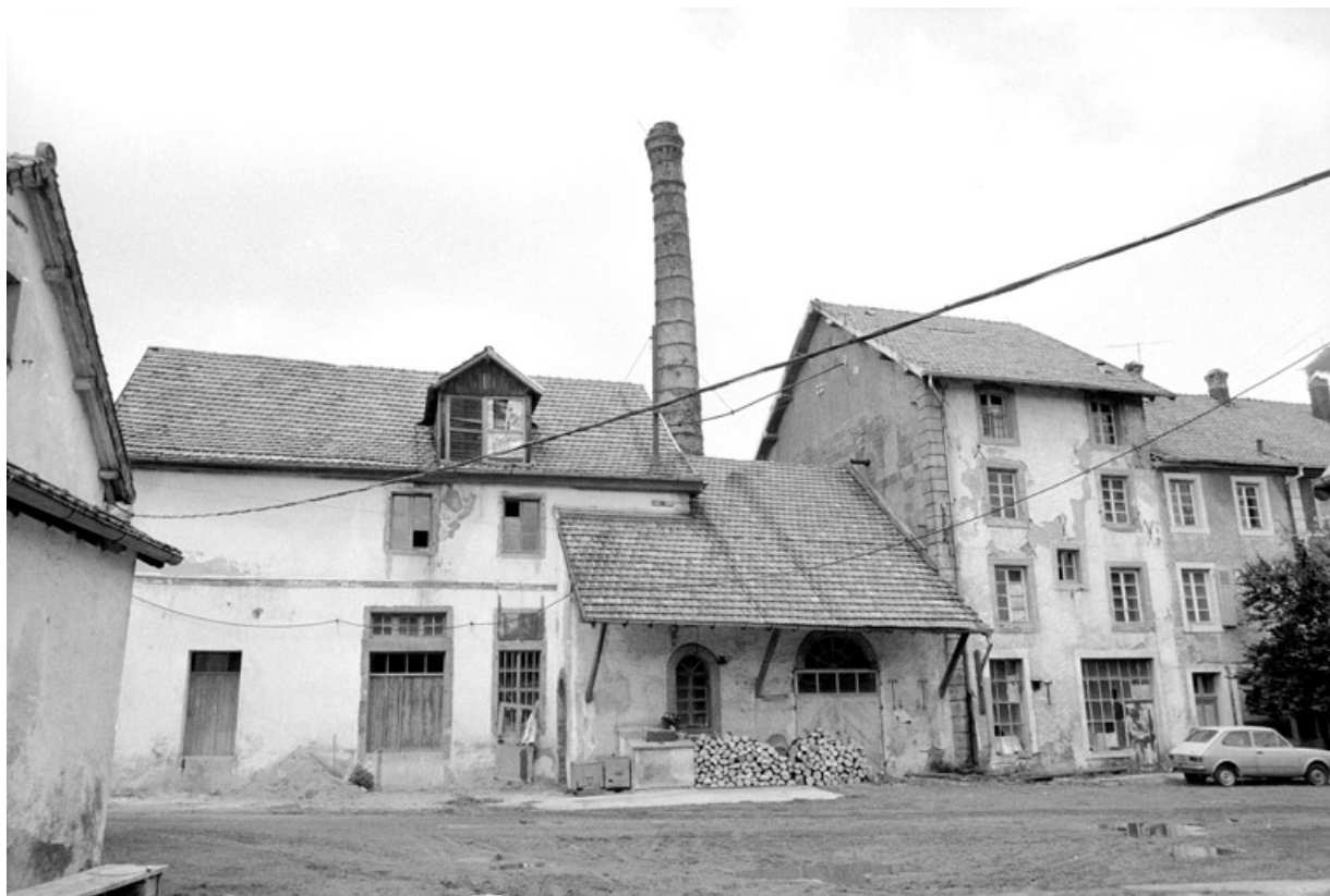
De gauche à droite : atelier de fabrication (eaux gazeuses), salle des machines et chaufferie, et salle de brassage en 1980. SRI. Enquête régionale sur les bâtiments industriels (1979-1981). 90, Lachapelle-sous-Rougemont, 4, 6 rue du Général de Gaulle