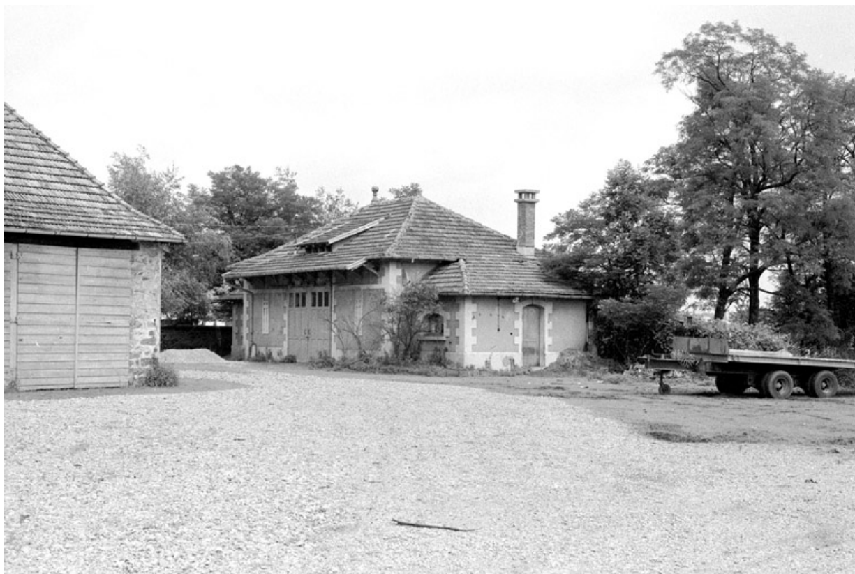
Garage en 1980. SRI. Enquête régionale sur les bâtiments industriels (1979-1981).

90, Lachapelle-sous-Rougemont, 4, 6 rue du Général de Gaulle