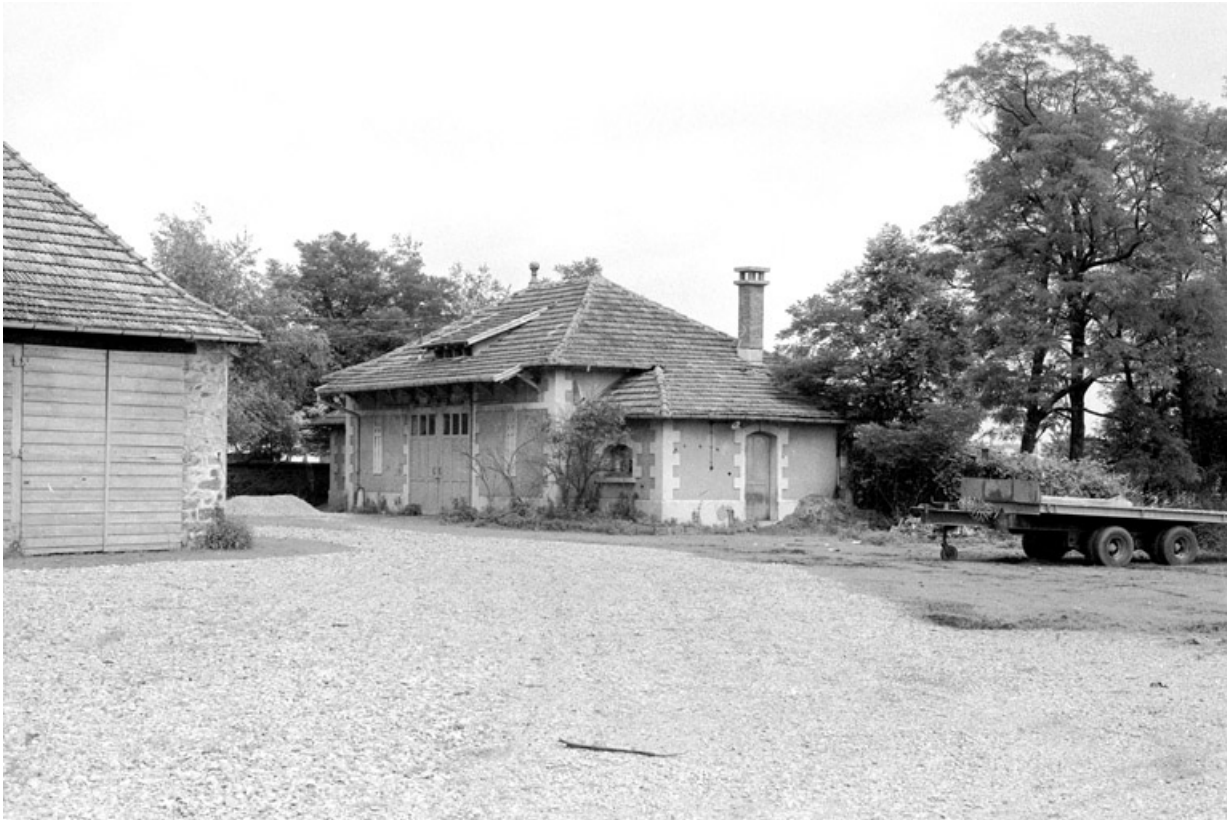
Garage en 1980. SRI. Enquête régionale sur les bâtiments industriels (1979-1981).

90, Lachapelle-sous-Rougemont, 4, 6 rue du Général de Gaulle