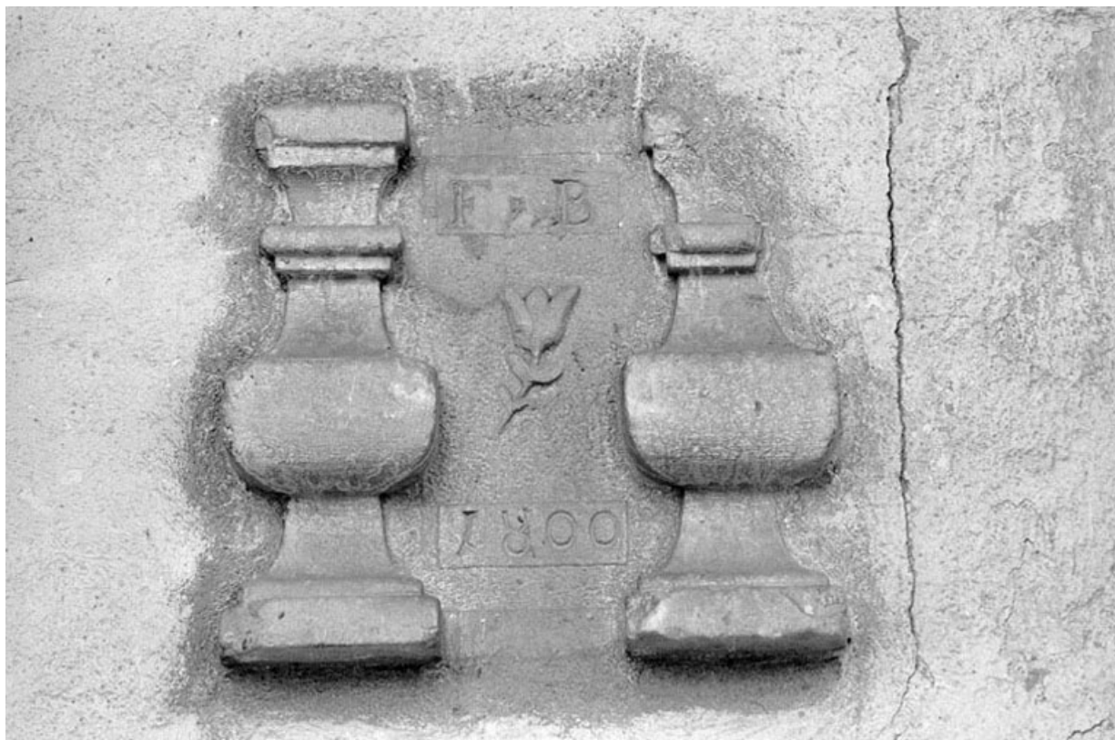
Pierre sculptée (employée) sur le bâtiment de nettoyage et d'embouteillage en 1980. SRI. Enquête régionale sur les bâtiments industriels (1979-1981).

90, Lachapelle-sous-Rougemont, 4, 6 rue du Général de Gaulle