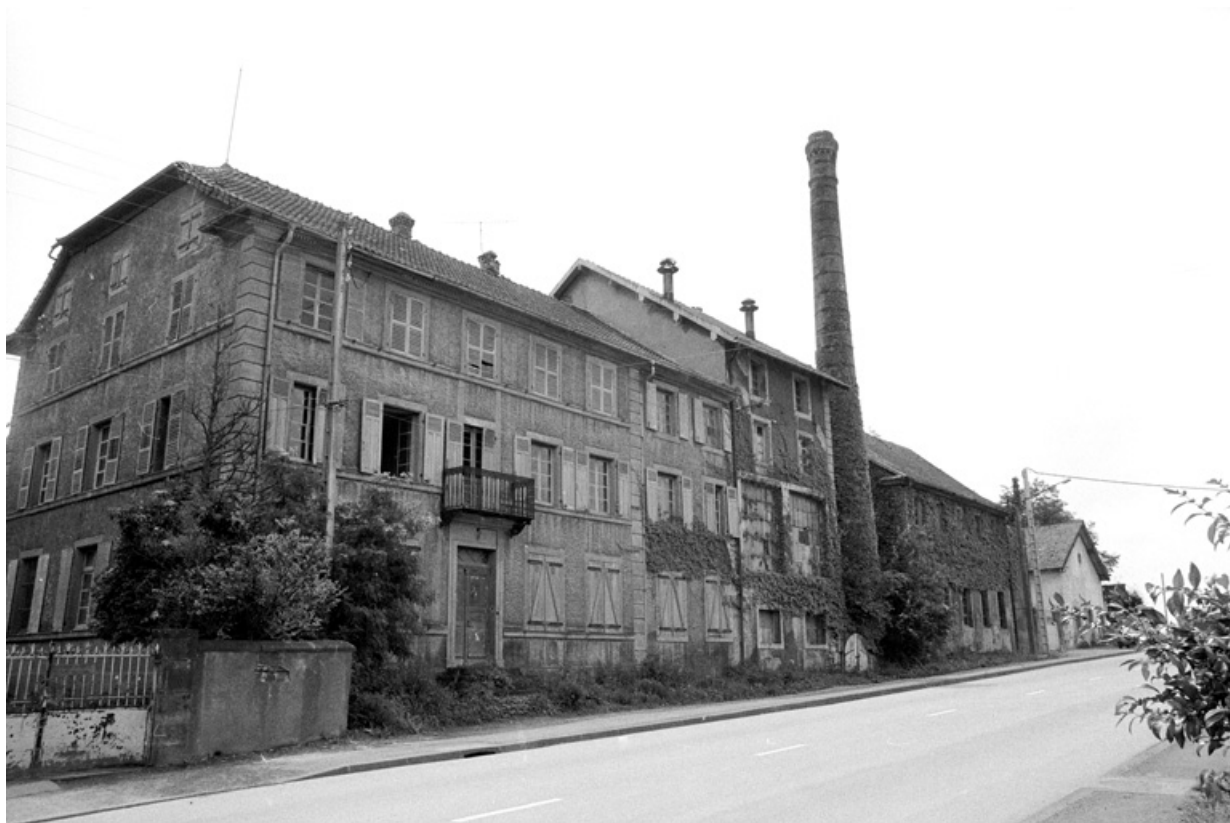
Façades sur rue en 1980. SRI. Enquête régionale sur les bâtiments industriels (1979-1981). 90, Lachapelle-sous-Rougemont, 4, 6 rue du Général de Gaulle