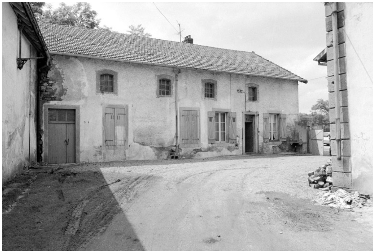
La conciergerie en 1980. SRI. Enquête régionale sur les bâtiments industriels (1979-1981). 90, Lachapelle-sous-Rougemont, 4, 6 rue du Général de Gaulle