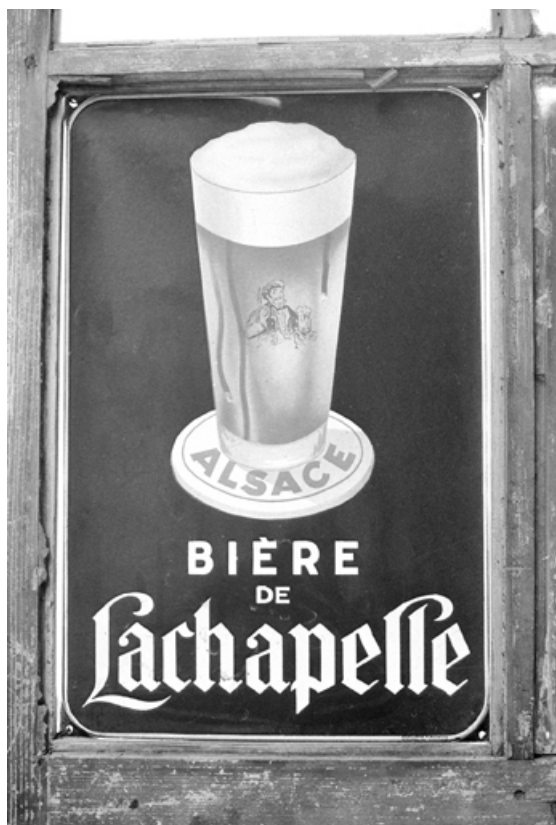
Plaque émaillée publicitaire. SRI. Enquête régionale sur les bâtiments industriels (1979-1981). 90, Lachapelle-sous-Rougemont, 4, 6 rue du Général de Gaulle