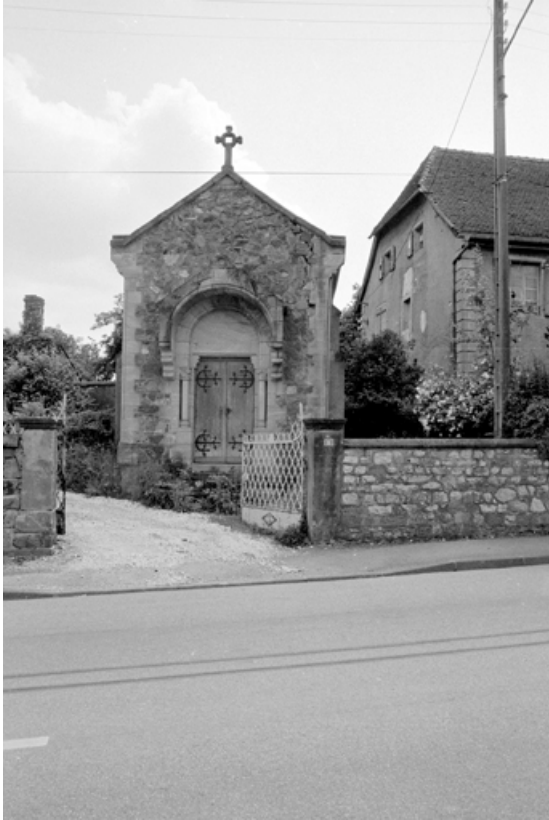
Chapelle en 1980. SRI. Enquête régionale sur les bâtiments industriels (1979-1981).

90, Lachapelle-sous-Rougemont, 4, 6 rue du Général de Gaulle