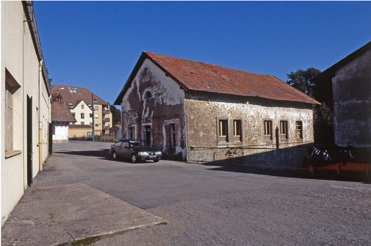
L'atelier de forge vu de trois quarts.

90, Rougemont-le-Château, 8, 10 route de Leval