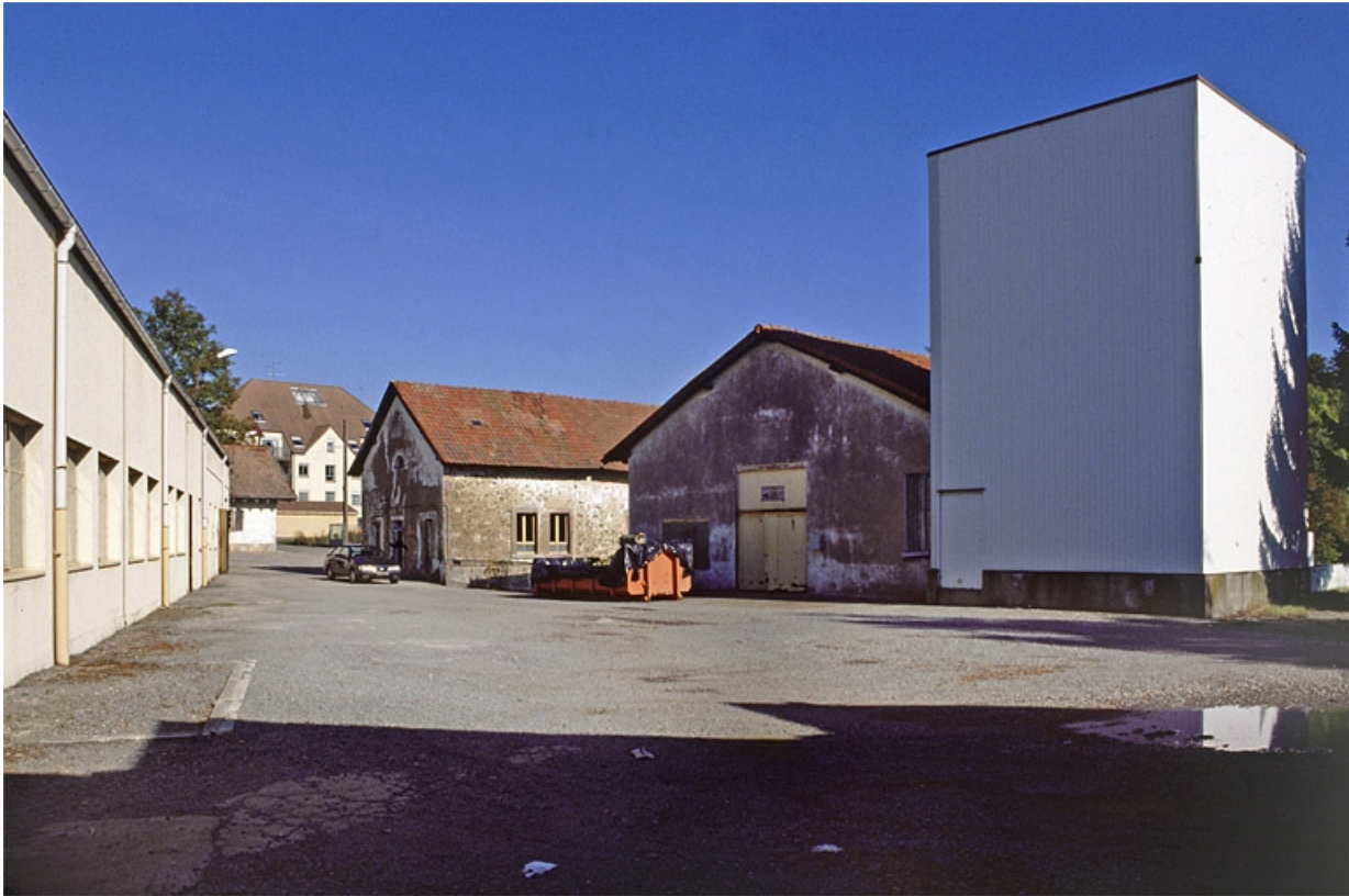
Atelier de fabrication, bureaux et forge depuis l'ouest.

90, Rougemont-le-Château, 8, 10 route de Leval