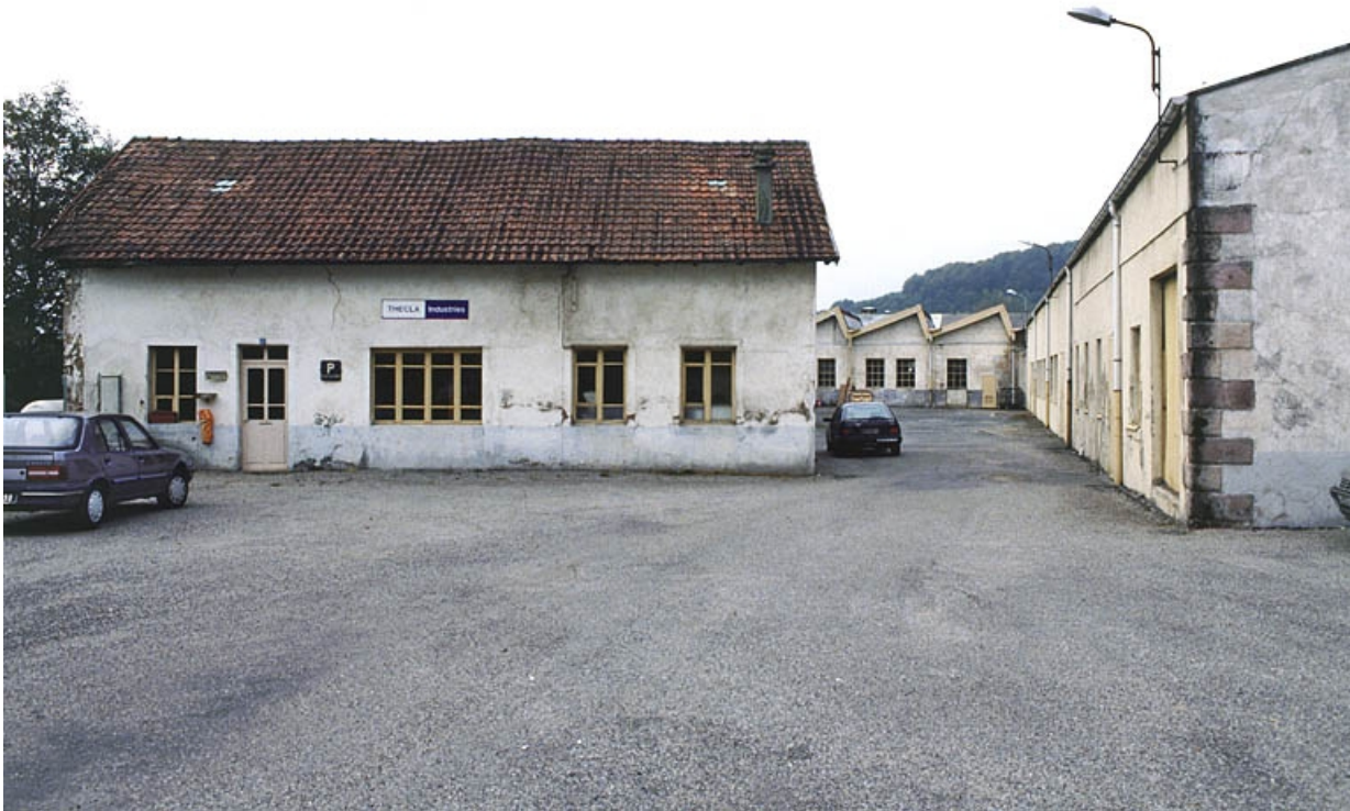
Bureau et ateliers de fabrication depuis le nord.

90, Rougemont-le-Château, 8, 10 route de Leval