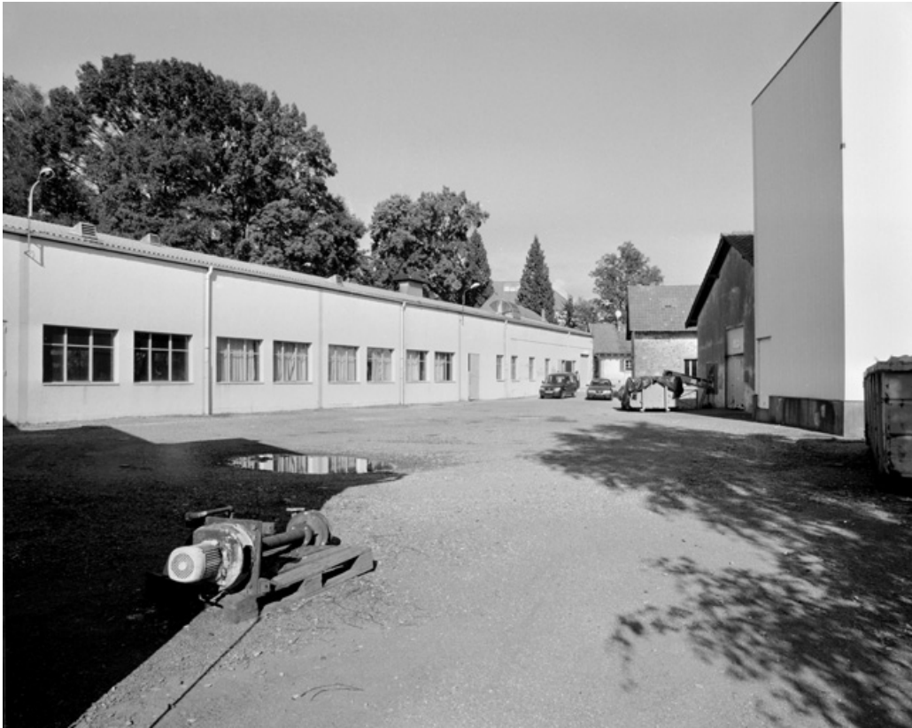
Atelier de fabrication depuis le sud-est.

90, Rougemont-le-Château, 8, 10 route de Leval