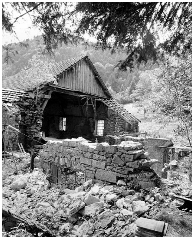
Vestiges de la salle des machines.