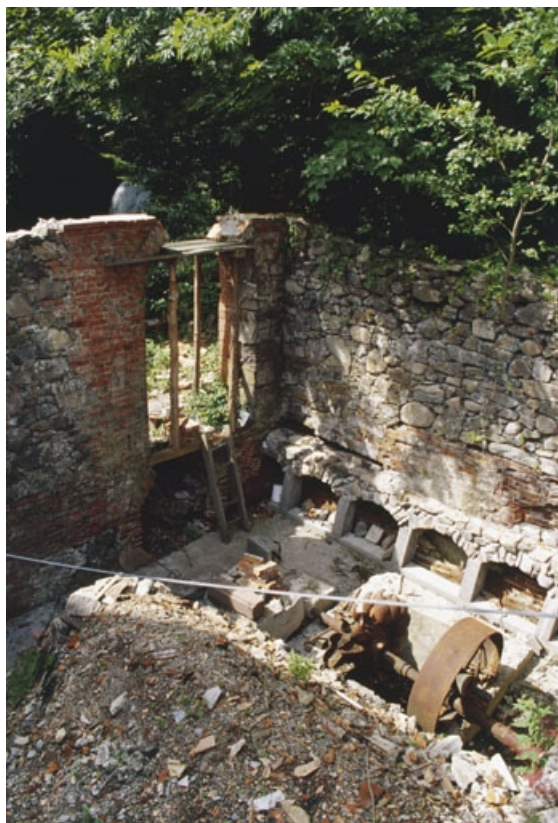
Vestiges de la salle des machines (postérieurement convertie en bâtiment d'eau ?).