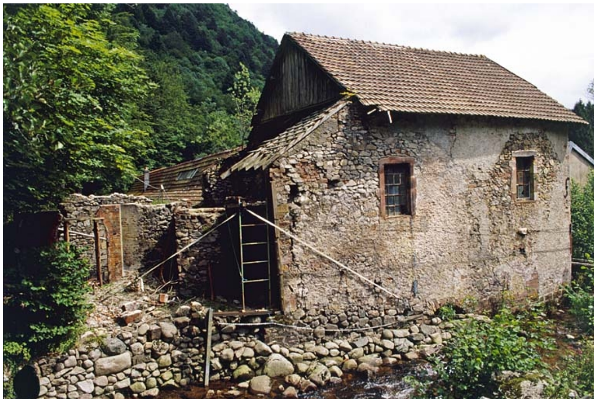
Vestiges de la salle des machines et bâtiment à usage inconnu.