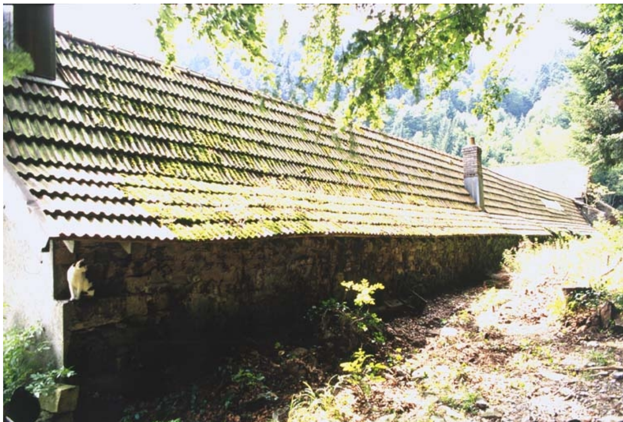
Versant nord (brisé) d'un shed.