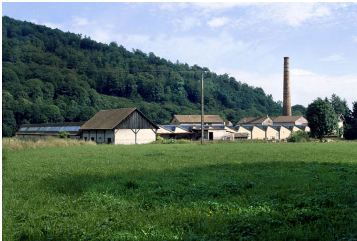
Vue d'ensemble depuis le nord-ouest.