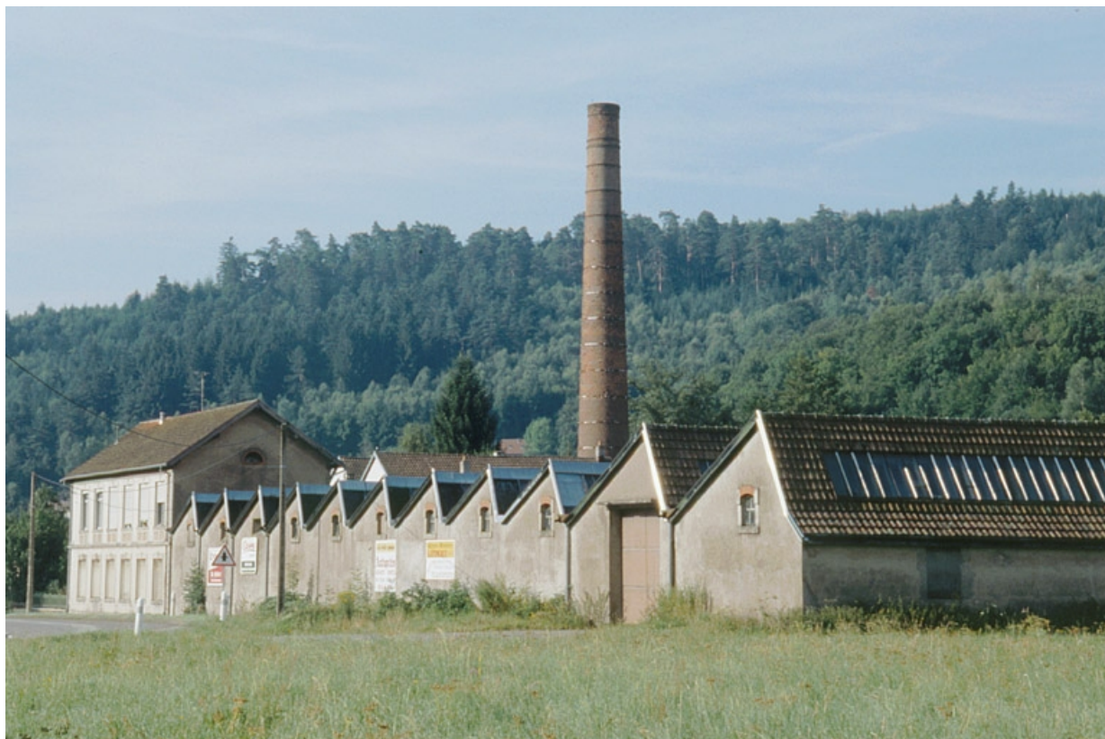
Façade sur la route départementale 465. 90, Lepuix R.D. 465