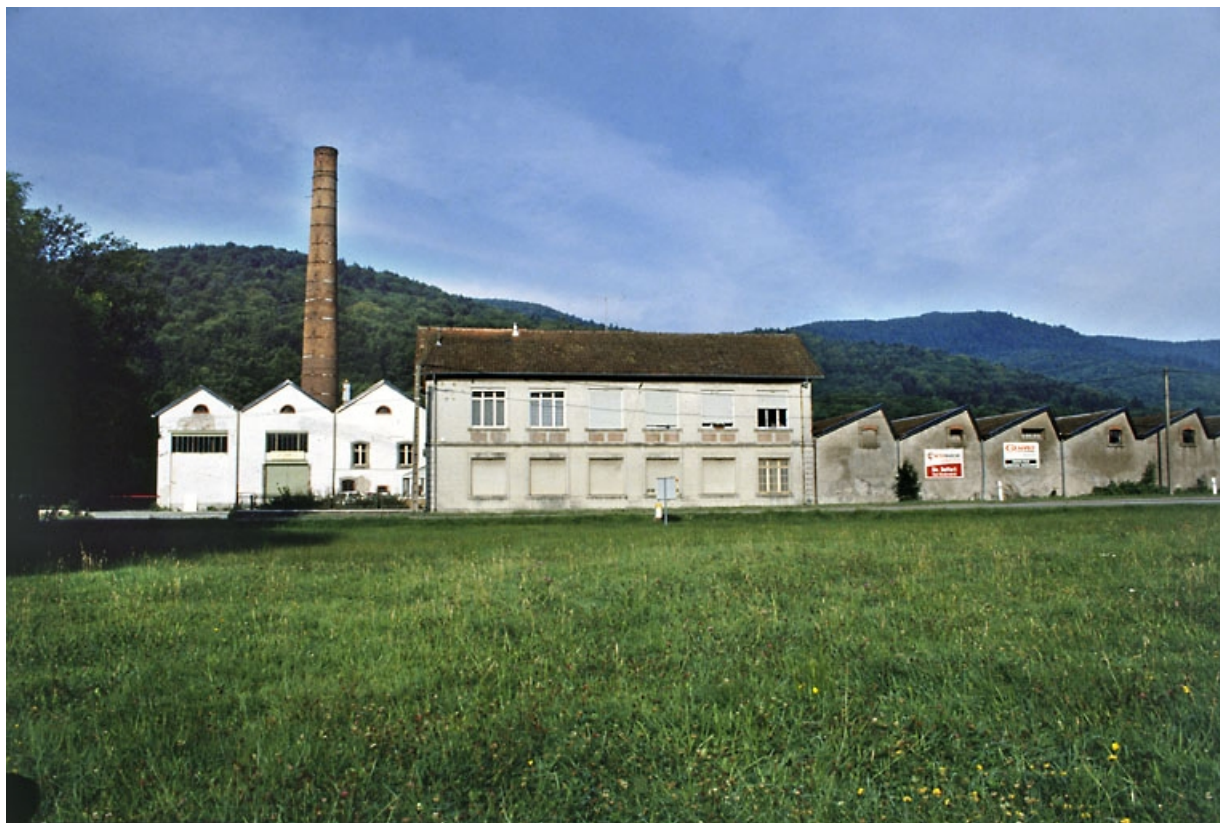
Pignons de la salle des machines, de l'atelier de tissage et façade des bureaux.