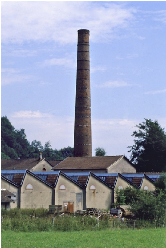
L'arrière du tissage.