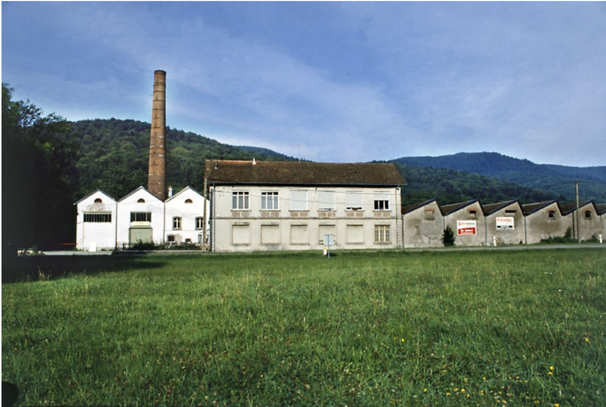
Pignons de la salle des machines, de l'atelier de tissage et façade des bureaux.