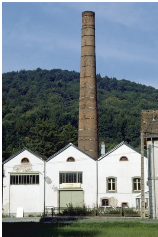
Salle des machines, chaufferie et cheminée.